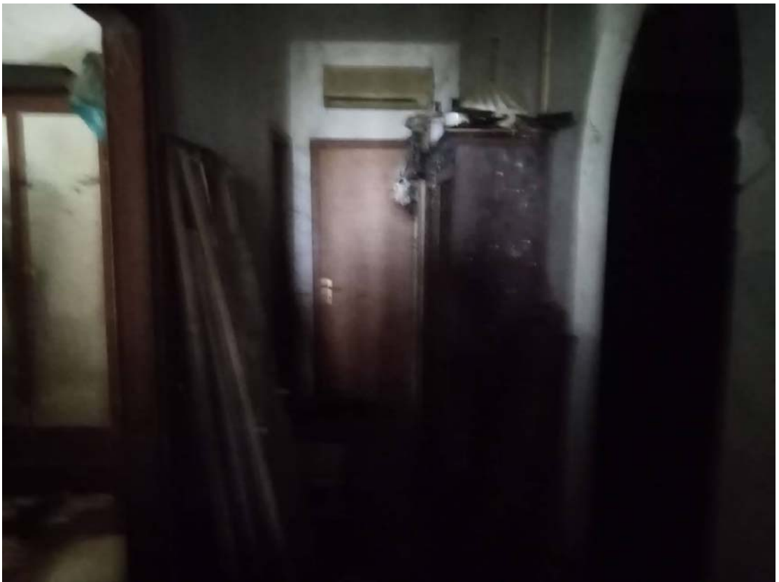
Ingresso e disimpegno