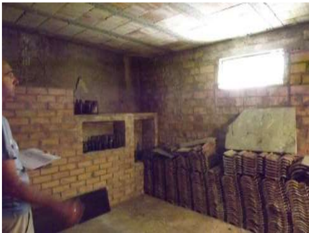
Interno cantina bene esclusivo sub 15