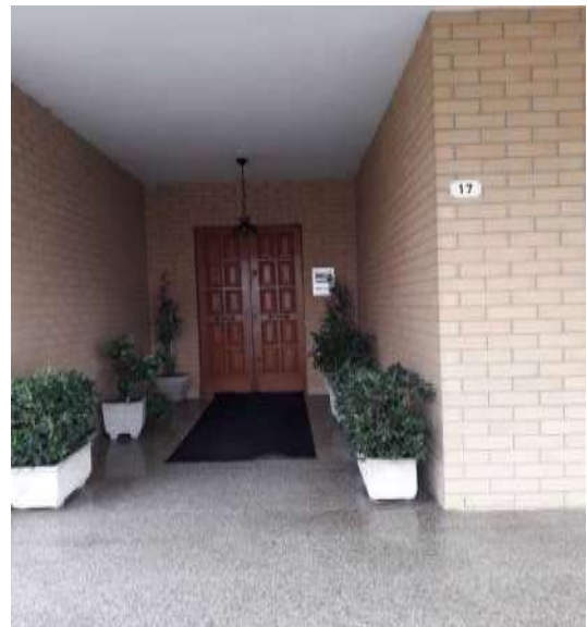
Ingresso corte prospiciente via Italia