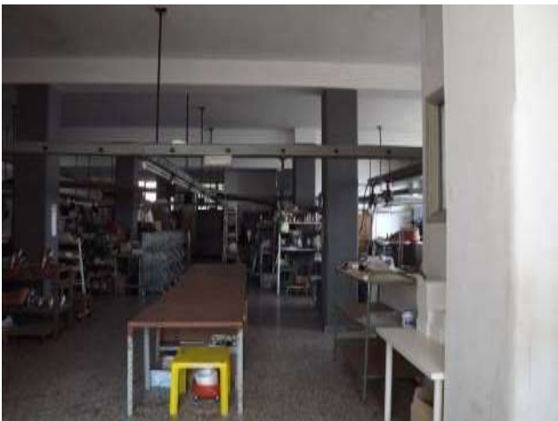
Interno locale laboratorio sub 16