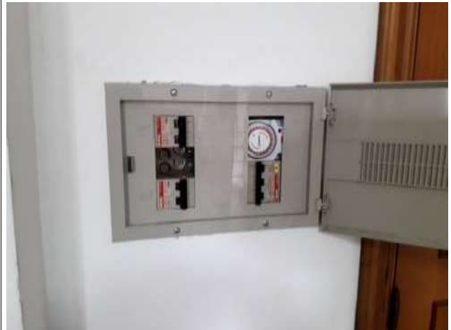
Interno negozio Quadro luci