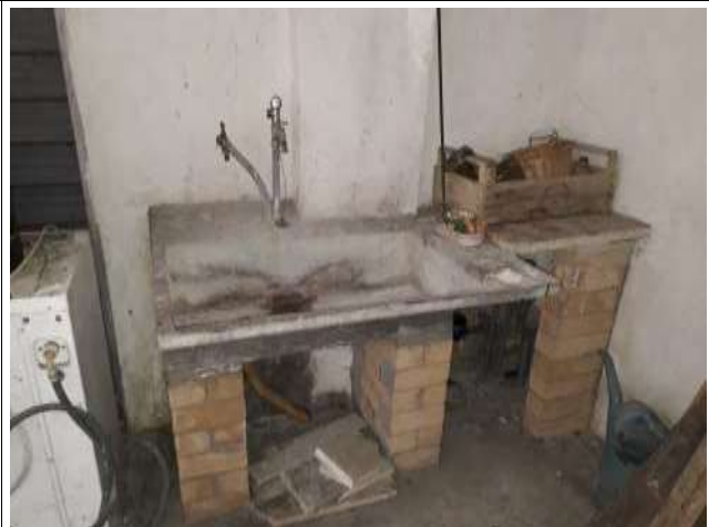
Interno garage blocco contatore e vaschetta interna al nuovo sub 19