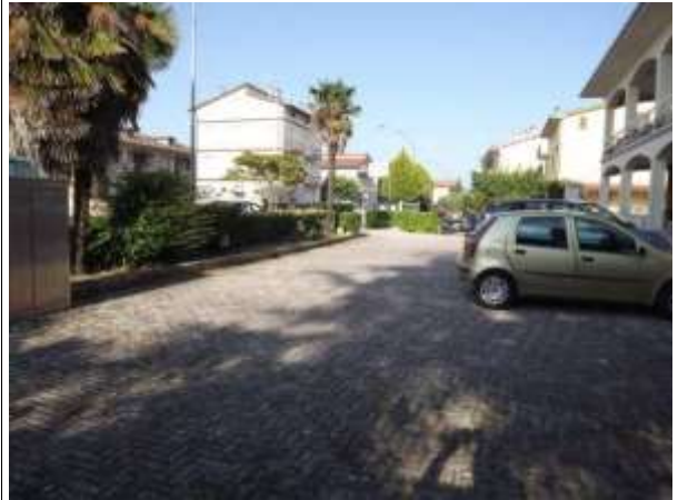
Part.re corte esterna prospiciente via Italia