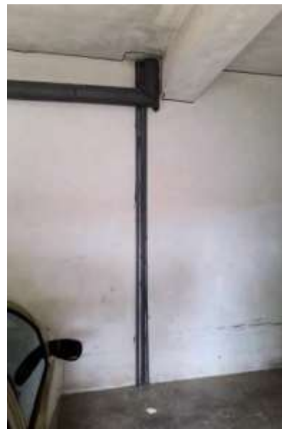
Interno garage colonna adduzione idrica ai piani superiori