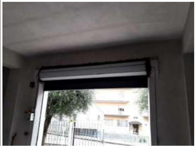
Part. Serranda motorizzata