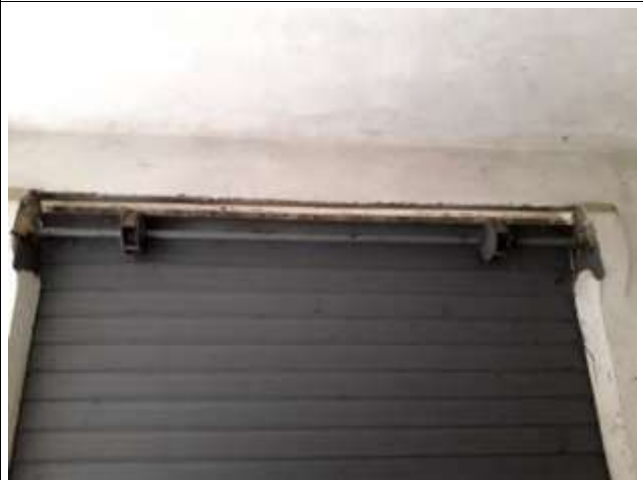
Part. Serranda non motorizzata