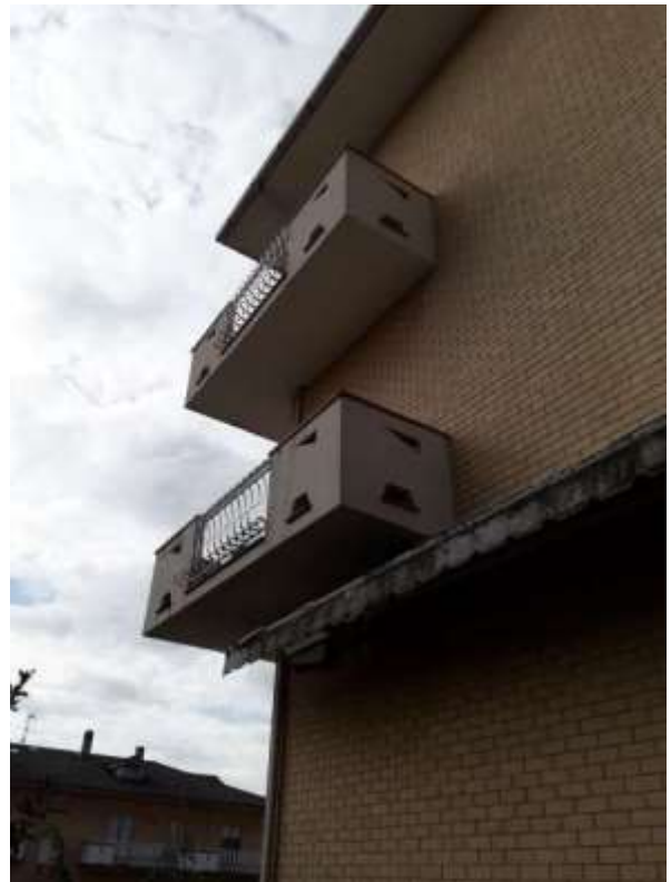
Part.re esterno balconi lato fronte est