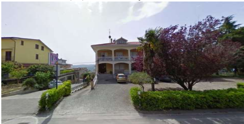
Vista prospettica fronte nord Ingresso su via Italia