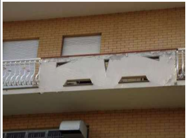
Part. Esfoliazione Parapetti balcone piano terra rialzato