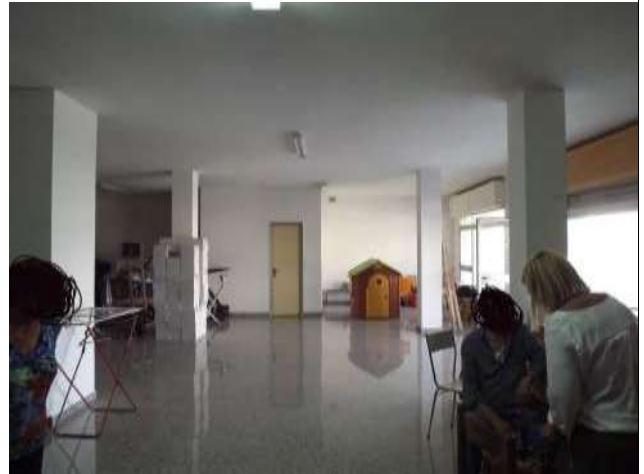
Interno negozio sub 12 piano terra rialzato