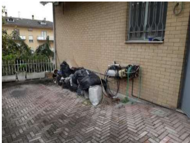
Coret esclusiva Esterno est