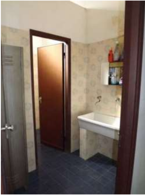
Servizi igienici laboratorio sub 16