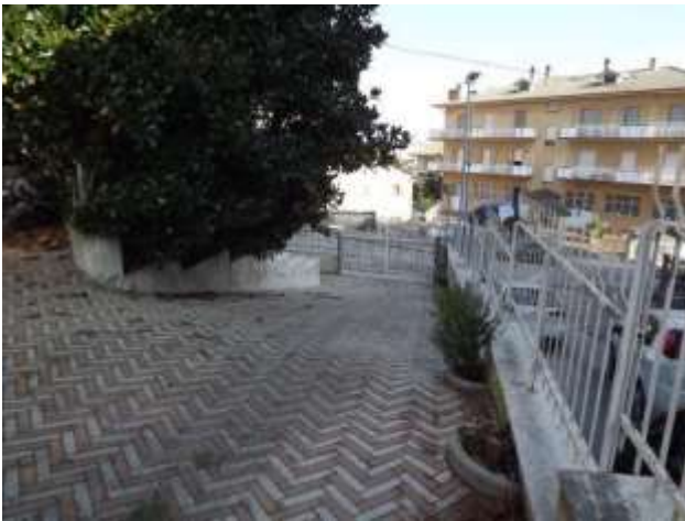
Part.re rampa a scendere vs. via Portogallo (ovest)