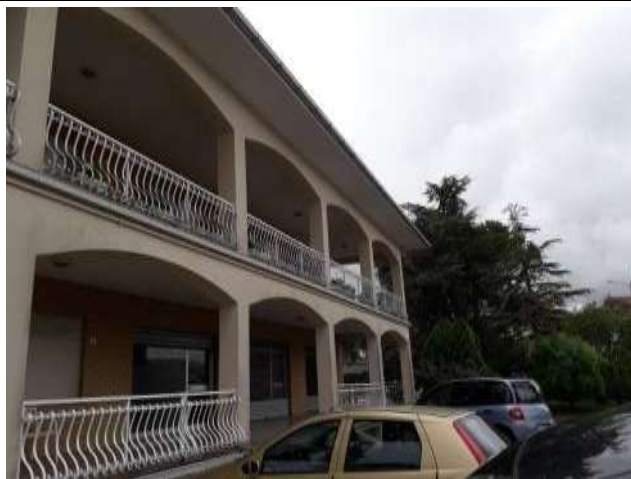
Esterno fronte nord part. Loggiati