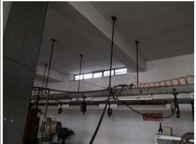
Interno laboratorio sub 16 Luci prosicienti corte su via italia