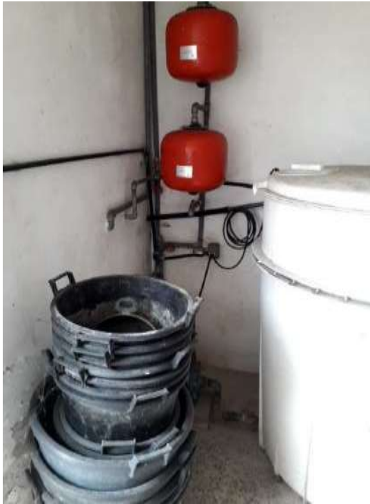
Loc caldaia - autoclave