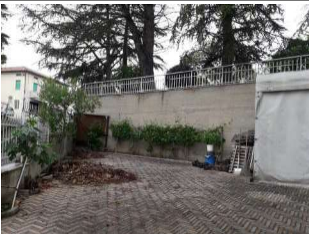
Corte liv. S1 ovest