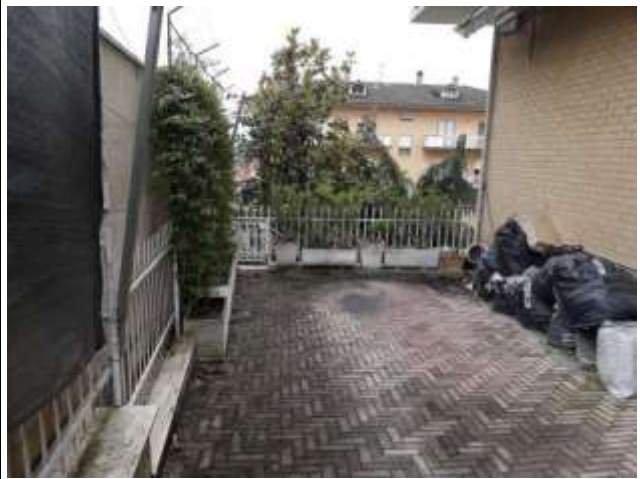
Esterno corte est livello S1 esclusiva sub 16