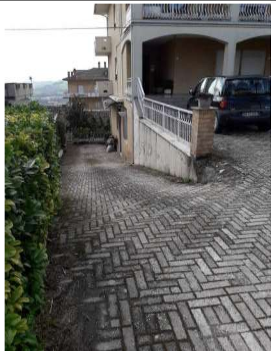
Part.re rampa a scendere da corte prospiciente via Italia a liv S1