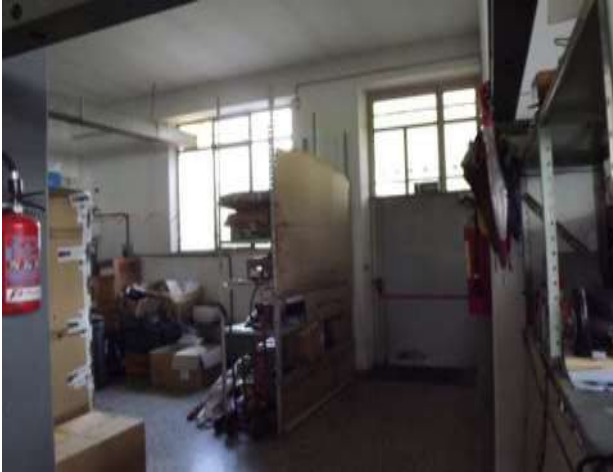
Interno laboratorio sub 16 lato est- porta accesso su corte esclusiva