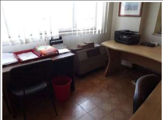
Interno uffici laboratorio sub 16