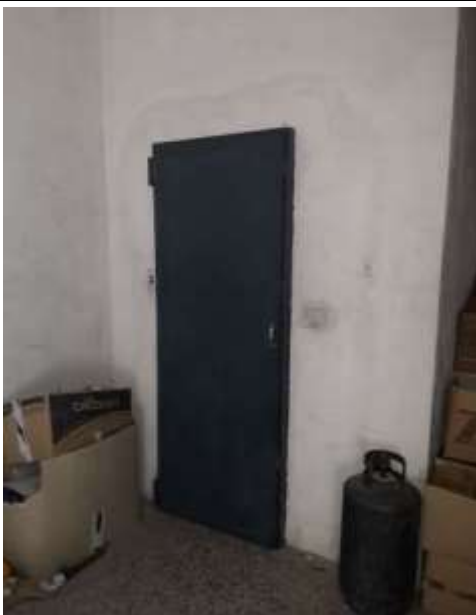
Interno garage -porta in ferro ascensore