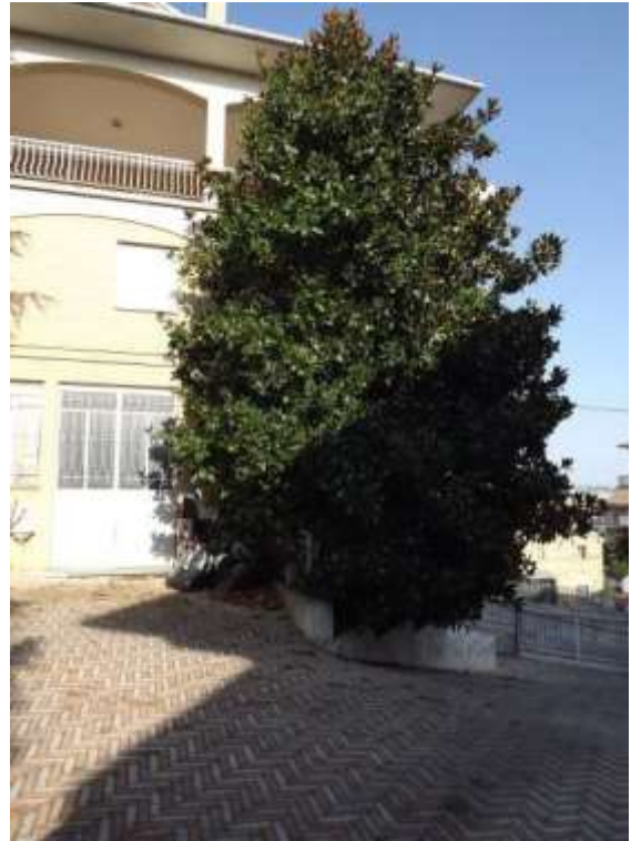
Part.re prospetto ovest raccordo rampa a scendere