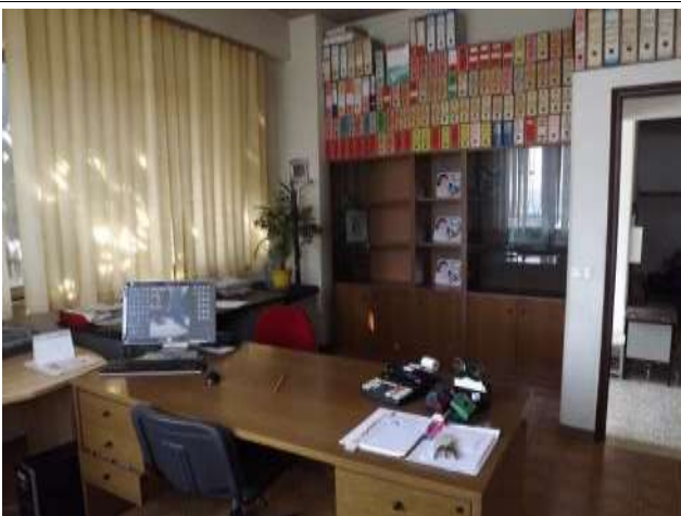
Interno uffici laboratorio sub 16