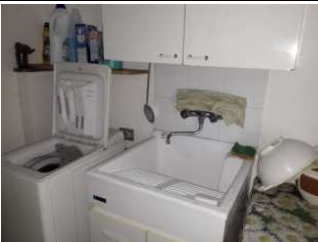
Part. Interno negozio