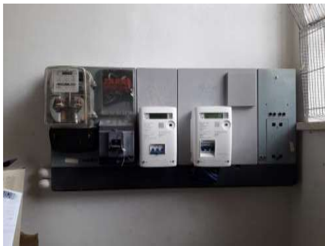
Quadro contatori -scala interna sub 10 livello S1