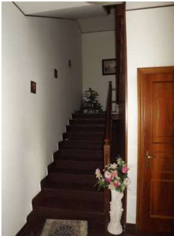
Androne ingresso piano terra- scala sub 11 ai piani abitativi scala in granito rosso- ringhiera in legno massello