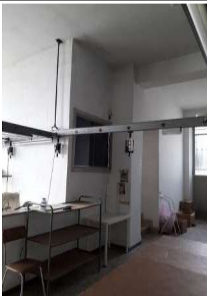
Interno laboratorio sub 16 - angolo uffici