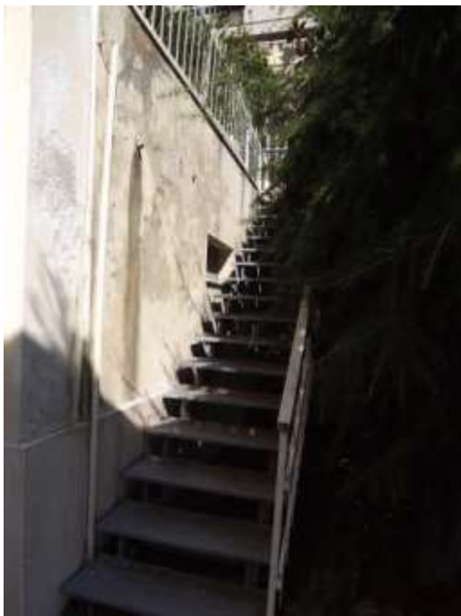
Passaggio a salire da liv.S2 a liv S1 Scaletta in ferro uso esclusivo sub 16