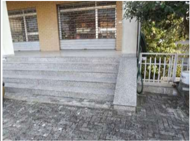
Part.re corte esterna accesso al p.terra rialzato lab. Sub 13