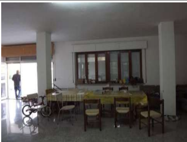
Interno negozio sub 12