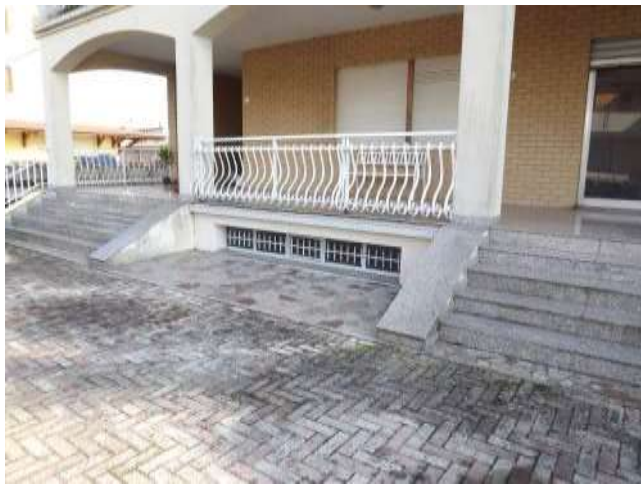
Part.re corte esterna accesso al p.terra rialzato e luci sub 16