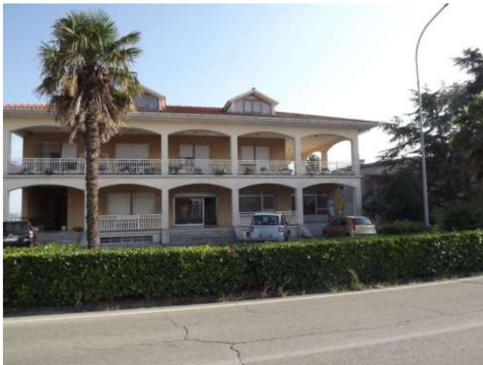
Vista prospettica fronte Nord prospiciente via Italia