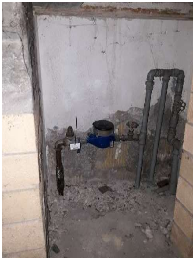
Part re contatore idrico interno garage