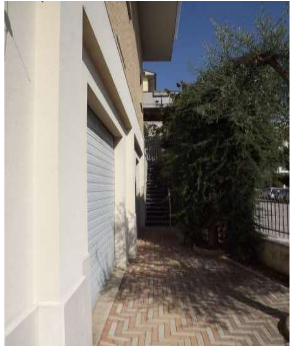
Part.re vista corte prospiciente via Portogallo