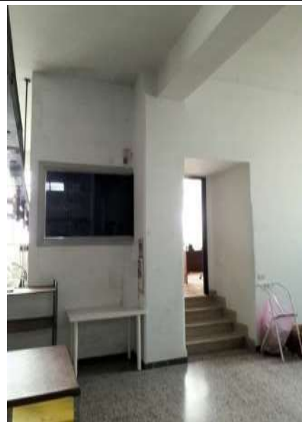
Interno laboratorio sub 16 - ingresso uffici