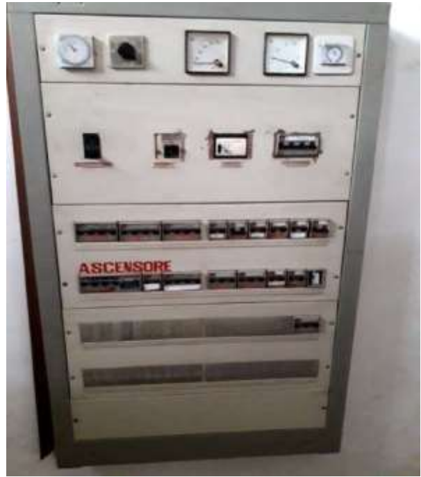
Part. Quadro elettrico loc laboratorio sub 16