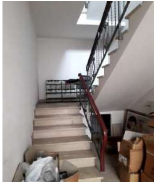
Scala interna bene comune sub 10