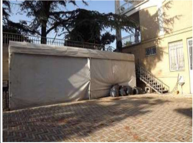
Accessorio non facente parte della vendita su corte S1