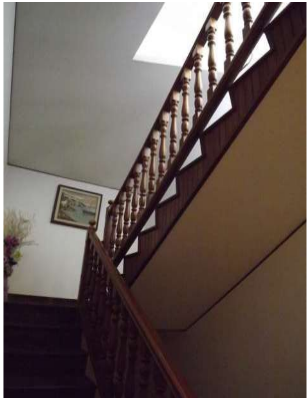
Part.re scala sub 11 al piano sottotetto