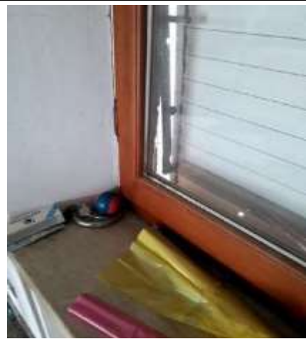
Interno negozio - Part. Infisso in legno