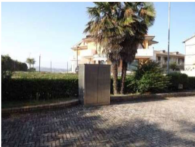
Part. Esetrno prospiciente via Italia- box su part. 85