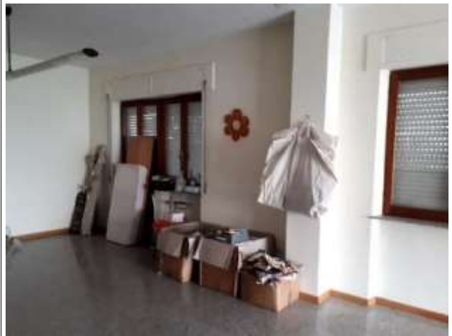
Interno lab sub 13