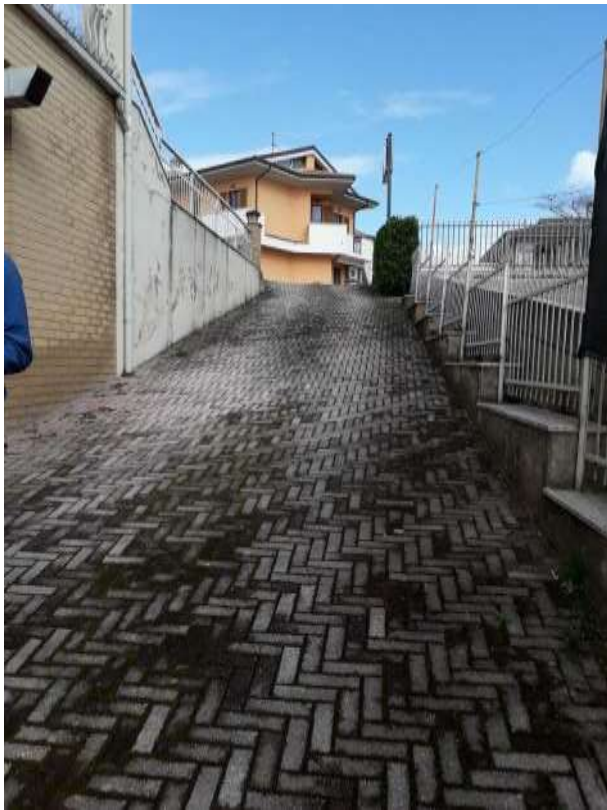
Rampa a salire da liv S1 est a corte prospiciente via Italia