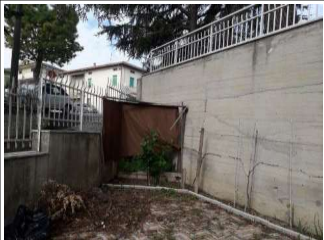
Angolo nord-ovest corte liv S1