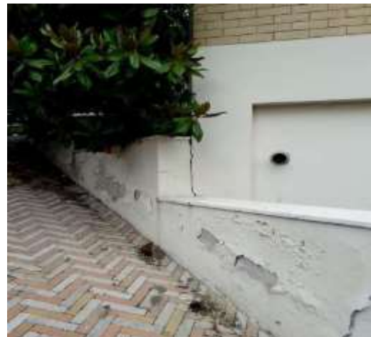
Part. Muretto rampa raccordo S2-S1 esfoliazione tinta e giunto