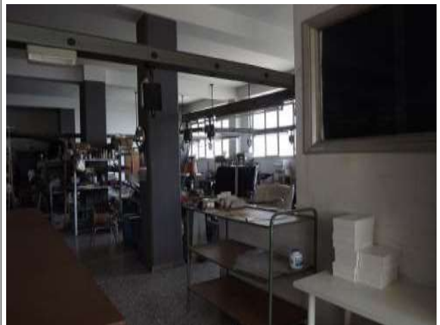
Interno laboratorio sub 16