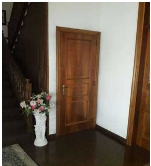
Androne ingresso piano terra-porta accesso alla scala sub 10