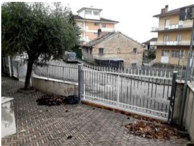
Part. Cancelli carrabili via Portogallo