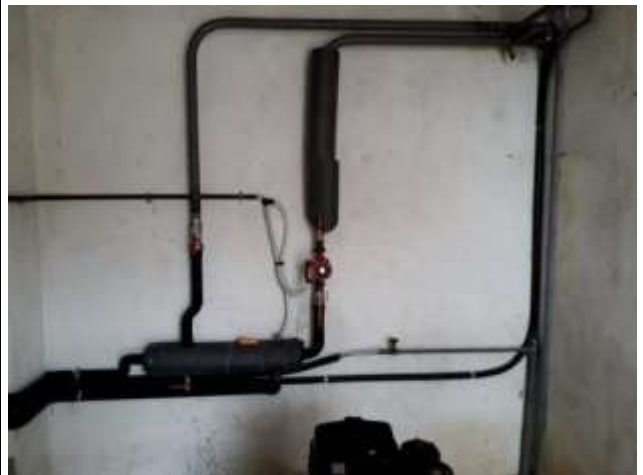
Particolare interno locale caldaia