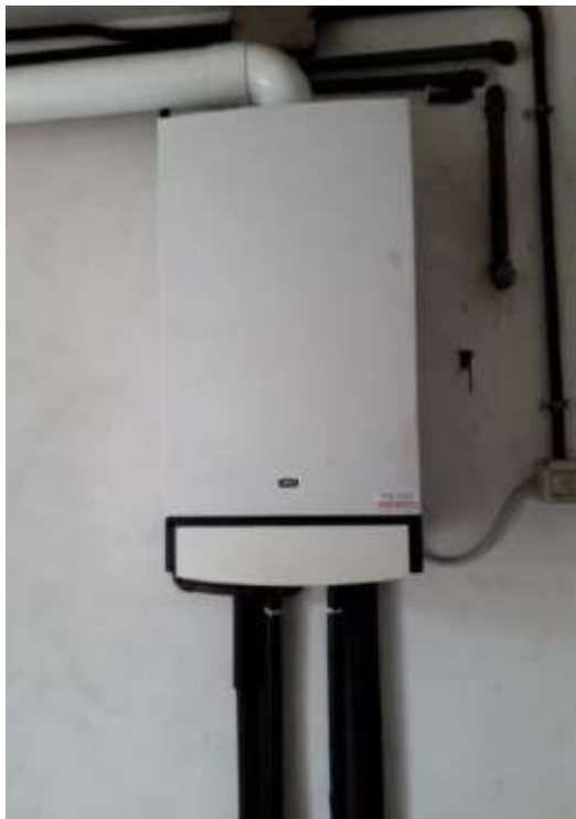
Locale caldaia – caldaia murale