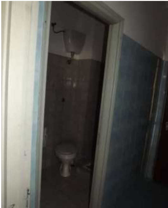
Part. Wc loc laboratorio sub 13