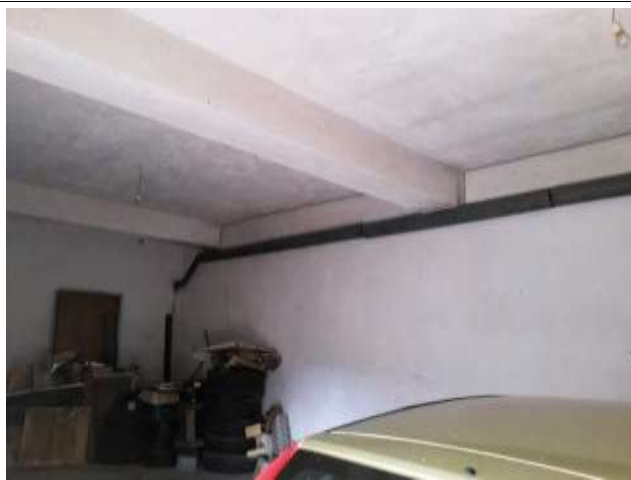
Interno garage collettore alimentazione impianto termico uffici laboratorio sub 16 e negozio sub 12