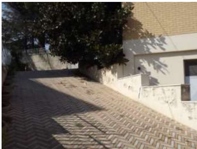
Part.re rampa a salire livello S2 vs Livello S1