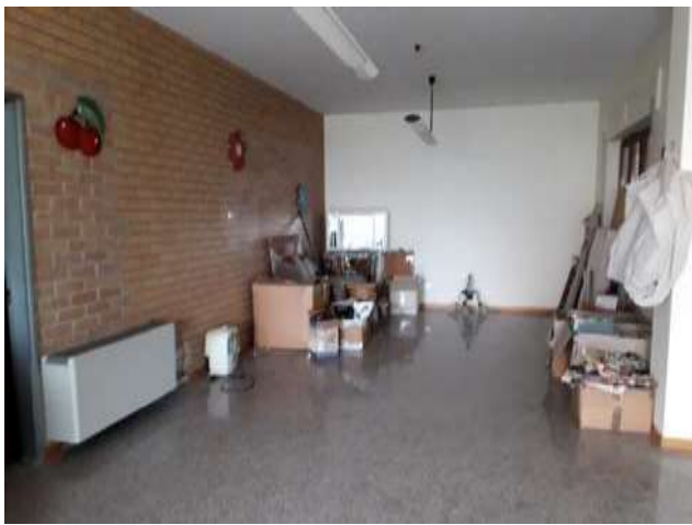
Locale laboratorio sub 13