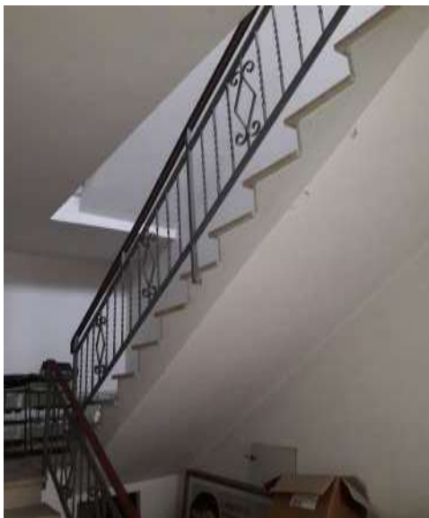
Scala interna bene comune sub 10