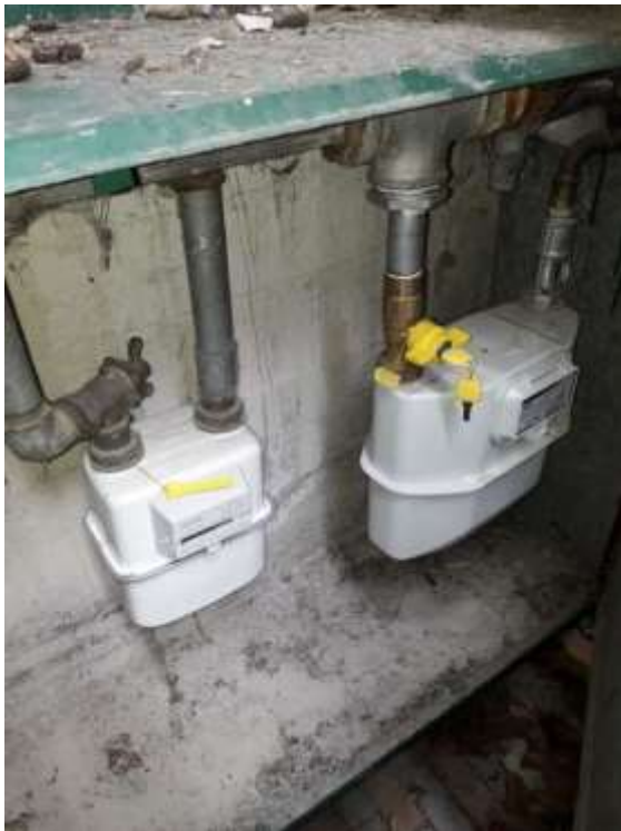
Part. Contatori gas sottoscala esterna ovest – corte livello S1