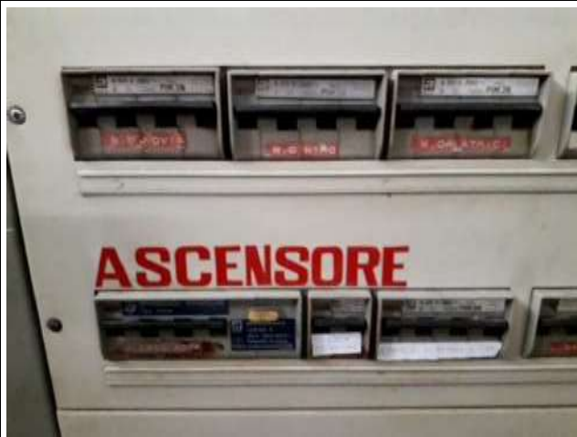
Part. Quadro elettrico loc laboratorio sub 16