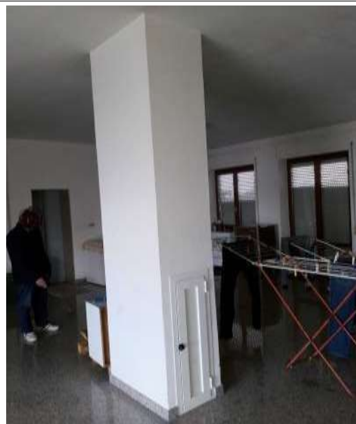
Interno negozio Colonna con collettore impianto termico