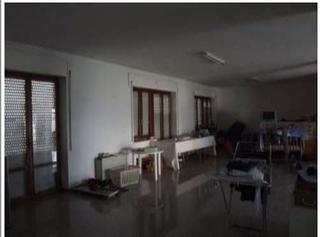
Interno negozio sub 12