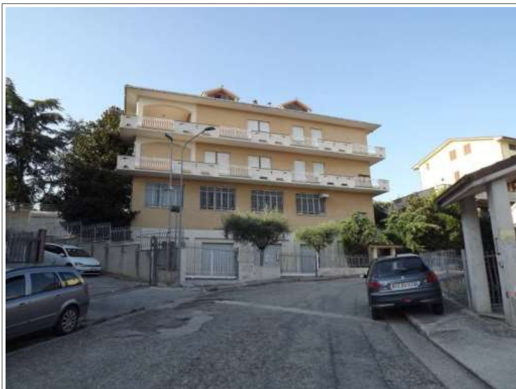
Vista prospettica fronte sud