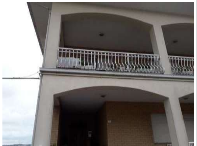
Esterno fronte nord part. ingresso