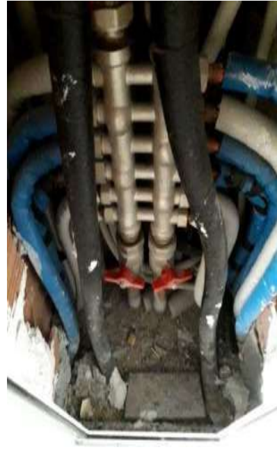
Interno negozio -Part.re collettore interno