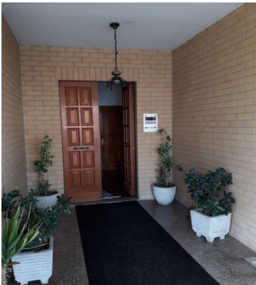
Ingresso corte prospiciente via Italia