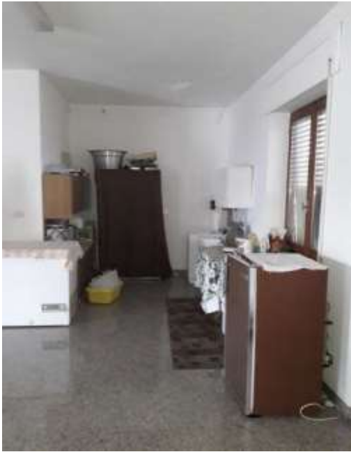
Interno negozio angolo sud -laterale Sx vano ascensore