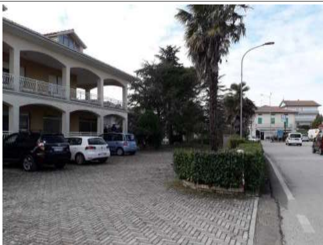
Part.re accesso corte prospiciente via Italia