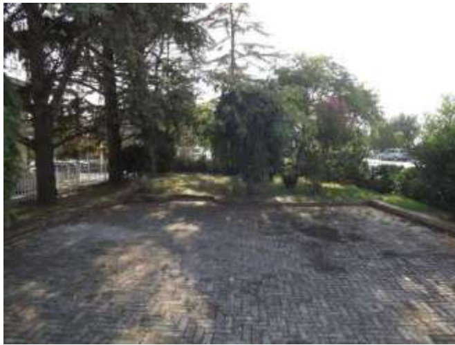
Part.re corte esterna prospiciente via Italia