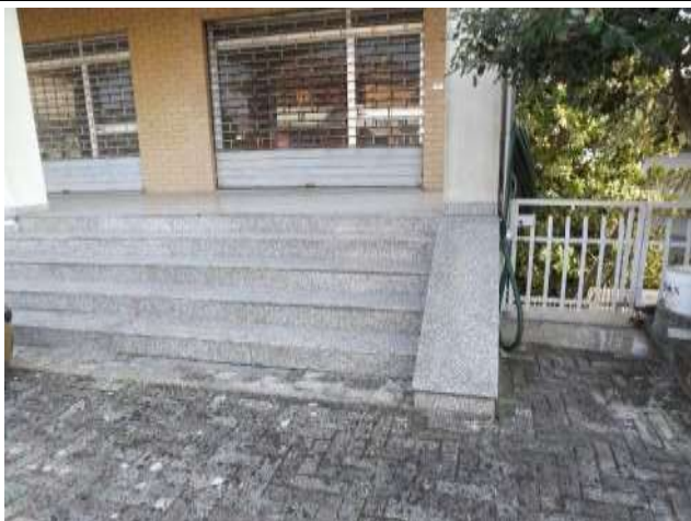
Ingresso su corte laboratorio sub 12