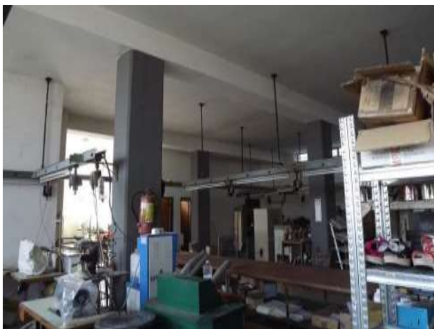
Interno laboratorio sub 16