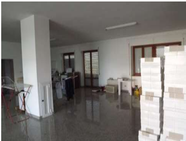
Interno negozio sub 12