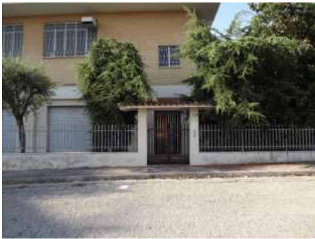
Part.re ingresso pedonale via Portogallo