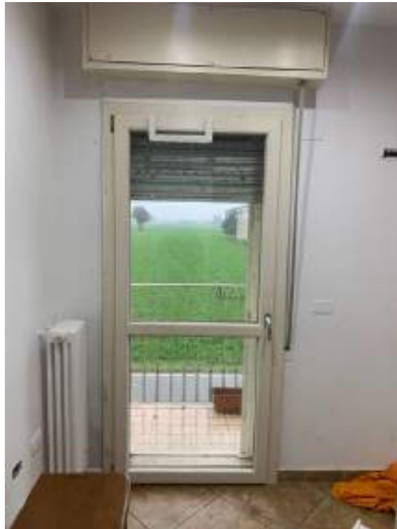
vista 2 camera singola