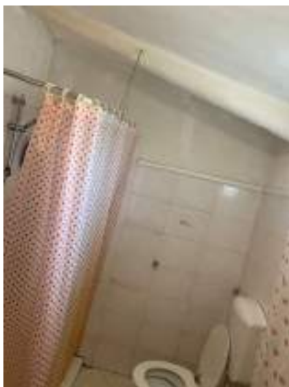
vista 2 bagno ex autorimessa