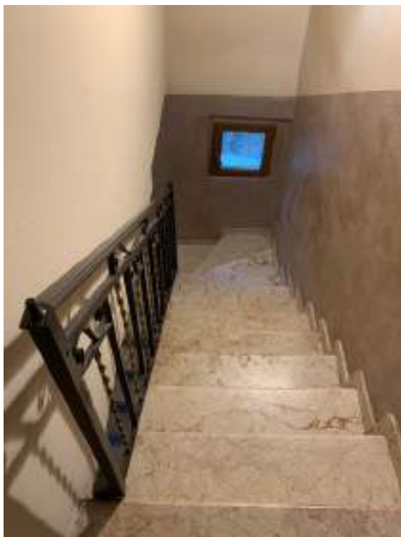
vista 1 corridoio/disimpegno P 1°