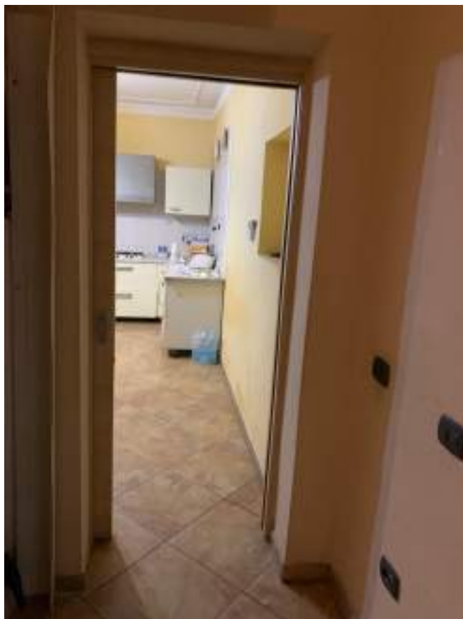
vista 2 disimpegno verso ingresso/soggiorno