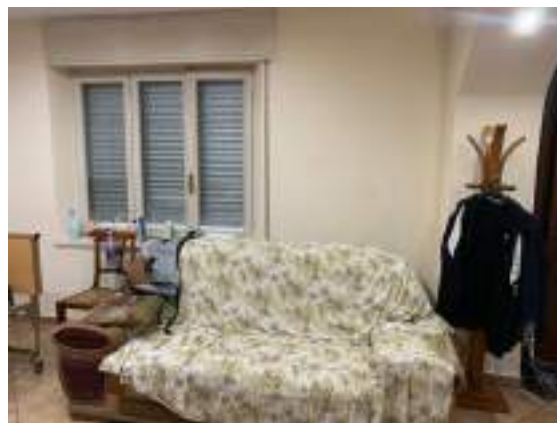
vista 2 soggiorno