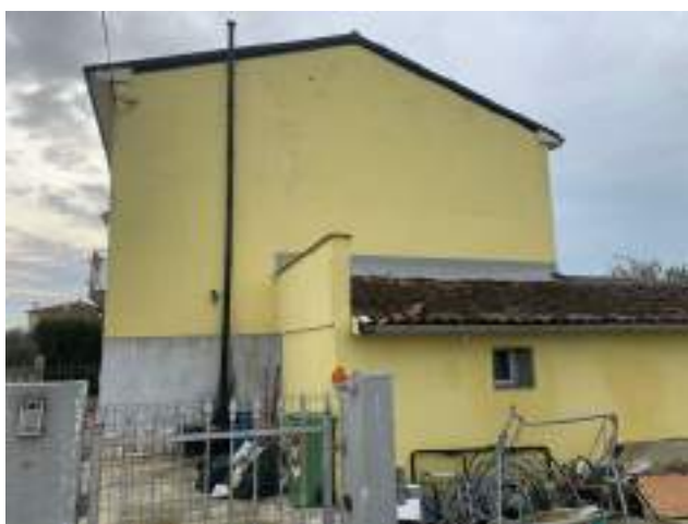
vista 4 lato nord da cortile laterale (ingresso carraio)