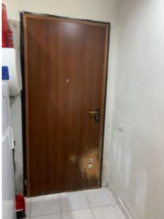
vista 1 locale impianti ex autorimessa