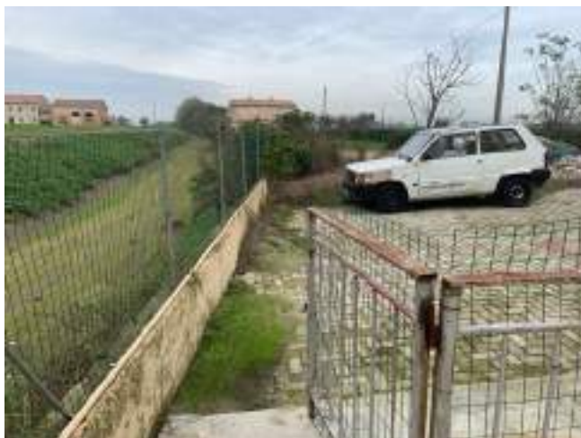
vista cortile retro lato ovest