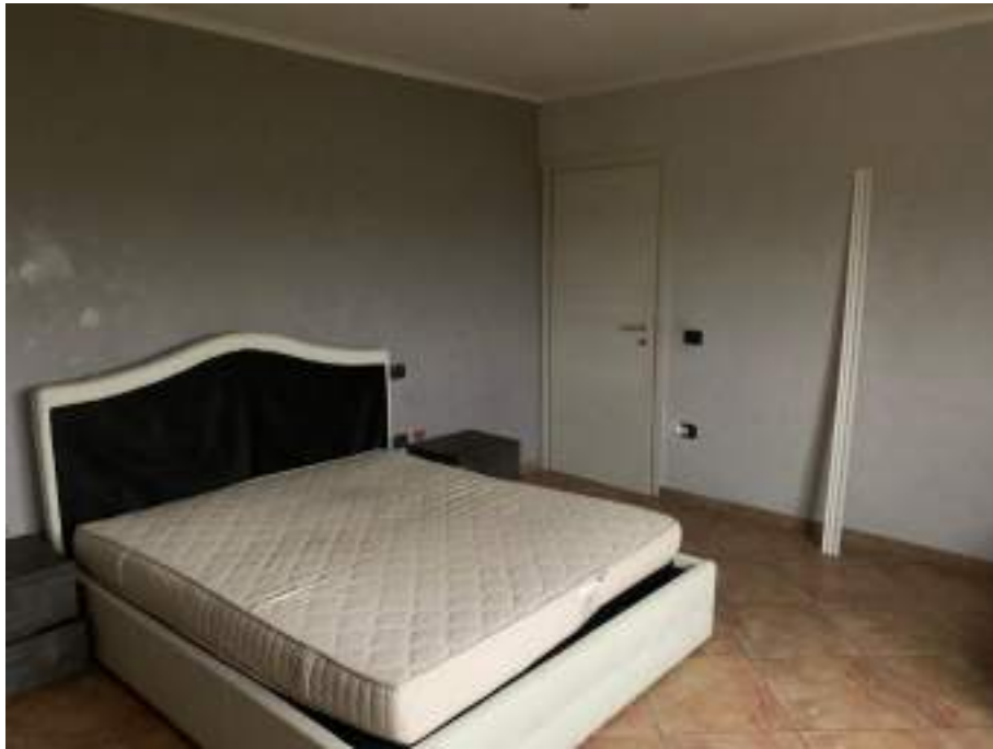
vista camera matrimoniale 1