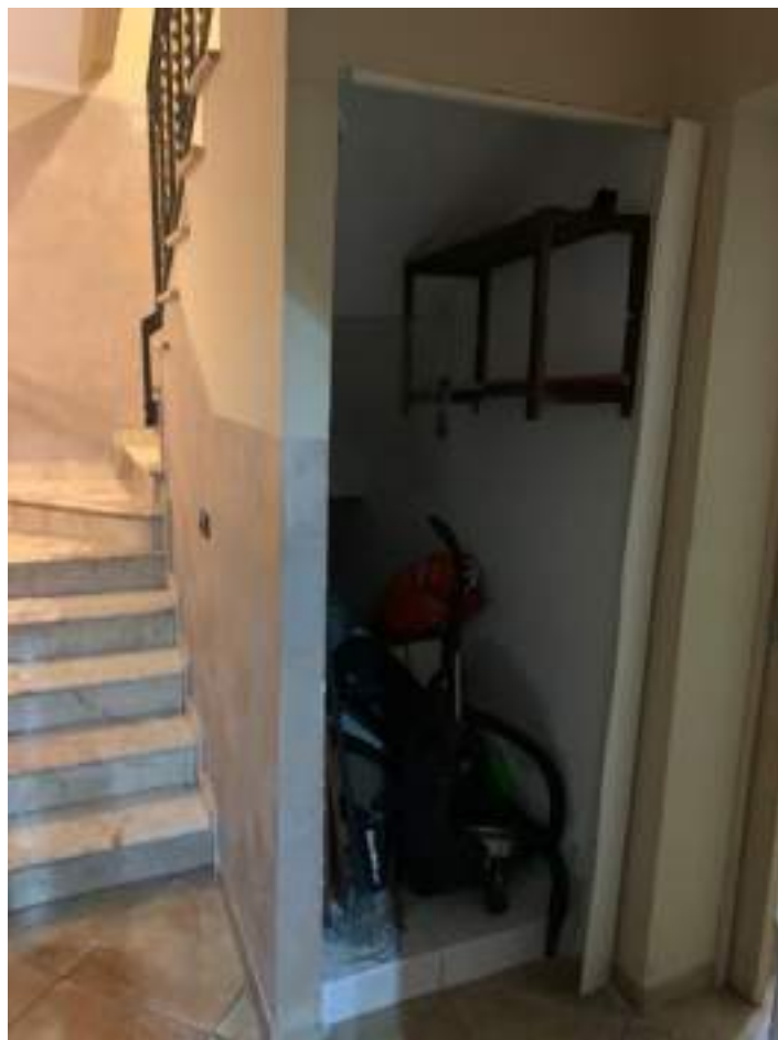
vista 1 vano scala