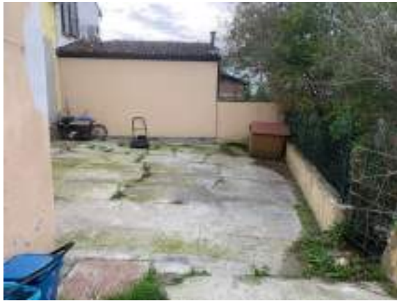
vista retro alloggio lato ovest