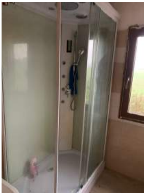
vista 2 bagno