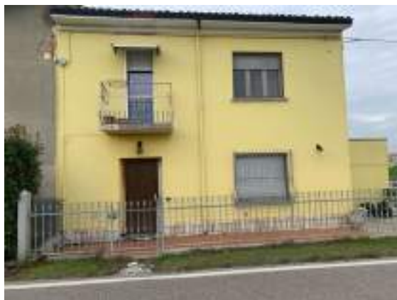
vista 2 facciata lato est su Strada Cadellora (SP 48)