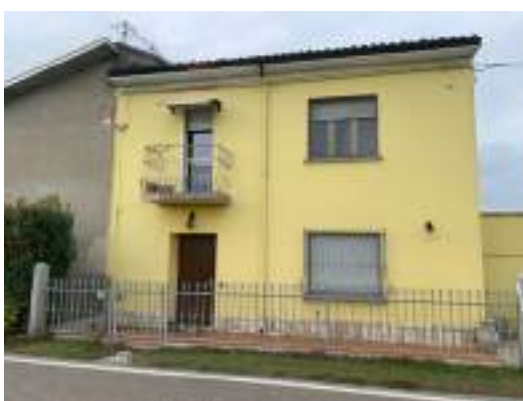
vista 1 lato nord da Strada Cadellora (SP 48)