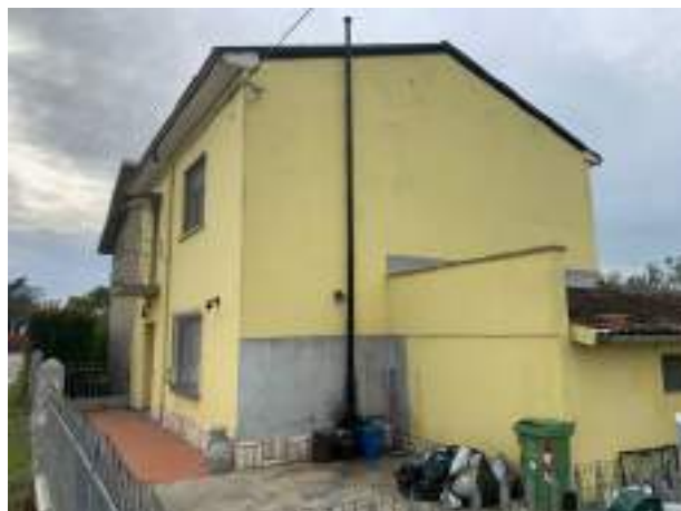
vista 3 lato nord