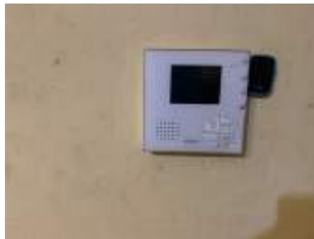
vista contatore utenza elettrica posto fianco porta ingresso