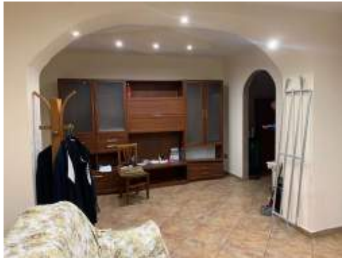
vista 1 soggiorno