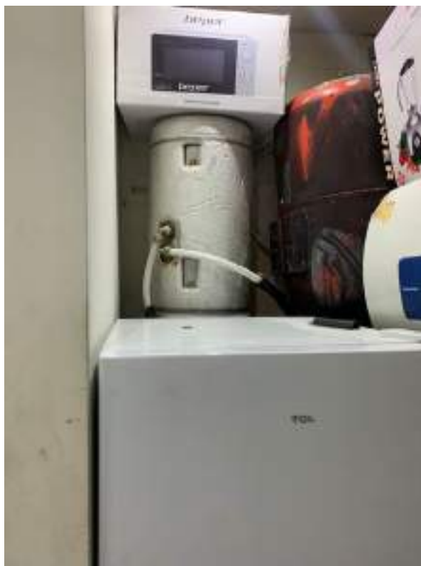
vista 1 angolo cottura ex autorimessa