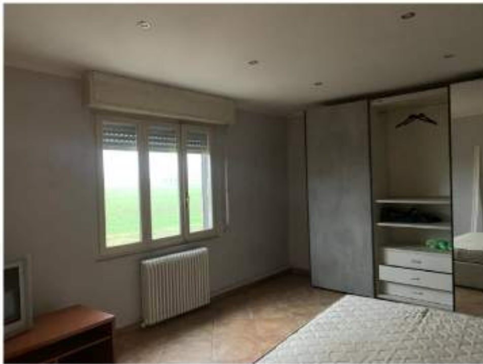
vista camera matrimoniale 2