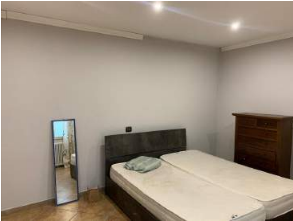
vista camera matrimoniale 2