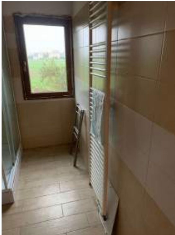
vista 4 bagno