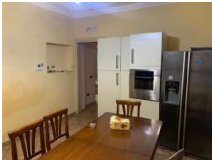
vista 3 cucina