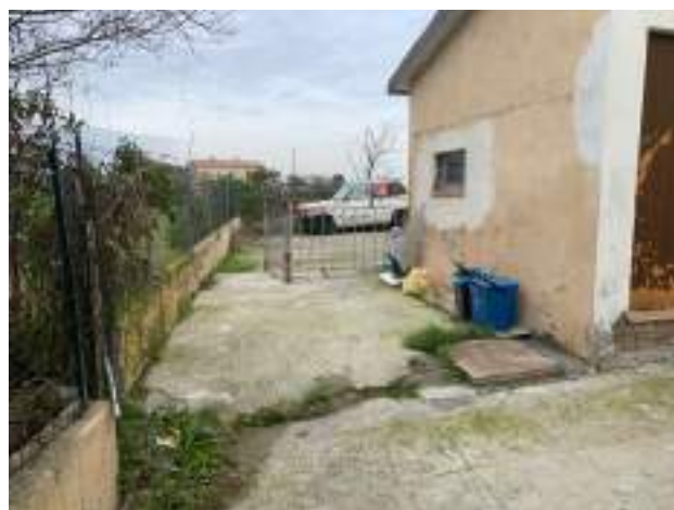
vista 1 cortile retro lato ovest