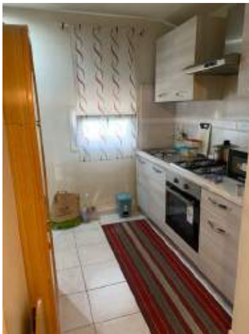
vista 1 camera ex autorimessa