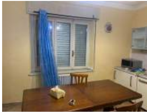
vista 2 cucina