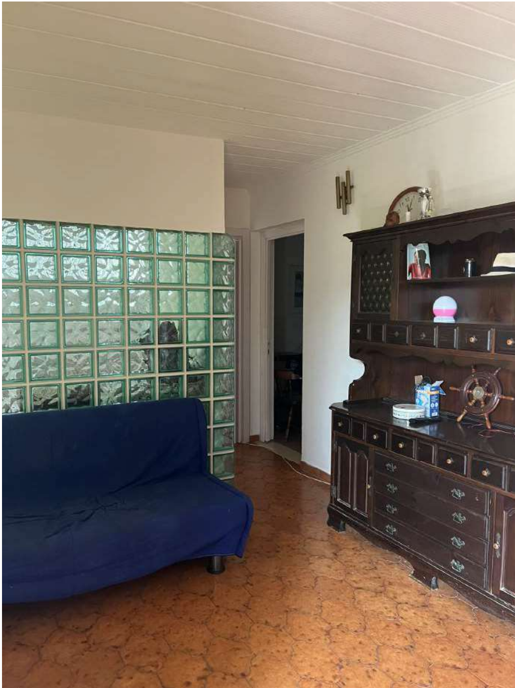
Figura 4: Interno - soggiorno e disimpegno