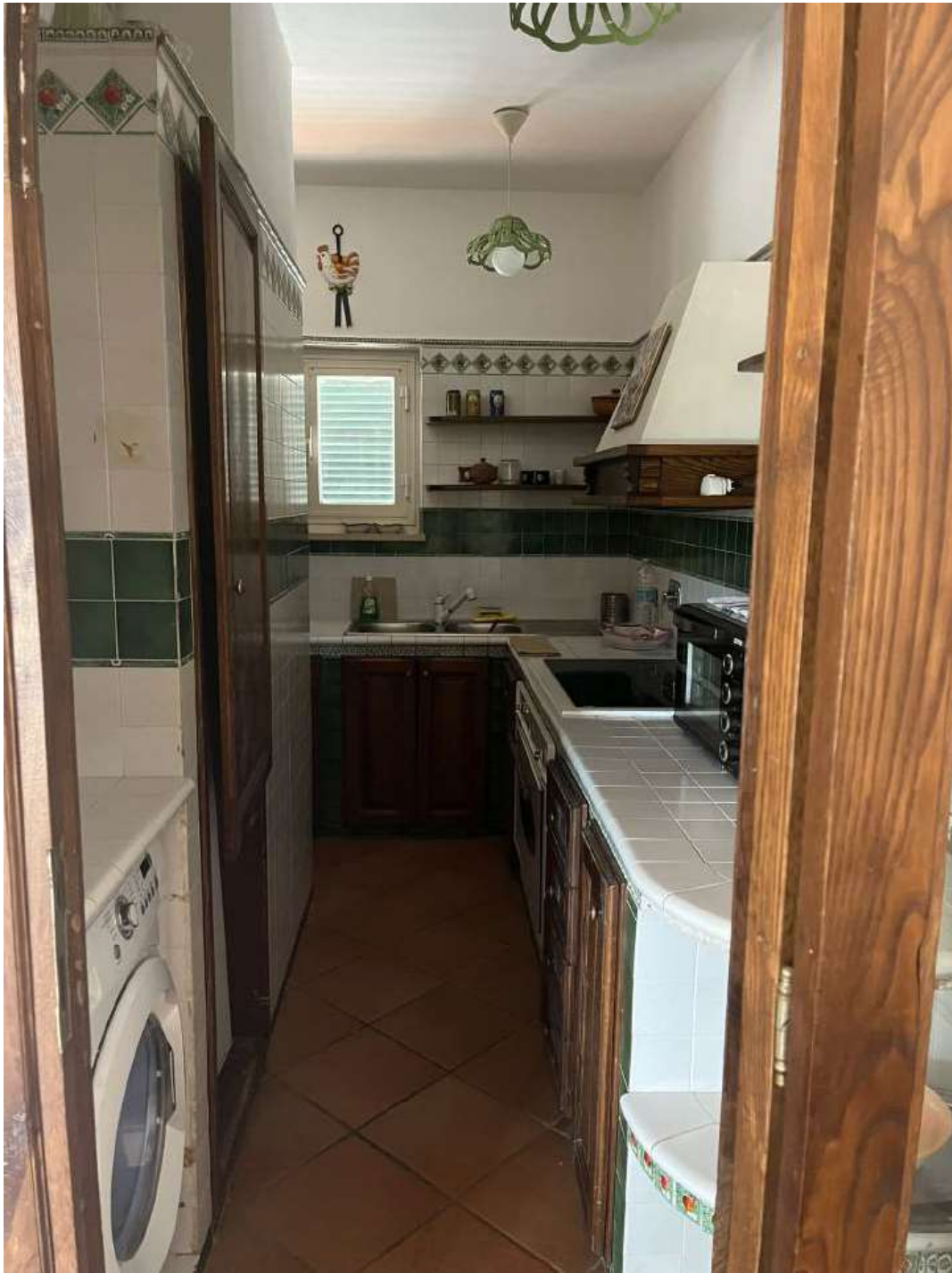
Figura 6: Cucina