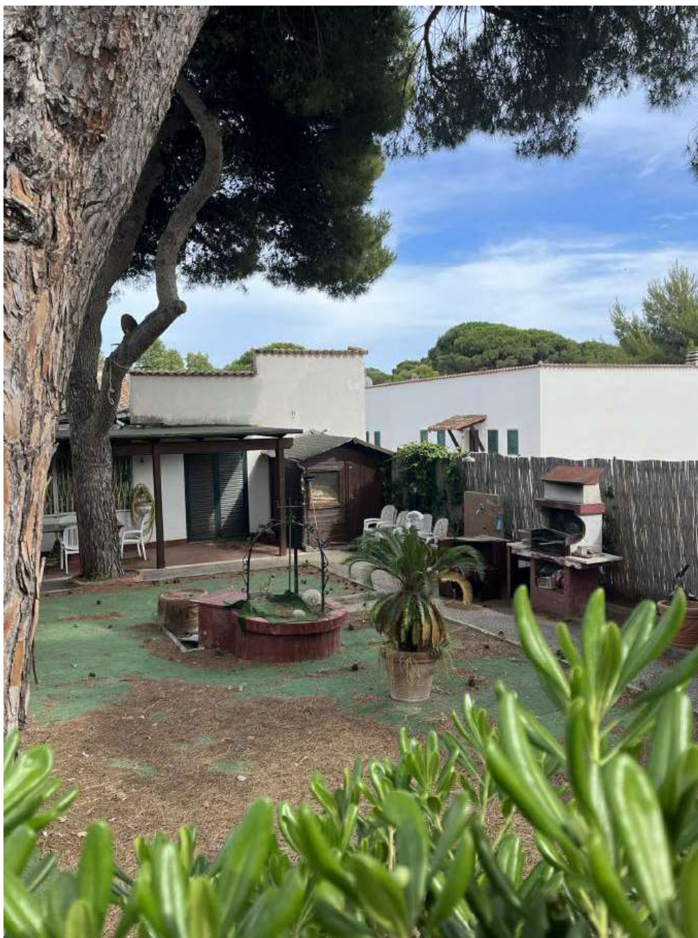
Figura 12: giardino - vista barbecue - doccia - vano tecnico e portico