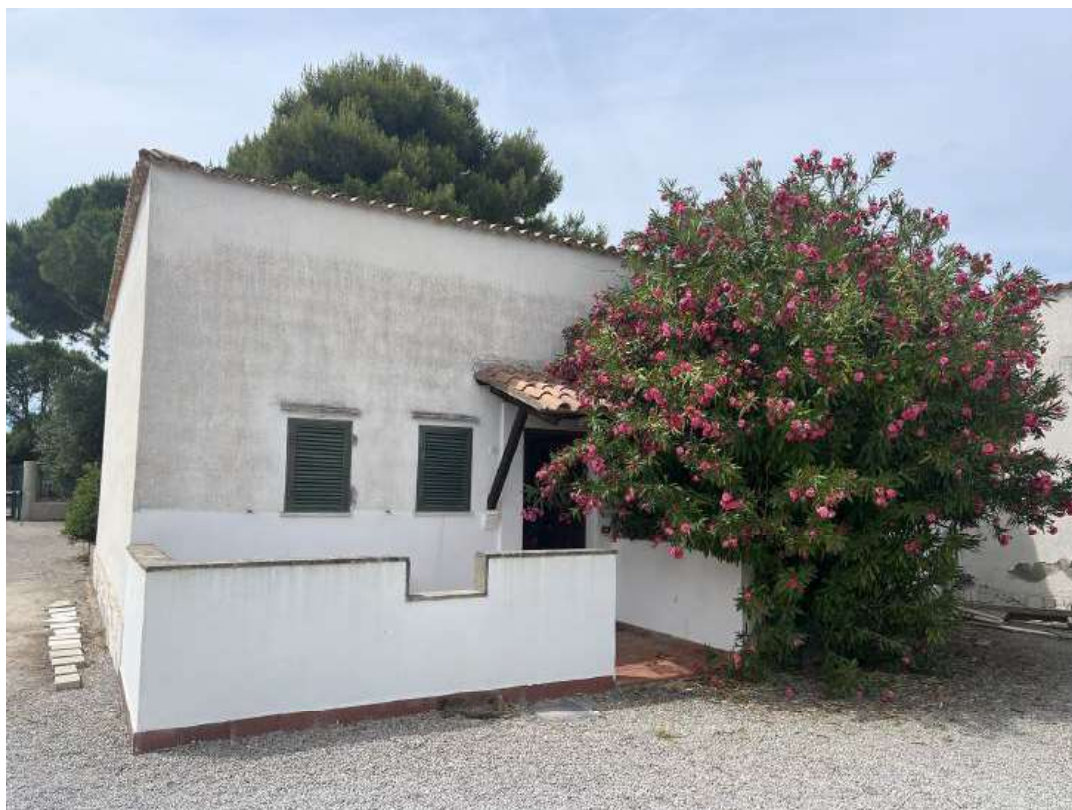
Figura 1: prospetto sud est, lato corte part. 216.