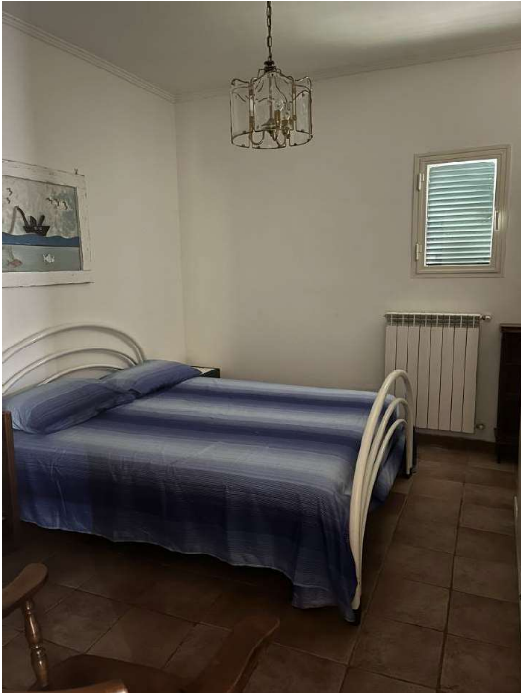
Figura 9: Camera 2