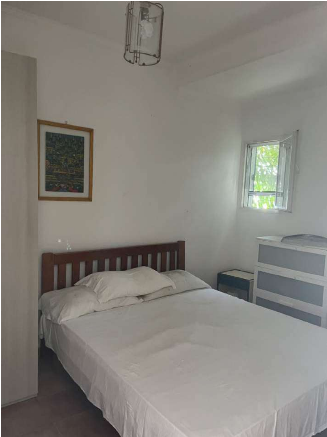
Figura 7: Camera 1