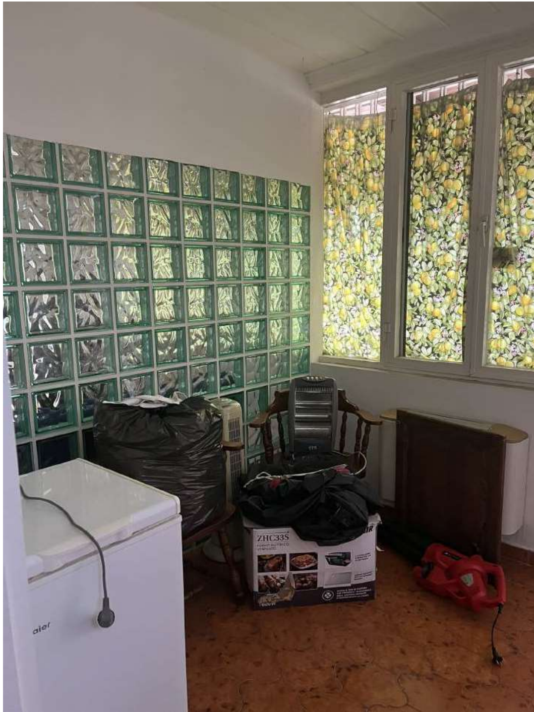
Figura 10: Zona pranzo