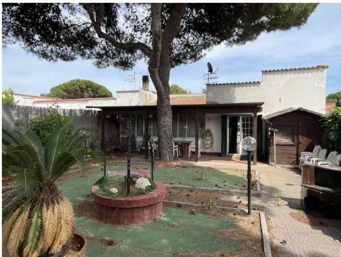
Figura 2: Prospetto nord ovest sul giardino