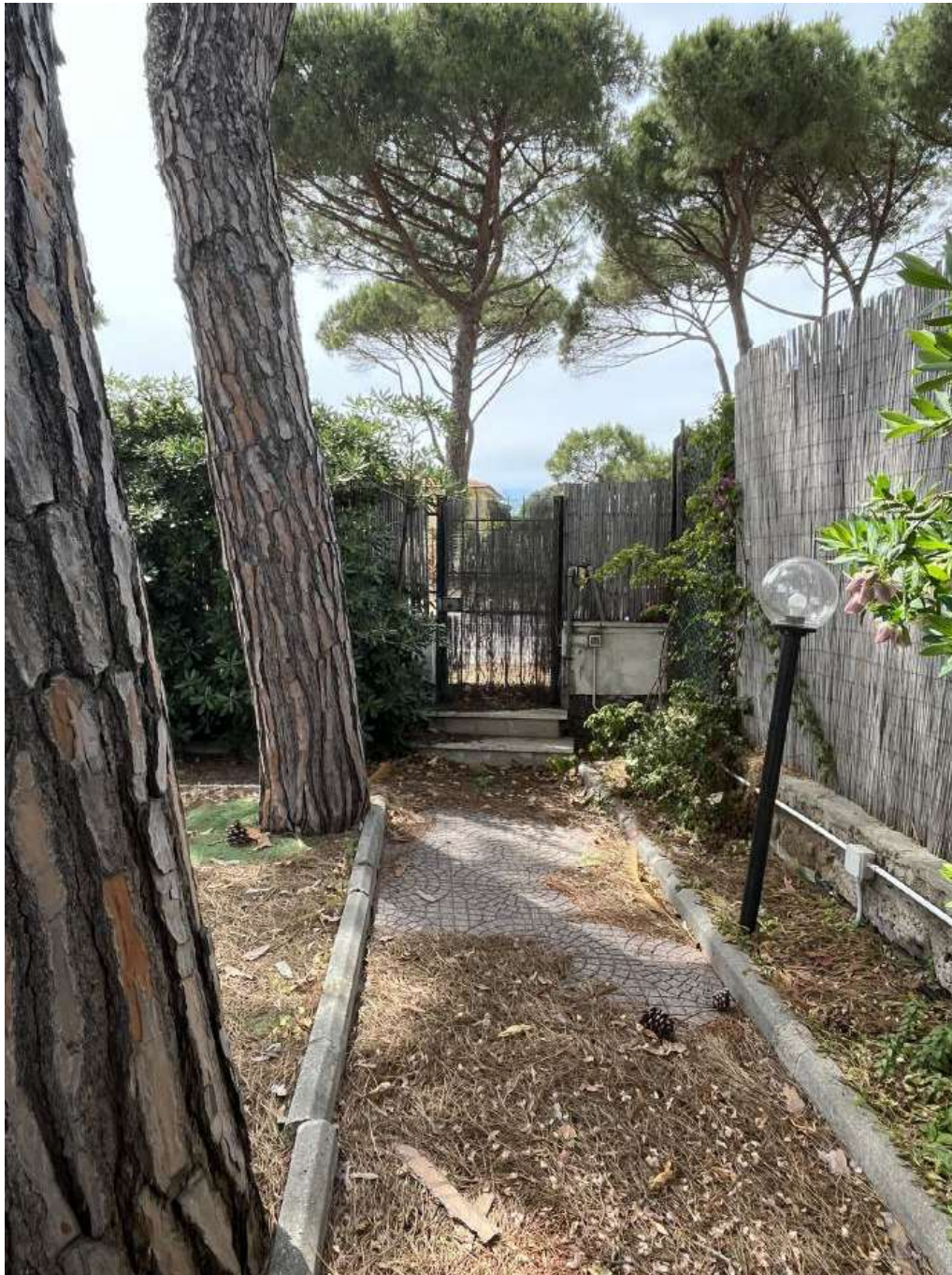
Figura 11: Giardino - vialetto di ingresso