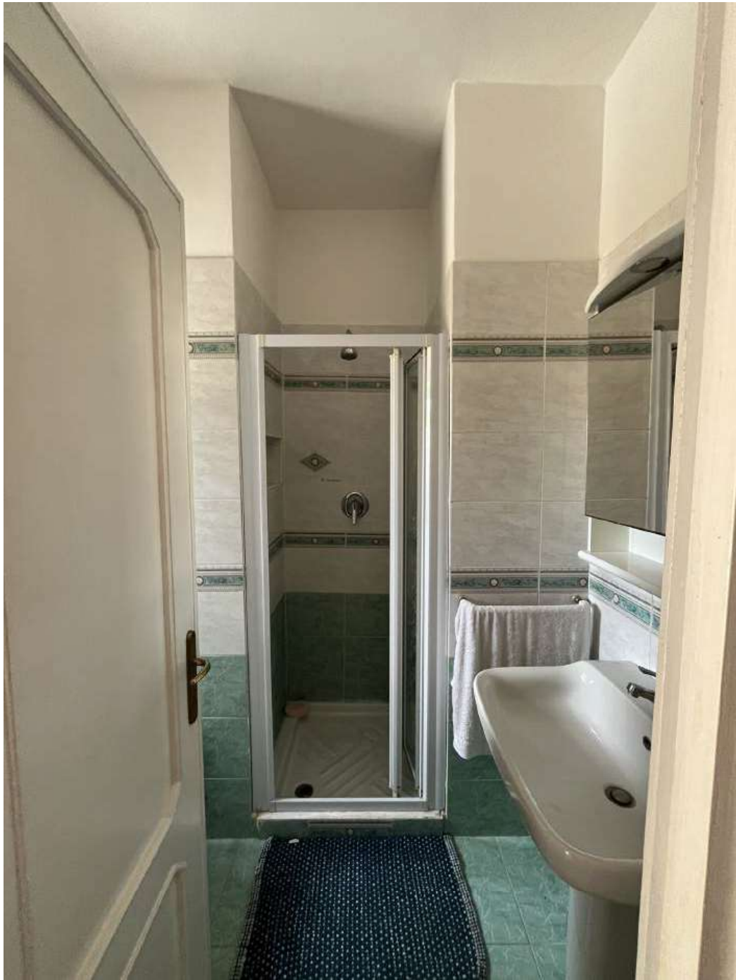
Figura 5: Bagno