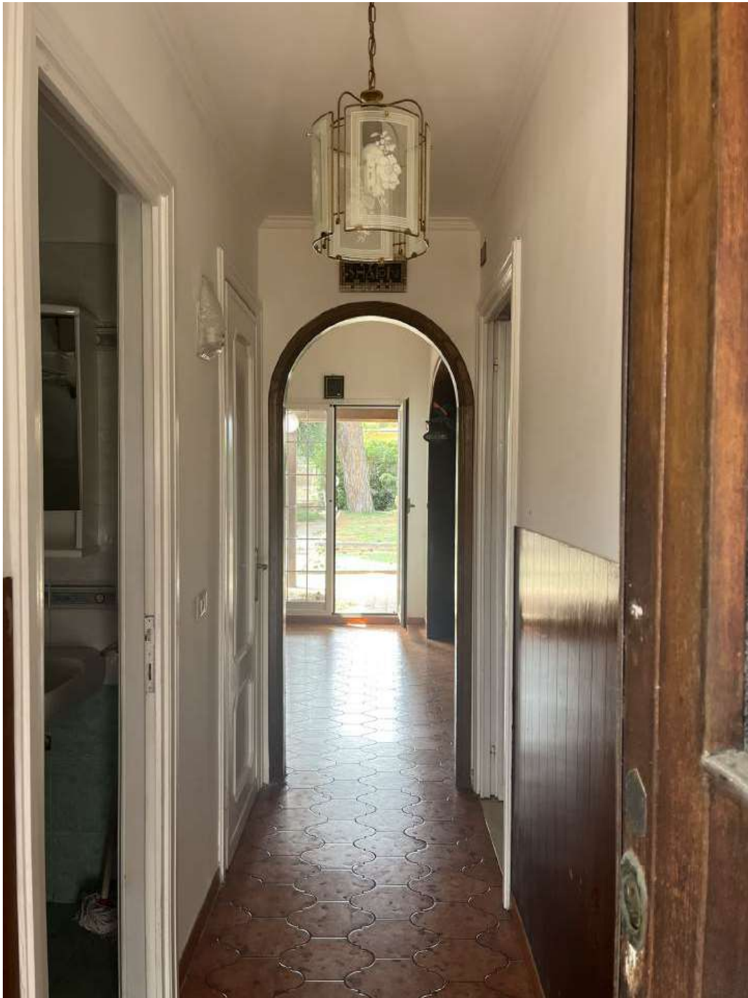
Figura 8: Corridoio