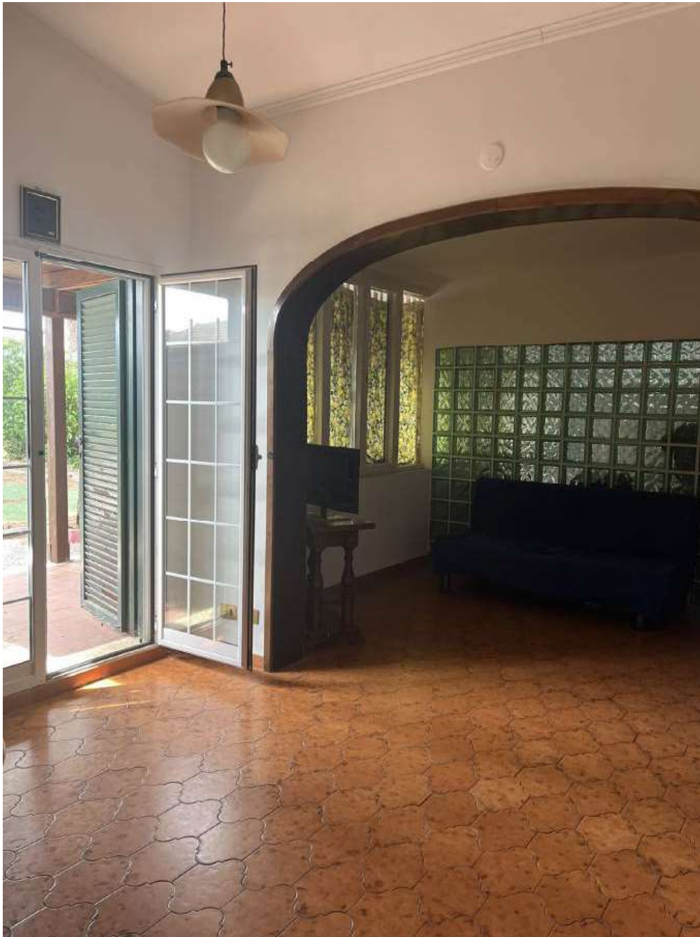
Figura 3: Interno – soggiorno