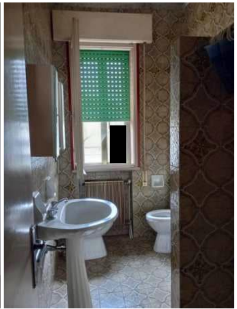
Piano Terra – laboratorio