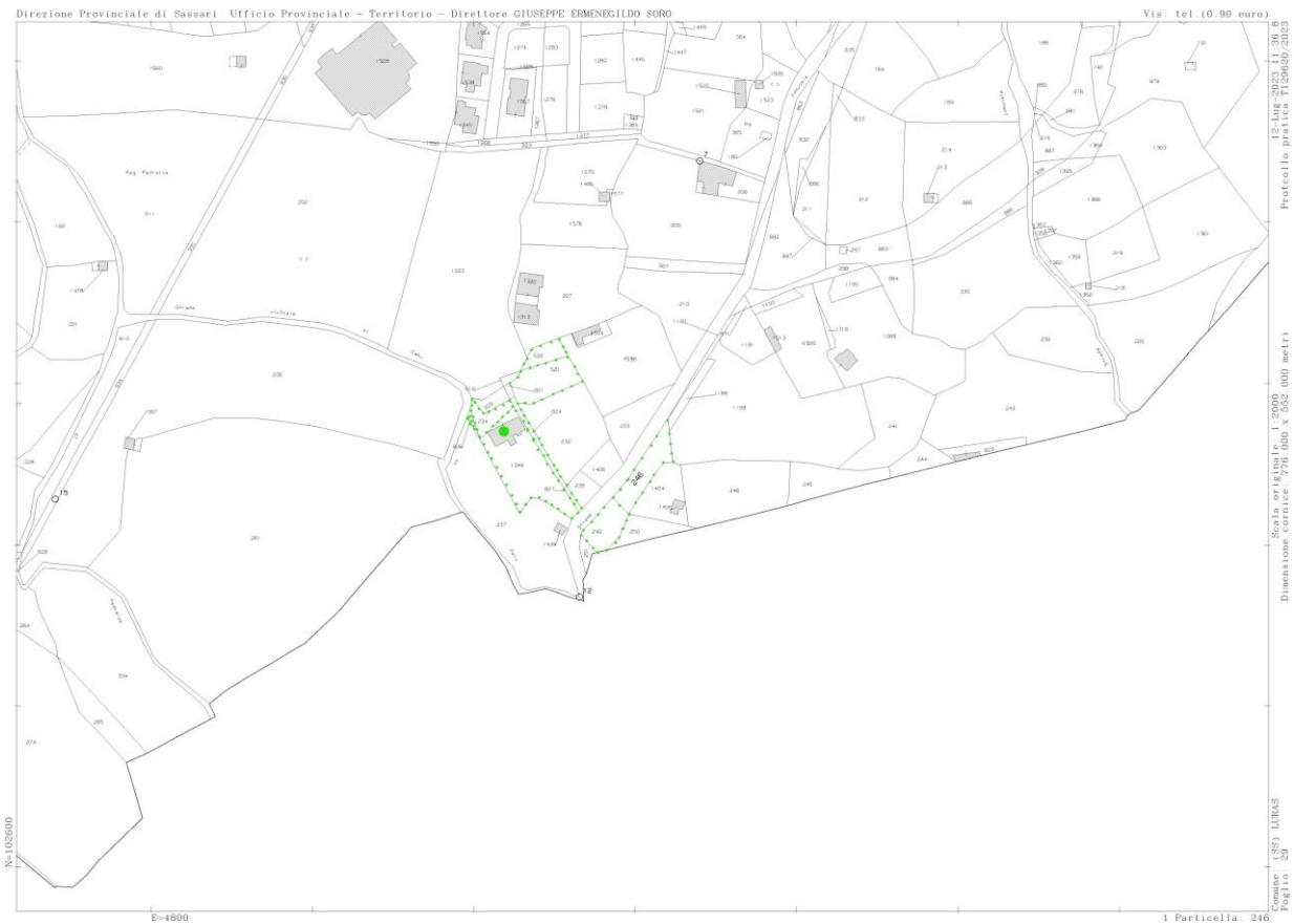
terreni - estratto di mappa catastale