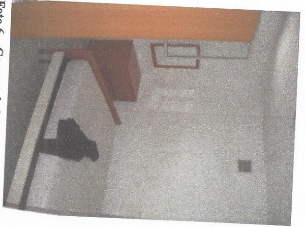
Foto 6 - Camera da letto _2