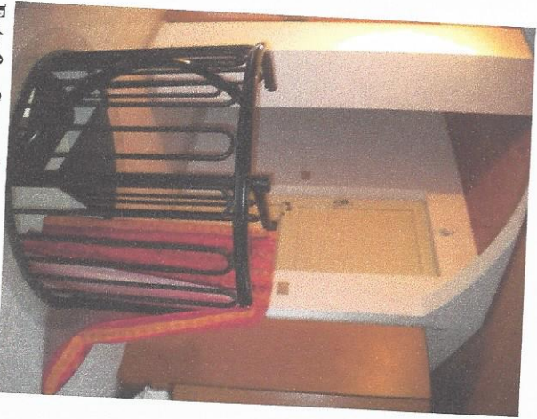
Foto 8 - Scala al sottotetto