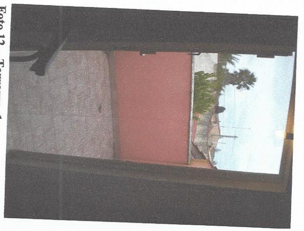
Foto 12 - Terrazza_1