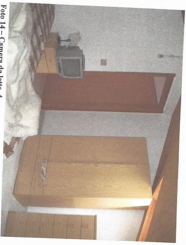
Foto 14 - Camera da letto_4