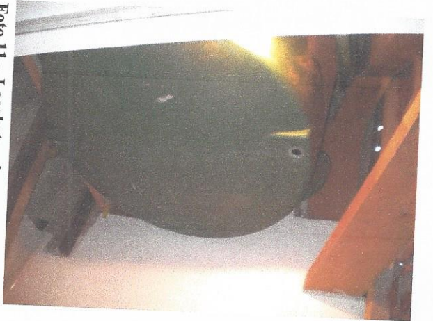
Foto 11 - Locale tecnico