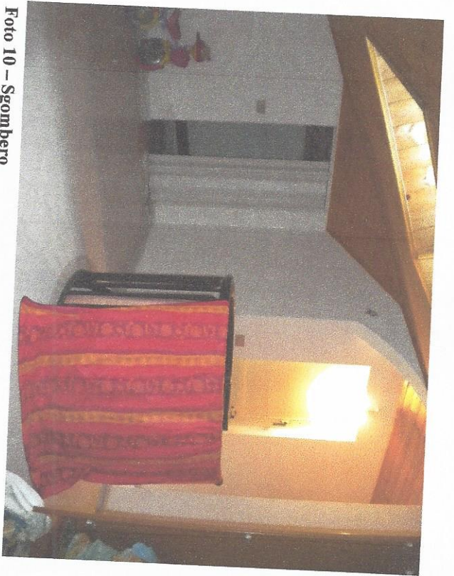
Foto 10 - Sgombero