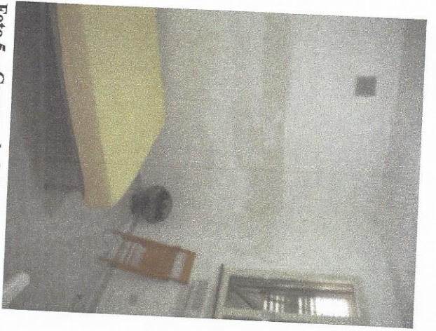
Foto 5 - Camera da letto _1