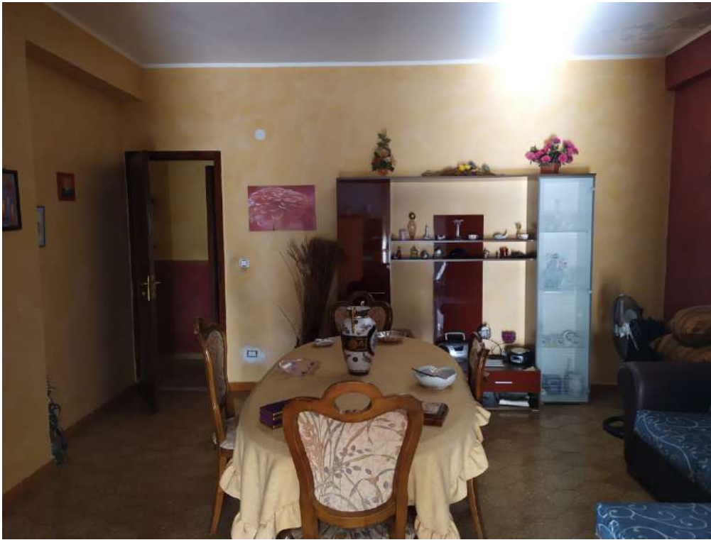
Fotografia 19 – sala da pranzo

Lotto Unico – Immobile identif. al N.C.E.U. del Comune di Misilmeri (PA), fg. n.18, part. n. 2501 – sub. n. 18