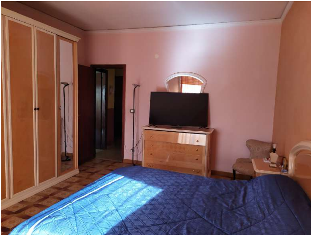
Fotografia 24 – Letto

Lotto Unico – Immobile identif. al N.C.E.U. del Comune di Misilmeri (PA), fg. n.18, part. n. 2501 – sub. n. 18