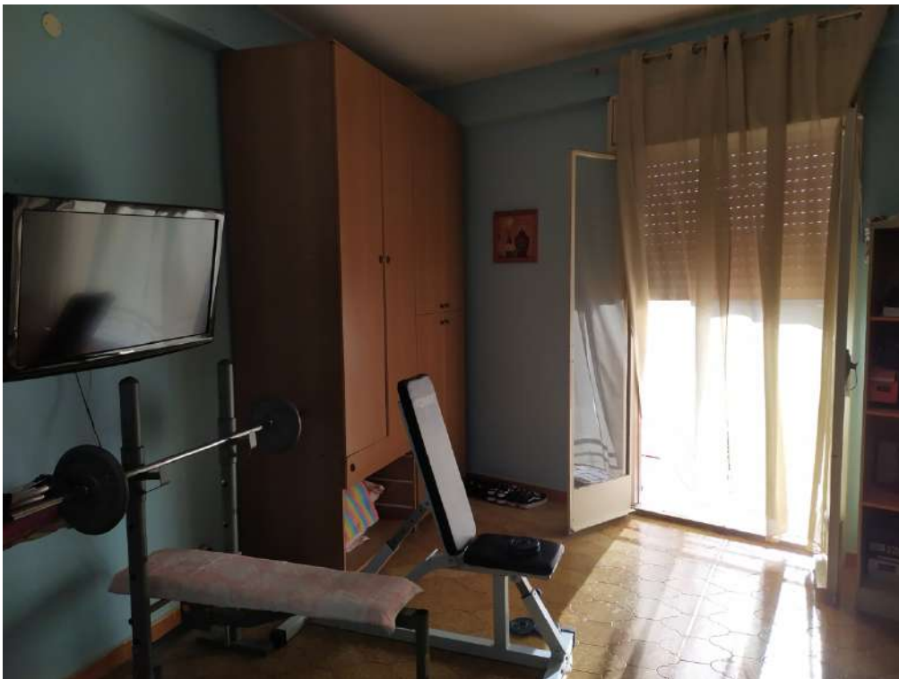
Fotografia 22 – soggiorno

Lotto Unico – Immobile identif. al N.C.E.U. del Comune di Misilmeri (PA), fg. n.18, part. n. 2501 – sub. n. 18