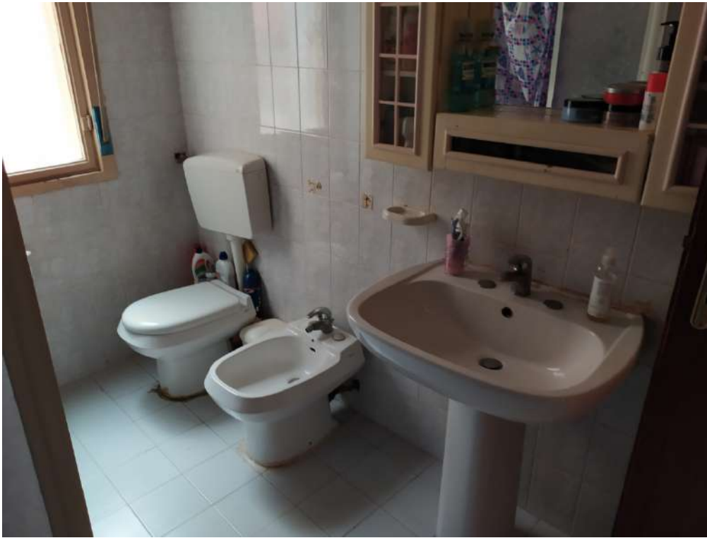
Fotografia 15 – w.c.

Lotto Unico – Immobile identif. al N.C.E.U. del Comune di Misilmeri (PA), fg. n.18, part. n. 2501 – sub. n. 18