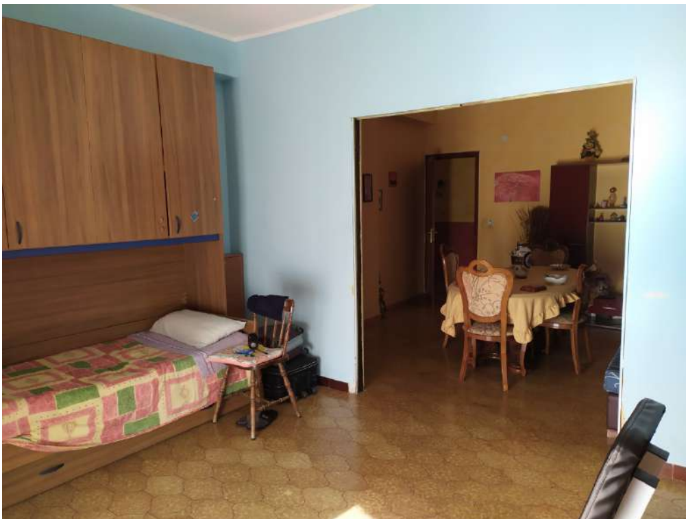
Fotografia 20 – soggiorno.

Lotto Unico – Immobile identif. al N.C.E.U. del Comune di Misilmeri (PA), fg. n.18, part. n. 2501 – sub. n. 18