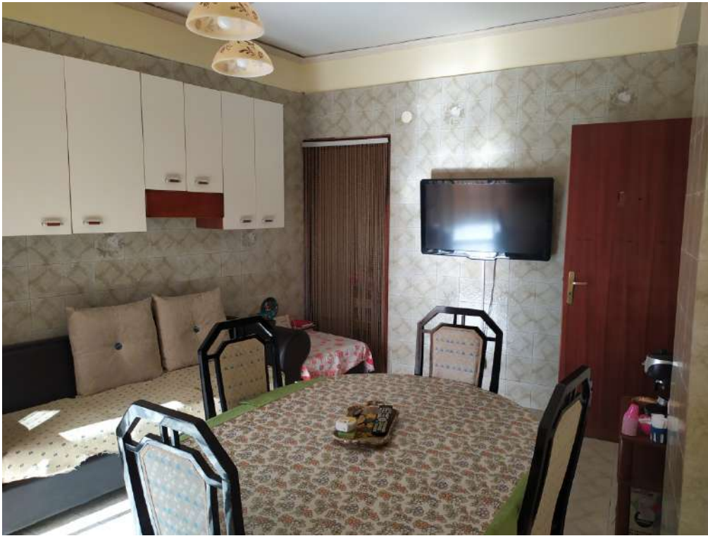
Fotografia 11 – Cucina

Lotto Unico – Immobile identif. al N.C.E.U. del Comune di Misilmeri (PA), fg. n.18, part. n. 2501 – sub. n. 18