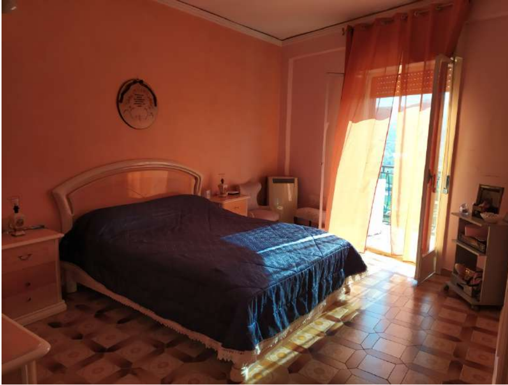
Fotografia 23 – Letto

Lotto Unico – Immobile identif. al N.C.E.U. del Comune di Misilmeri (PA), fg. n.18, part. n. 2501 – sub. n. 18