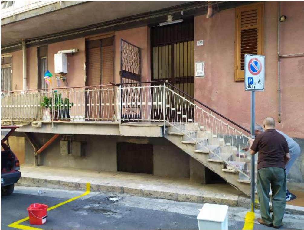
Fotografia 5 – Ingresso su via Carso n. 123

Lotto Unico – Immobile identif. al N.C.E.U. del Comune di Misilmeri (PA), fg. n.18, part. n. 2501 – sub. n. 18