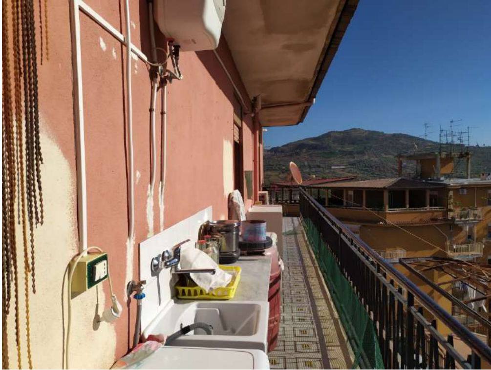
Fotografia 25 – Balcone

Lotto Unico – Immobile identif. al N.C.E.U. del Comune di Misilmeri (PA), fg. n.18, part. n. 2501 – sub. n. 18