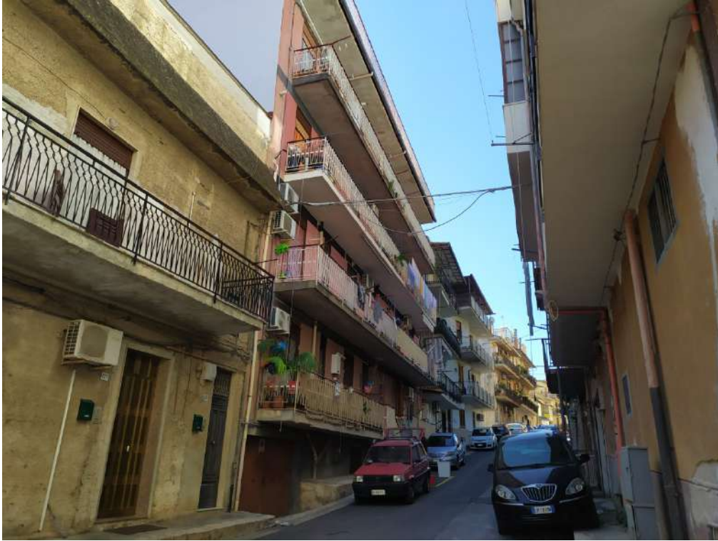
Fotografia 3 – Prospetto via Carso n. 123

Lotto Unico – Immobile identif. al N.C.E.U. del Comune di Misilmeri (PA), fg. n.18, part. n. 2501 – sub. n. 18