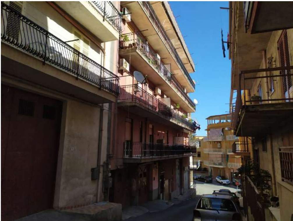
Fotografia 4 – Prospetto via Turrisi Colonna

Lotto Unico – Immobile identif. al N.C.E.U. del Comune di Misilmeri (PA), fg. n.18, part. n. 2501 – sub. n. 18