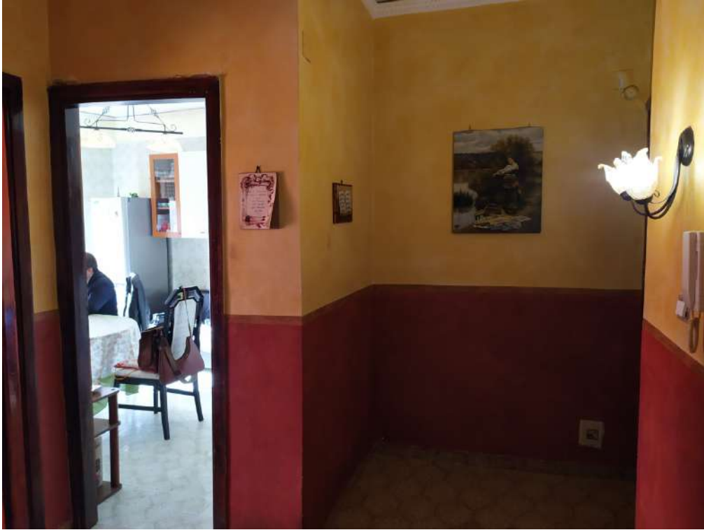
Fotografia 9 – Disimpegno

Lotto Unico – Immobile identif. al N.C.E.U. del Comune di Misilmeri (PA), fg. n.18, part. n. 2501 – sub. n. 18