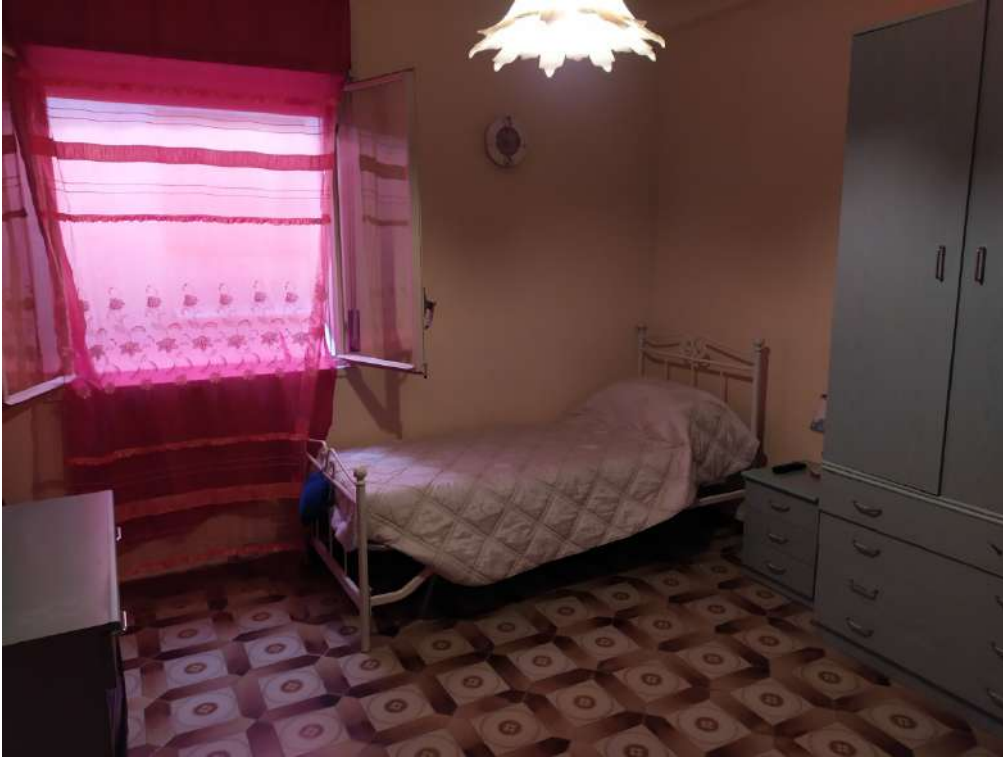
Fotografia 17 – Letto

Lotto Unico – Immobile identif. al N.C.E.U. del Comune di Misilmeri (PA), fg. n.18, part. n. 2501 – sub. n. 18