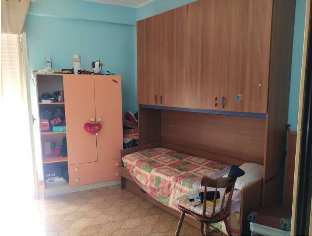
Fotografia 21 – soggiorno

Lotto Unico – Immobile identif. al N.C.E.U. del Comune di Misilmeri (PA), fg. n.18, part. n. 2501 – sub. n. 18