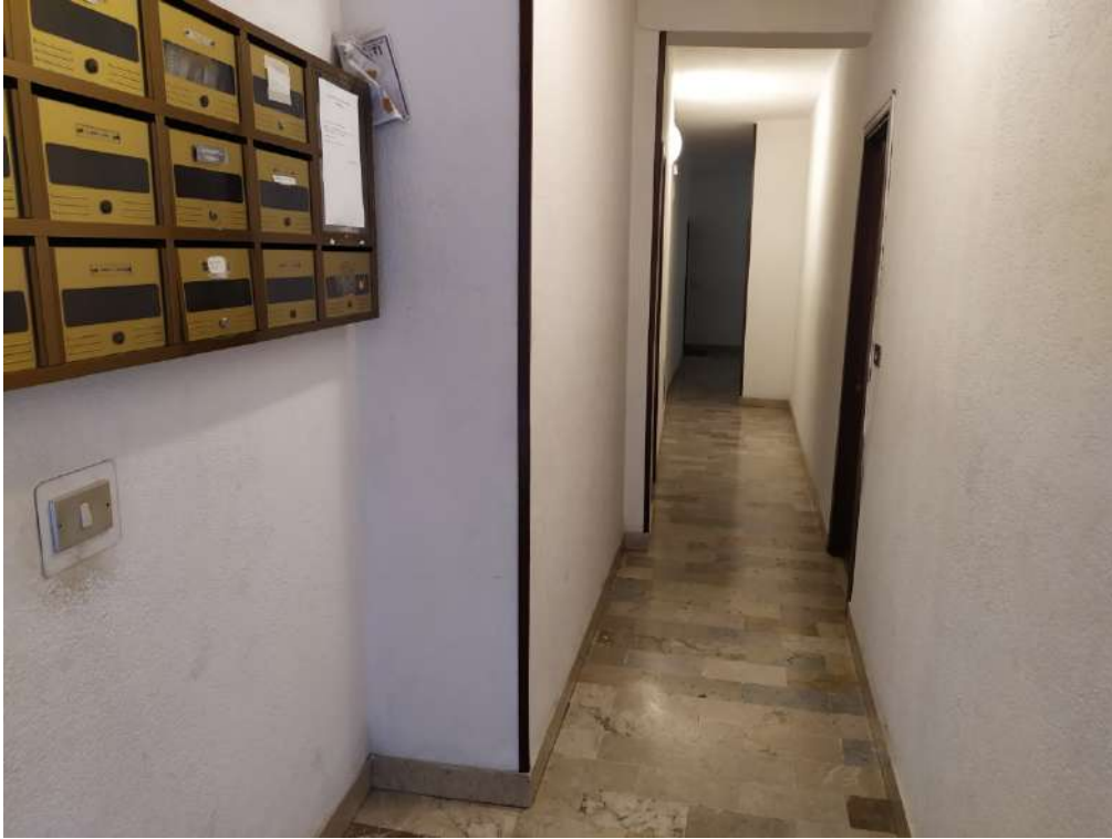
Fotografia 7 – Androne

Lotto Unico – Immobile identif. al N.C.E.U. del Comune di Misilmeri (PA), fg. n.18, part. n. 2501 – sub. n. 18