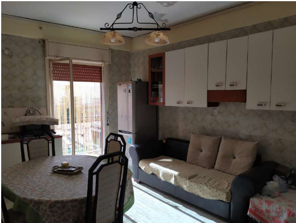
Fotografia 10 – Cucina

Lotto Unico – Immobile identif. al N.C.E.U. del Comune di Misilmeri (PA), fg. n.18, part. n. 2501 – sub. n. 18