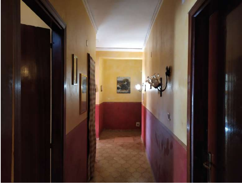
Fotografia 13 – Disimpegno

Lotto Unico – Immobile identif. al N.C.E.U. del Comune di Misilmeri (PA), fg. n.18, part. n. 2501 – sub. n. 18