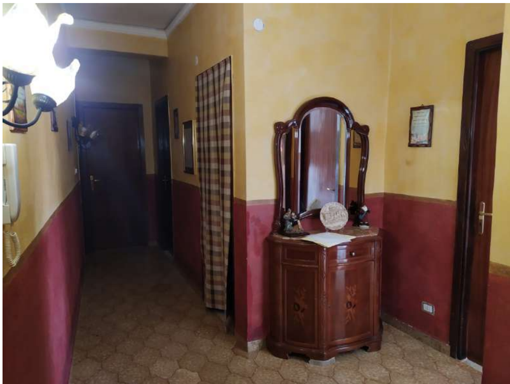
Fotografia 14 – Disimpegno

Lotto Unico – Immobile identif. al N.C.E.U. del Comune di Misilmeri (PA), fg. n.18, part. n. 2501 – sub. n. 18