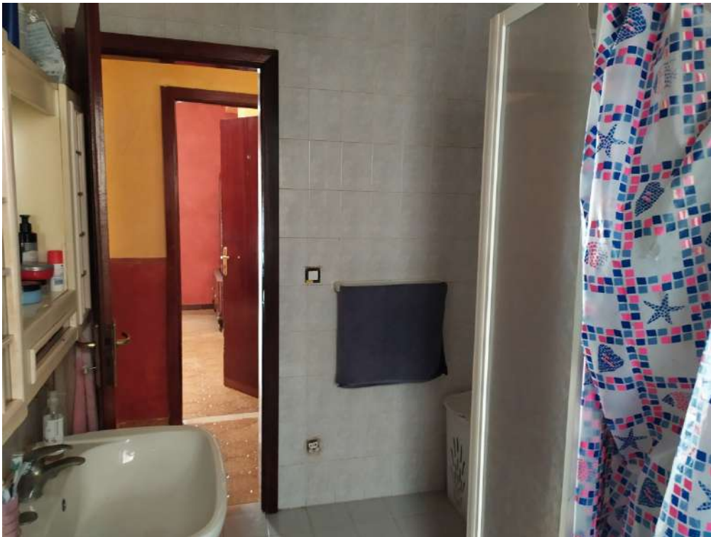
Fotografia 16 – w.c.

Lotto Unico – Immobile identif. al N.C.E.U. del Comune di Misilmeri (PA), fg. n.18, part. n. 2501 – sub. n. 18