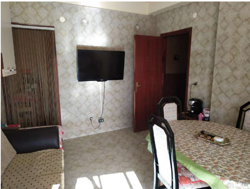
Fotografia 12 – Cucina

Lotto Unico – Immobile identif. al N.C.E.U. del Comune di Misilmeri (PA), fg. n.18, part. n. 2501 – sub. n. 18