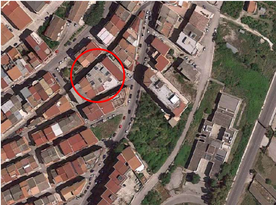
Fotografia 2 -Inquadramento territoriale MISILMERI (PA), via Carso, n.123 (Immagine di Google Earth)