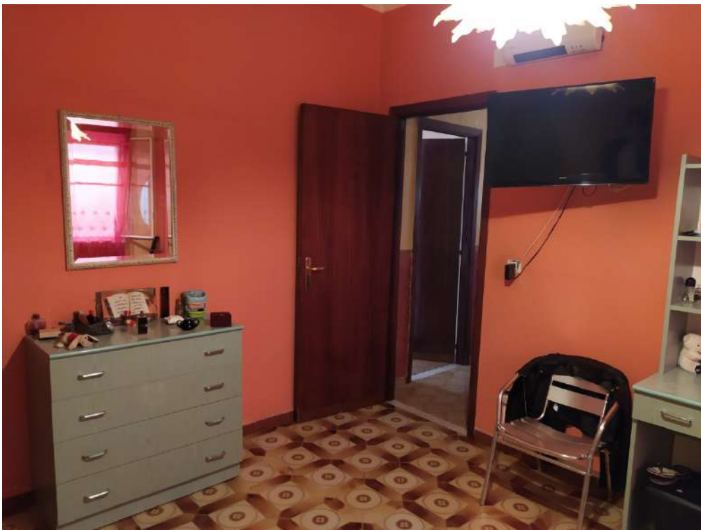
Fotografia 18 – Letto

Lotto Unico – Immobile identif. al N.C.E.U. del Comune di Misilmeri (PA), fg. n.18, part. n. 2501 – sub. n. 18