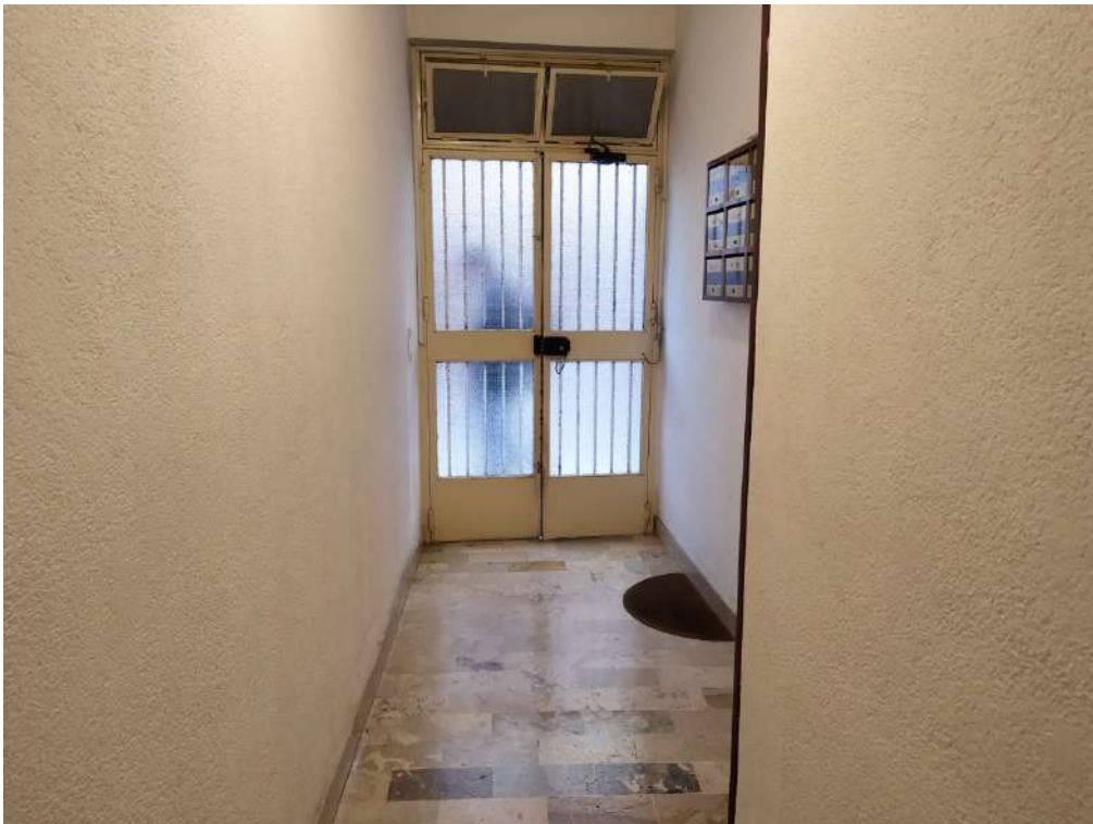
Fotografia 6 – Ingresso interno edificio condominiale

Lotto Unico – Immobile identif. al N.C.E.U. del Comune di Misilmeri (PA), fg. n.18, part. n. 2501 – sub. n. 18