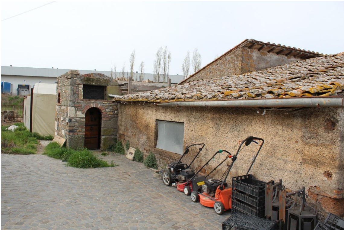
Foto 3 - Magazzino e volume annesso con funzioni di ingresso agli spazi ipogei (Sub 12)