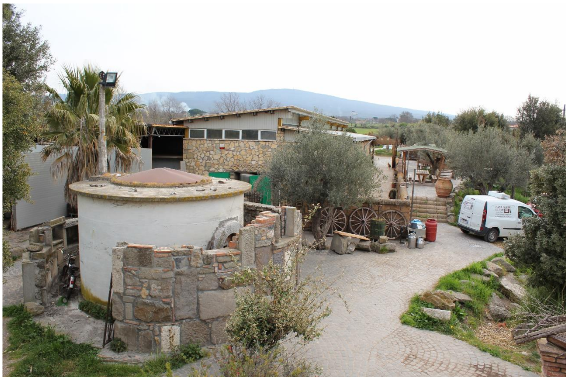
Foto 4 - Volume cilindrico di ingresso agli spazi ipogei (sub 12)