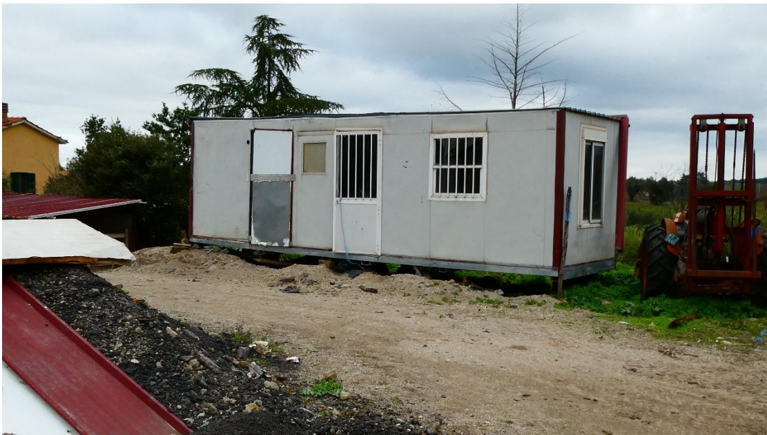
Foto 10 - Immobile-container a servizio dell'attività agricola (rif. Planimetria n. 4)