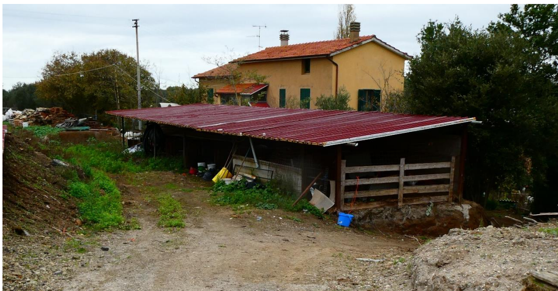
Foto 11 - Immobile destinato al ricovero animali (rif. planimetria n.5)