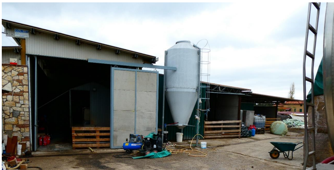
Foto 7 - Immobile destinato al ricovero del bestiame (rif. Planimetria n. 2)