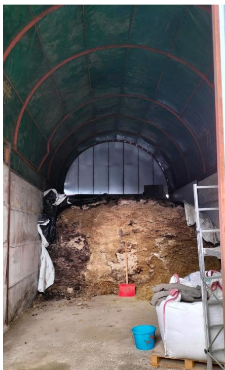
Foto 9 - Interno con l'insilato