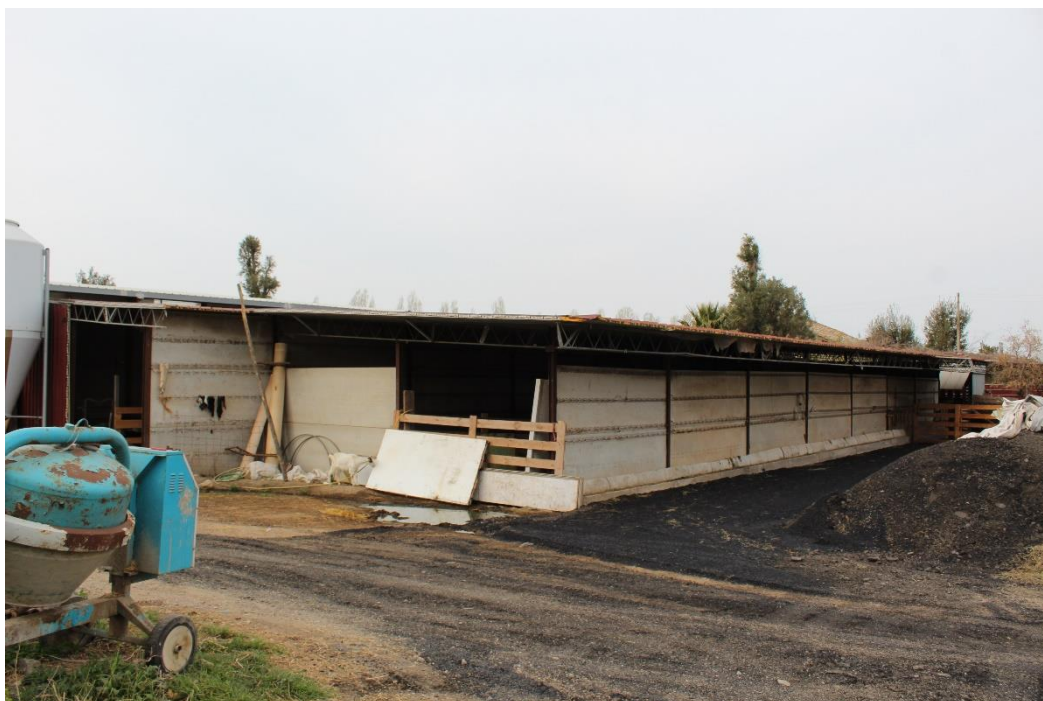
Foto 2 - Immobile destinato al ricovero degli animali