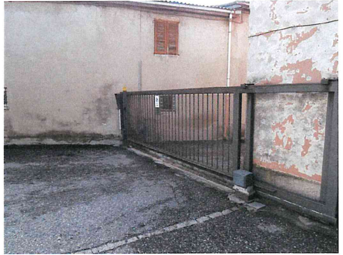
Foto 01 - Cancellone pedonale e carrale di accesso