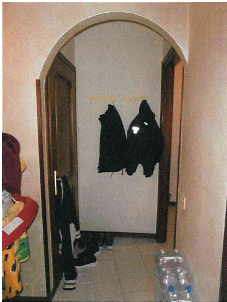
Foto 11 - Disimpegno