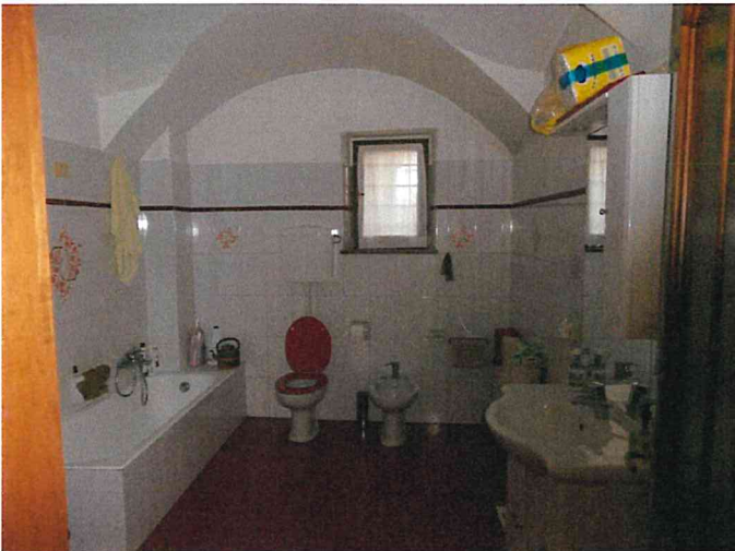
Foto 13 - bagno