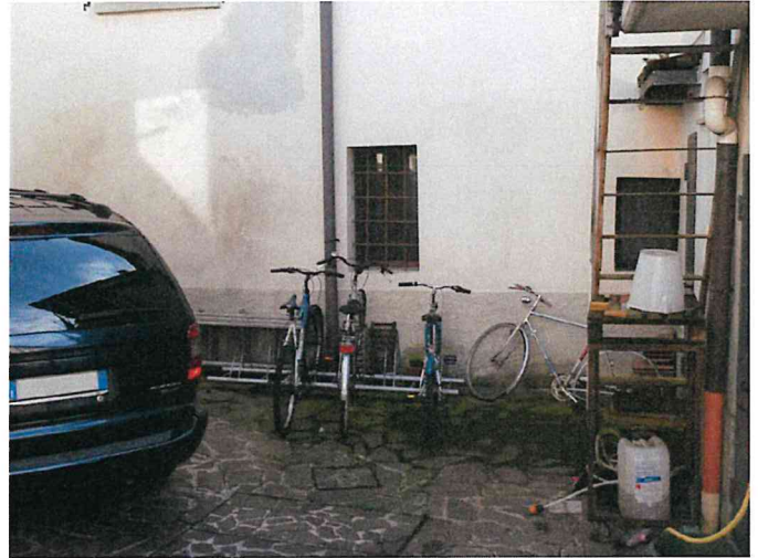
Foto 08 - prospetto Nord alloggio