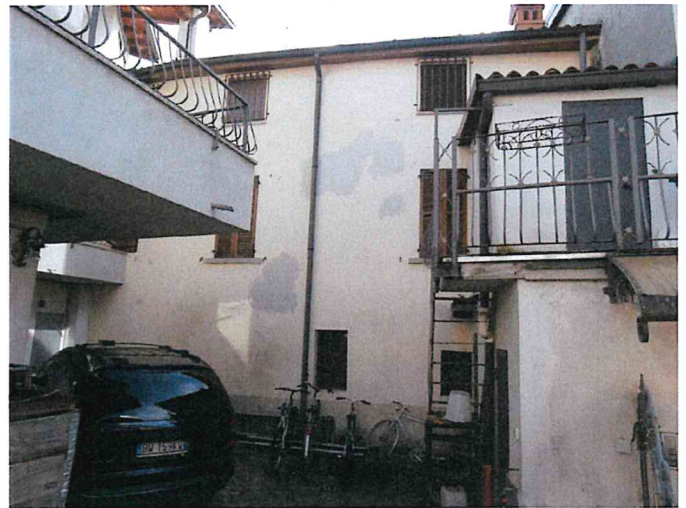
Foto 06 - Fabbricato cui appartengono i beni - prospetto Nord