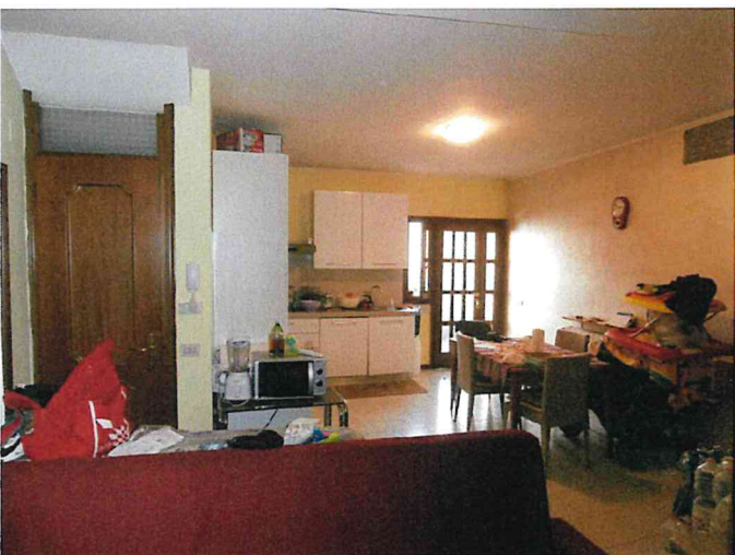
Foto 09 - ingresso angolo cottura