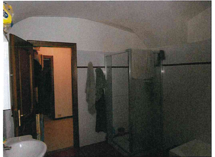
Foto 14 - bagno