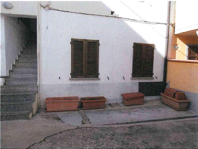
Foto 05 - Prospetto Sud-Est alloggio