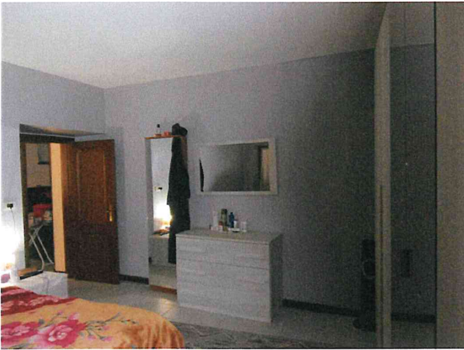
Foto 17 - camera Sud