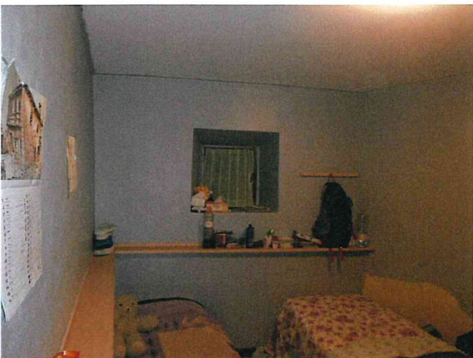
Foto 15 - camera Nord