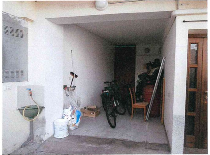
Foto 03 - Prospetto Sud-Est box