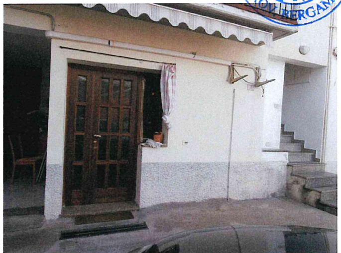
Foto 04 - Prospetto Sud-Est alloggio