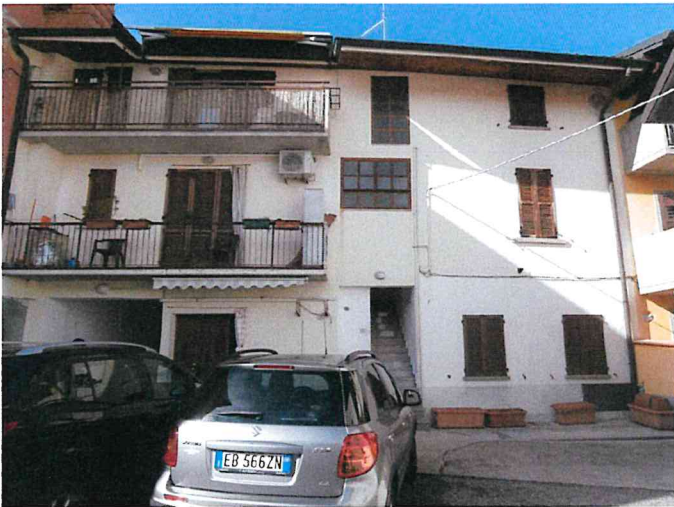
Foto 02 - Fabbricato cui appartengono i beni - prospetto Sud-Est