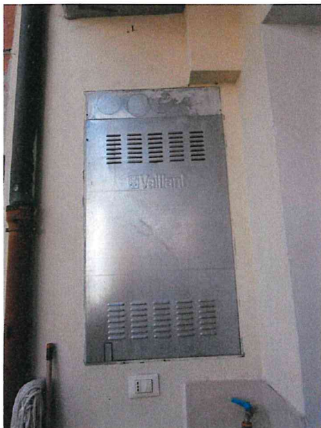
Foto 03bis particolare caldaia