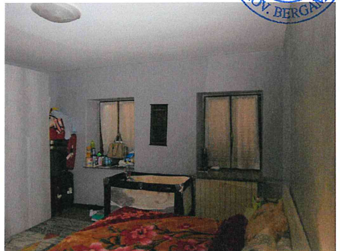
Foto 16 - camera Sud