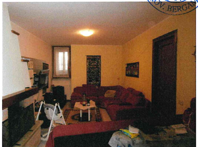
Foto 10 - Soggiorno