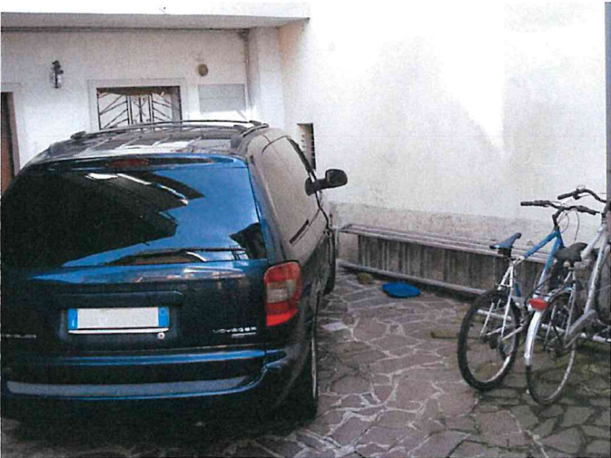
Foto 07 - prospetto Nord alloggio