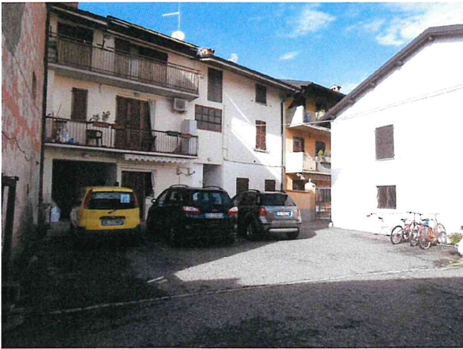
Foto 00 - Area esterna comune di cui al mapp. 46