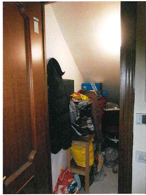
Foto 18 - ripostiglio