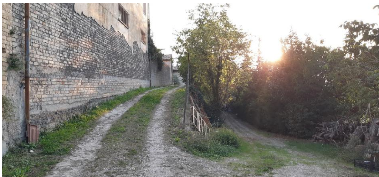
Strada di accesso