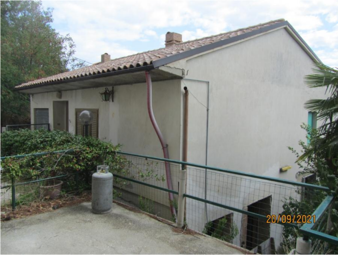
Prospetti Nord e Ovest