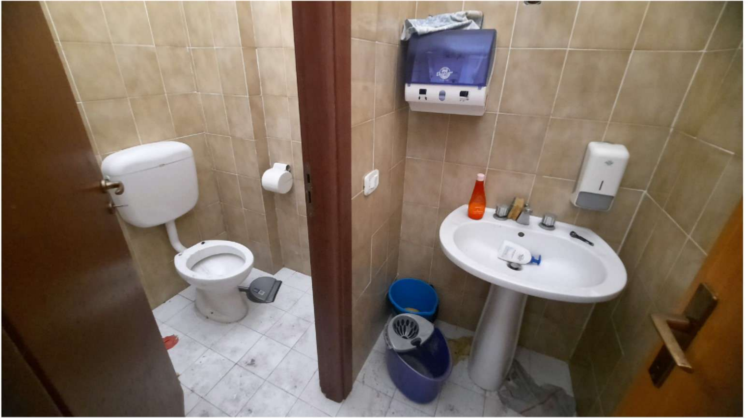
Foto 15 - 16 - Panoramiche del bagno e antibagno del negozio al piano terra (Foglio n°26, Particella n°557 subalterno n° 388)