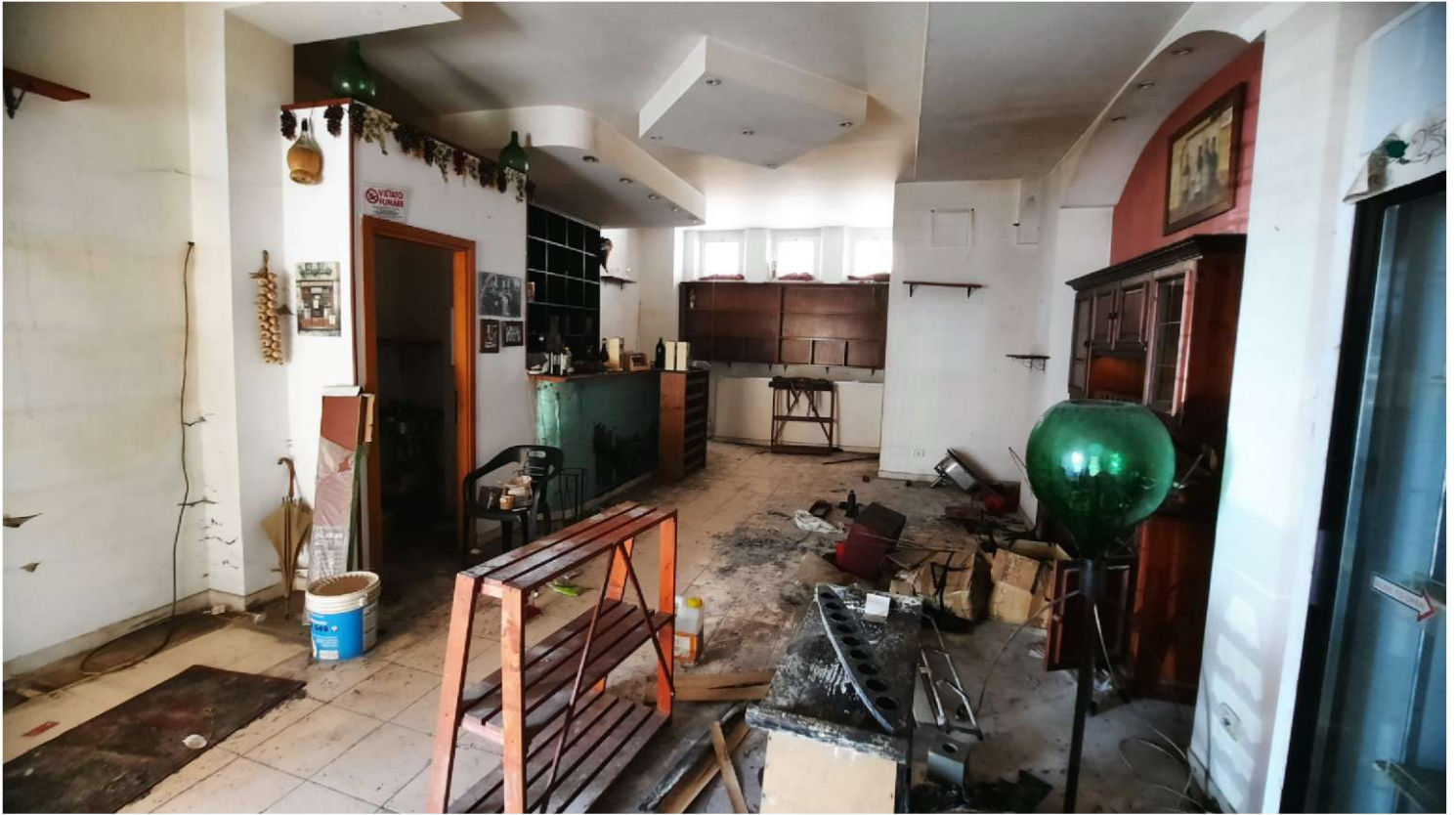
Foto 9 - 10 - Panoramiche del negozio al piano terra (Foglio n°26, Particella n°557 subalterno n° 388)