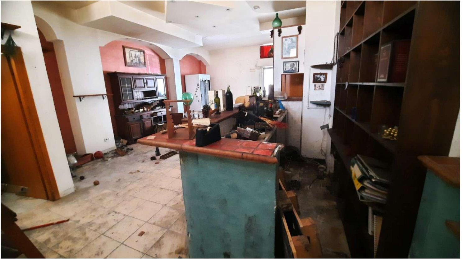
Foto 13 - 14 - Panoramiche del bancone del negozio al piano terra (Foglio n°26, Particella n°557 subalterno n° 388)