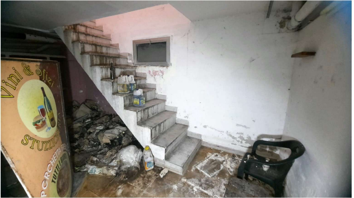
Foto 7 - 8 - Panoramiche della scala di collegamento tra il piano terra ed il piano sotto-strada