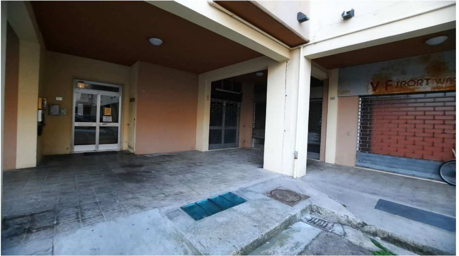
Foto 3 - 4 - ingresso delle U.I.