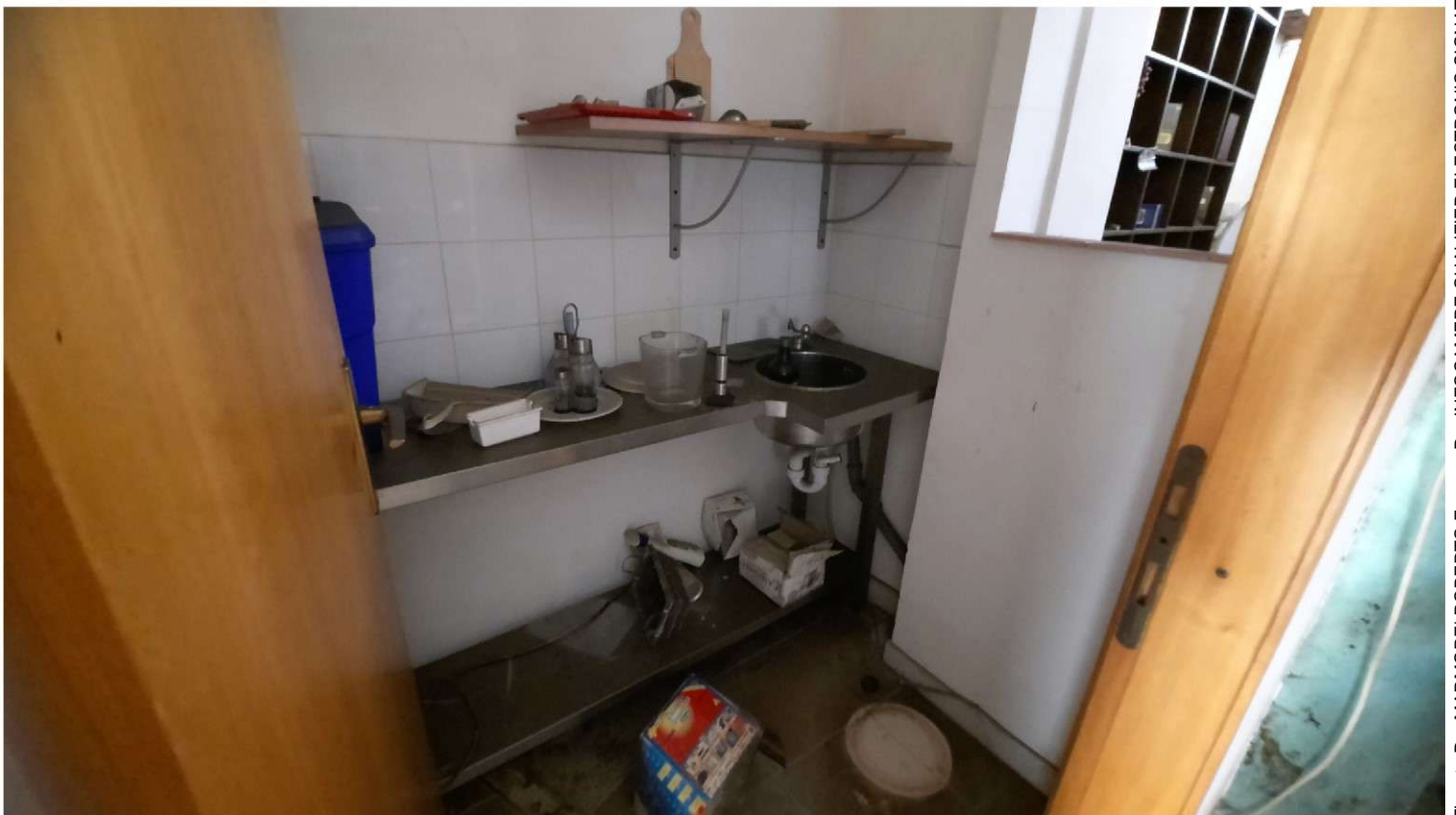
Foto 12 - Dispensa del negozio al piano terra