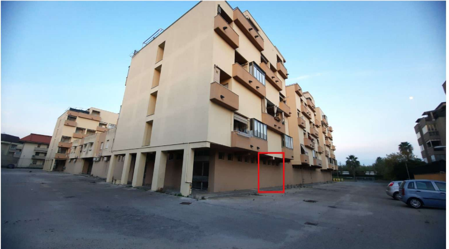
Foto 2 - Prospetti nord e ovest fabbricato (vista da cortile condominiale)