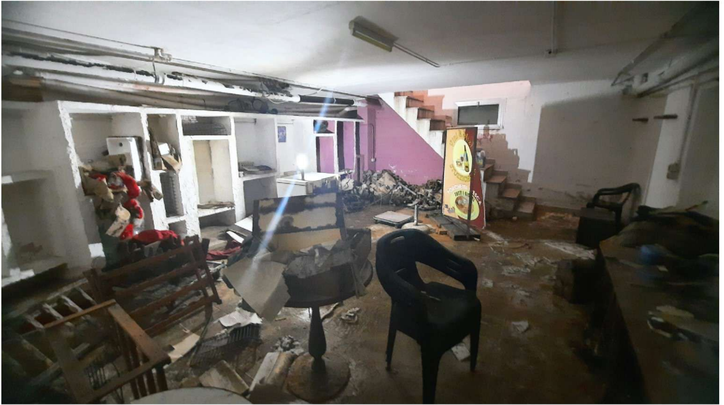
Foto 5 - 6 - Panoramiche del fondaco/magazzino al piano sotto-strada (Foglio n°26, Particella n°557 subalterno n° 387)