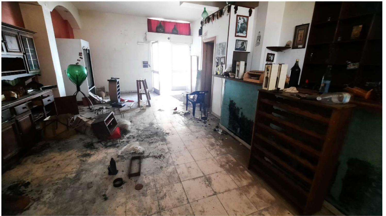
Foto 11 - Panoramica del negozio al piano terra (Foglio n°26, Particella n°557 subalterno n° 388)