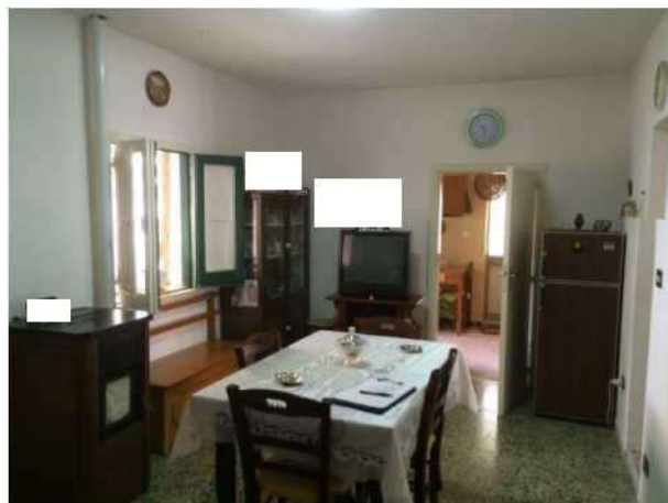
FOTO 4 - SOGGIORNO