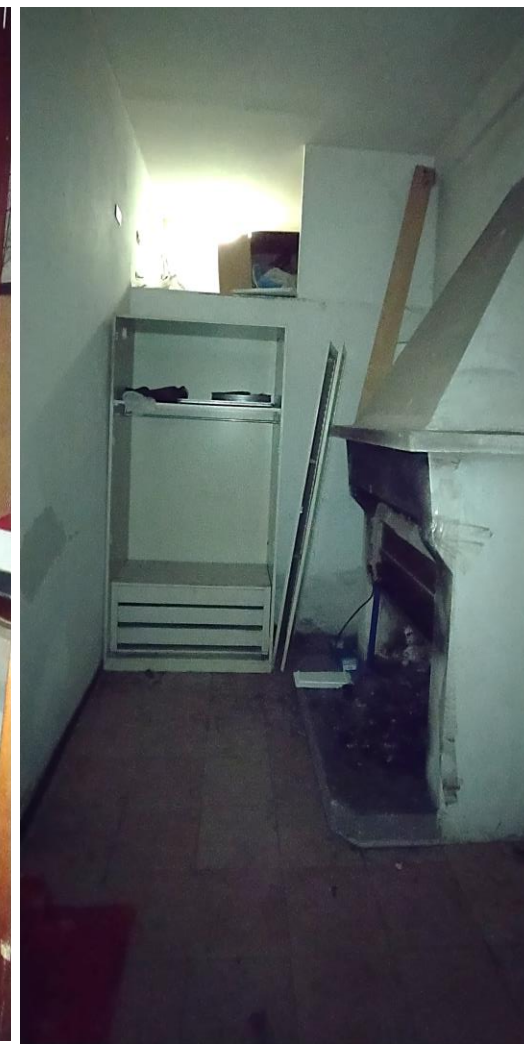
Foto 13-14-15 – accessori P. Terra: disimpegno, bagno e ripostiglio