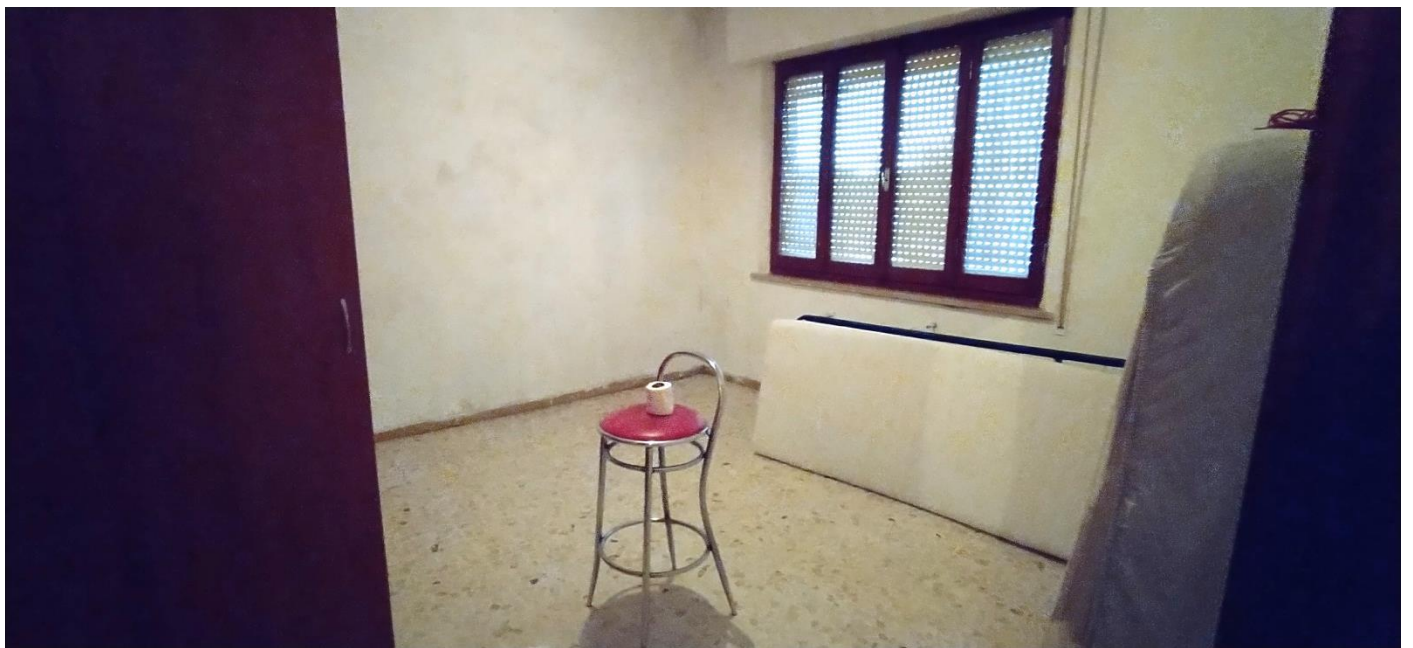
Foto 25 - camera 4