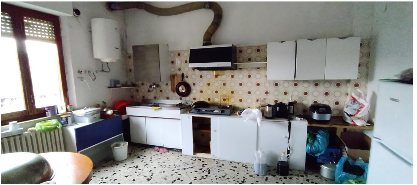
Foto 26-27-28-29 – viste cucina