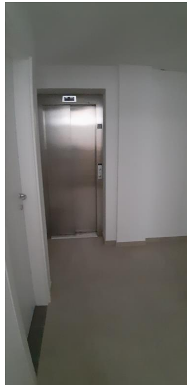
FOTO 3 ascensore prima e dopo