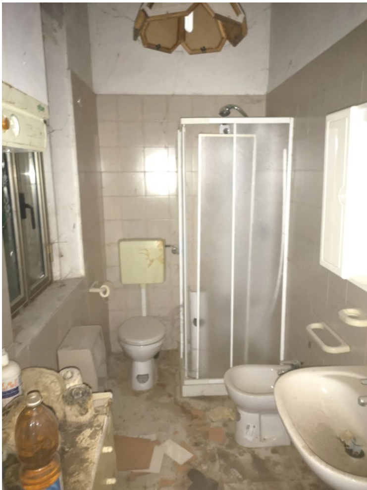
BAGNO P1 RETRO