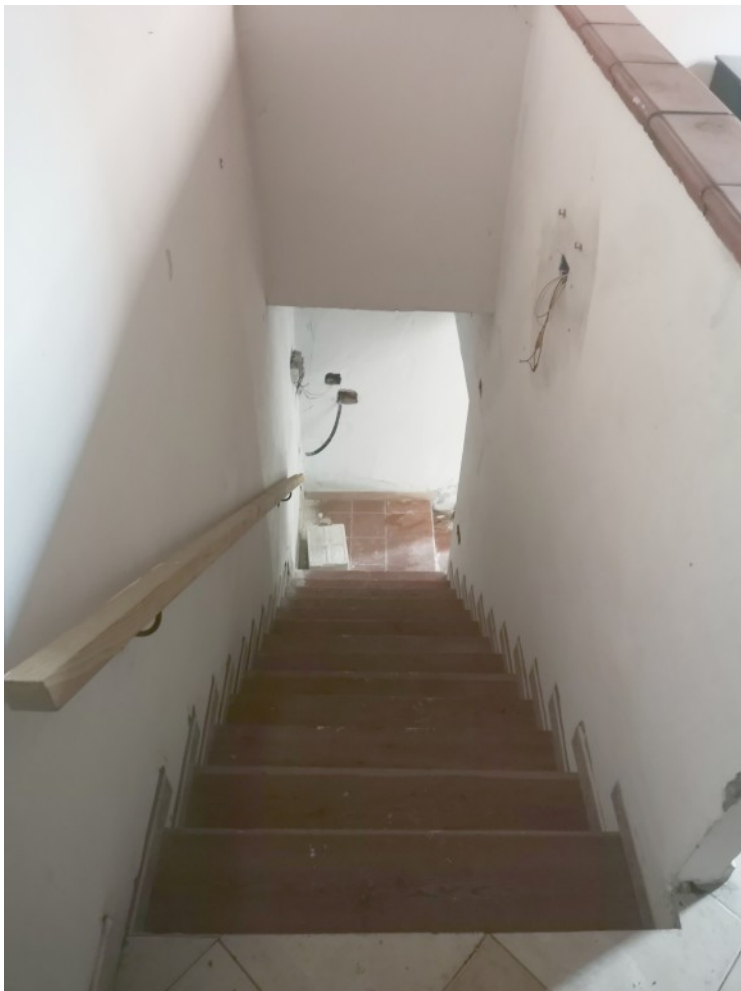
SCALA P1 - FRONTE