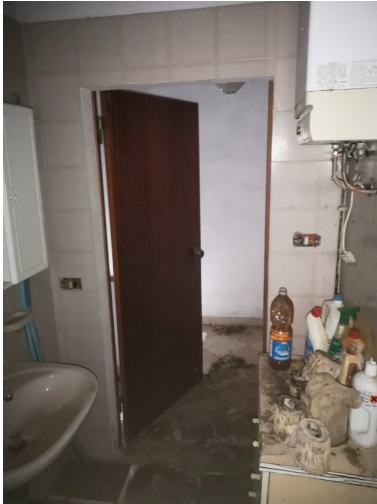
BAGNO P1 RETRO