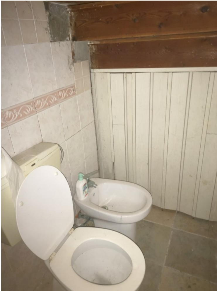
BAGNO PT FRONTE