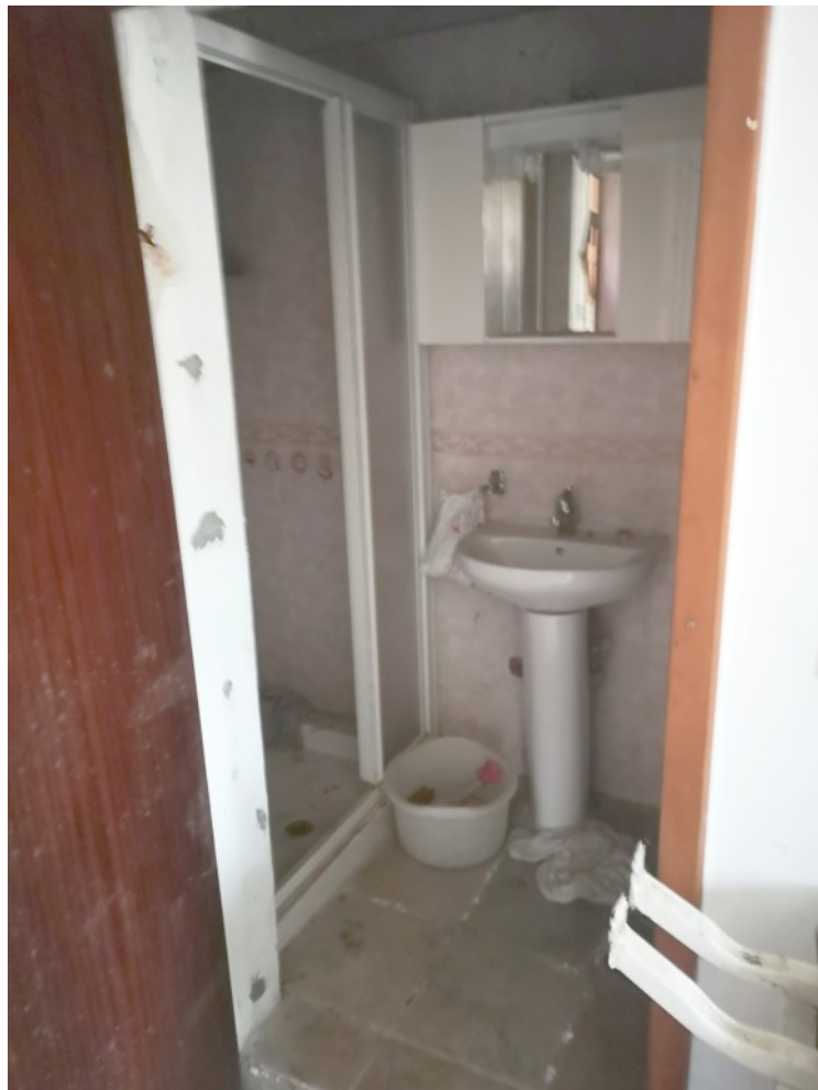
BAGNO PT FRONTE