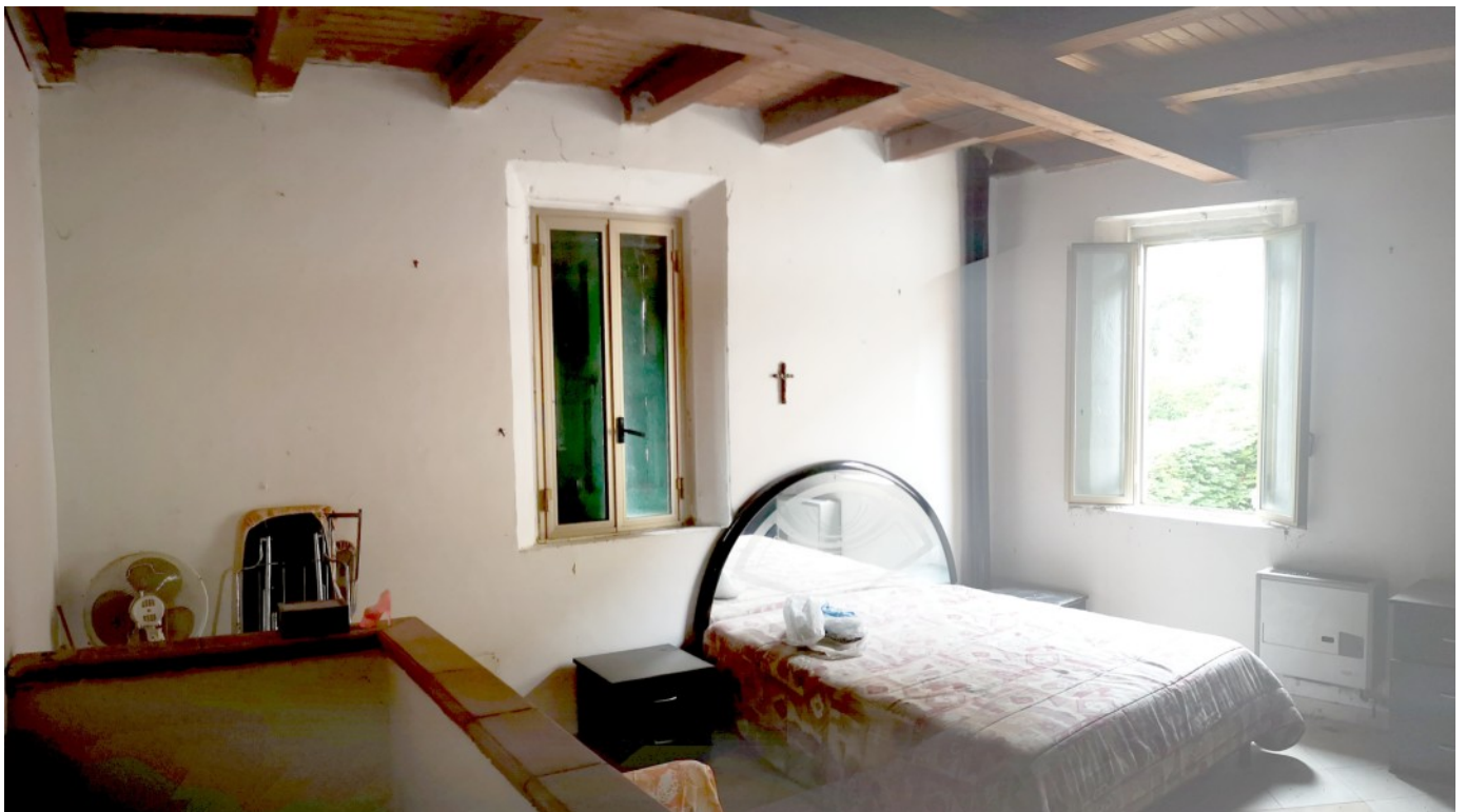
P1 - FRONTE