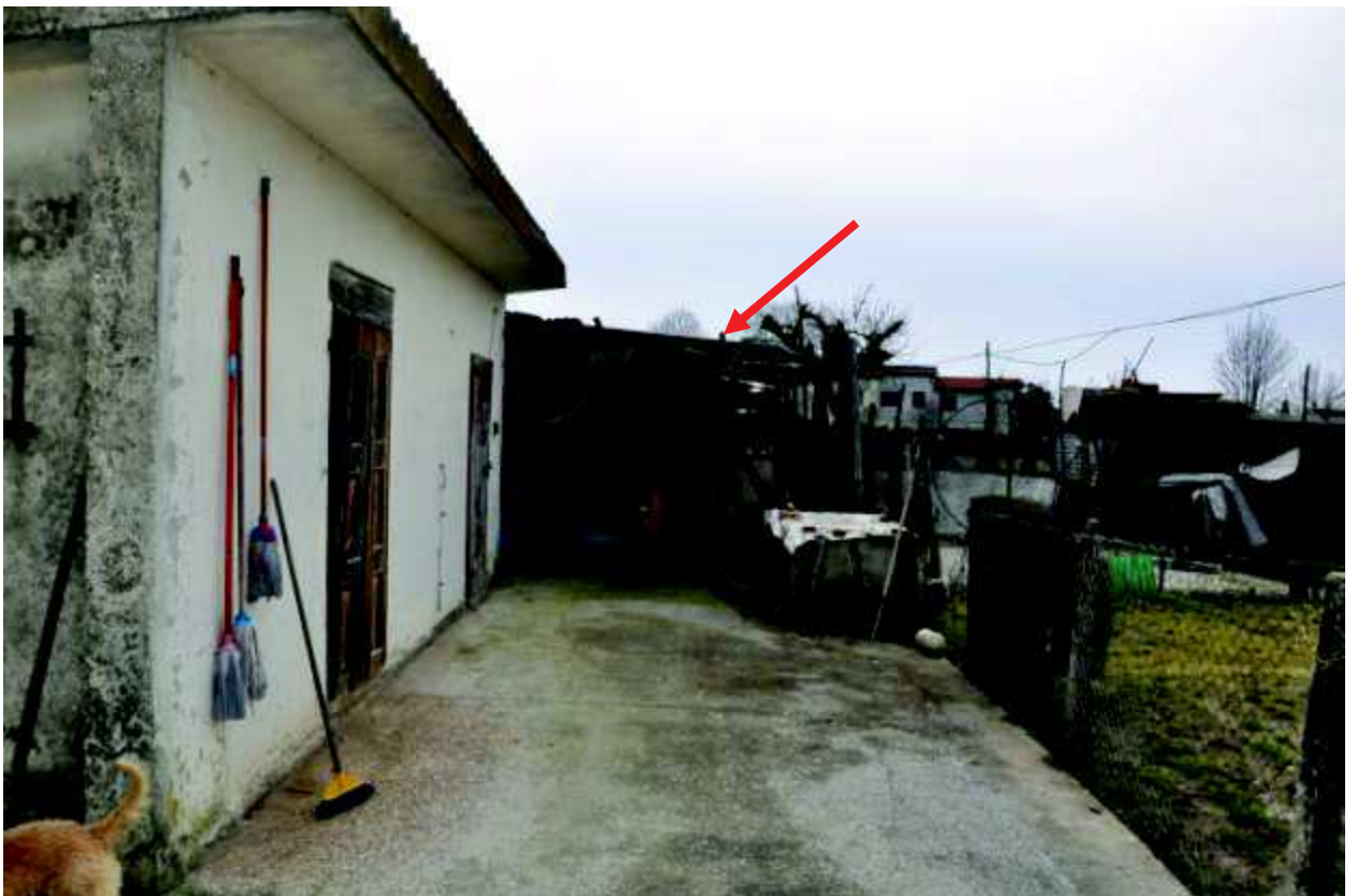
12 Fabbricato lato ovest (in rosso indicata la tettoia abusiva).