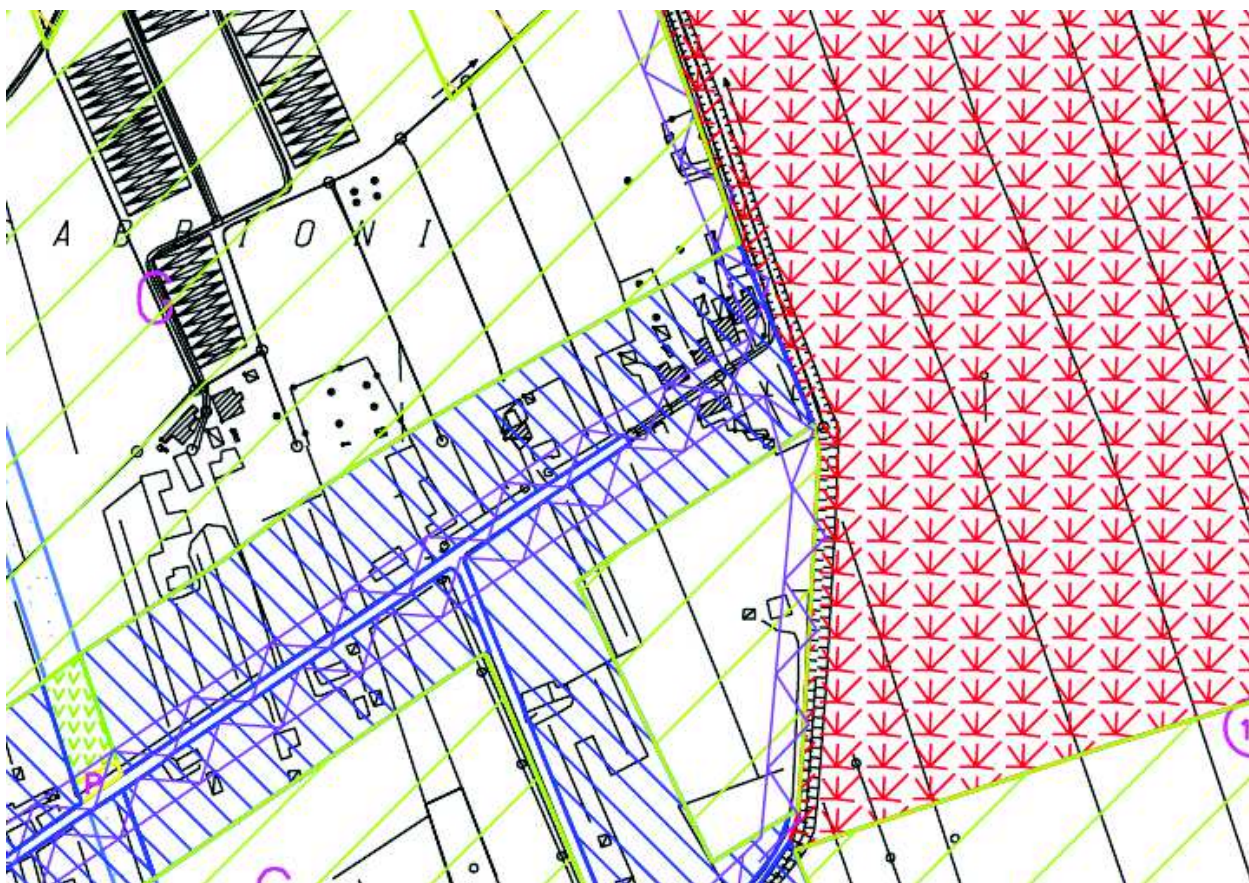
5. Individuazione su PRG tav.13 (il bene oggetto di stima ricade in zona Residenziale C1.2, sottozona agricola E3 e in zona di indagine geologica preventiva).