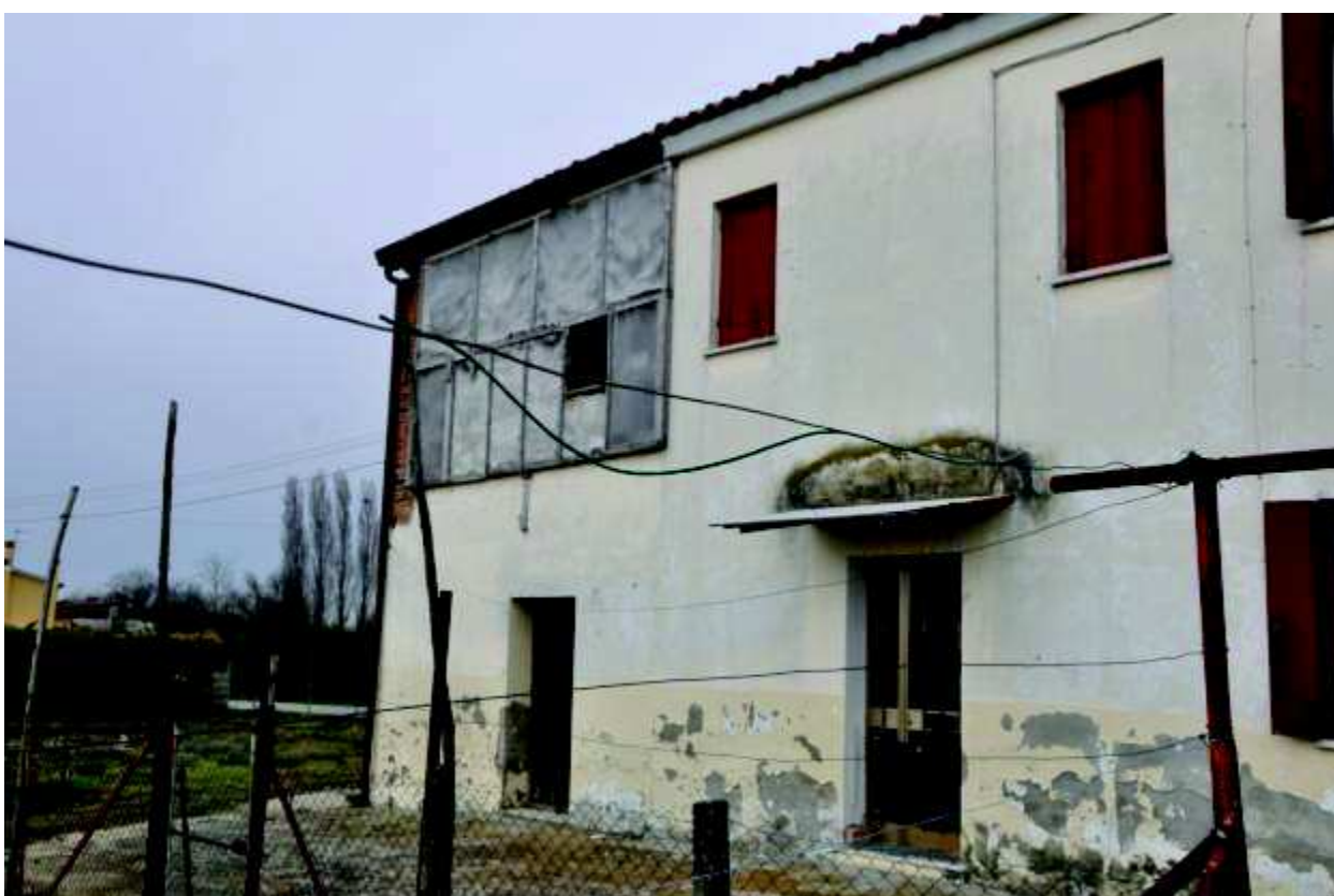
10 Porzione di piano primo, attualmente al grezzo.