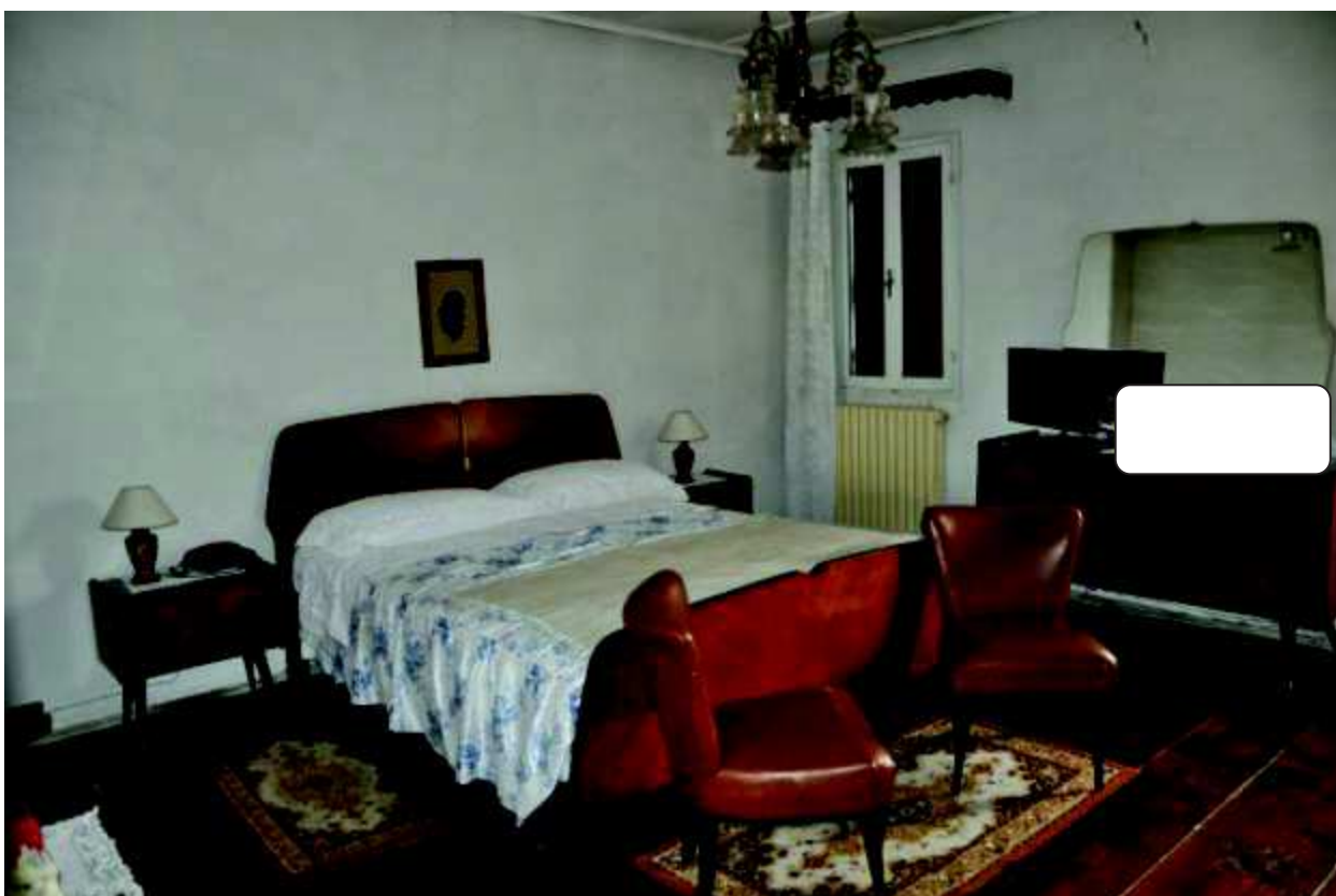
8 Camera da letto.