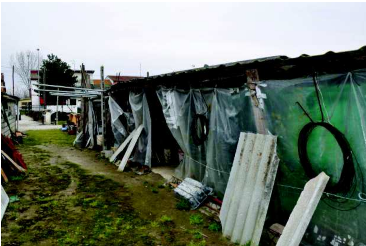
19 Tettoie abusive con tetto in Eternit.