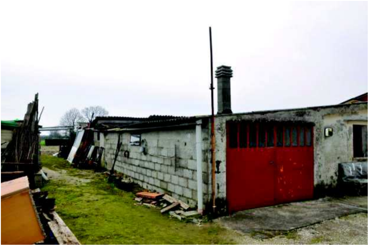
11 Fabbricato lato Nord, antistante la casa destinato ad uso ripostiglio, porcile e pollaio.