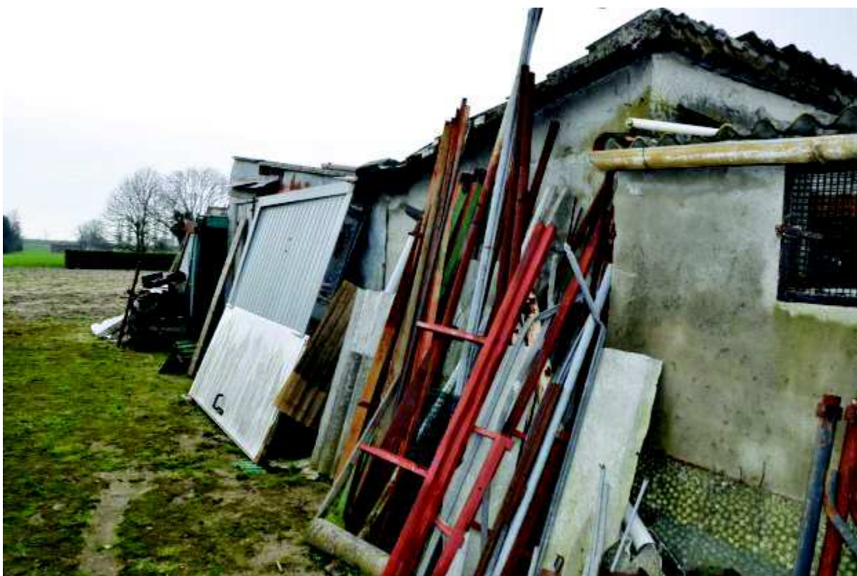
18 Fabbricato lato Est , adibito a deposito materiali.