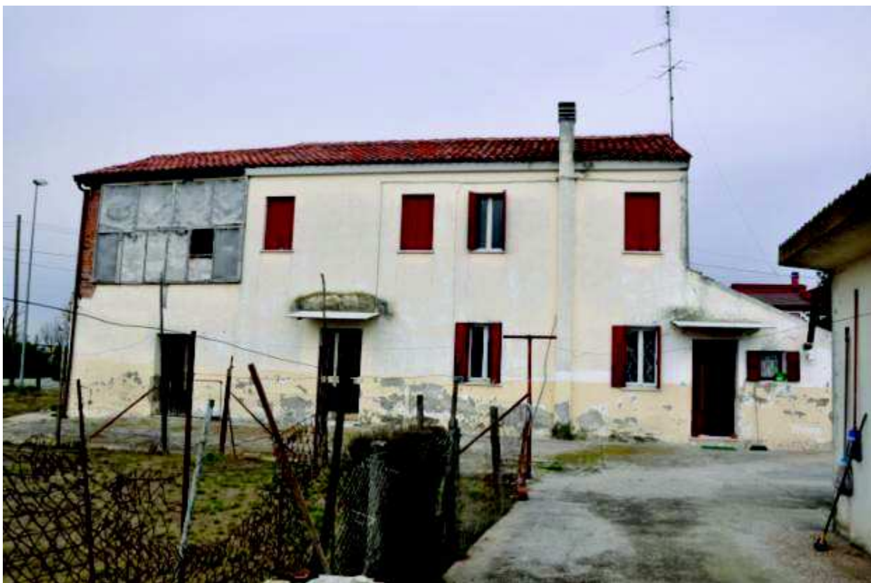
7. Vista dell'immobile lato Sud.