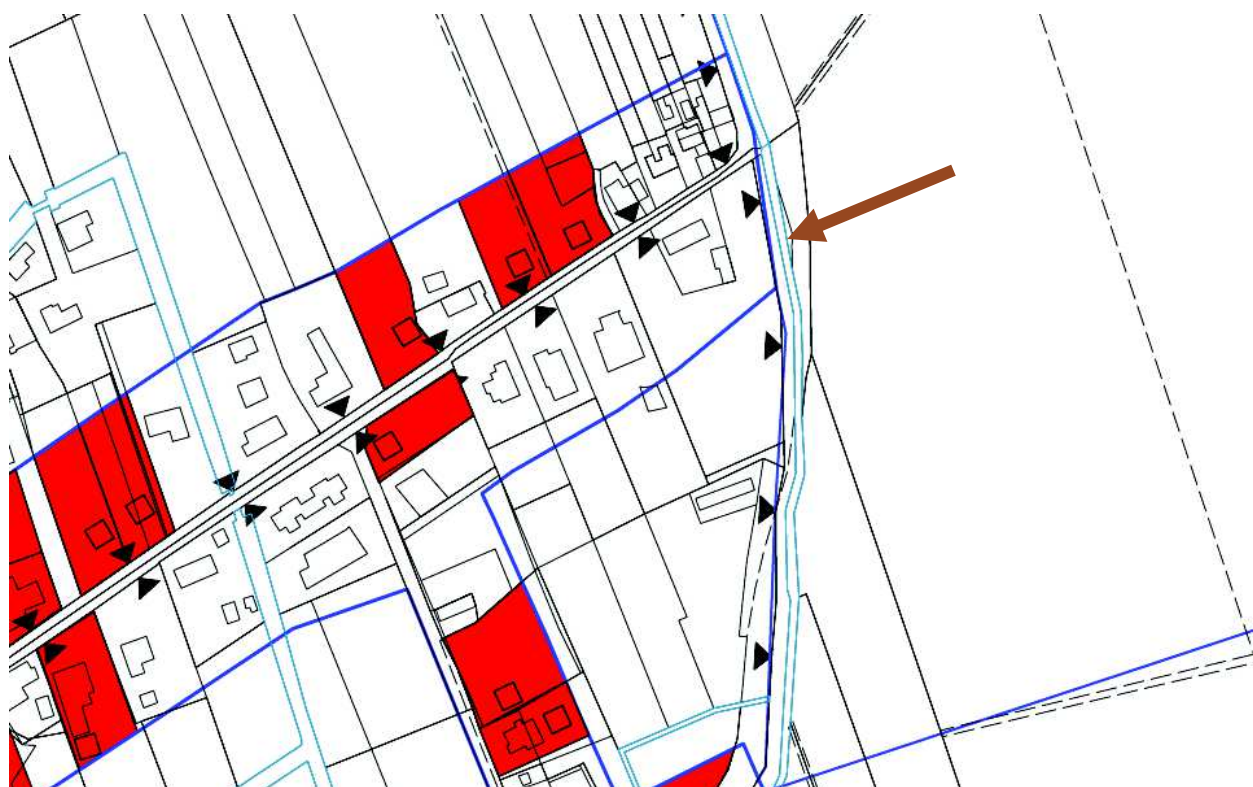
4. Individuazione su PRG tav.13 Zone significative.