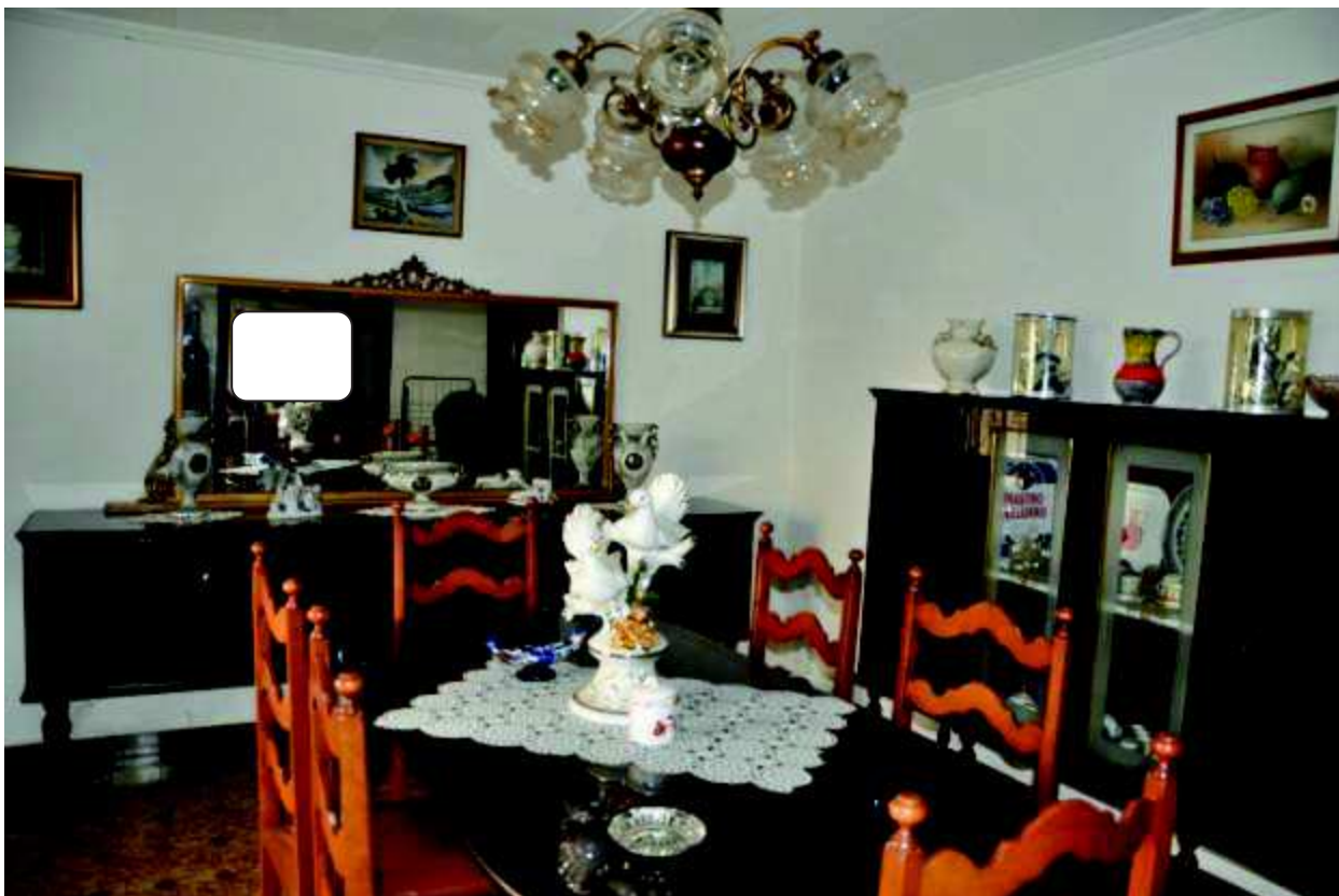
7 Zona salotto.