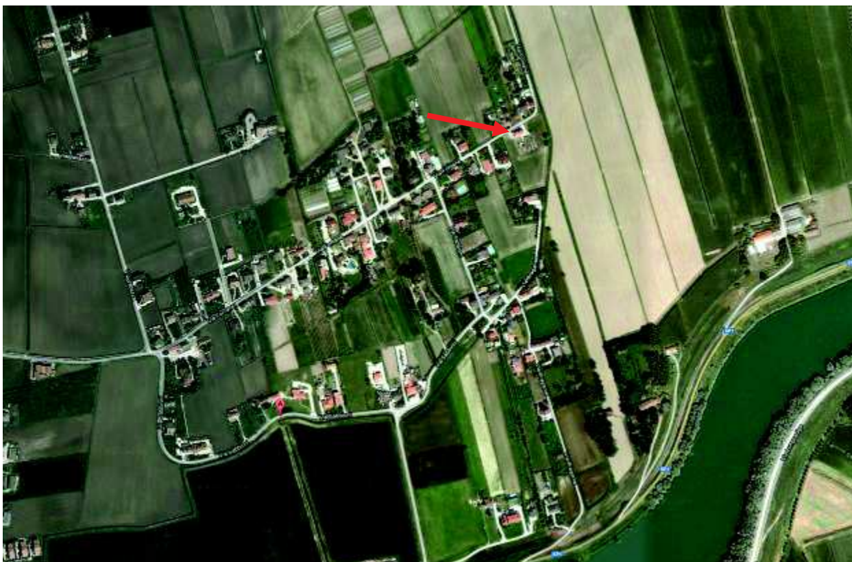
1. Individuazione dell'immobile sul territorio.