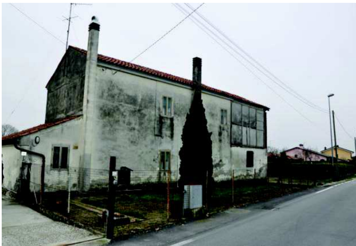
6. Vista dell'immobile lato Nord (Via Bragante).