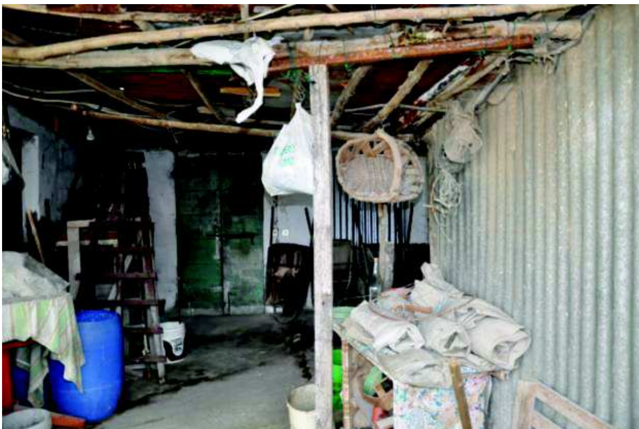
17 Porzione di interno del fabbricato.