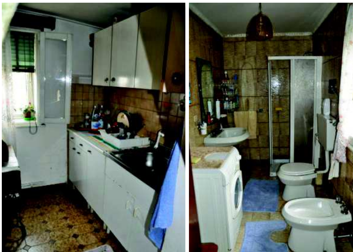
6. Cucina e bagno.