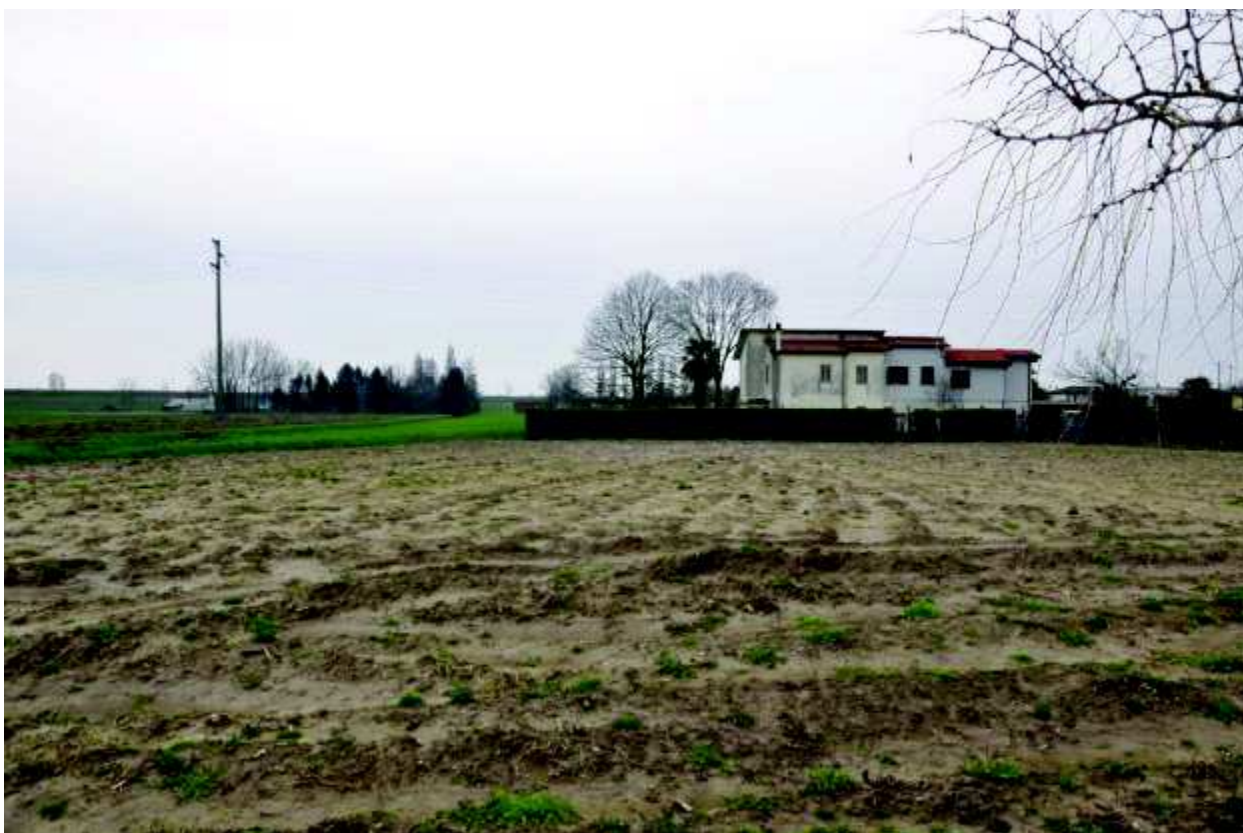
20. Porzione di terreno agricolo (mappale 426).