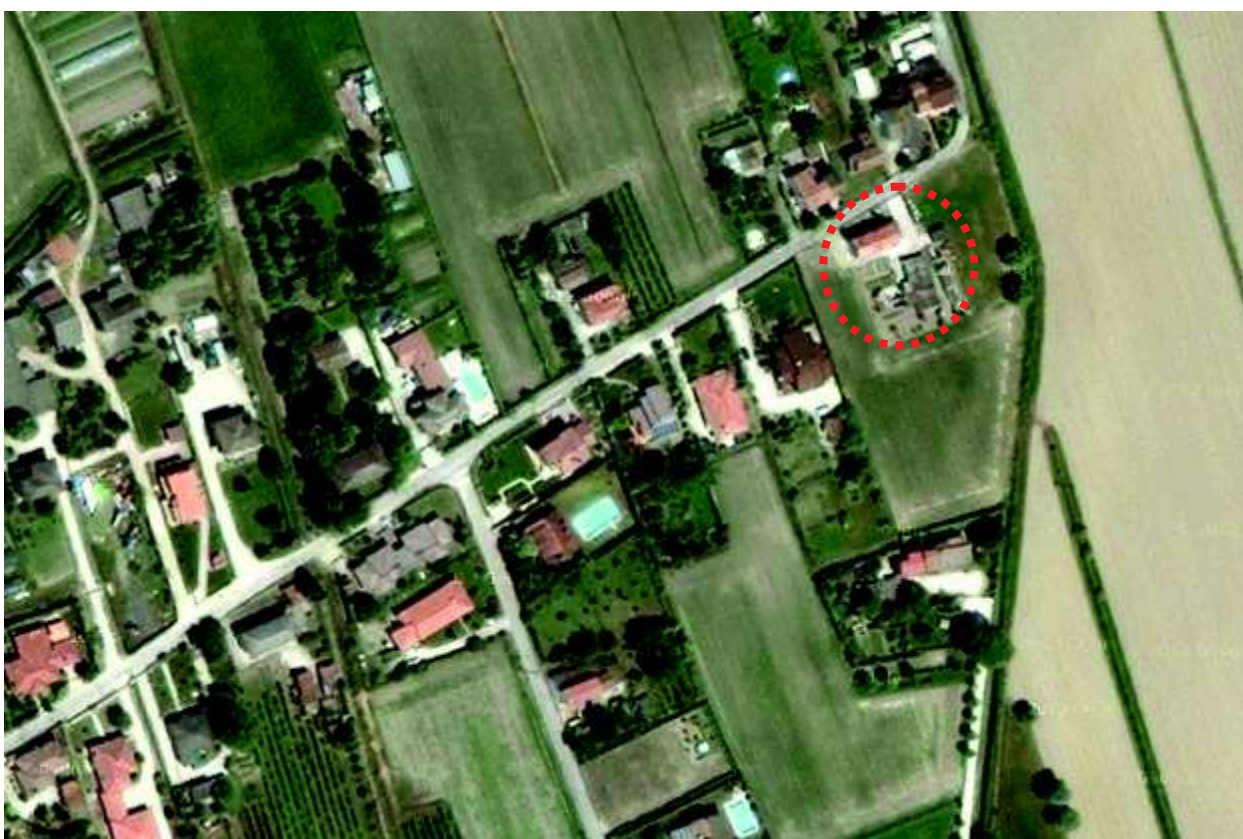
2. Immobile che comprende l'abitazione pignorata.