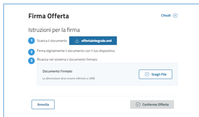
Figura 22 – Firma Offerta

Scaricato il documento e firmato digitalmente, è necessario allegare il documento firmato.