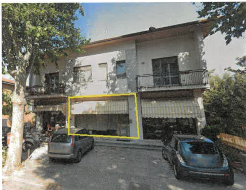
Foto n° 2 – individuazione negozio al piano terra sub 7 di Viale Italia 44