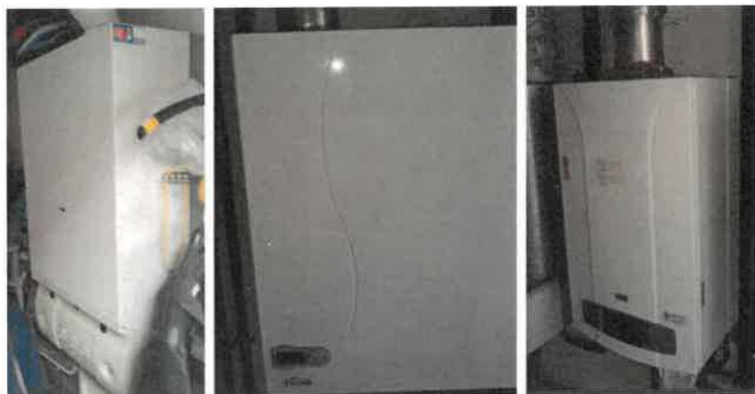
Foto n° 26 – – caldaie appartamenti appartamento. sub 10 , 11, 13