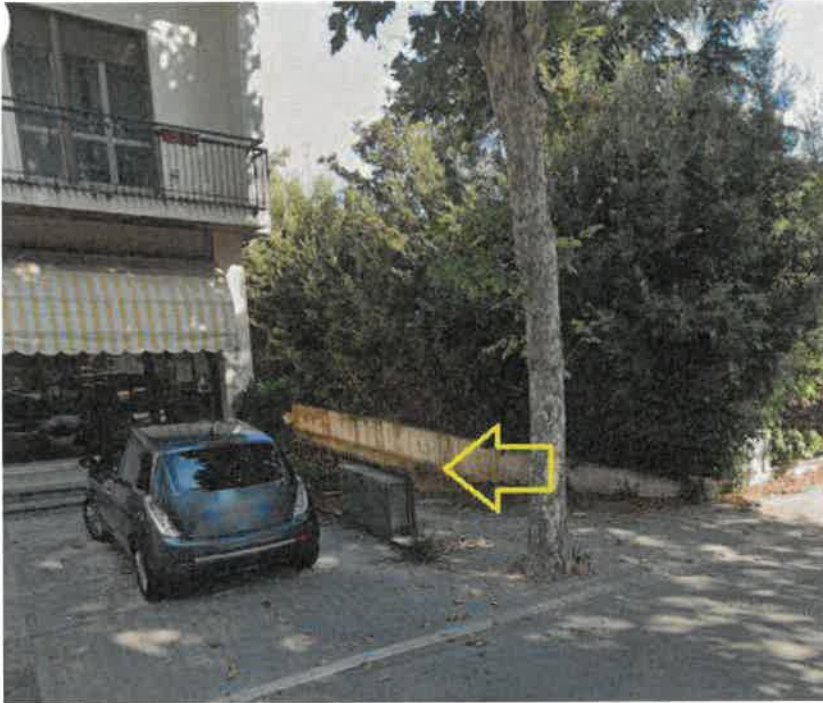
Foto n° 3 – rampa di accesso all'autorimessa (sub 15 e 16) da Viale Italia