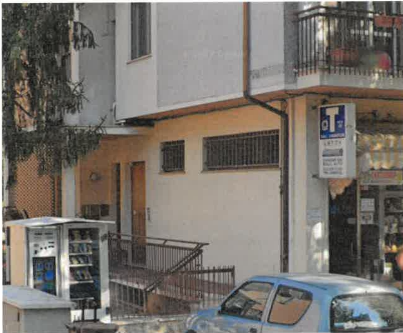
Foto n° 4 – ingresso per accesso agli appartamenti (sub 10, 11 e 13)