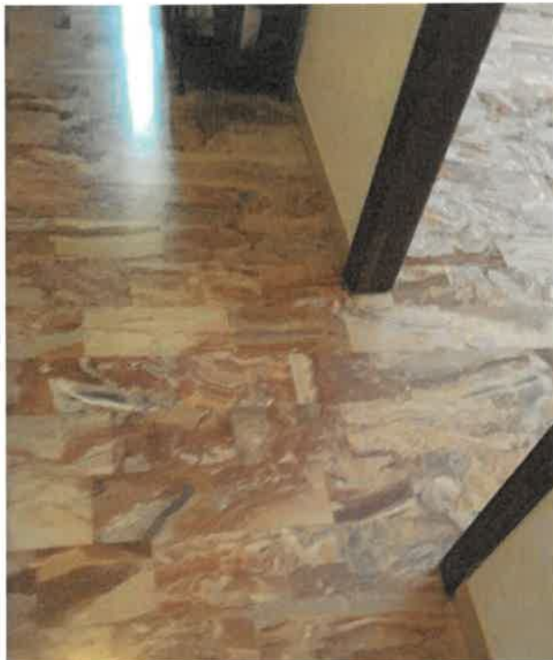
Foto n° 12 – particolare pavimento disimpegno e soggiorno appartamento sub. 10