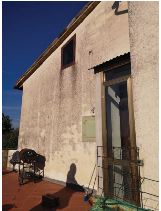
Abitazione Piano terra (part. 27 sub. 2)