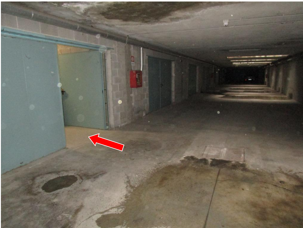
Foto 5 – Vista e indicazione, dal corsello comune di manovra, dell'ingresso al deposito