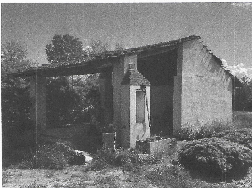
Vista della tettoia dal cortile