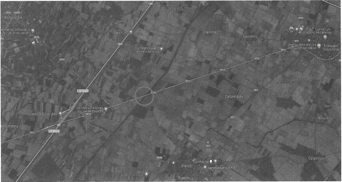
Inquadramento della proprietà