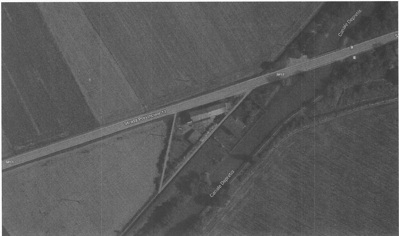
Localizzazione della proprietà

Il Lotto Unico è situato in Bianzè, localizzato in Cascina Ponte Reale 64.