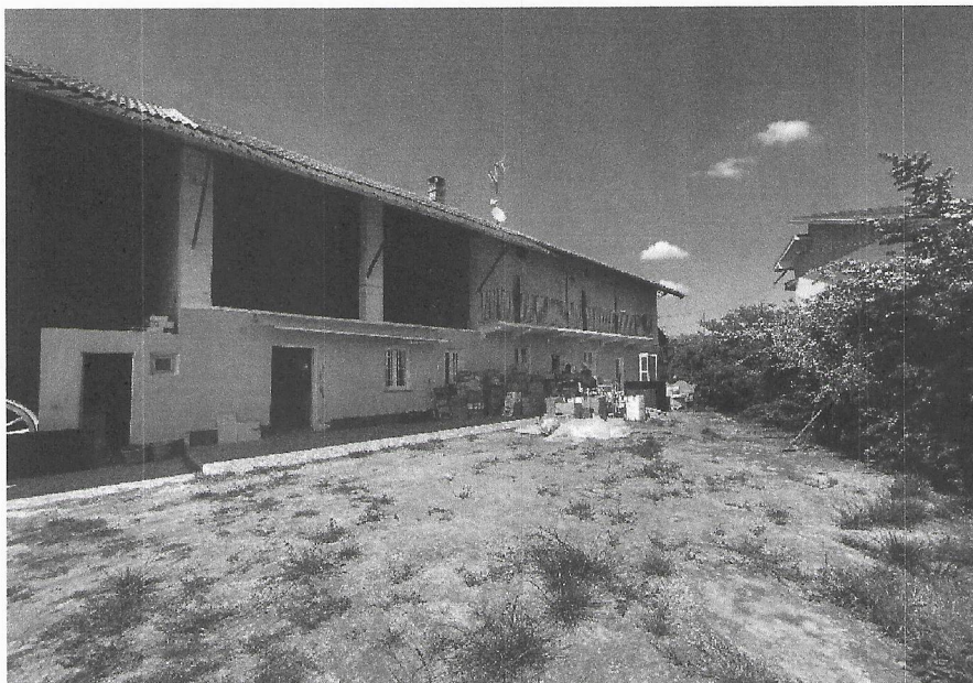
Vista dell'abitazione dal cortile

In tale data si è potuto accedere ai beni oggetto di esecuzione che si sono rivelati liberi dai beni dall'esecutato e in stato di abbandono.