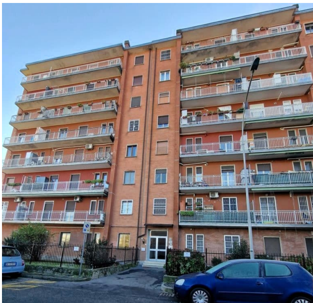
Figura 1 - prospetto