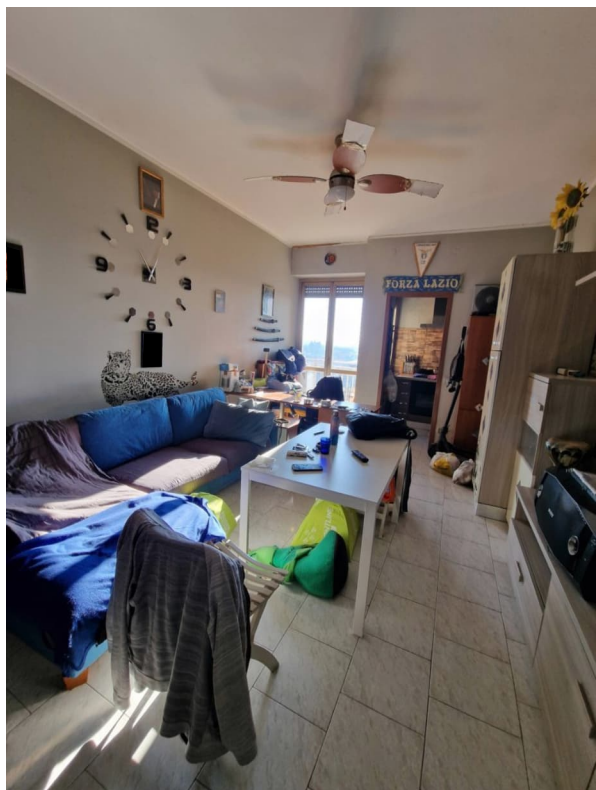
Figura 2 - soggiorno