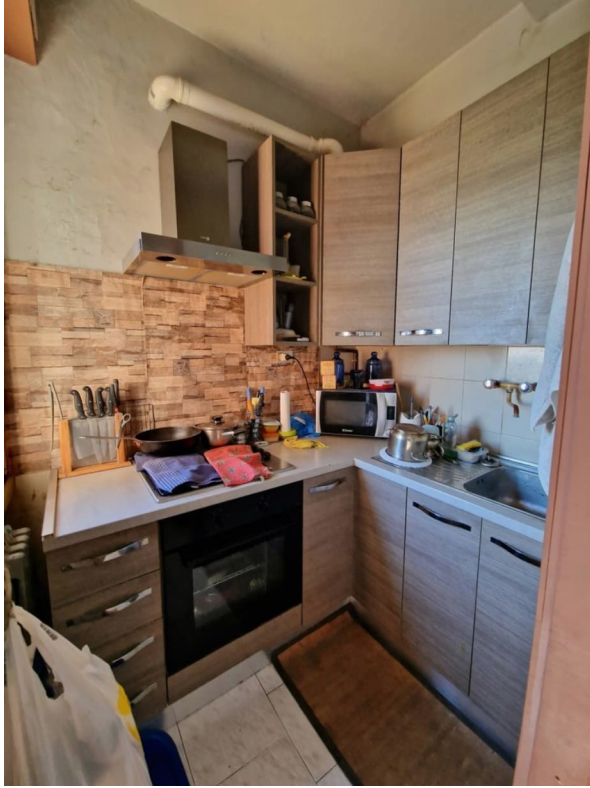
Figura 3 - zona cottura

cell. 338 7009009 - e-mail: crocesilvia.sc@gmail.com