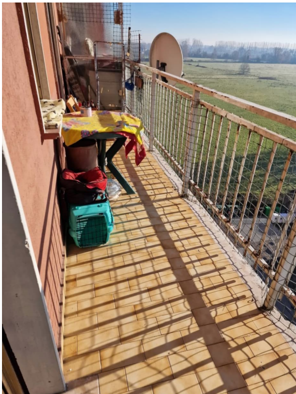
Figura 4 - balcone