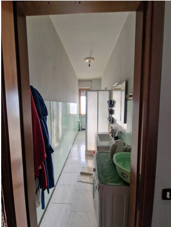
Figura 6 - bagno