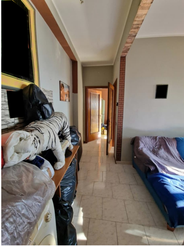
Figura 5 - disimpegno

cell. 338 7009009 - e-mail: crocesilvia.sc@gmail.com