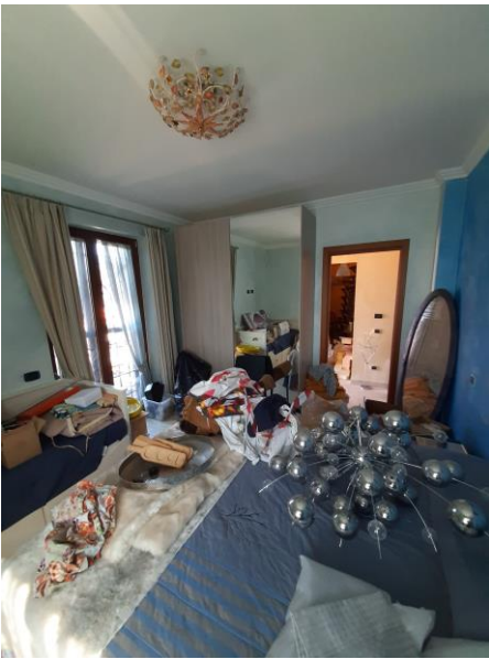
Camera piano terra