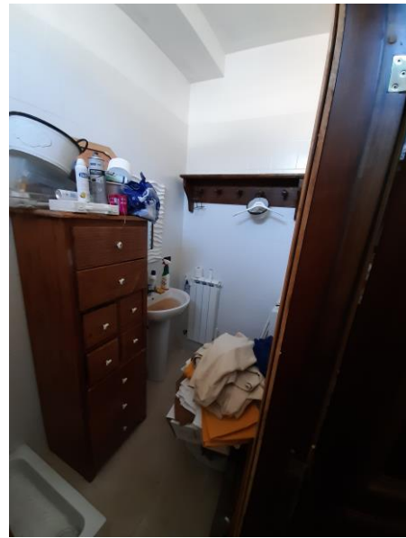
Bagno piano seminterrato