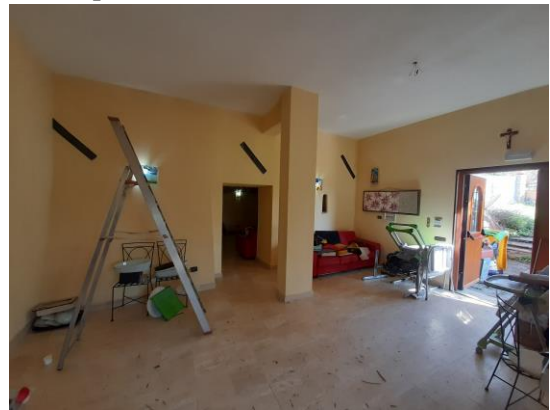
interni piano seminterrato