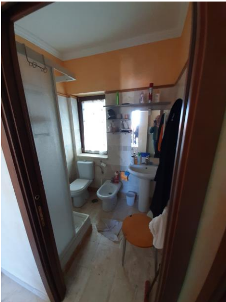
Bagno piano terra