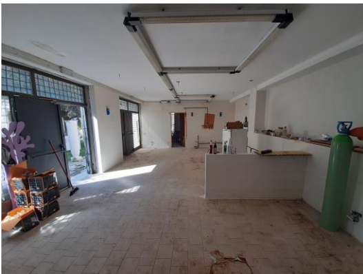
Autorimessa piano seminterrato