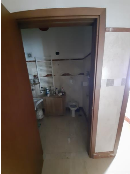
Bagno piano seminterrato