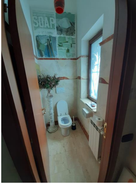
Bagni piano seminterrato