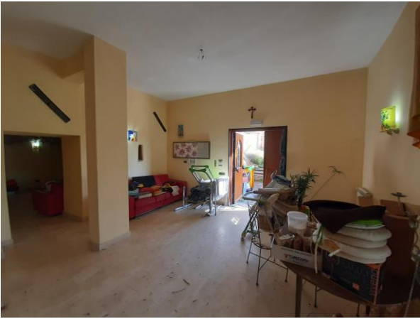
Interni piano seminterrato