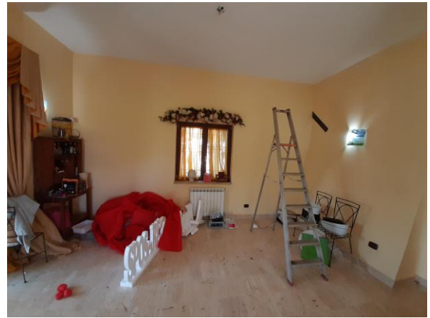
Interni piano seminterrato