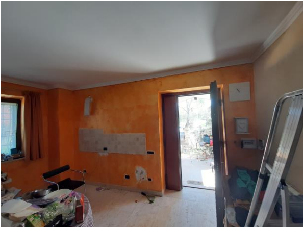
Interni piano terra