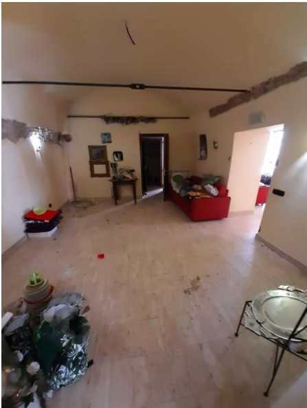
interni piano seminterrato