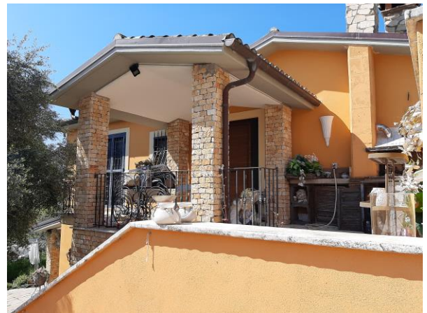
portico piano primo