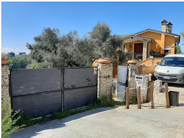
Loc. Corese Terra, Loc. Fonte Vecchia civ. 19-21