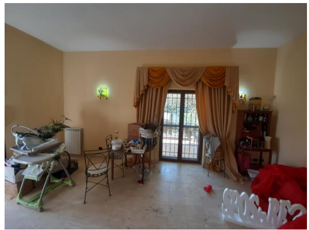
interni piano seminterrato