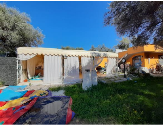
Pergotenda ed altre strutture removibili