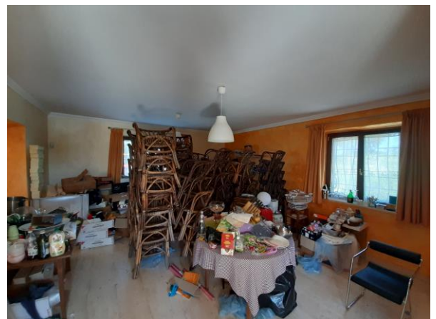
Interni piano terra