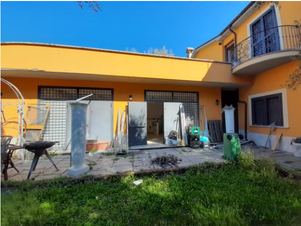
Accesso alla autorimessa