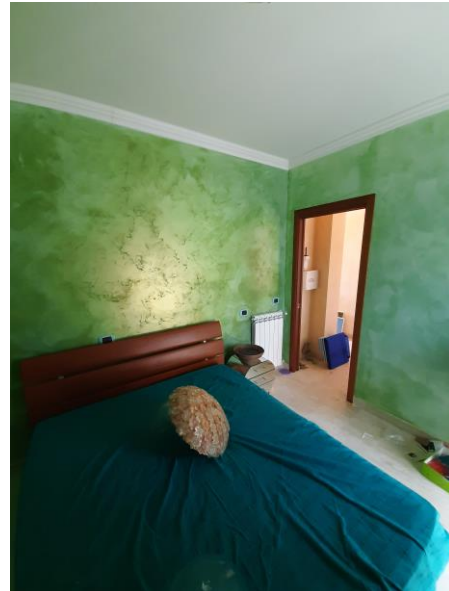
Camera piano terra