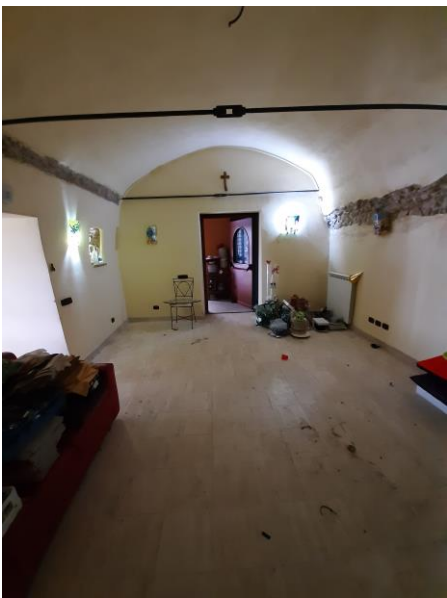
interni piano seminterrato