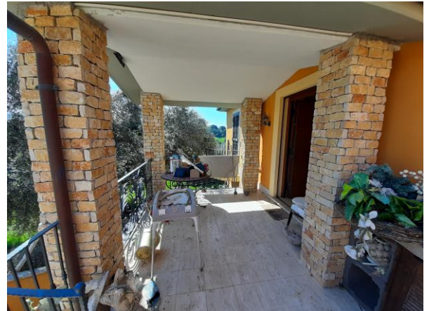
Portico piano primo