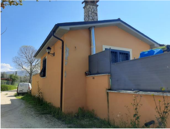
Lato strada Fonte Vecchia