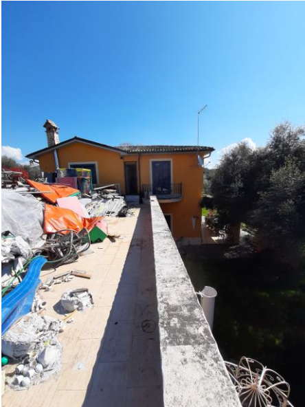
Vista dal lastrico solare