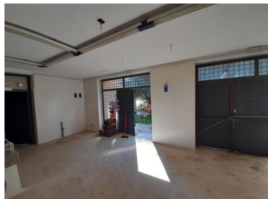
Autorimessa piano seminterrato