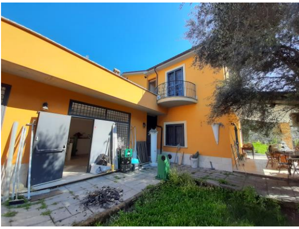
Ingresso autorimessa- abitazione