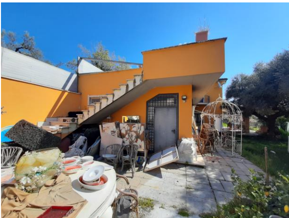
Lastrico solare a copertura autorimesse