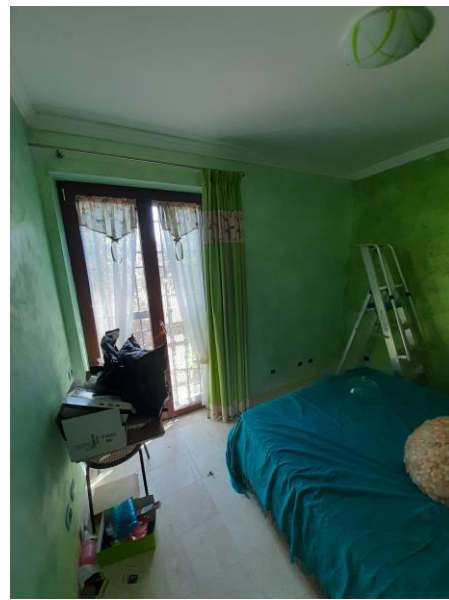
Camera piano terra