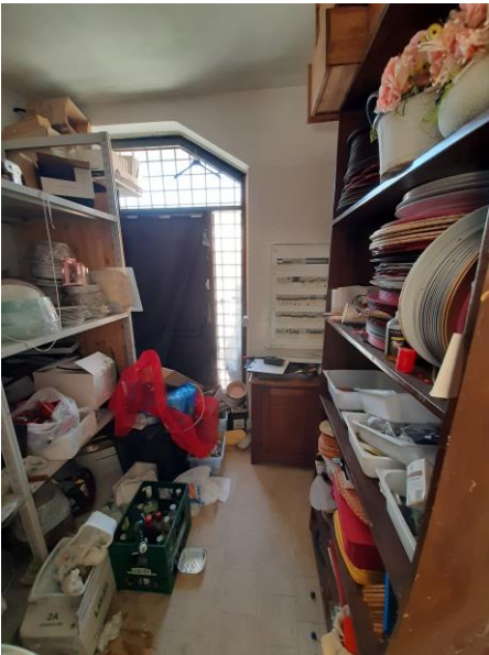
Ripostiglio piano seminterrato