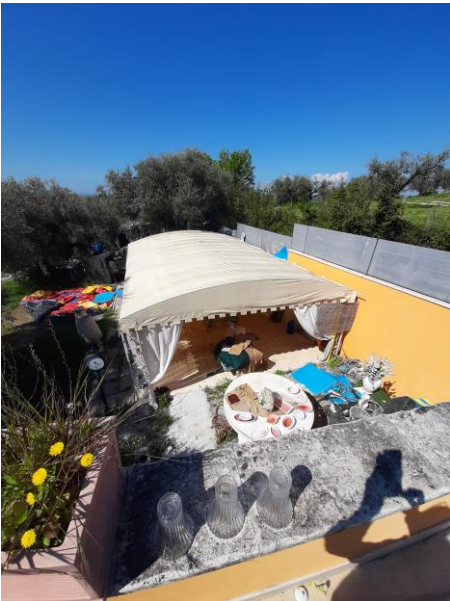
Pergotenda ed altre strutture removibili