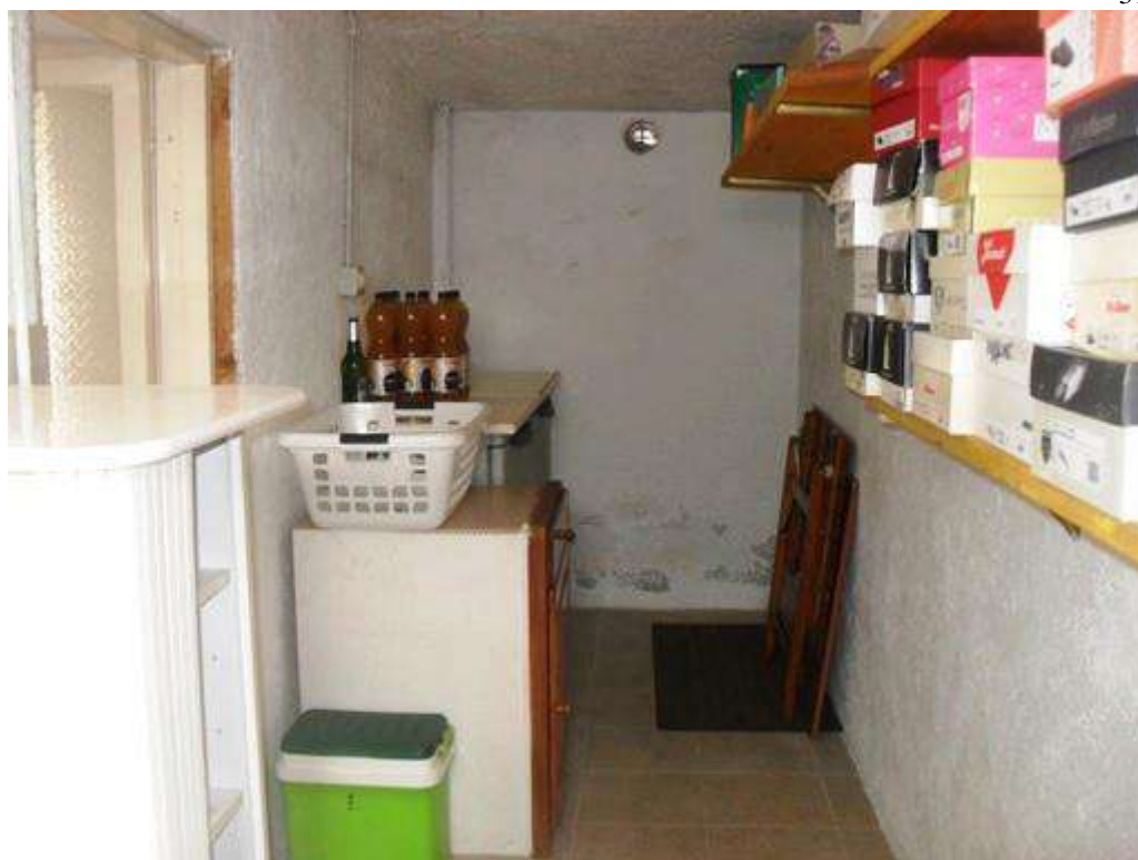
lotto n. 2