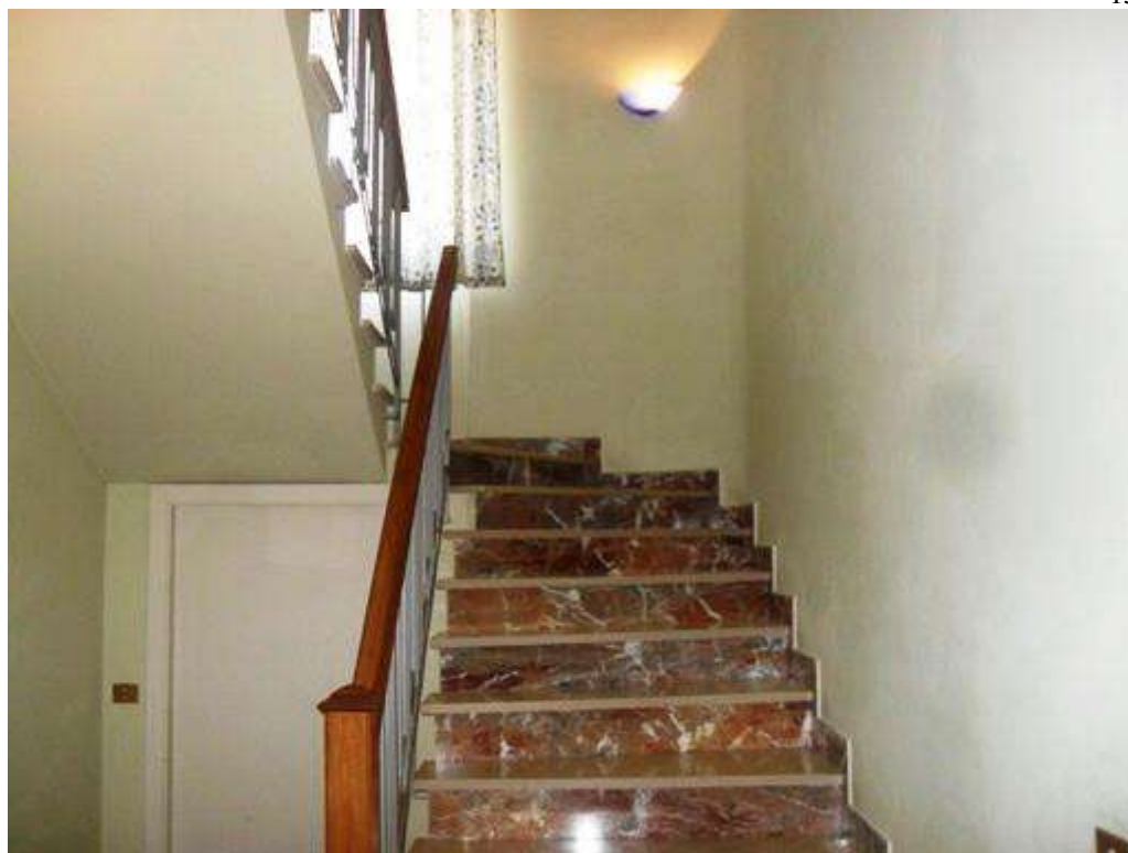
lotto n. 1