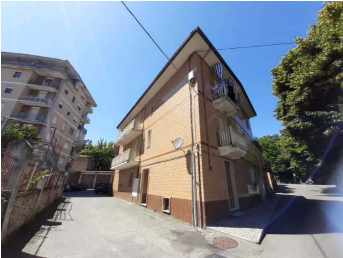
Vista dal sedime stradale di Via Vittorio Veneto, del fabbricato condominiale comprendente la U.I.U. oggetto di valutazione