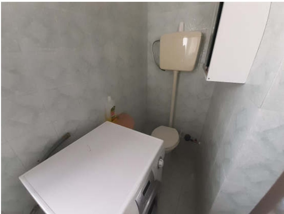
Vista interna alla U.I.U. del locale bagno