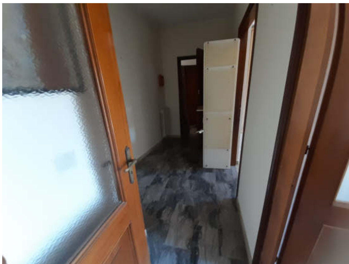
Vista interna alla U.I.U. della zona ingresso / disimpego