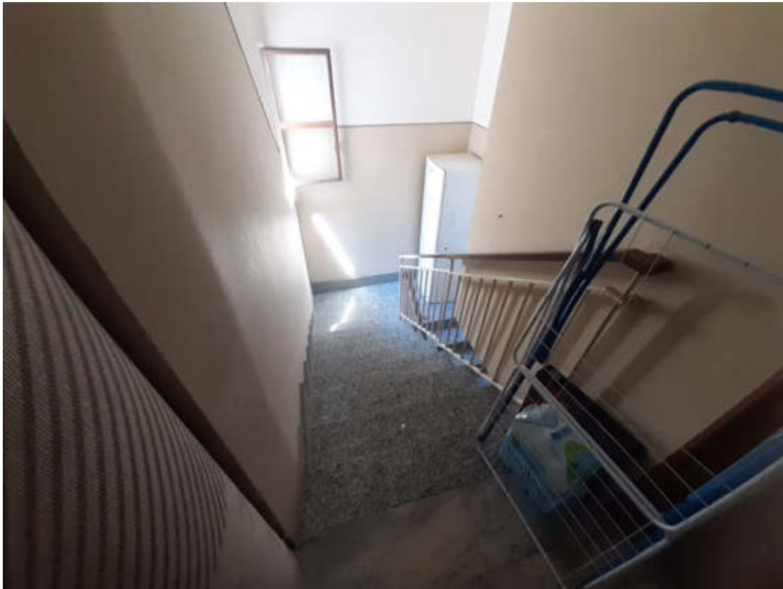
Vista interna del vano scala condominiale