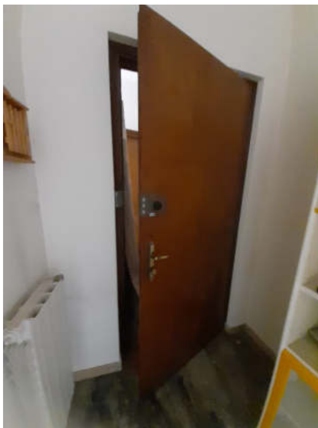
Vista dal ballatoio condominiale in piano secondo del portoncino caposcala di accesso alla U.I.U. oggetto di valutazione