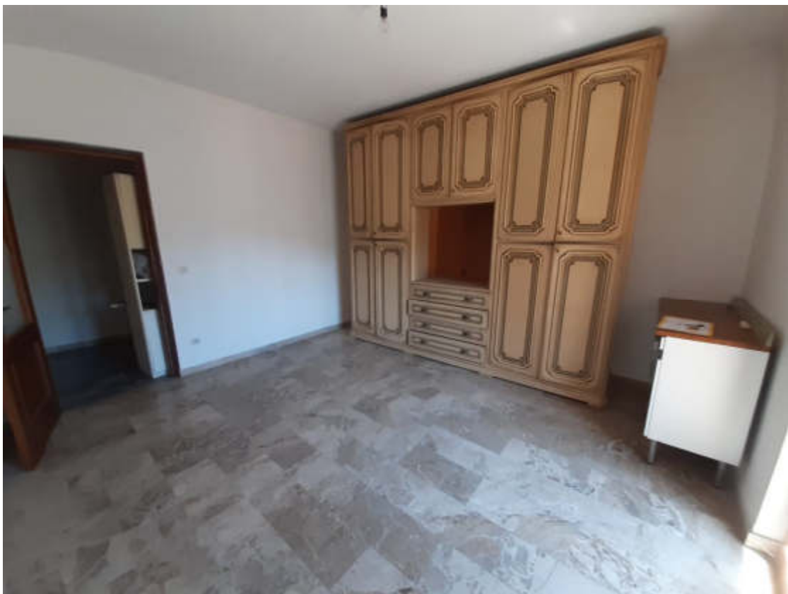
Vista interna alla U.I.u. del locale camera letto