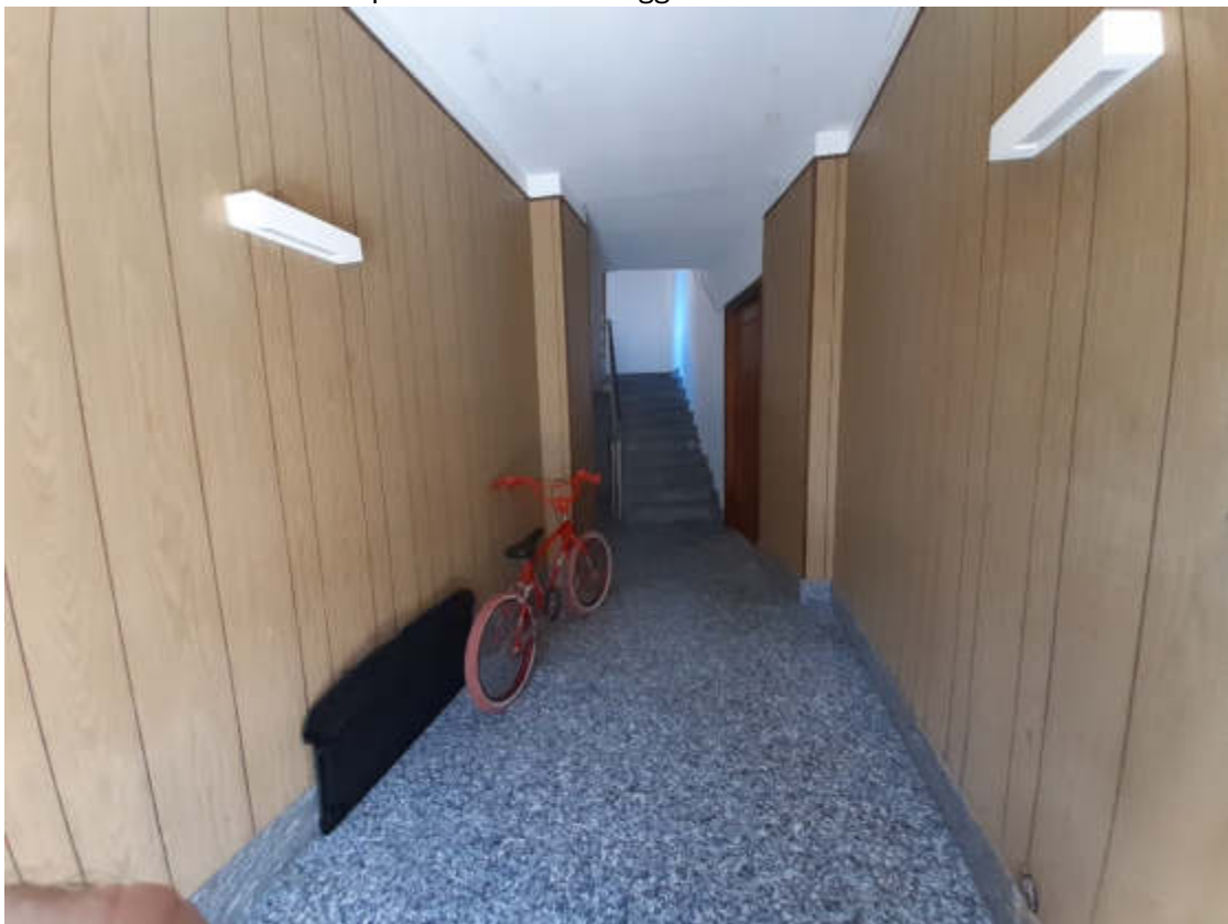
Vista interna quota piano terra dell'androne comune di accesso al vano scala condominiale