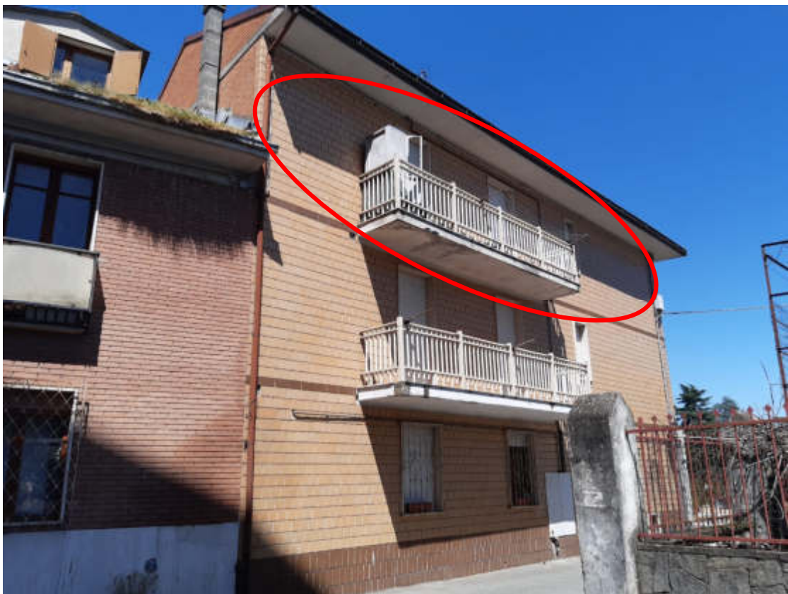
Vista dal sedime stradale di Via Vittorio Veneto, del fabbricato condominiale comprendente la U.I.U. oggetto di valutazione