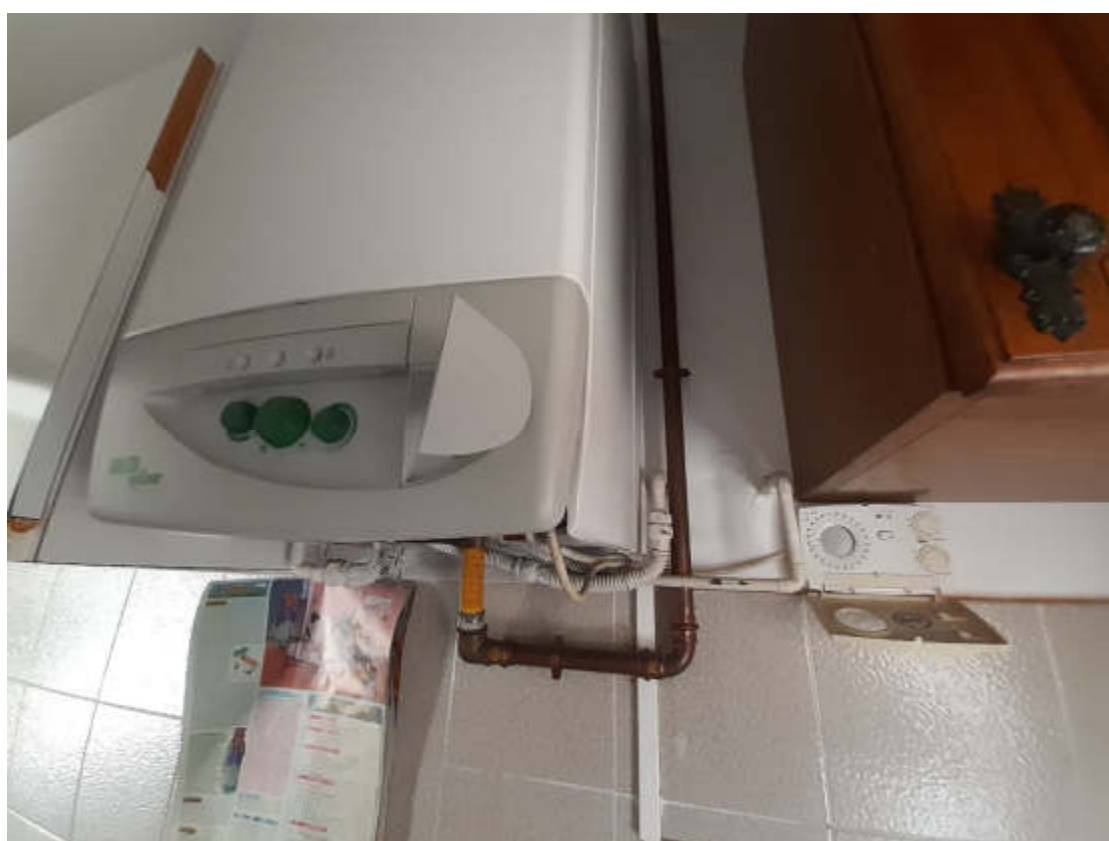
Vista particolare caldaia impianto riscaldamento a servizio della U.I.U.