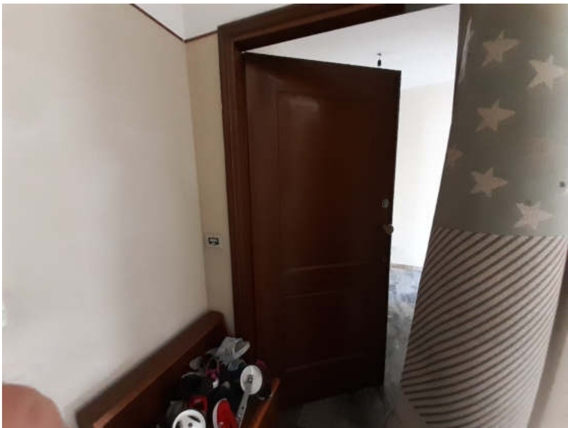
Vista dal ballatoio condominiale in piano secondo del portoncino caposcala di accesso alla U.I.U. oggetto di valutazione