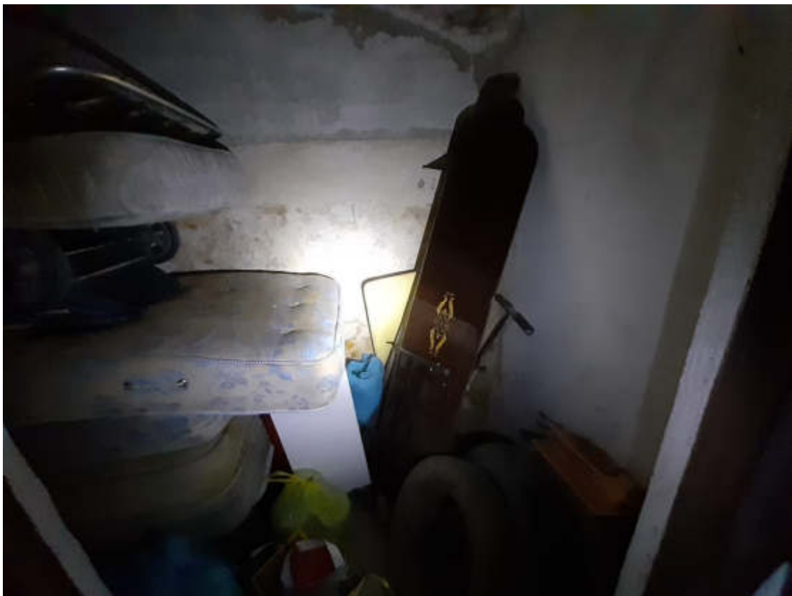
Vista interna del locale cantina pertinenziale alla U.I.U. abitativa