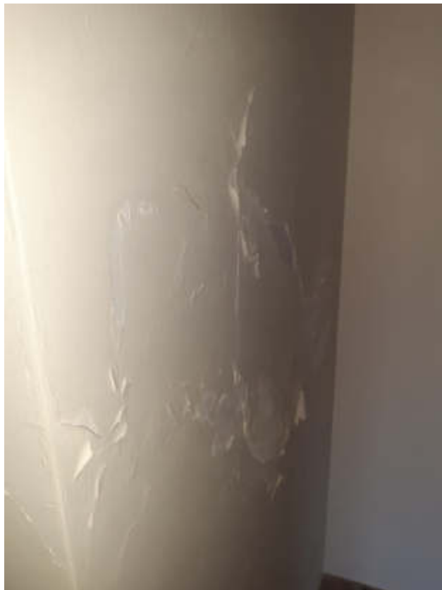
Vista particolare degli ammaloramenti accertati sulle superfici interne della U.I.U.