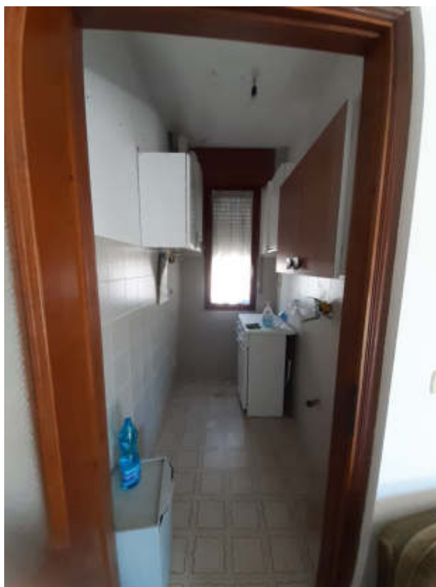
Vista interna alla U.I.U. del locale cucinino