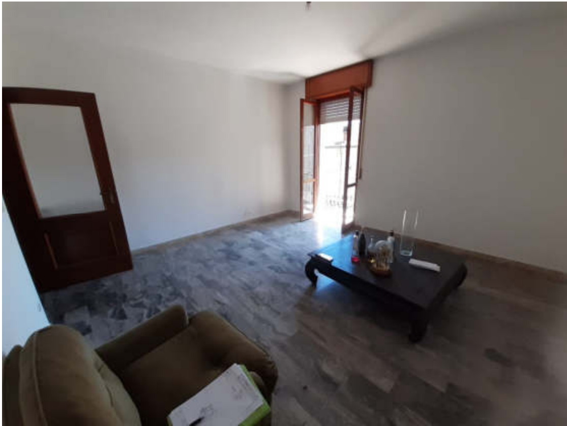
Vista interna alla U.i.U. del locale soggiorno