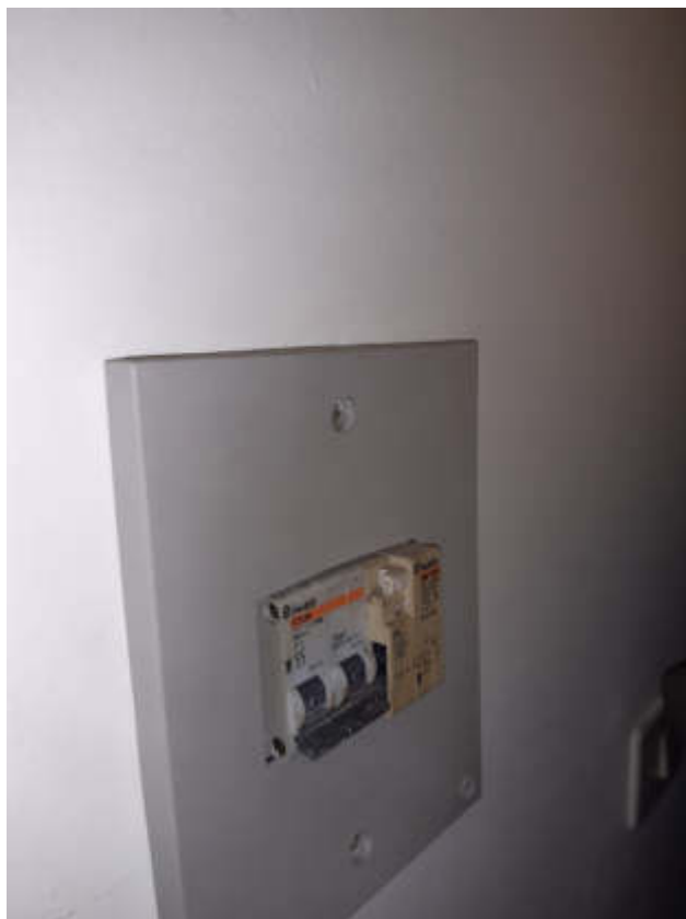
Vista particolare quadrone generale di utenza e contatore a servizio della U.I.U.