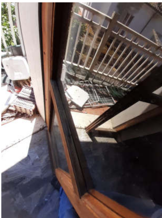
Vista particolare tipologia serramenti interni ed esterni a servizio dei vani costituenti la U.I.U.