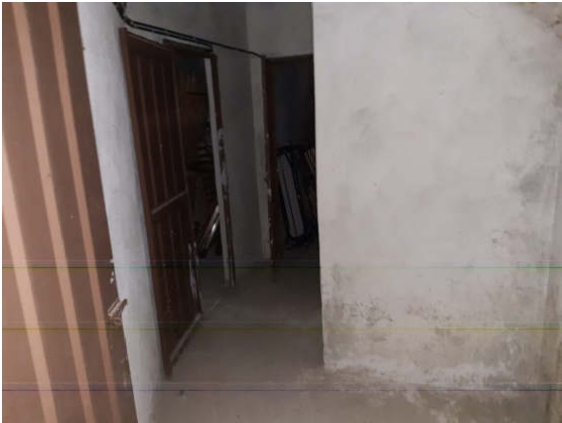
Vista interna del vano scala condominiale di accesso al piano interrato