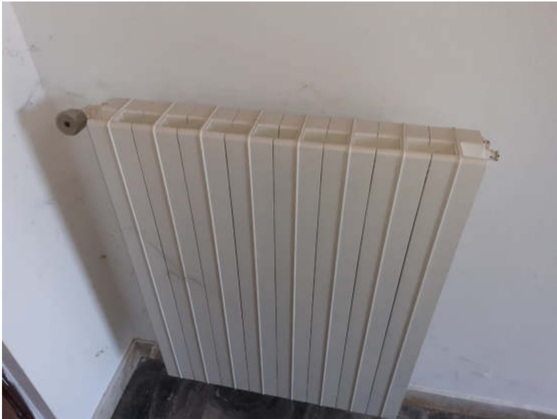
Vista particolare tipologia batterie radiatori a servizio dei locali costituenti la U.I.U.