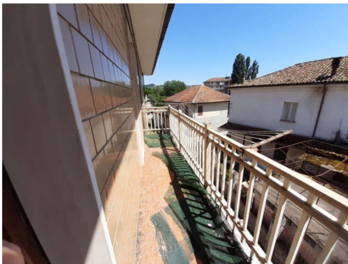
Vista esterna del balcone pertienziale alla U.I.U.