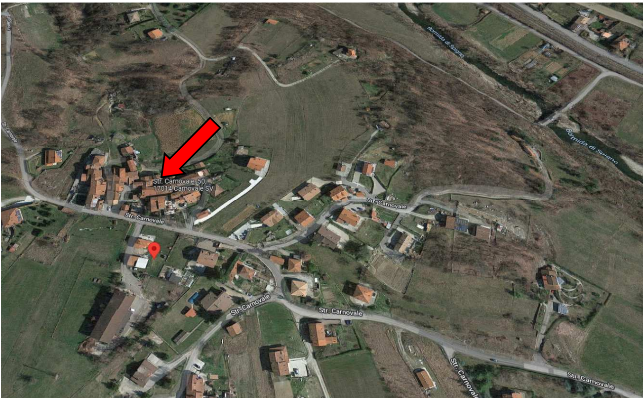
Foto 1 – Vista satellitare Google Maps Cairo M.tte, Strada Carnovale civ. 50, con ubicazione dell'immobile