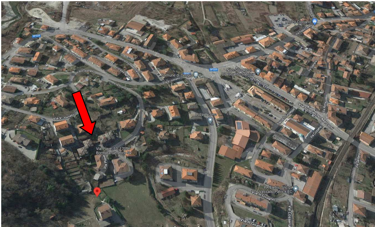
Foto 35 – Vista satellitare Google Maps di Cengio, Via Piave civ. 10, con ubicazione dell'immobile