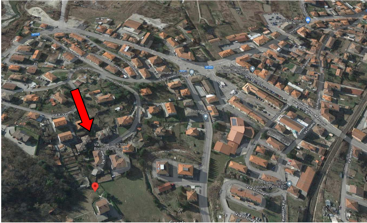
Foto 22 – Vista satellitare Google Maps di Cengio, Via Piave civ. 10, con ubicazione dell'immobile