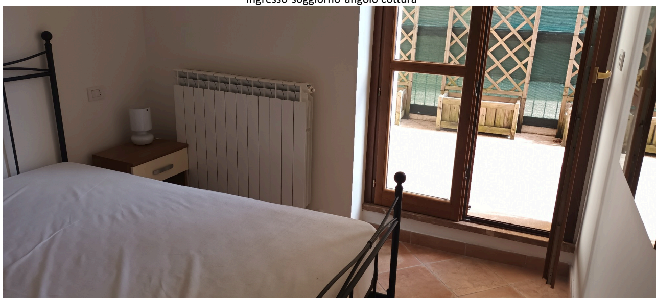
Camera e terrazzo