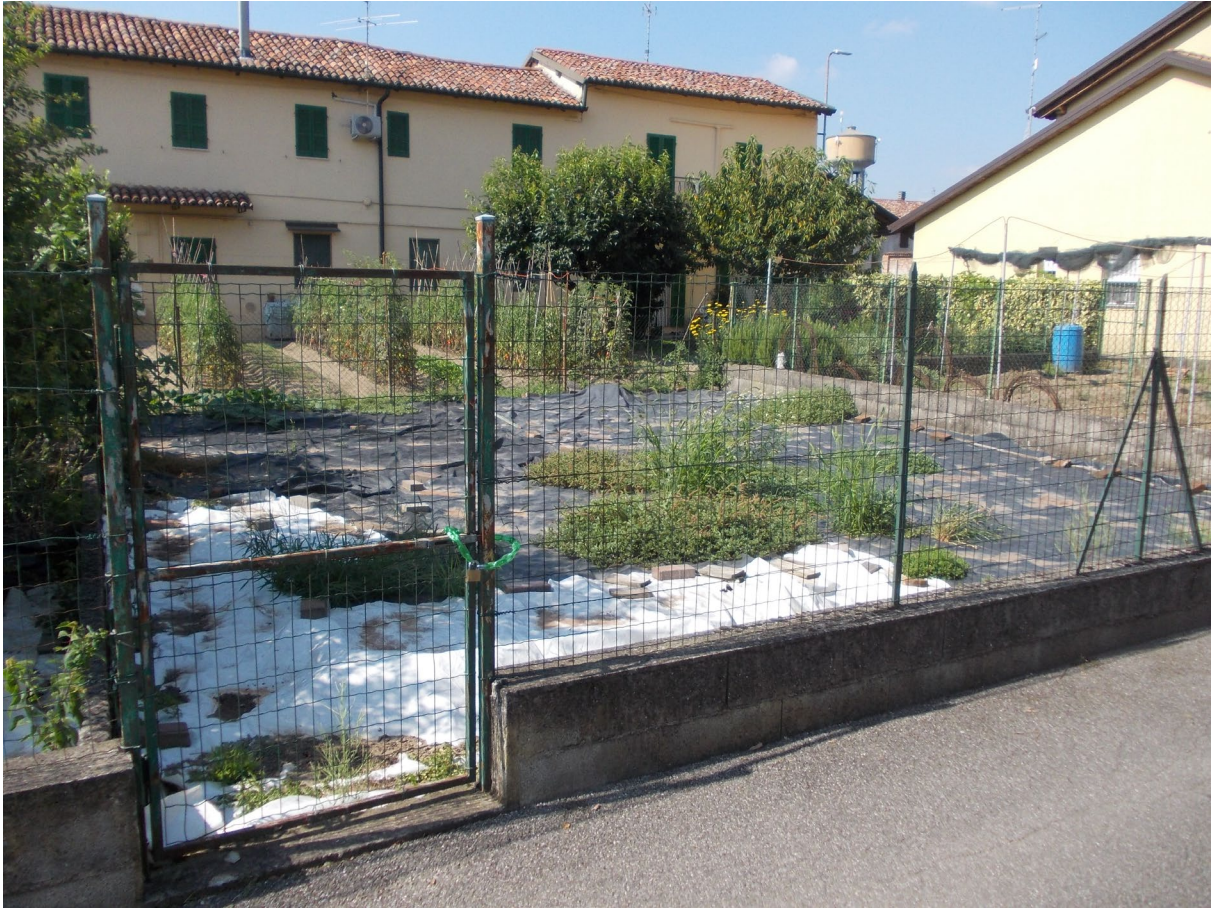
AREA DI PERTINENZA (MAPP. 398)