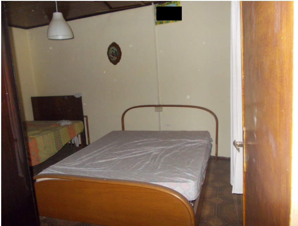
LOCALE CAMERA LATO OVEST