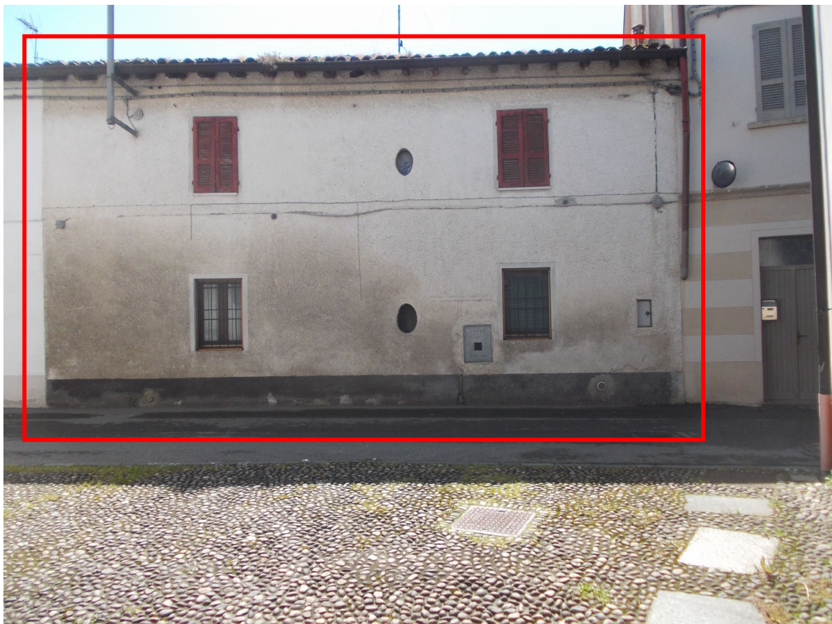
ALLOGGIO FRONTE NORD DA VIA RIPAFREDDA