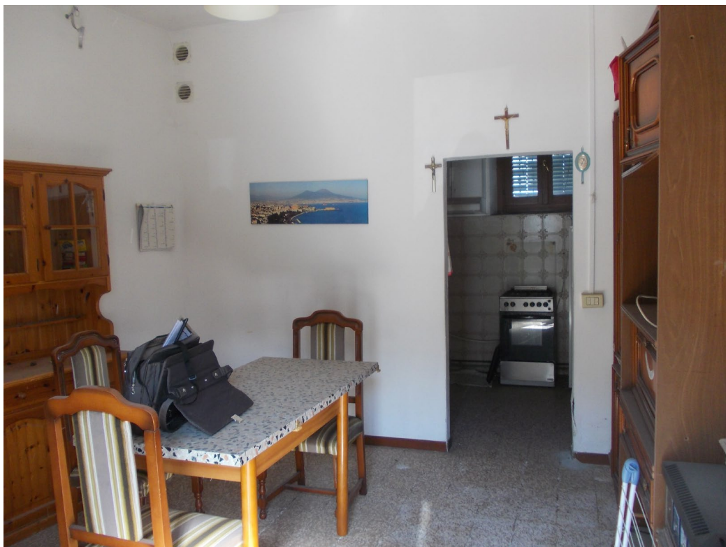
LOCALE DESTINATO A SOGGIORNO LATO OVEST