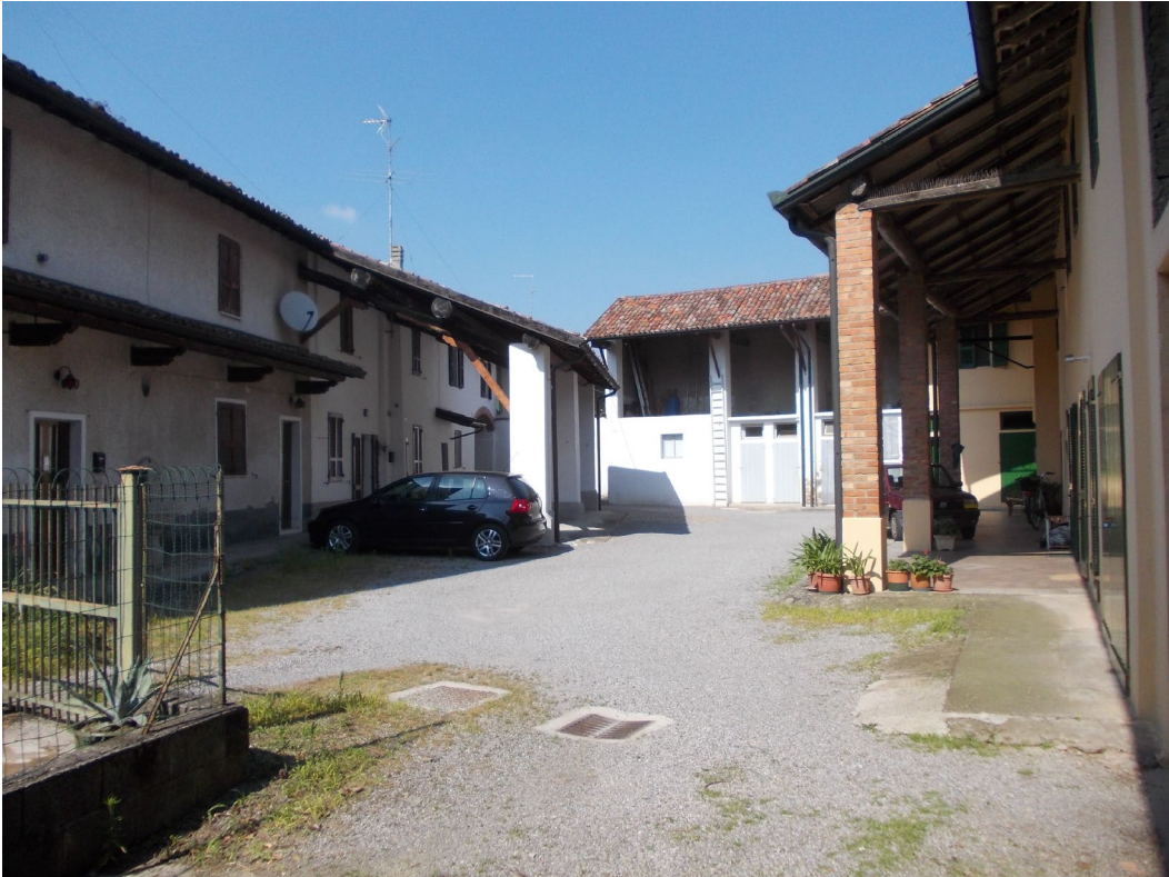
AREA CORTILIZA COMUNE