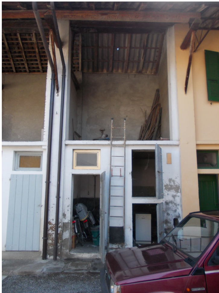
ACCESSORI RUSTICI (MAPP. 205) DAL CORTILE