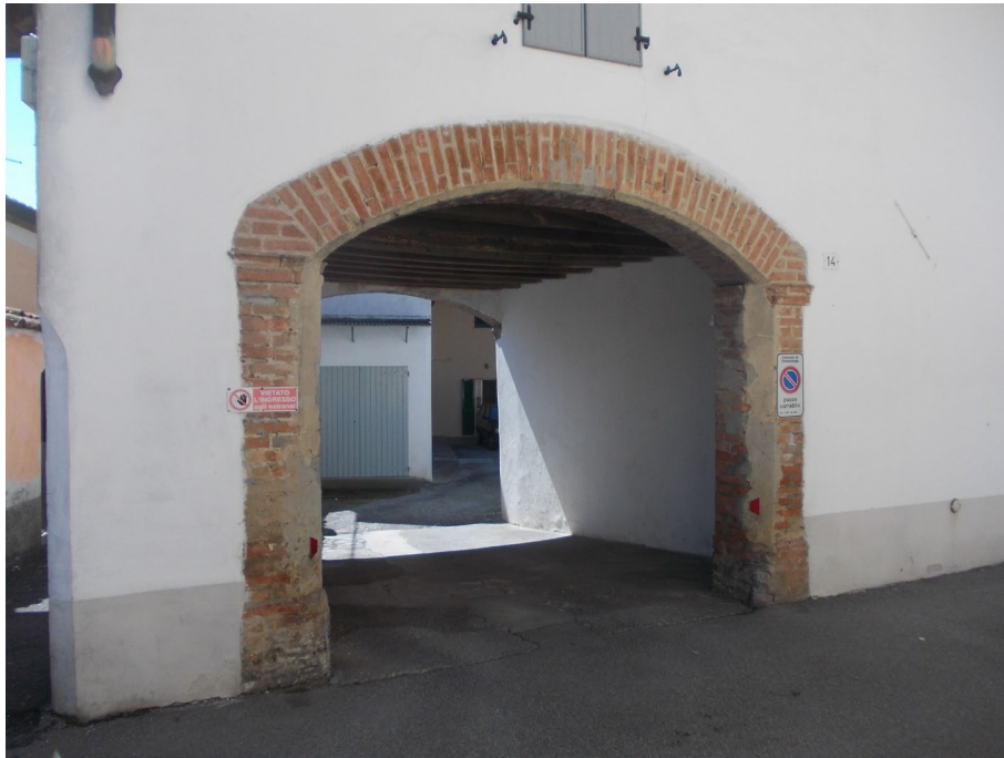
ACCESSO LATO NORD AREA CORTILIZA COMUNE