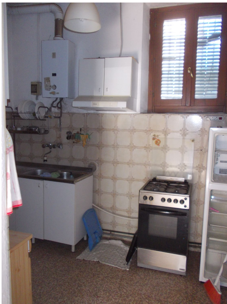
LOCALE DESTINATO A CUCINA LATO OVEST