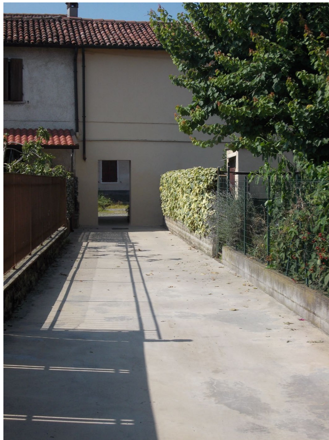
ACCESSO LATO SUD AREA CORTILIZA COMUNE