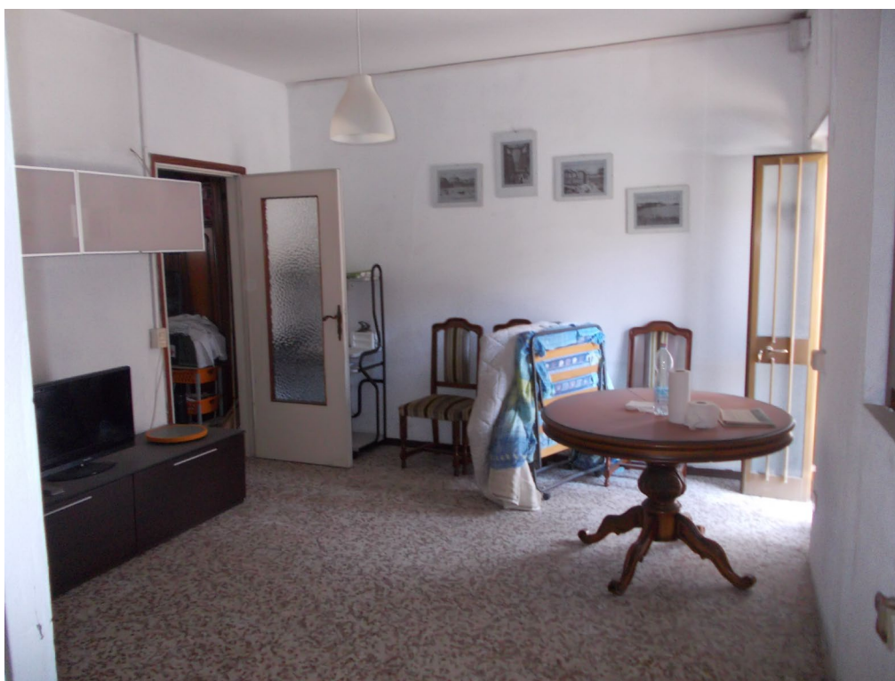
LOCALE DESTINATO A SOGGIORNO LATO EST