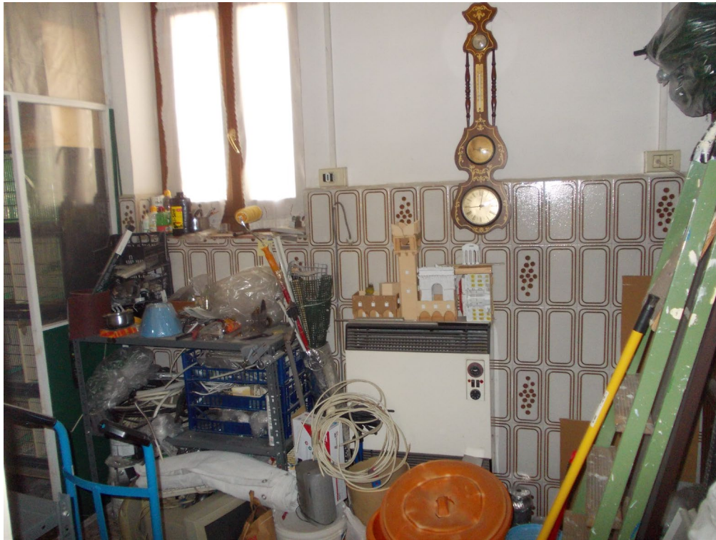
LOCALE DESTINATO A CUCINA LATO EST