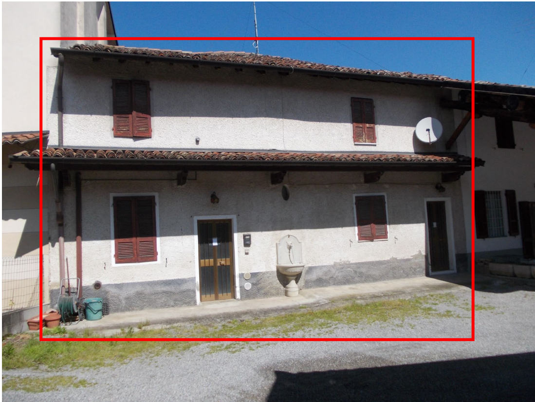
ALLOGGIO FRONTE SUD DA AREA COMUNE