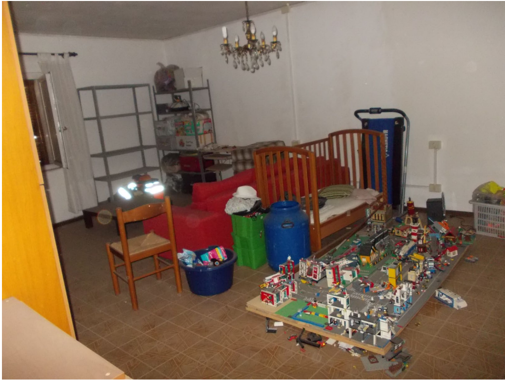
LOCALE CAMERA LATO EST