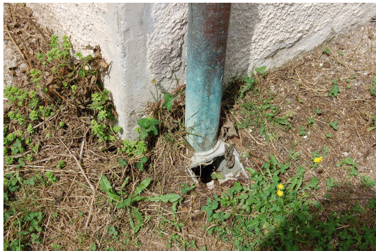
FOTO 1 – POZZETTI PLUVIALI MANCANTI E PLUVIALI VETUSTI E CON FESSURAZIONI