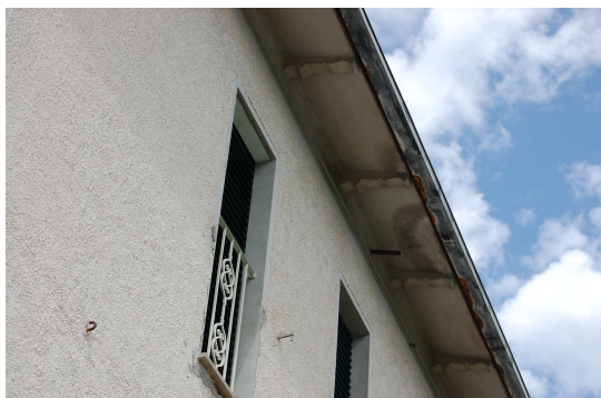
FOTO 7 – CORNICE CON PRESENZA DI UMIDITA' PER INFILTRAZIONI DI ACQUE METEORICHE