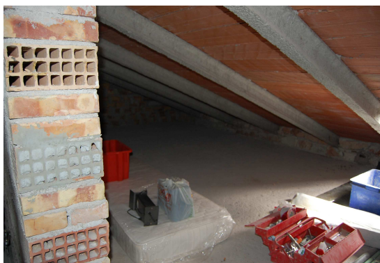
FOTO 12 – PRESENZA DI BACINELLE PER RACCOLTA ACQUE METEORICHE CAUSA INFILTRAZIONI DALLA COPERTURA PER MANCANZA DI IMPERMEABILIZZAZIONE