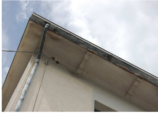
FOTO 8 – CORNICIONE CON PRESENZA DI UMIDITA' PER INFILTRAZIONI DI ACQUE METEORICHE E GRONDAIE IN PESSIMO STATO