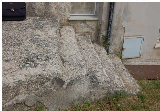
FOTO 11 – GRADINI SCALA GIARDINO IN PESSIMO STATO CON PERICOLO PER COLORO CHE LI UTILIZZANO