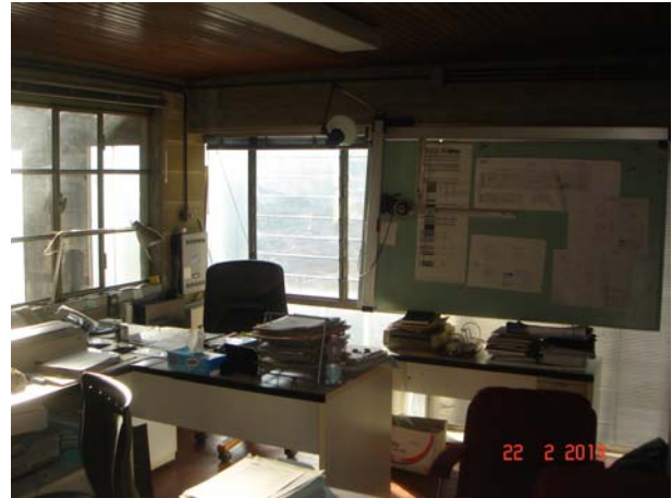
INTERNI DEL CAPANNONE AL PIANO SECONDO : UFFICIO