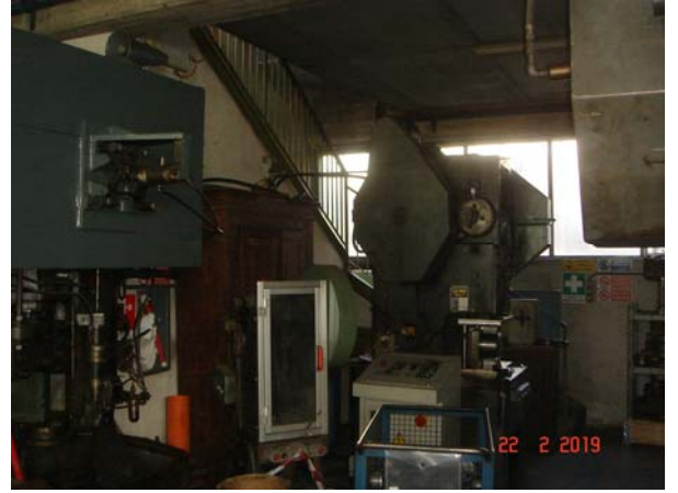
INTERNI DEL CAPANNONE AL PIANO PRIMO