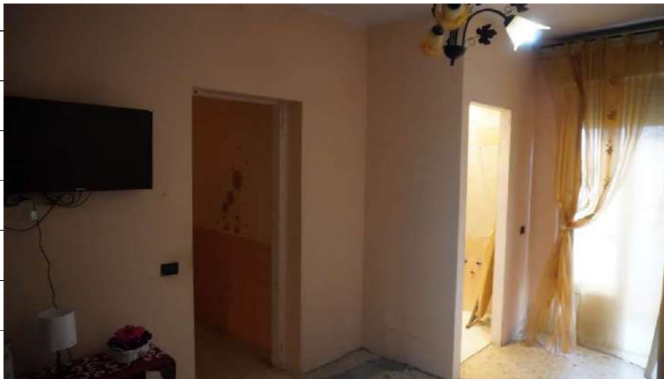
Foto n.24: immagine interna della camera 2 ubicata al piano primo relativa all'immobile sito in via Giovanni Bovio n.14 ronco I a Carlentini.