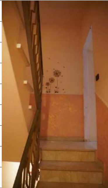
Foto n.21: immagine interna del vano scala di collegamento tra i piani terra e primo relativo all'immobile sito in via Giovanni Bovio n.14 ronco I a Carlentini.