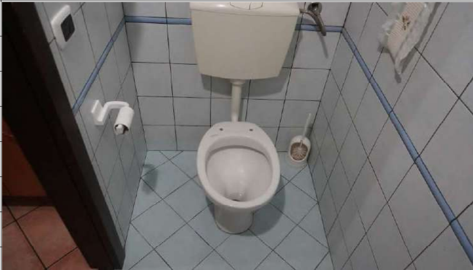
Foto n.11: immagine interna del bagno 1 ubicato al piano terra dell'immobile sito in via Giovanni Bovio n.5 ronco II a Carlentini.