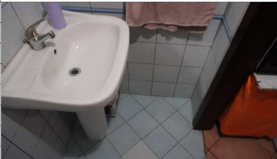
Foto n.12: immagine interna del bagno 1 ubicato al piano terra dell'immobile sito in via Giovanni Bovio n.5 ronco II a Carlentini.