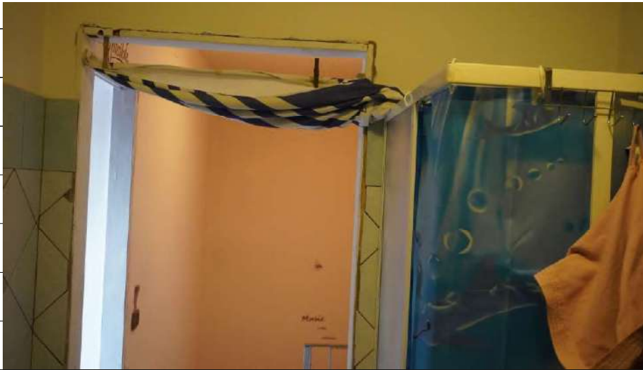
Foto n.34: immagine interna del bagno 4 ubicato al piano secondo relativo all'immobile sito in via Giovanni Bovio n.14 ronco I a Carlentini.