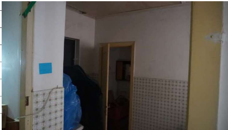
Foto n.16: immagine interna dell'antibagno 2 ubicato al piano terra dell'immobile sito in via Giovanni Bovio n.5 ronco II a Carlentini.