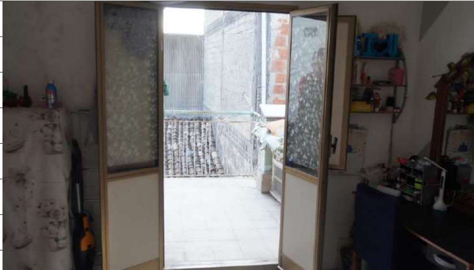
Foto n.31: immagine interna della camera 3 ubicata al piano secondo relativa all'immobile sito in via Giovanni Bovio n.14 ronco I a Carlentini.