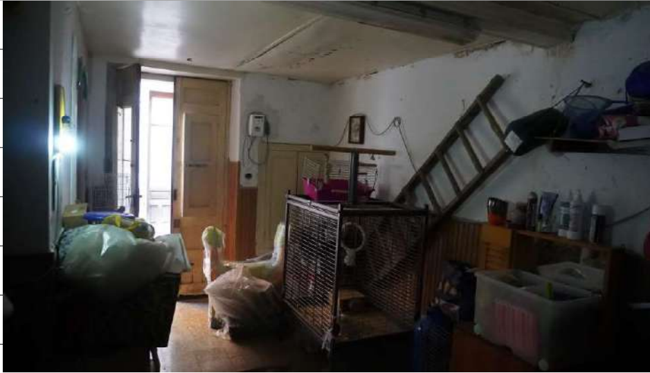
Foto n.13: immagine interna della camera 1 ubicata al piano terra dell'immobile sito in via Giovanni Bovio n.5 ronco II a Carlentini.