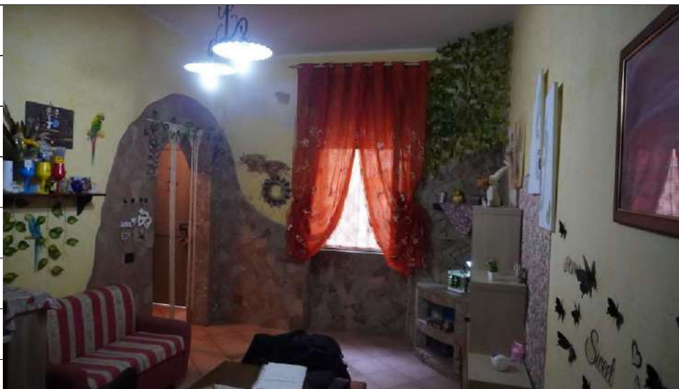
Foto n.8: immagine interna della cucina ubicata al piano terra dell'immobile sito in via Giovanni Bovio n.14 ronco I a Carlentini.