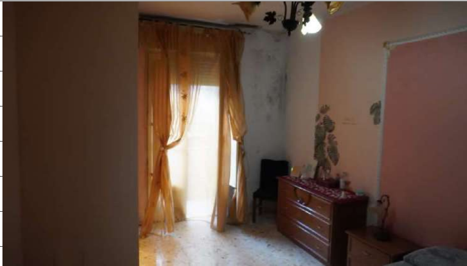
Foto n.23: immagine interna della camera 2 ubicata al piano primo relativa all'immobile sito in via Giovanni Bovio n.14 ronco I a Carlentini.