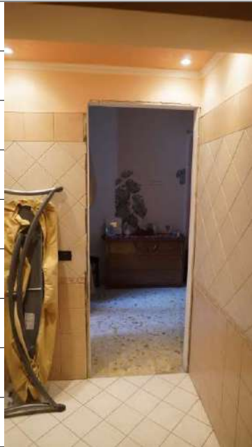
Foto n.27: immagine interna del bagno 3 ubicato al piano primo relativo all'immobile sito in via Giovanni Bovio n.14 ronco I a Carlentini.