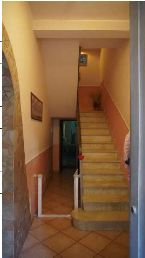
Foto n.6: immagine interna del vano scala ubicato al piano terra dell'immobile sito in via Giovanni Bovio n.14 ronco I a Carlentini.