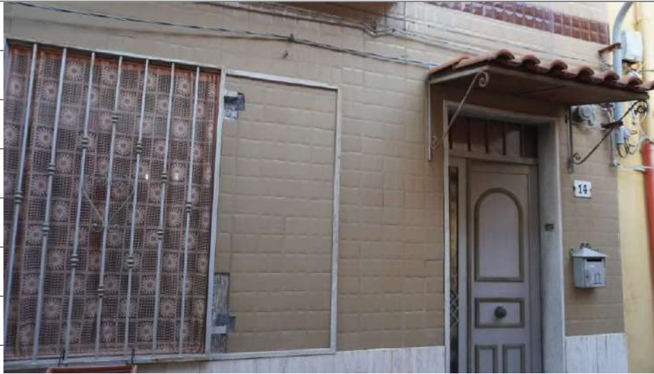
Foto n.3: immagine esterna dell'ingresso relativo all'immobile sito in via Giovanni Bovio n.14 ronco I a Carlentini.

Immobile oggetto di esecuzione, sito in via G. Bovio ronco II n.5 a Carlentini.