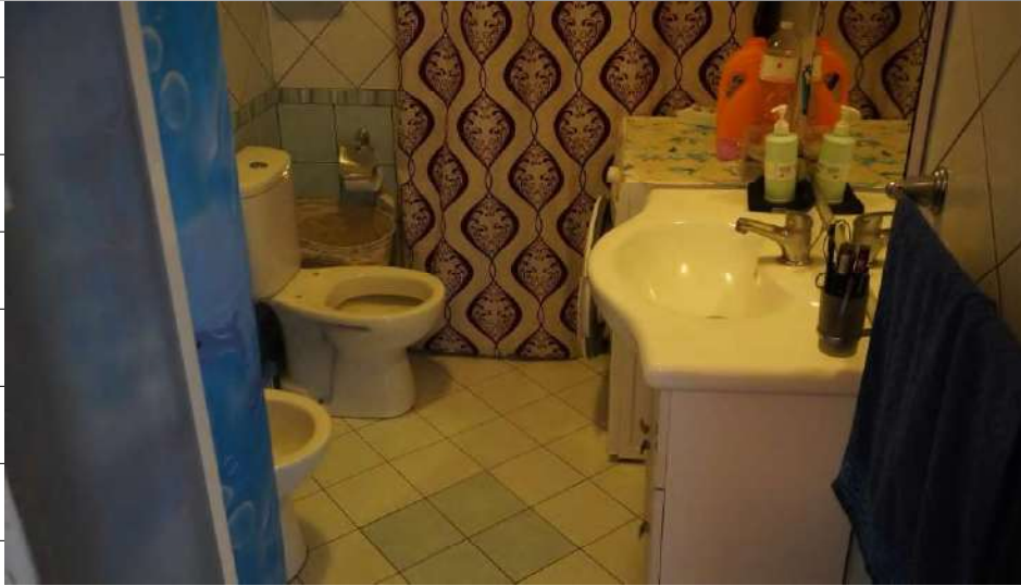
Foto n.33: immagine interna del bagno 4 ubicato al piano secondo relativo all'immobile sito in via Giovanni Bovio n.14 ronco I a Carlentini.