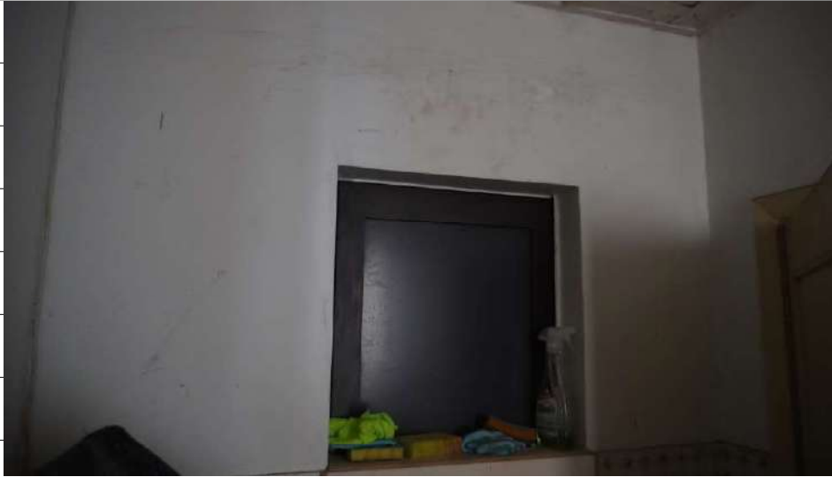
Foto n.17: immagine interna della finestra prospiciente sull'antibagno 2 ubicato al piano terra dell'immobile sito in via Giovanni Bovio n.5 ronco II a Carlentini.