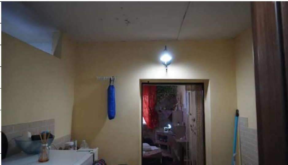
Foto n.10: immagine interna dell'antibagno 1 ubicato al piano terra dell'immobile sito in via Giovanni Bovio n.5 ronco II a Carlentini.