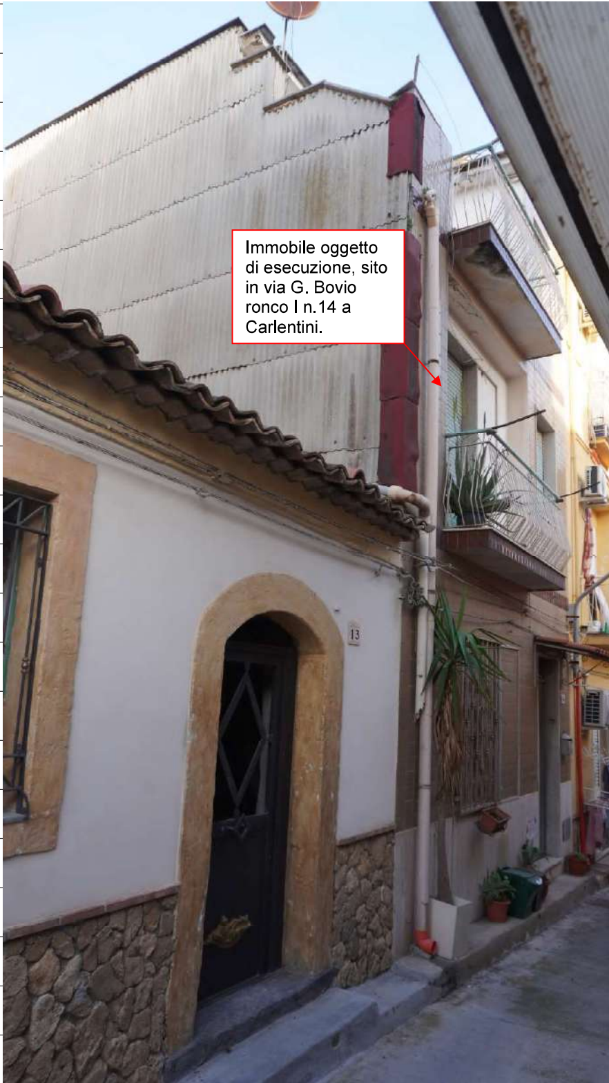
Foto n.2: immagine esterna dell'immobile sito in via Giovanni Bovio n.14 ronco I a Carlentini.