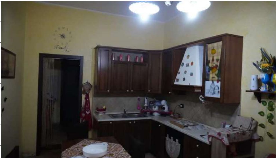
Foto n.7: immagine interna della cucina ubicata al piano terra dell'immobile sito in via Giovanni Bovio n.14 ronco I a Carlentini.