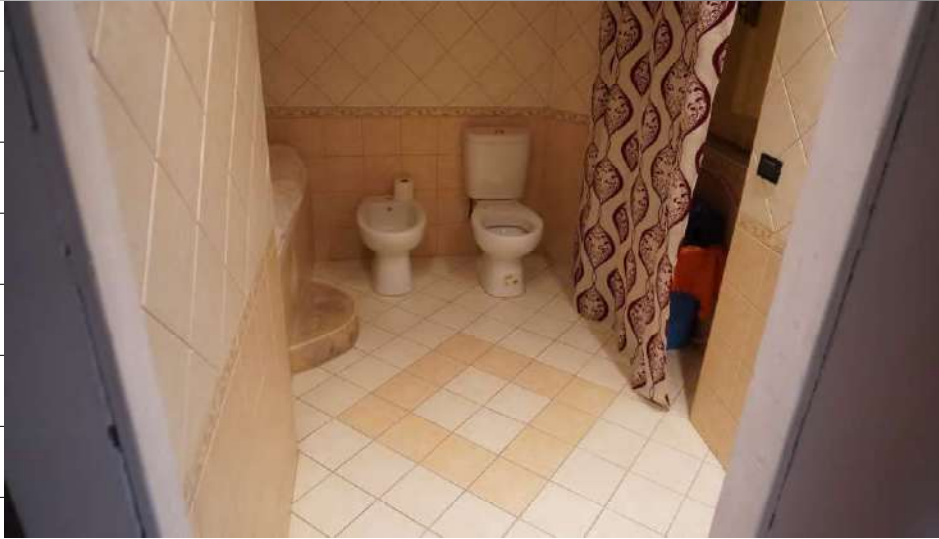
Foto n.25: immagine interna del bagno 3 ubicato al piano primo relativo all'immobile sito in via Giovanni Bovio n.14 ronco I a Carlentini.