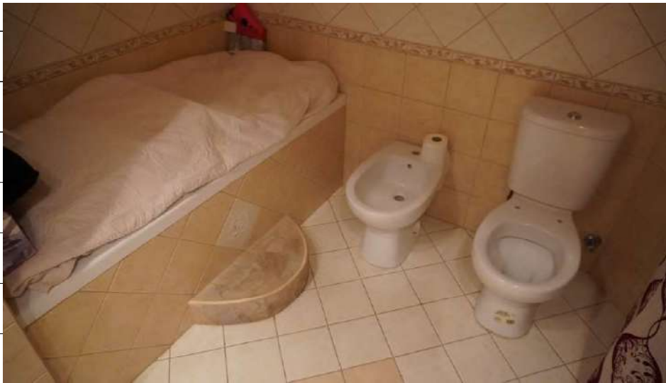
Foto n.26: immagine interna del bagno 3 ubicato al piano primo relativo all'immobile sito in via Giovanni Bovio n.14 ronco I a Carlentini.