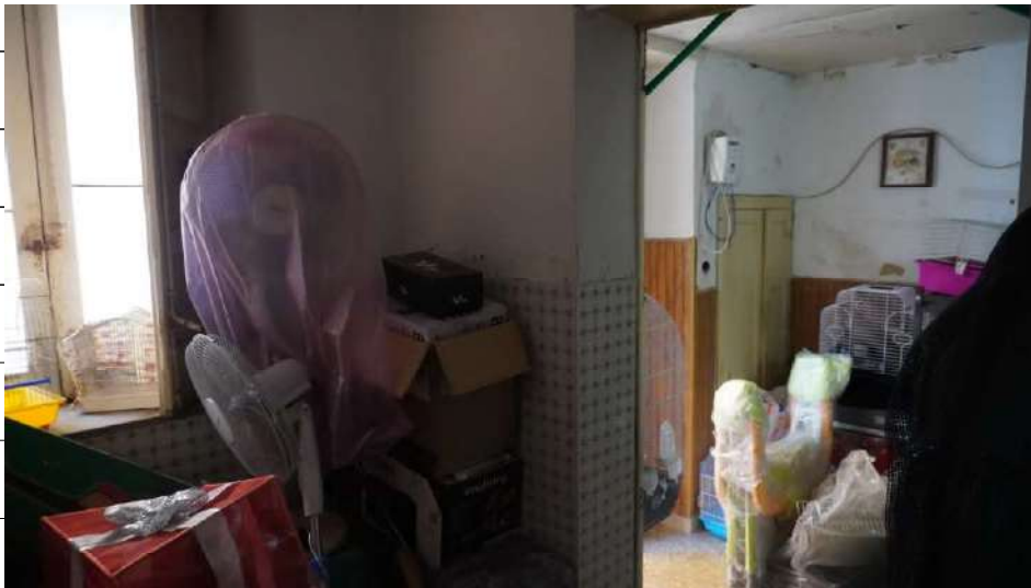
Foto n.18: immagine interna dell'antibagno 2 e della camera 1 ubicati al piano terra dell'immobile sito in via Giovanni Bovio n.5 ronco II a Carlentini.