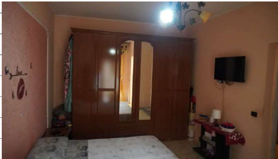
Foto n.22: immagine interna della camera 2 ubicata al piano primo relativa all'immobile sito in via Giovanni Bovio n.14 ronco I a Carlentini.