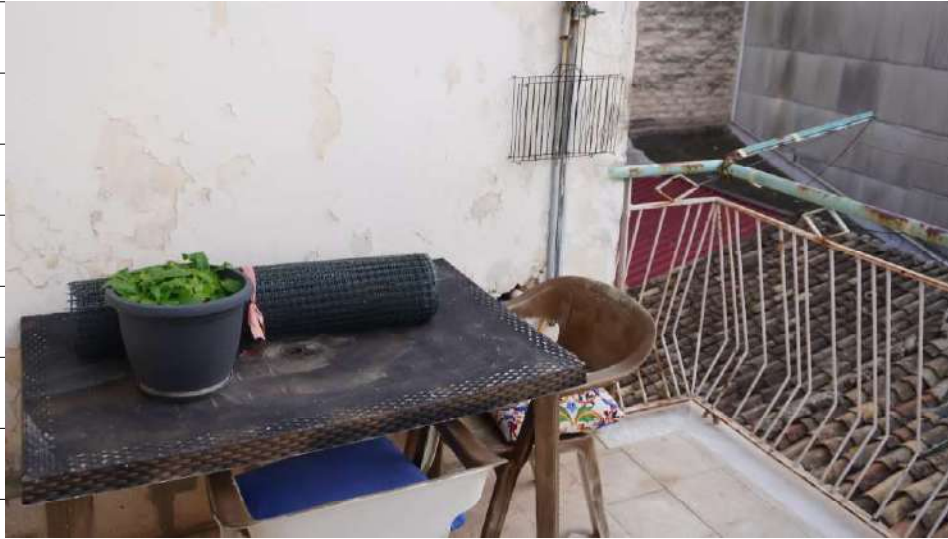
Foto n.35: immagine esterna della terrazza con balcone ubicata al piano secondo relativa all'immobile sito in via Giovanni Bovio n.14 ronco I a Carlentini.