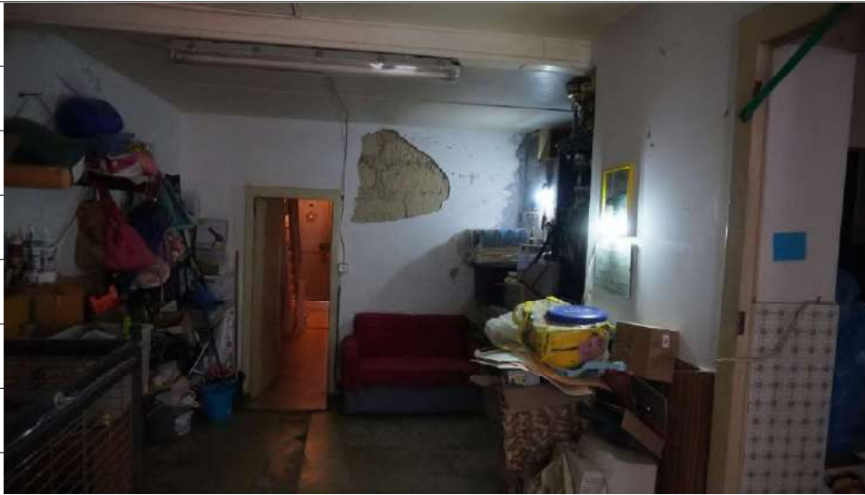
Foto n.15: immagine interna della camera 1 ubicata al piano terra dell'immobile sito in via Giovanni Bovio n.5 ronco II a Carlentini.