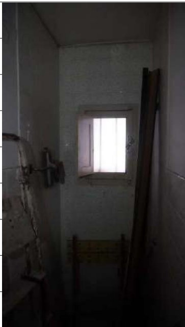
Foto n.19: immagine interna del bagno 2 ubicato al piano terra dell'immobile sito in via Giovanni Bovio n.5 ronco II a Carlentini.