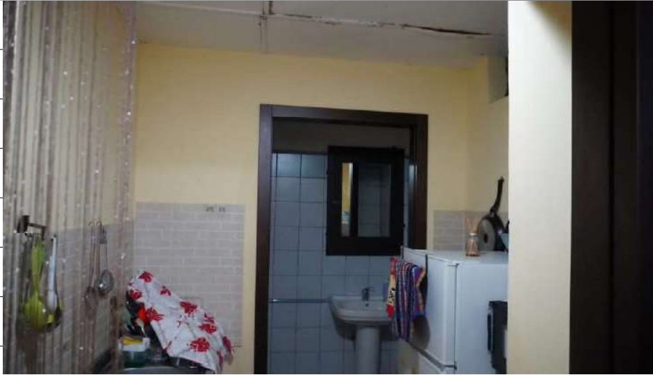
Foto n.9: immagine interna dell'antibagno 1 ubicato al piano terra dell'immobile sito in via Giovanni Bovio n.5 ronco II a Carlentini.