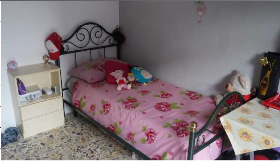
Foto n.29: immagine interna della camera 3 ubicata al piano secondo relativa all'immobile sito in via Giovanni Bovio n.14 ronco I a Carlentini.