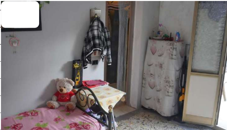
Foto n.30: immagine interna della camera 3 ubicata al piano secondo relativa all'immobile sito in via Giovanni Bovio n.14 ronco I a Carlentini.