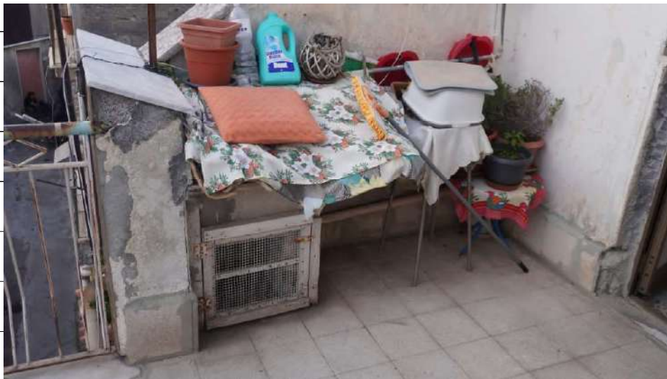
Foto n.36: immagine esterna della terrazza con balcone ubicata al piano secondo relativa all'immobile sito in via Giovanni Bovio n.14 ronco I a Carlentini.