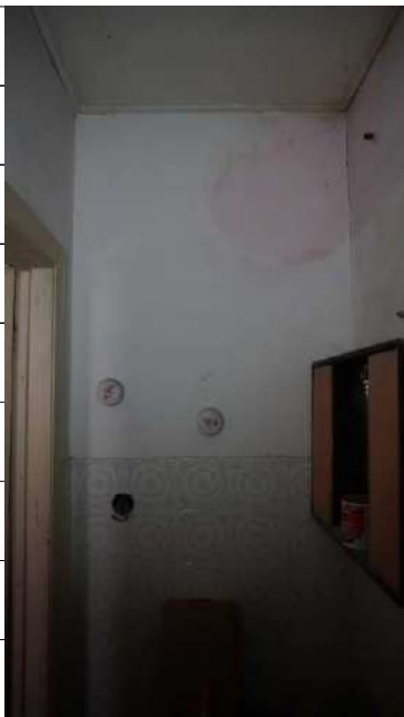
Foto n.20: immagine interna del bagno 2 ubicato al piano terra dell'immobile sito in via Giovanni Bovio n.5 ronco II a Carlentini.