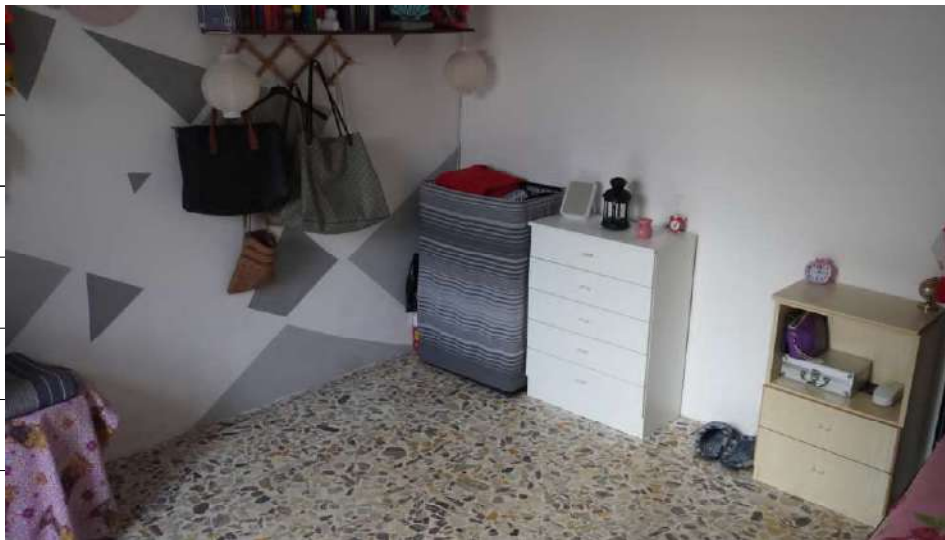
Foto n.32: immagine interna della camera 3 ubicata al piano secondo relativa all'immobile sito in via Giovanni Bovio n.14 ronco I a Carlentini.