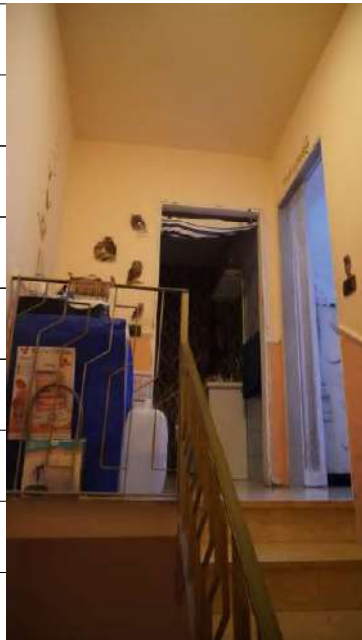
Foto n.28: immagine interna del vano scala di collegamento tra i piani primo e secondo relativo all'immobile sito in via Giovanni Bovio n.14 ronco I a Carlentini.