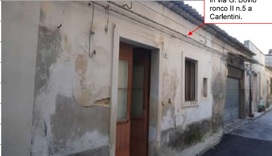
Foto n.5: immagine esterna dell'ingresso relativo all'immobile sito in via Giovanni Bovio n.5 ronco II a Carlentini.

Immobile oggetto di esecuzione, sito in via G. Bovio ronco II n.5 a Carlentini.