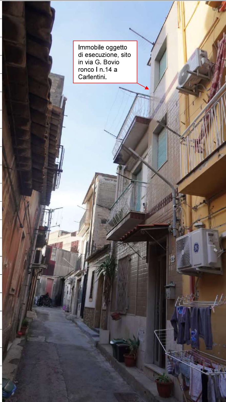
Foto n.1: immagine esterna dell'immobile sito in via Giovanni Bovio n.14 ronco I a Carlentini.