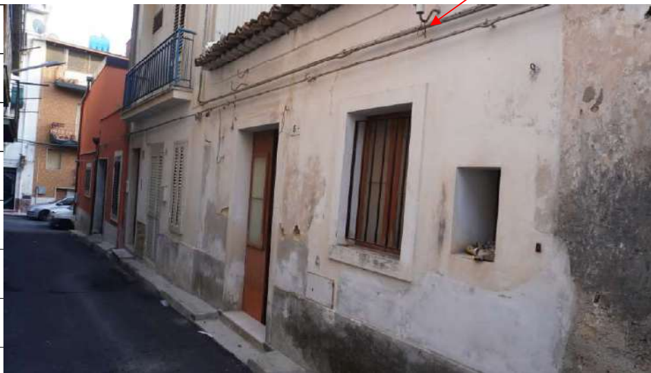
Foto n.4: immagine esterna dell'immobile sito in via Giovanni Bovio n.5 ronco II a Carlentini.

Immobile oggetto di esecuzione, sito in via G. Bovio ronco II n.5 a Carlentini.