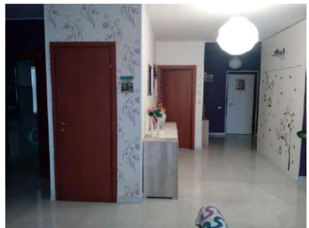
Altra vista del soggiorno