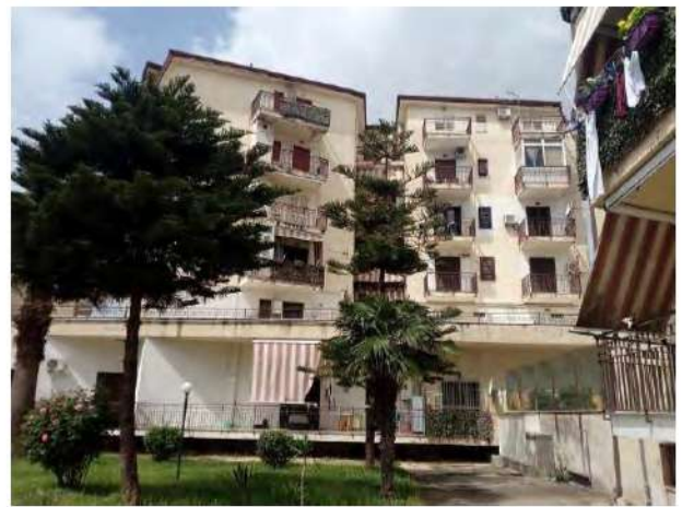
Altra vista del fabbricato A

La porta di ingresso immette direttamente in un ampio vano soggiorno, sul cui lato destro vi sono la cucina, un bagno e il ripostiglio, nonché il disimpegno da cui si accede alle due camere da letto e al secondo bagno.