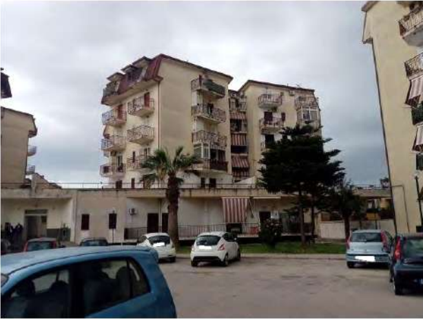
Vista d'insieme del fabbricato A

La superficie interna utile complessiva è pari a mq. 115,39, con altezza interna di m. 2,75. Inoltre, vi sono quattro balconi, uno sul lato Nord di mq. 14,85, e tre sul lato Est di mq. 6,15, mq. 3,90 e mq. 3,90, tutti prospicienti l'area scoperta comune del fabbricato.