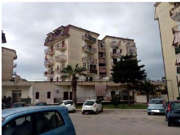
Vista d'insieme del fabbricato A

La superficie interna utile complessiva è pari a mq. 95,10, con altezza interna di m. 2,75. Inoltre, vi sono quattro balconi, uno sul lato Nord-Est di mq. 7,35, due sul lato Nord-Est di mq. 4,00 ciascuno e uno sul lato Sud-Ovest di mq. 6,00, tutti prospicienti l'area scoperta comune del fabbricato.