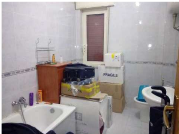
Uno dei due bagni

Sulla base di tutto quanto sopra descritto, lo stato di manutenzione generale degli immobili può definirsi buono.