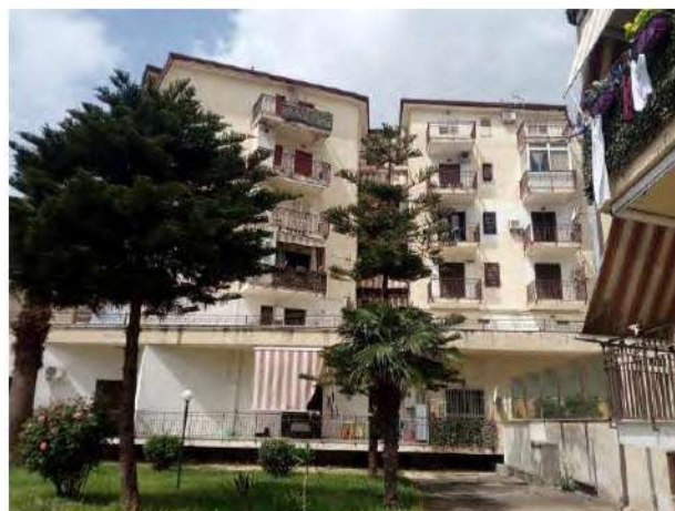
Altra vista del fabbricato A

La porta di ingresso immette direttamente nel vano soggiorno, sul cui lato sinistro vi è la cucina con annesso ripostiglio, mentre in posizione frontale vi è la porta del disimpegno, posto in posizione centrale e baricentrica, da cui si accede alle due camere da letto e ai bagni.