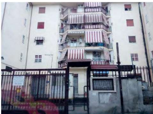
Ingresso del Parco Bonifico

L'appartamento dispone di affacci sul lato Nord, Est ed Ovest, tutti prospicienti l'area scoperta comune del complesso immobiliare "Parco Bonifico". Tutti i vani sono dotati di vani finestra di adeguate dimensioni, per cui l'esposizione dell'appartamento può definirsi buona.