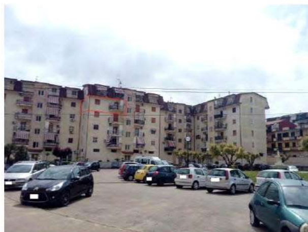
Vista d'insieme del fabbricato C