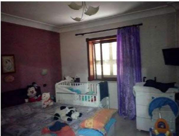
Seconda camera da letto