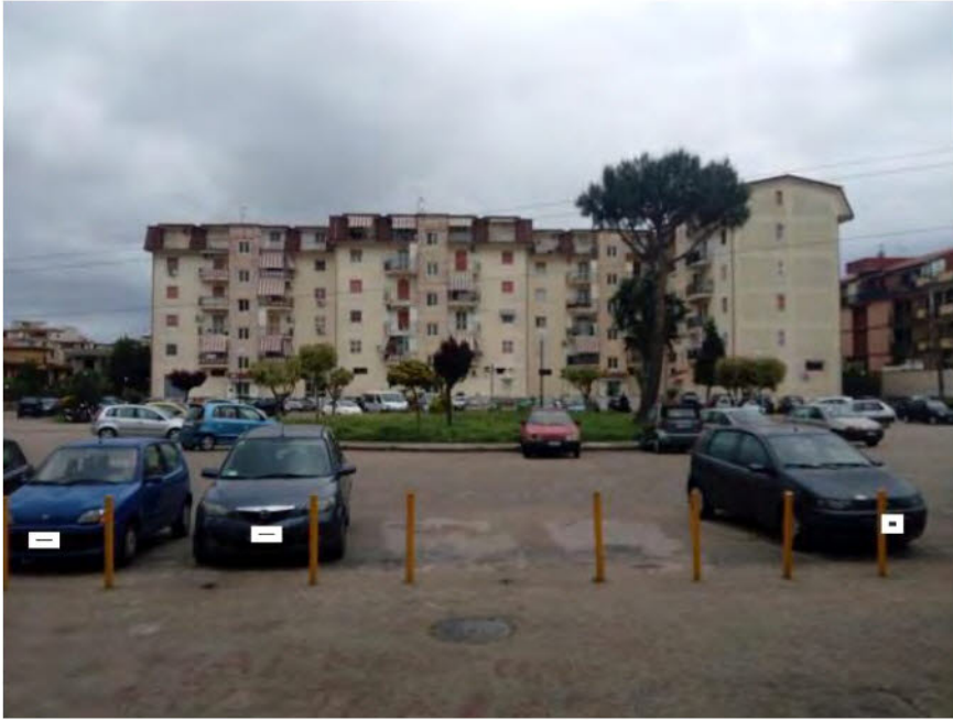
FOTO N. 13 – Vista d'insieme del fabbricato C di cui fa parte l'appartamento pignorato