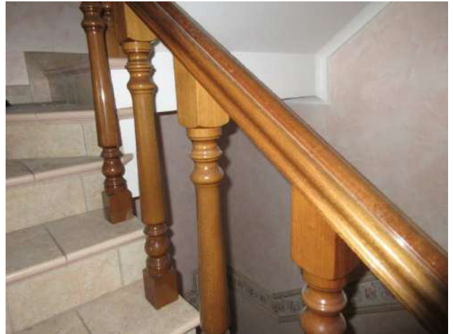
FOTO N.23 - VANO SCALA TRA SECONDO E TERZO PIANO