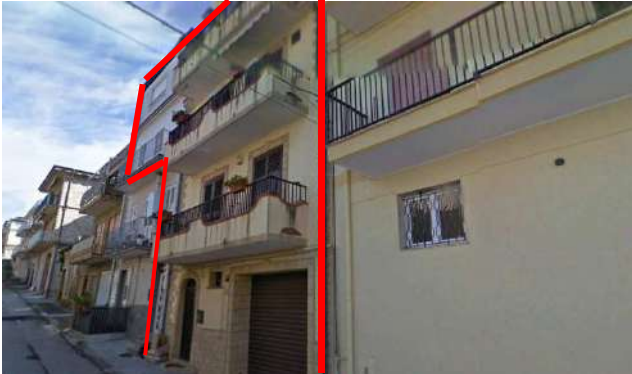
FOTO N.2 - PROSPETTO VIA COSENTINO