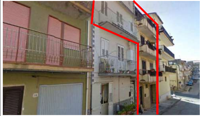
FOTO N.3- PROSPETTO VIA COSENTINO