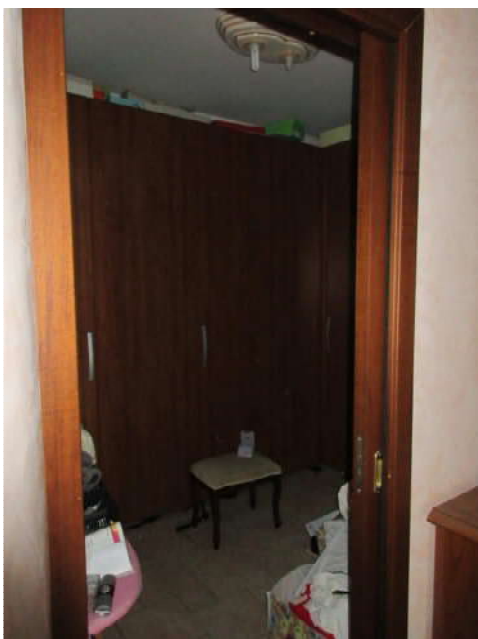
FOTO N.12 - VANO INTERNO PIANO PRIMO