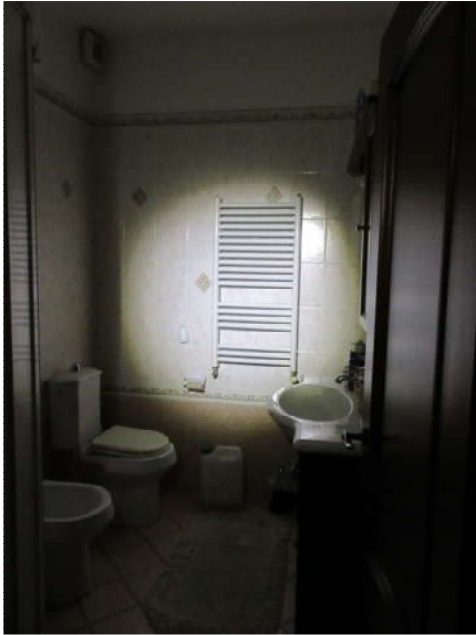
FOTO N.14 - VANO BAGNO PIANO PRIMO