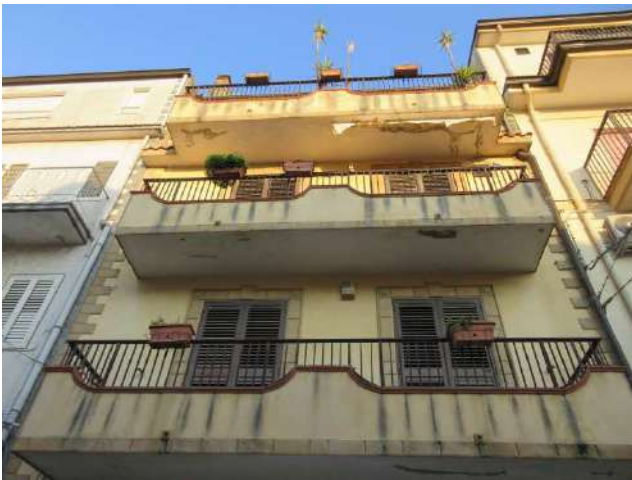
FOTO N.4 - PROSPETTO VIA COSENTINO