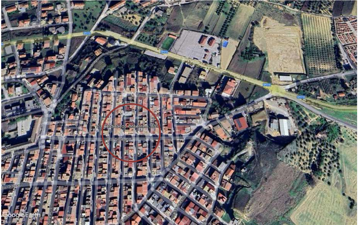
FOTO N.1 – LOCALIZZAZIONE IMMOBILE PIGNORATO IN MIRABELLA IMBACCARI VIA F. COSENTINO N.88-90