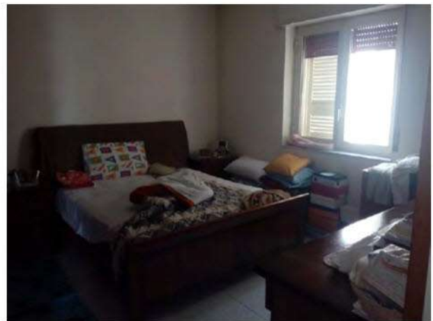
Seconda camera da letto