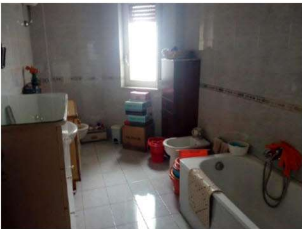
Bagno con vasca

L'appartamento non è dotato di A.P.E. – Attestato di Prestazione Energetica, che potrà essere rilasciato con un costo stimabile in Euro 200,00.