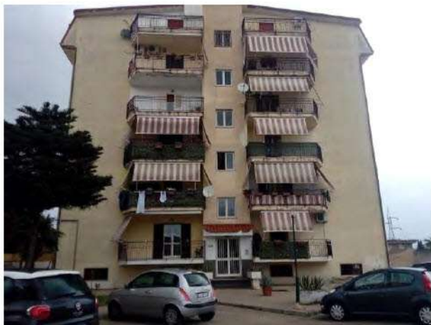
Vista d'insieme del fabbricato A

La porta di ingresso immette direttamente nel vano soggiorno, sul cui lato destro vi è la cucina, mentre in posizione frontale vi è la porta del disimpegno, posto in posizione centrale e baricentrica, da cui si accede alle due camere da letto e ai bagni.