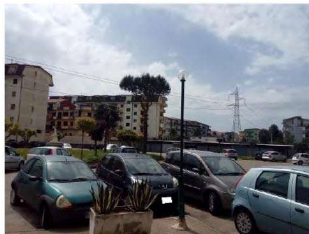
Vista del piazzale del complesso immobiliare