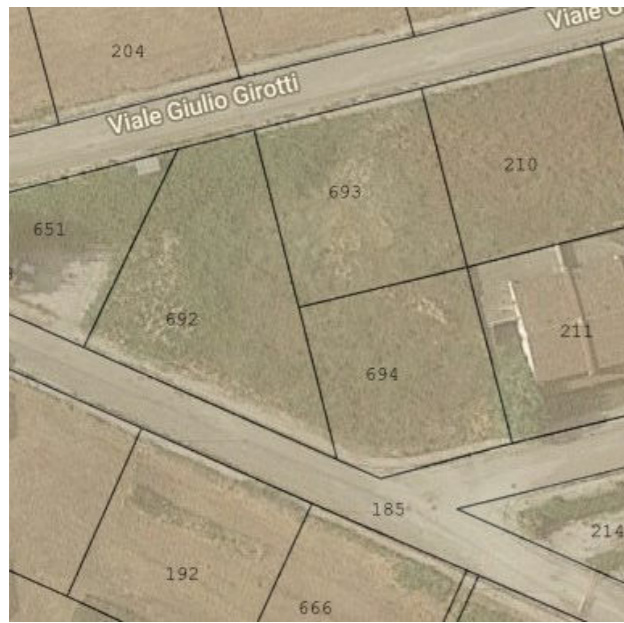
Stralcio Planimetrico Sovrapposizione dello stralcio catastale con il rilievo fotogrammetrico