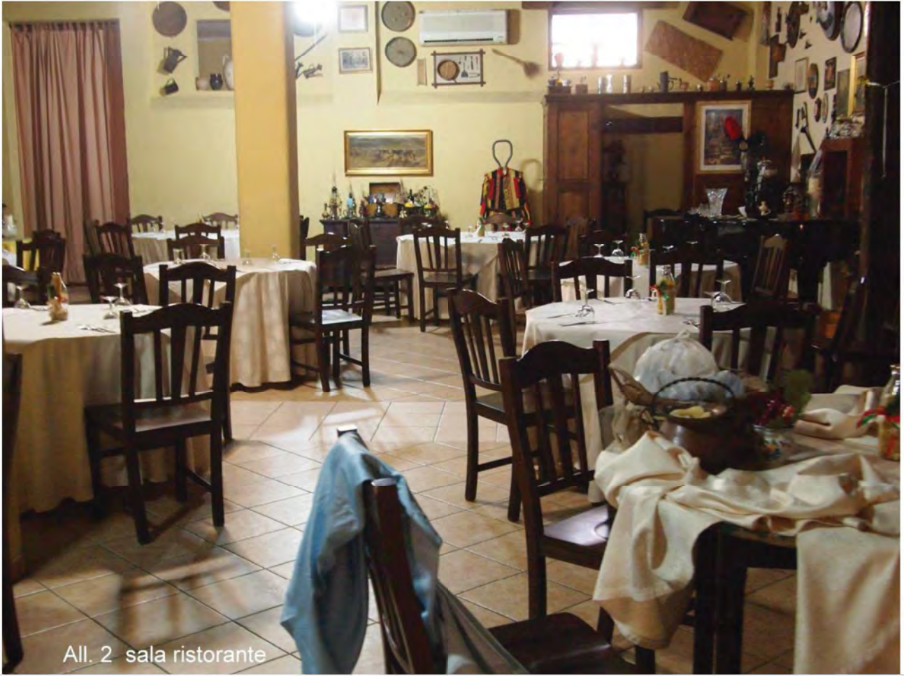
All. 2 sala ristorante