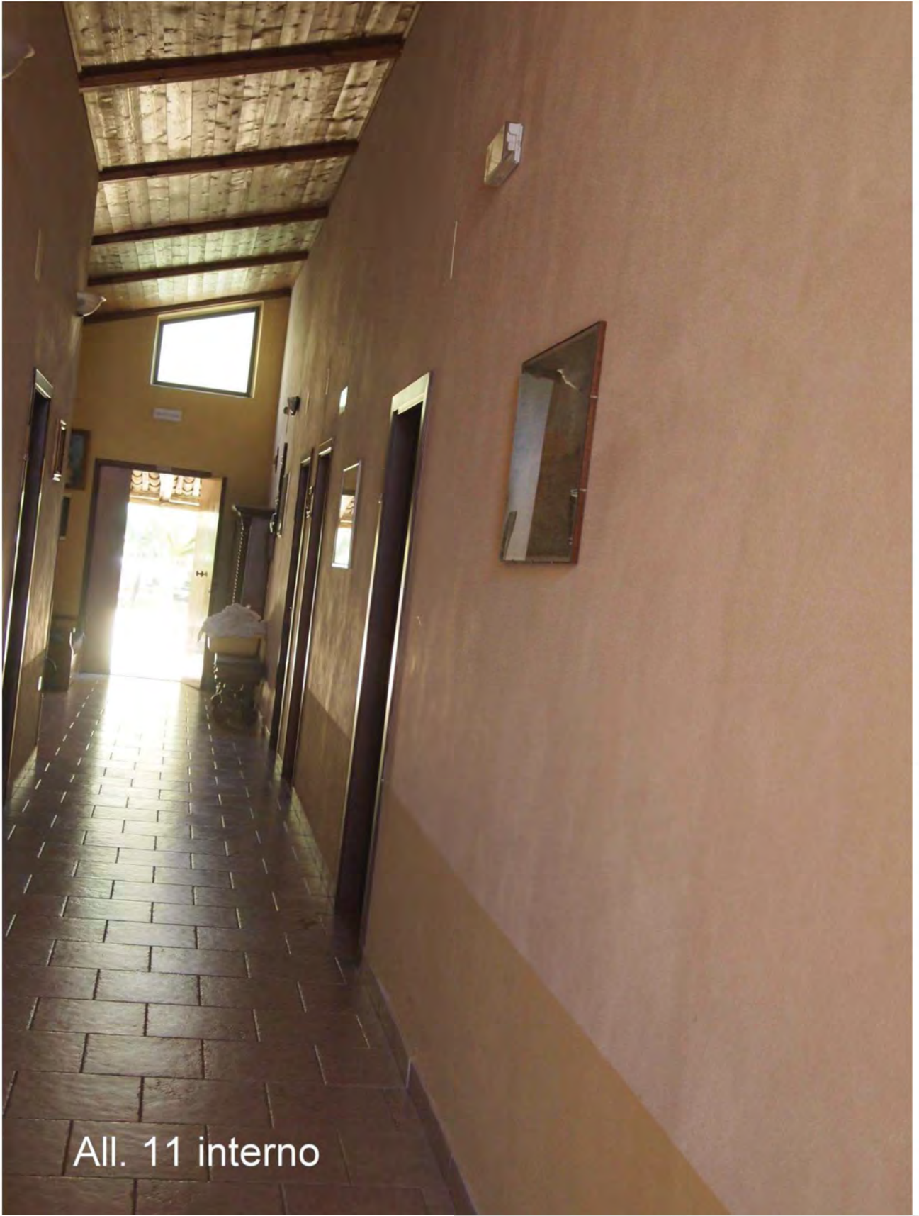
All. 11 interno