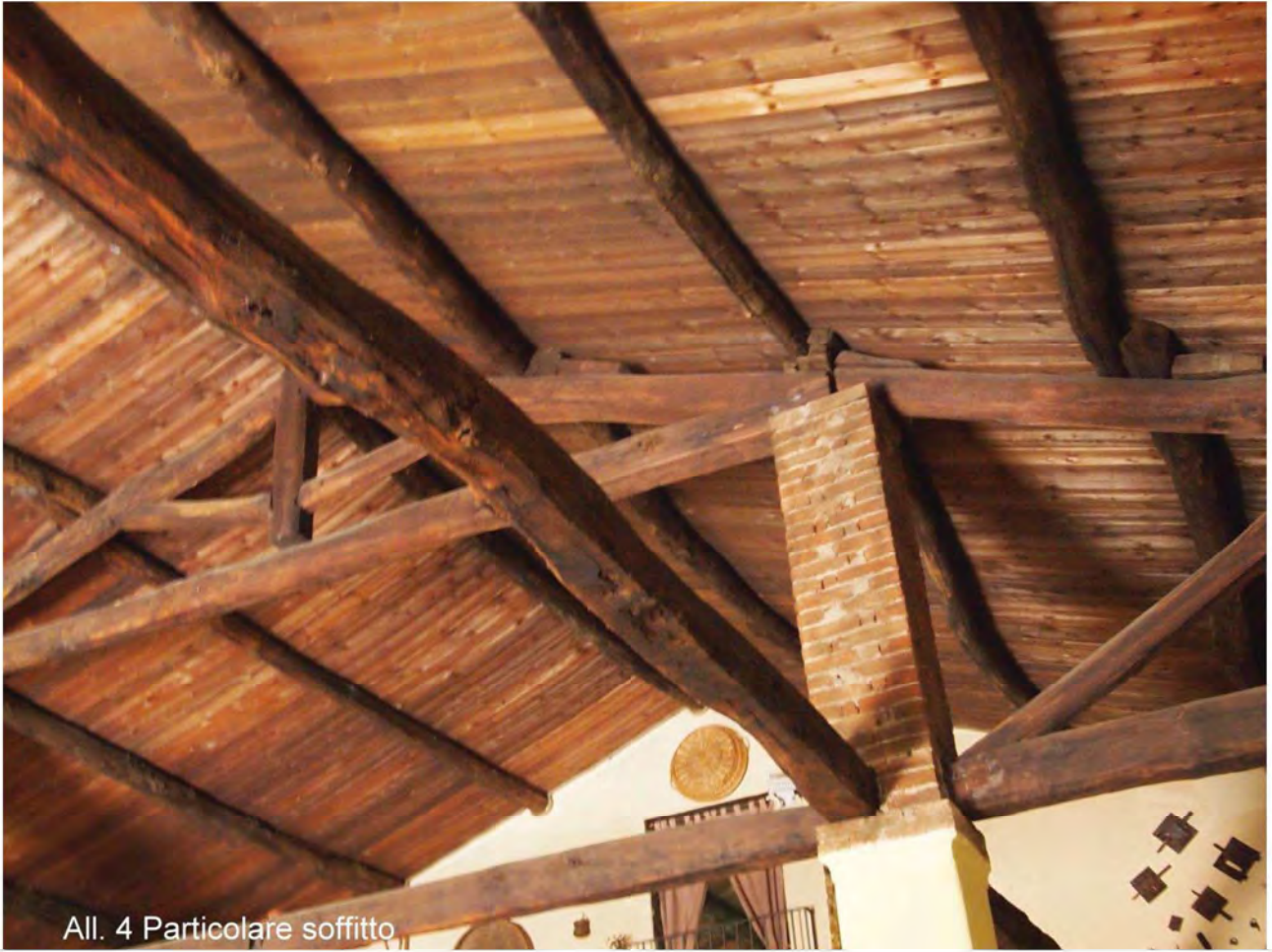
All. 4 Particolare soffitto