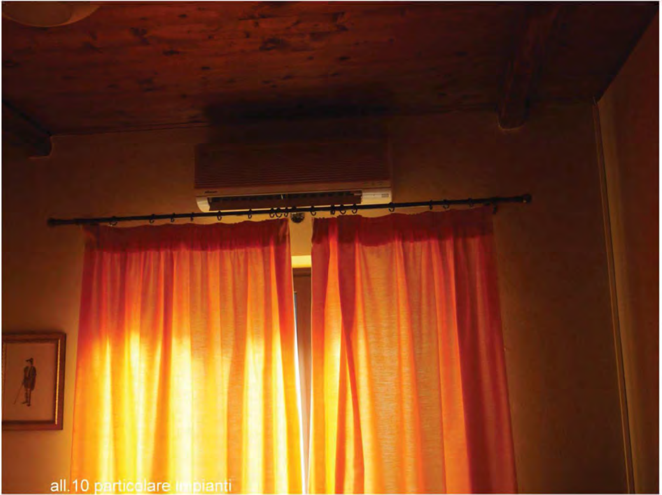
all. 10 particolare impianti