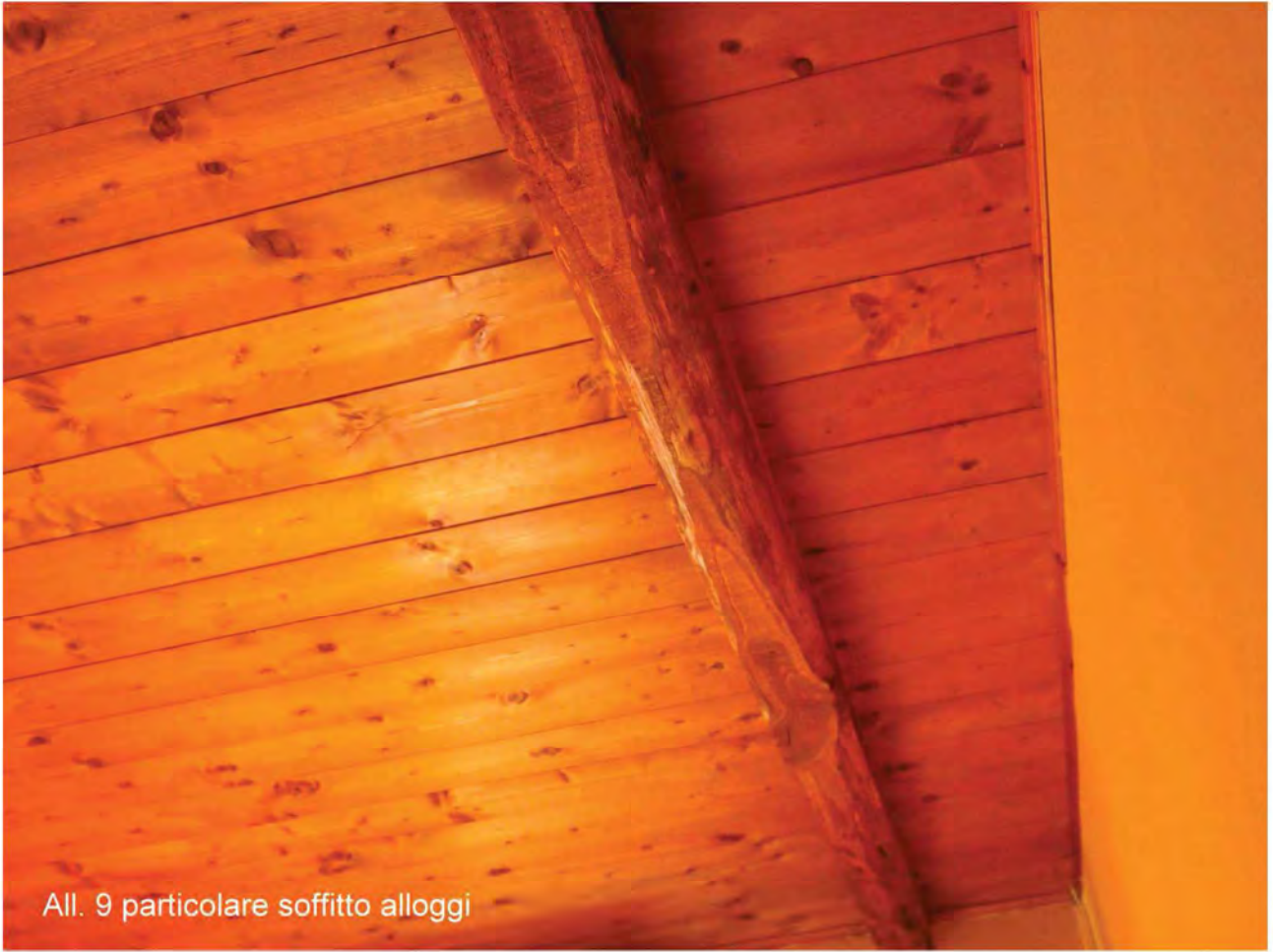
All. 9 particolare soffitto alloggi