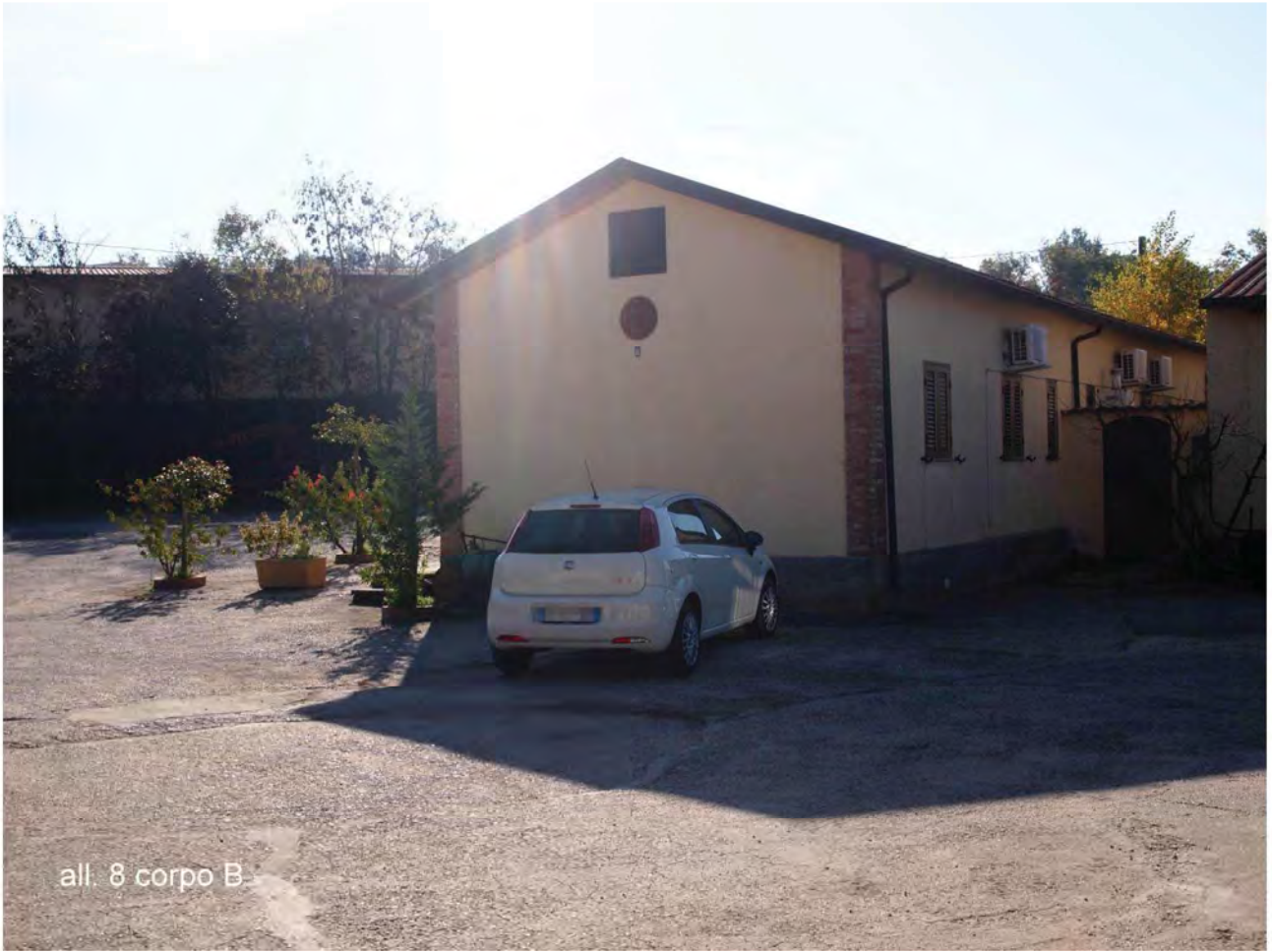
all. 8 corpo B