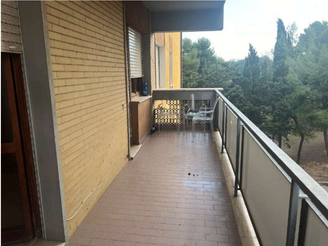
Foto 13 - Balcone