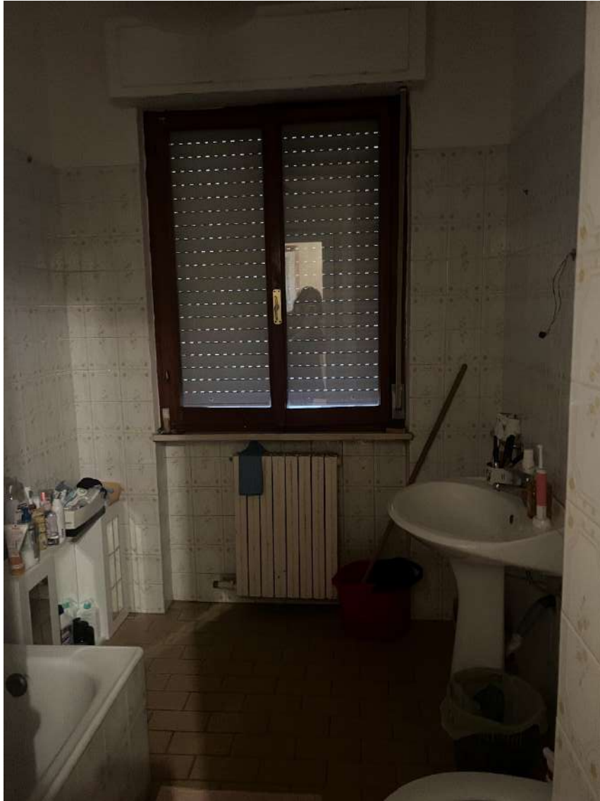
Foto 22 - Bagno