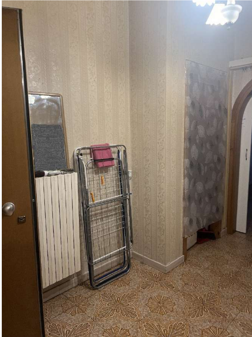
Foto 8 - Ingresso