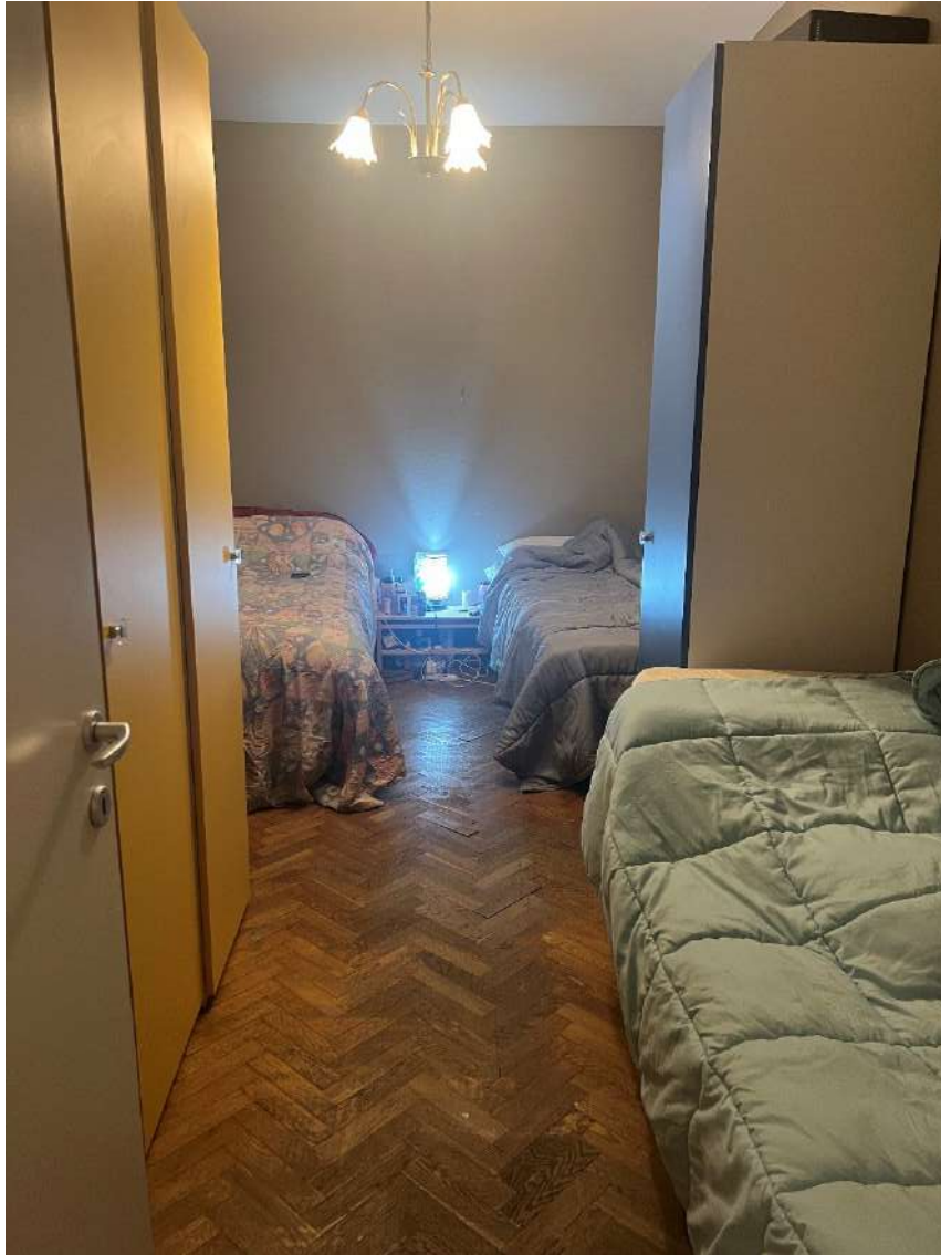
Foto 23 - Camera