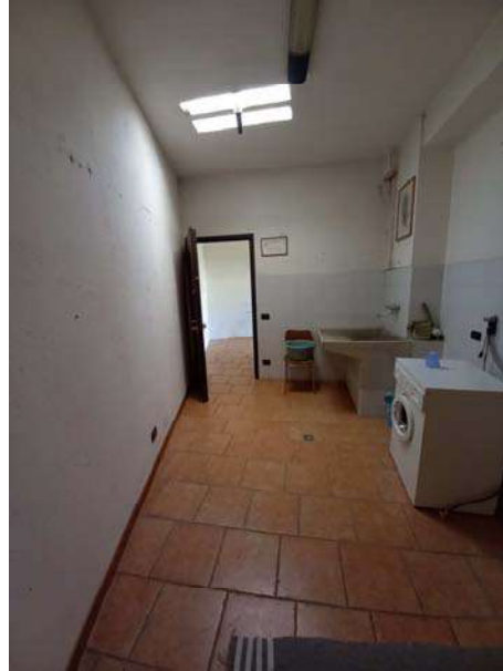
VISTA ANTI PT