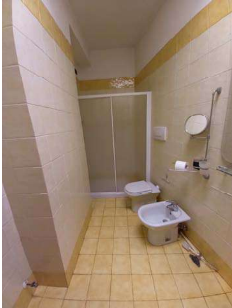
VISTA BAGNO PT