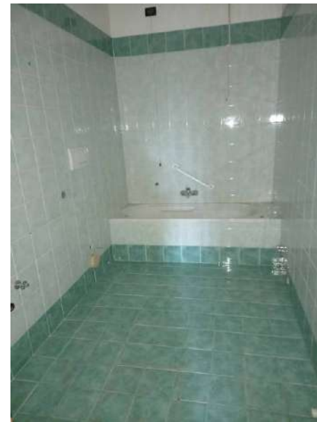
VISTA BAGNO PT