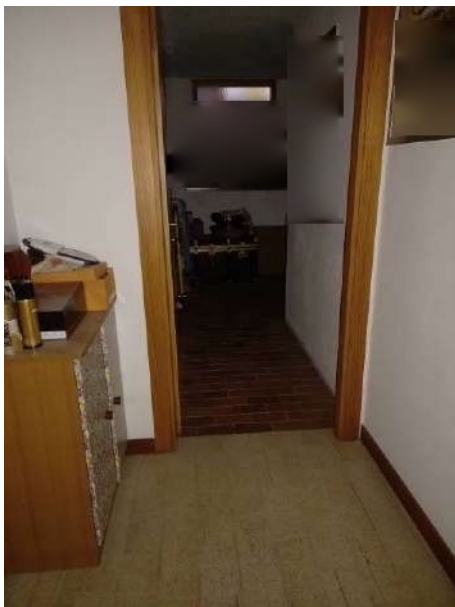
VISTA CANTINA P.INT