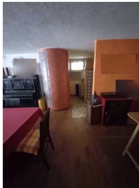
VISTA RIPOSTIGLIO P. INT