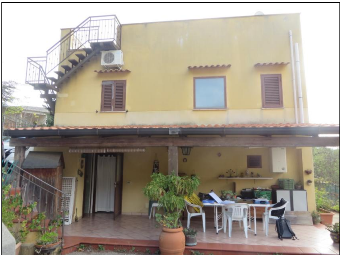
Retrospetto dell'edificio (prospetto esposto ad ovest)