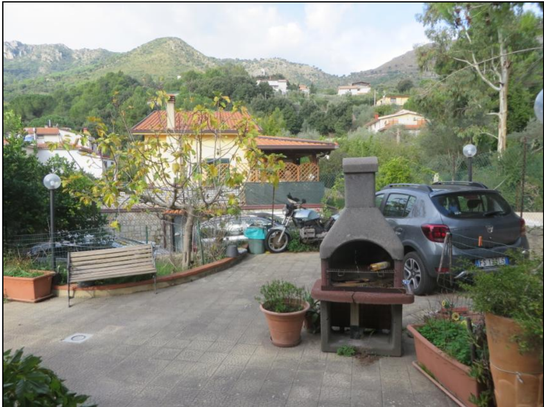
Corte esterna prospiciente il retrospetto