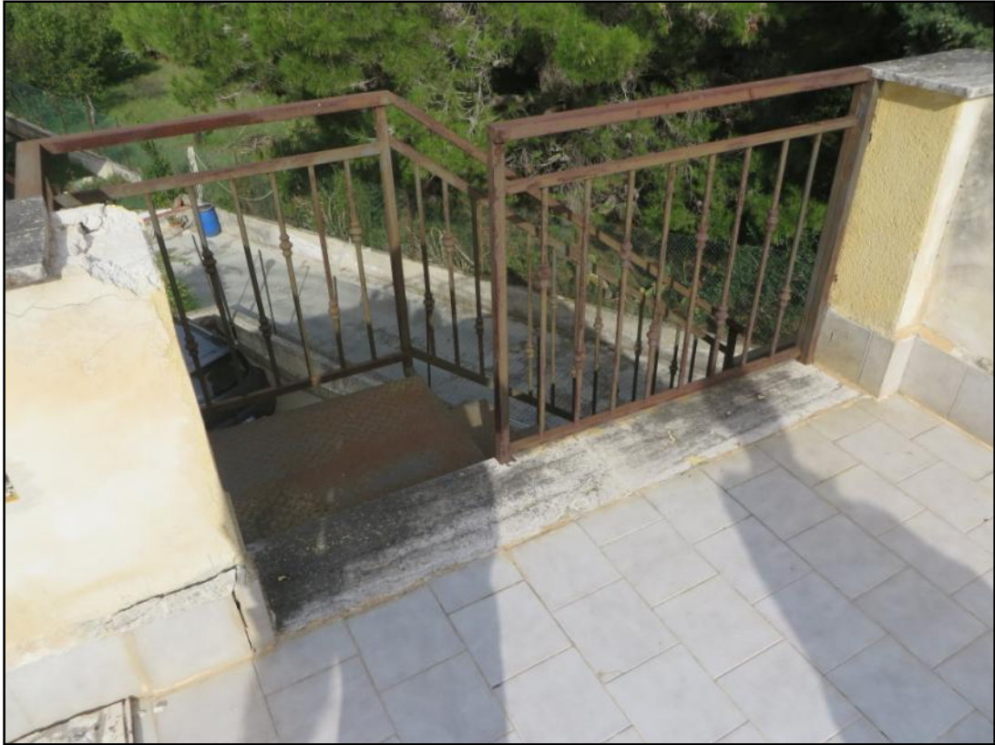
Particolare del muretto d'attico