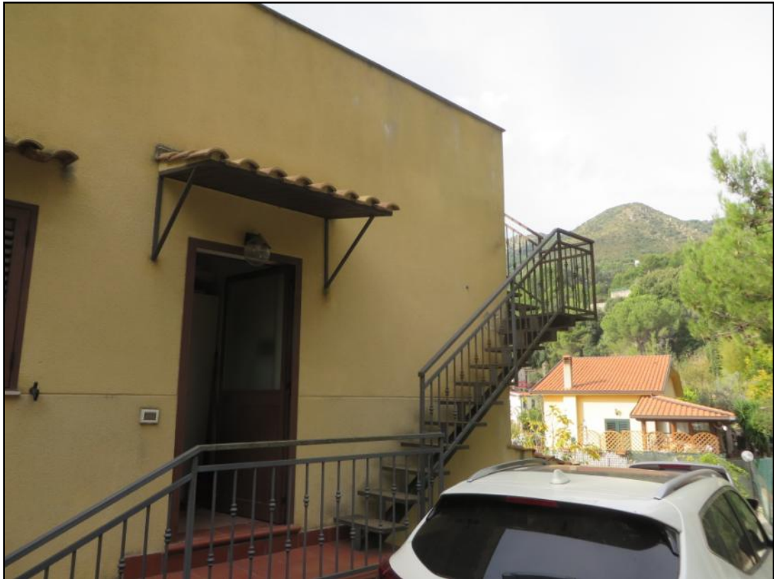
Prospetto laterale (nord) in cui è ubicato l'accesso al primo piano