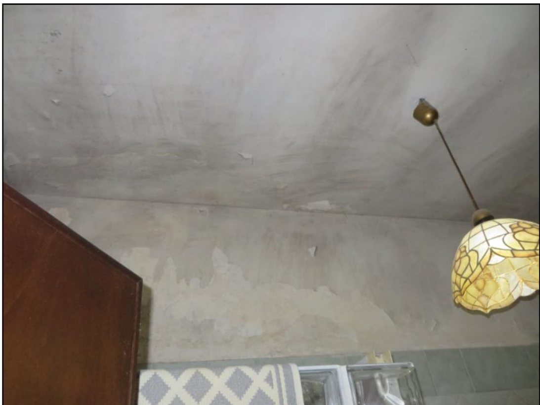
Soffitto del servizio igienico