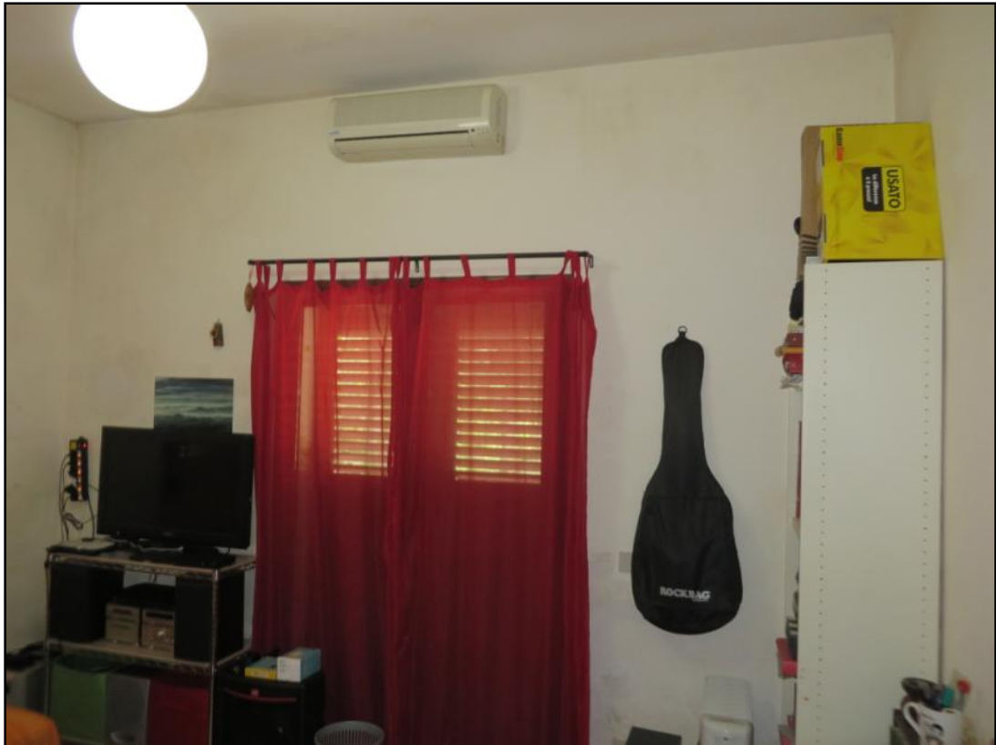
Seconda camera da letto