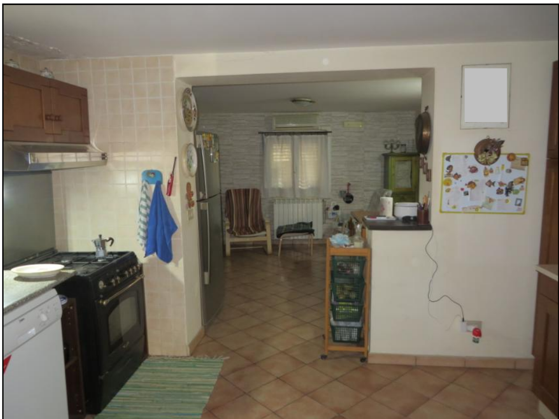
Cucina ubicata al piano terra