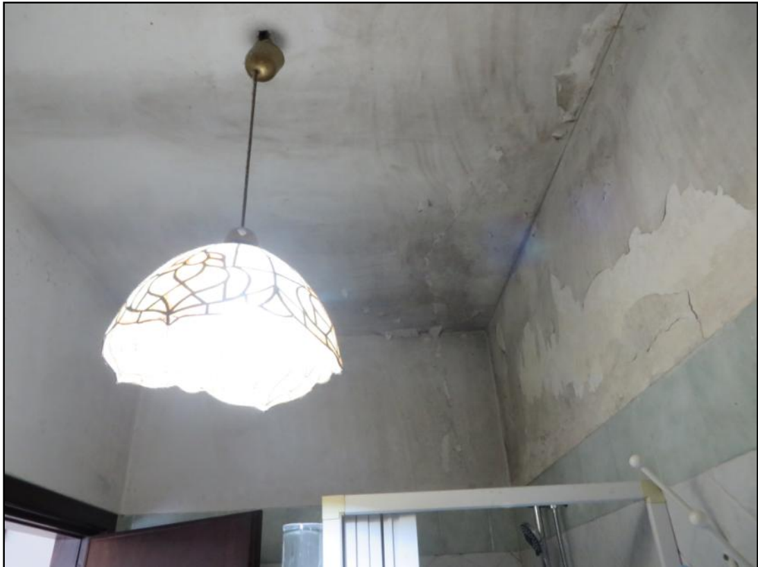
Soffitto del servizio igienico