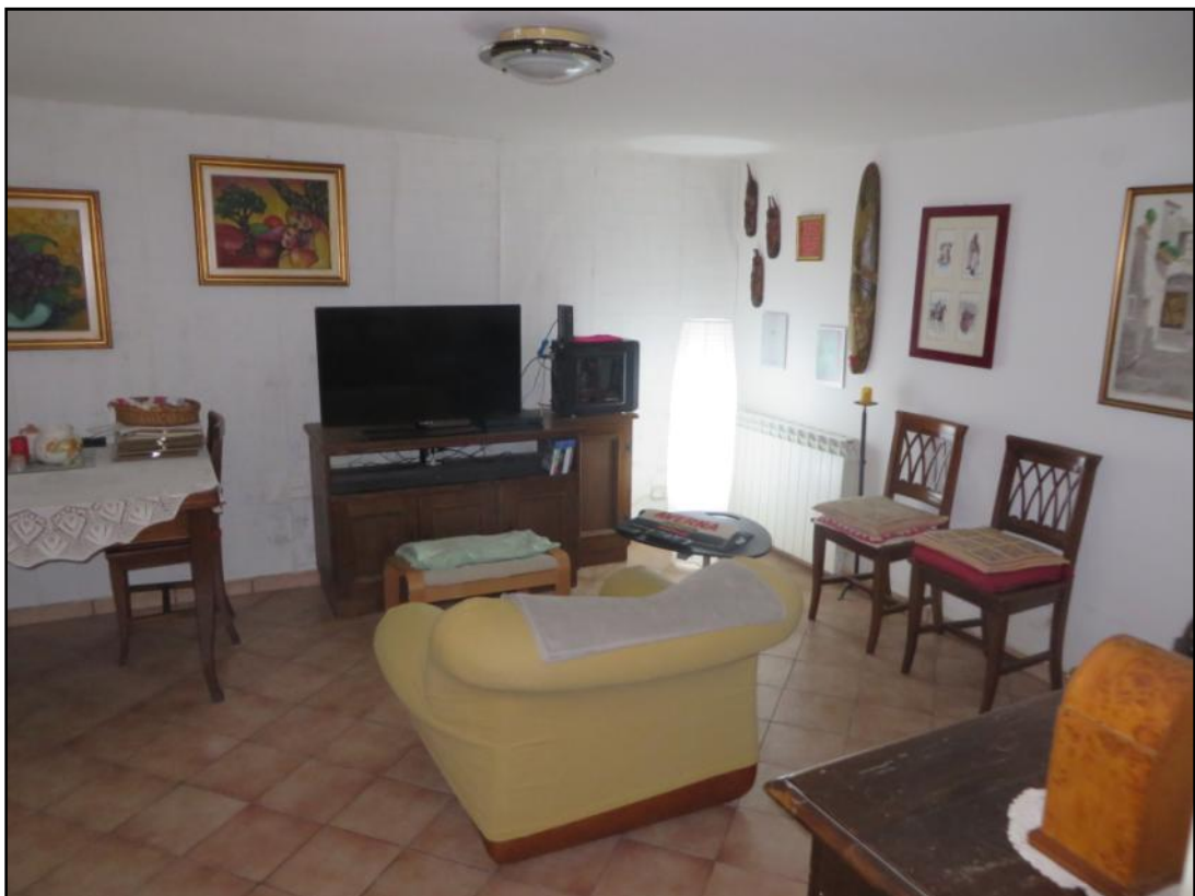
Soggiorno ubicato al piano terra