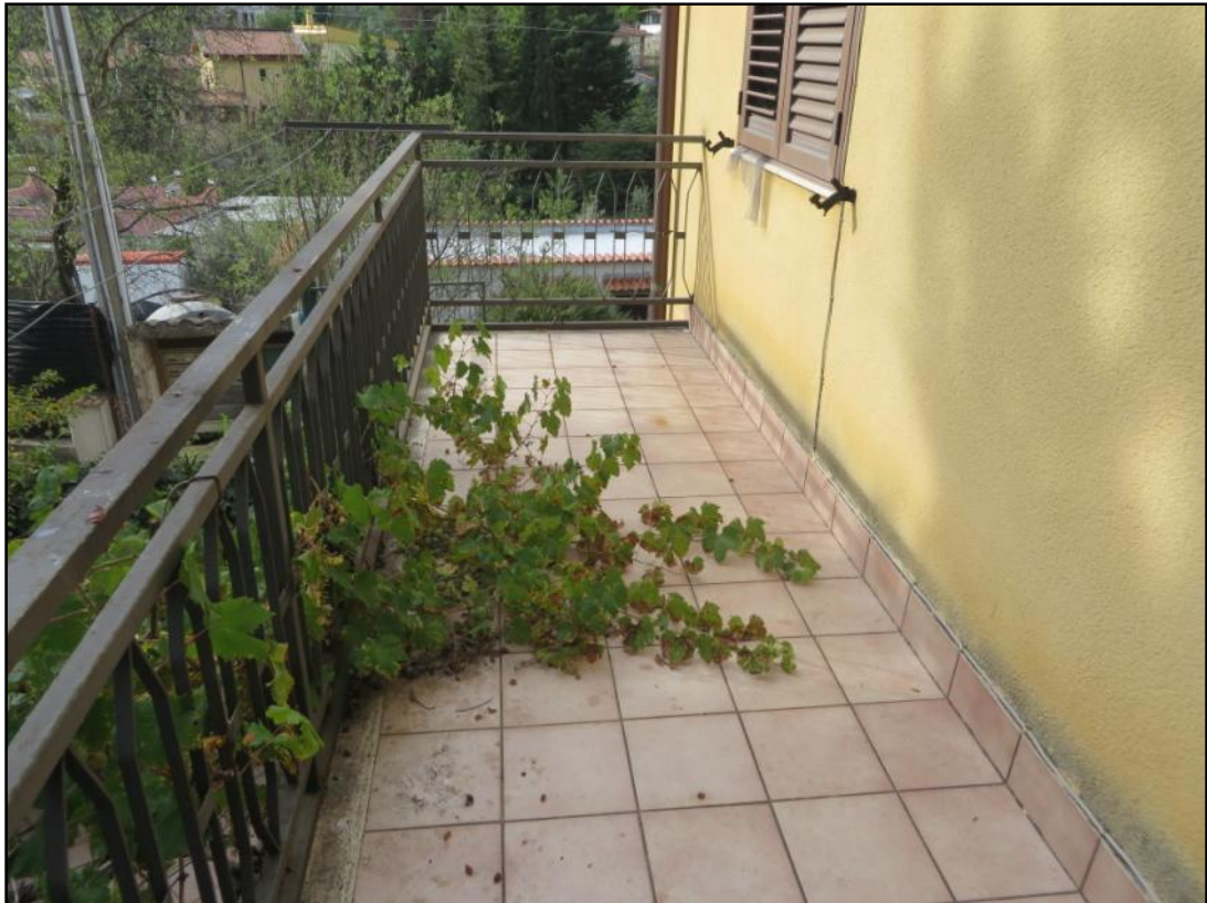
Balcone posto sul prospetto principale