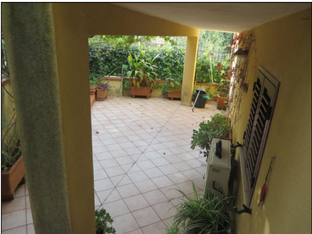
Portico ubicato in corrispondenza del prospetto principale (est)