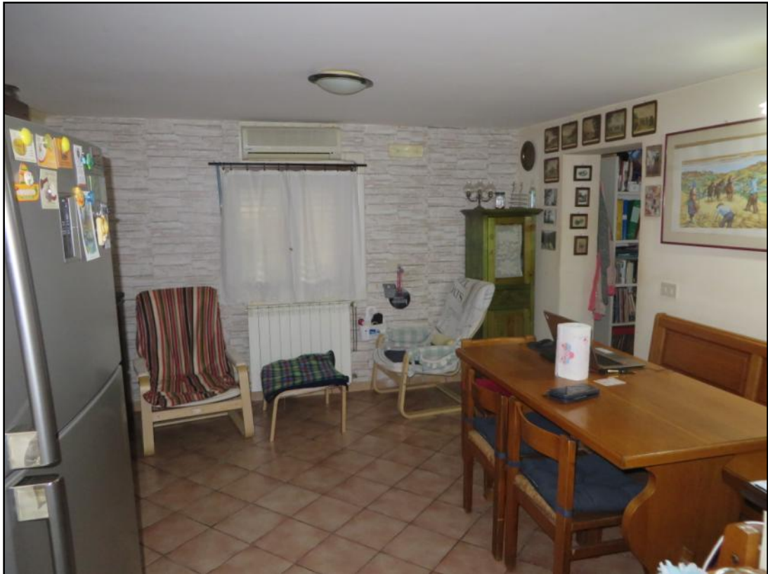
Sala da pranzo ubicata al piano terra