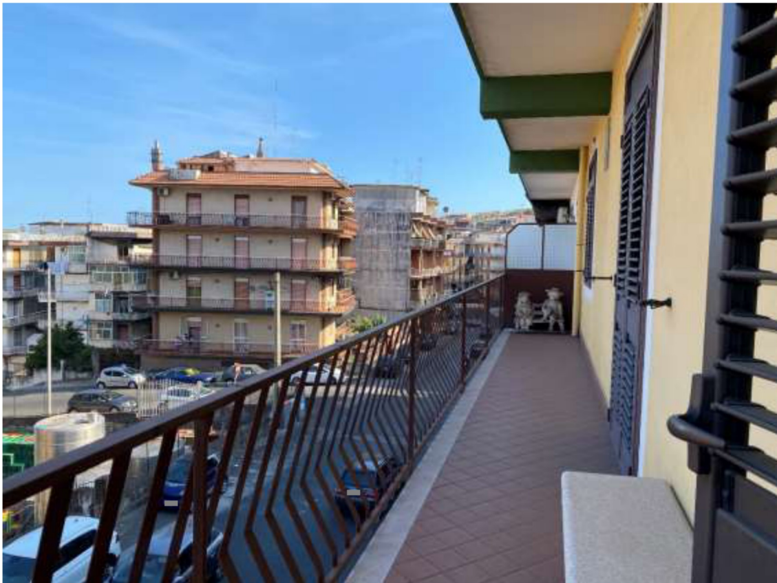
Foto 23 – Vista del balcone lato est con affaccio su via Santa Maria del Sanguè