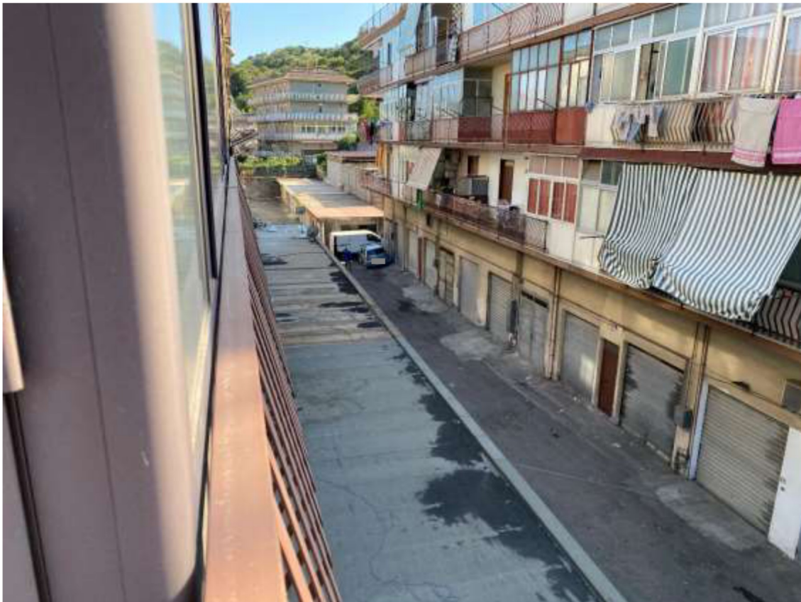
Foto 21 – Vista dal balcone lato ovest con affaccio sulla corsia di manovra dei garage