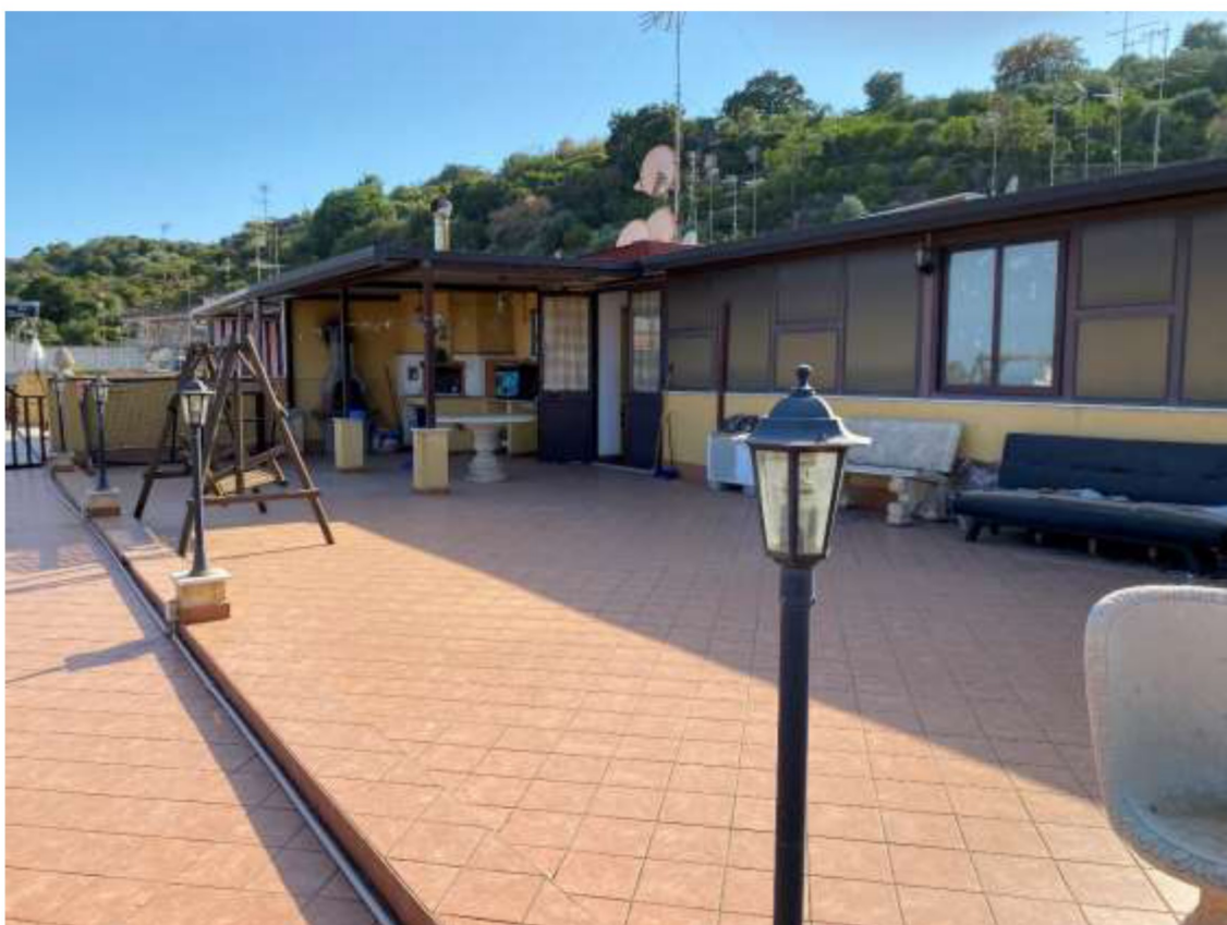
Foto 31 – Terrazza di copertura con vista della tettoia in parte chiusa ed in parte aperta