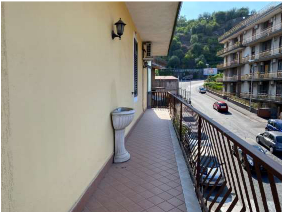
Foto 24 – Vista del balcone lato nord con affaccio su via Petralia