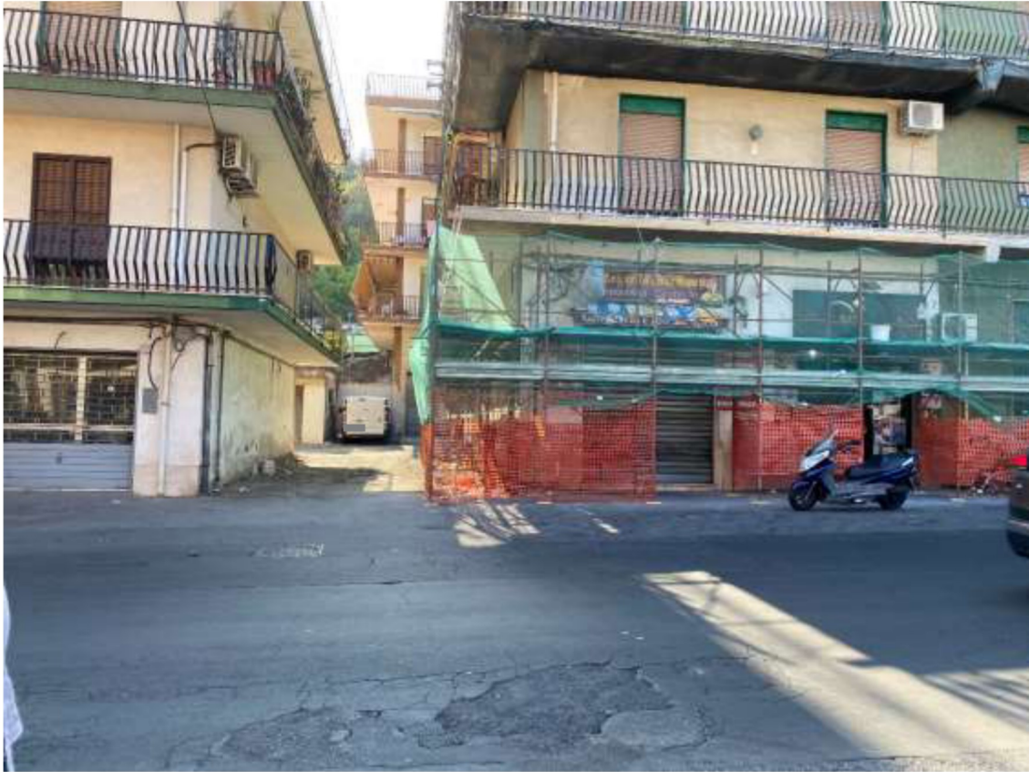
Foto 35 – Vista dalla via Santa Maria del Sangue della corsia di accesso e manovra dei garage