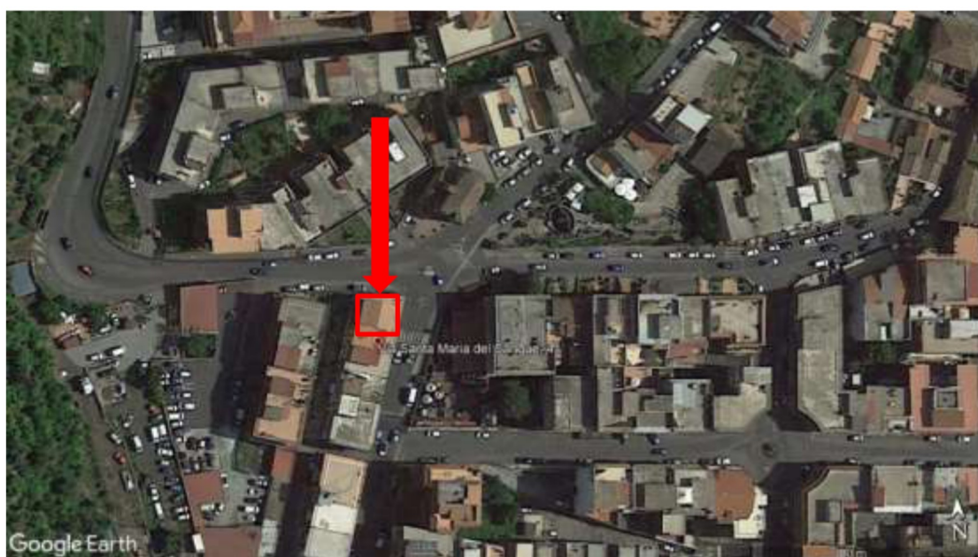
Foto 2 – Vista aerea degli immobili pignorati siti in via Santa Maria del Sangue n. 41