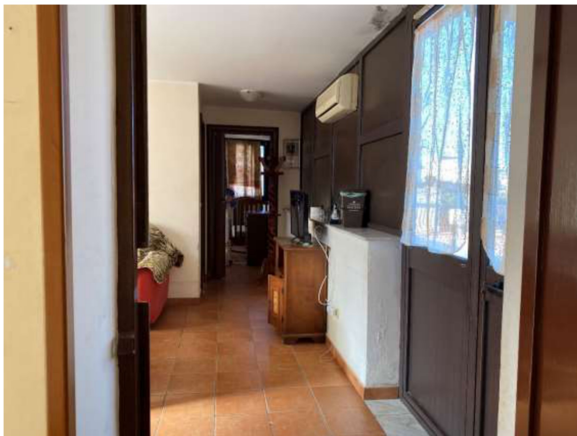
Foto 26 – Ingresso alla terrazza di copertura in cui è presente una tettoia chiusa