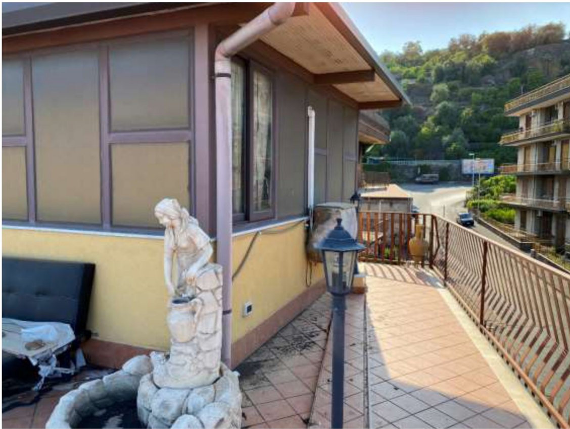
Foto 33 – Terrazza di copertura con affaccio lato nord su via Petralia