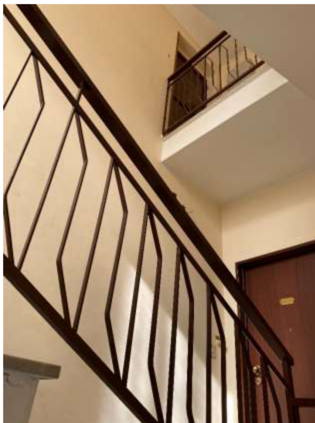
Foto 25 – Vano scala con vista dell'ingresso all'appartamento e della porta di accesso alla terrazza di copertura