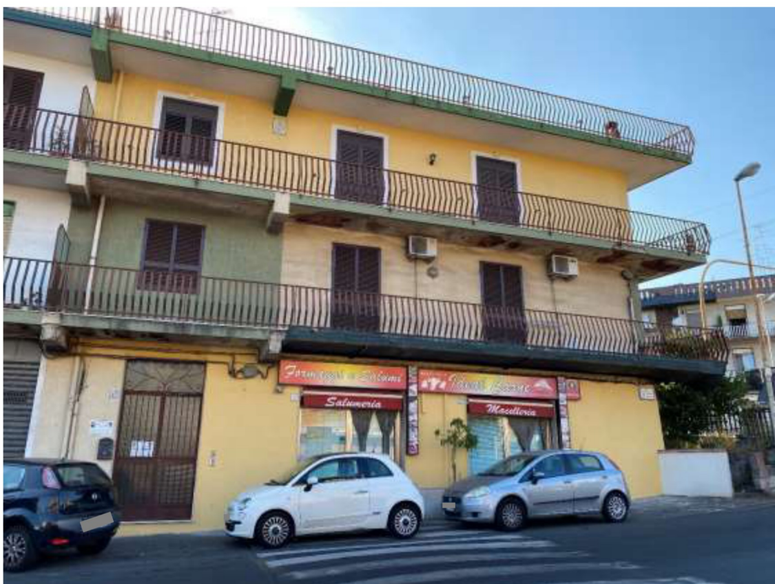
Foto 5 – Vista del portone di ingresso al fabbricato in cui è ubicato l'appartamento.