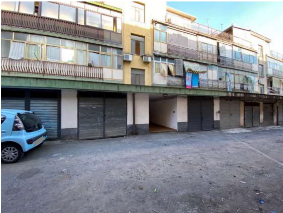
Foto 38 – Vista dei garage e dell'accesso al vano scala dalla corsia di manovra