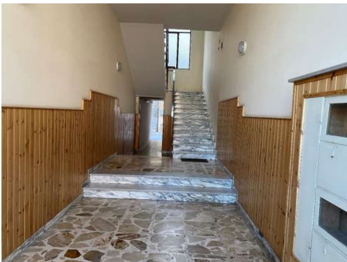
Foto 6 – Vista dell'androne con a destra la scala di accesso all'appartamento ed a sinistra la porta interna di accesso ai garage.