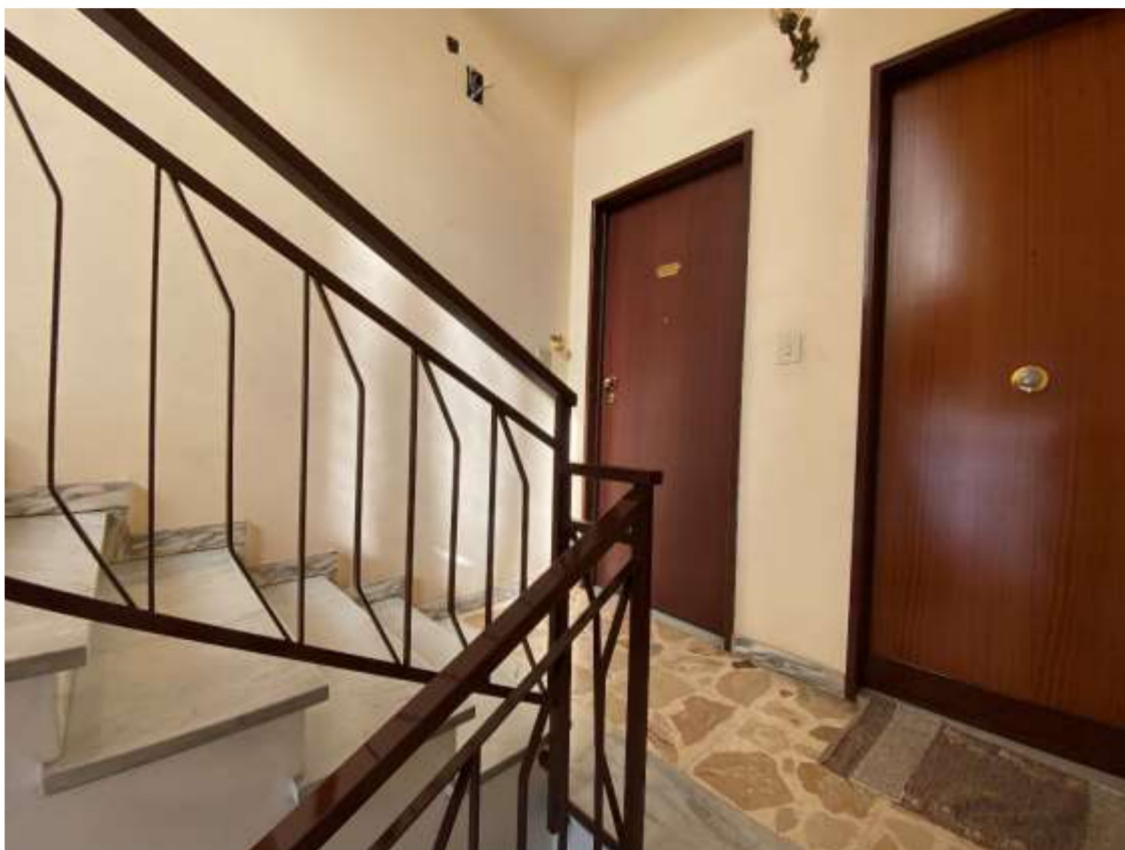
Foto 7 – Pianerottolo di accesso all'appartamento (porta a sinistra)