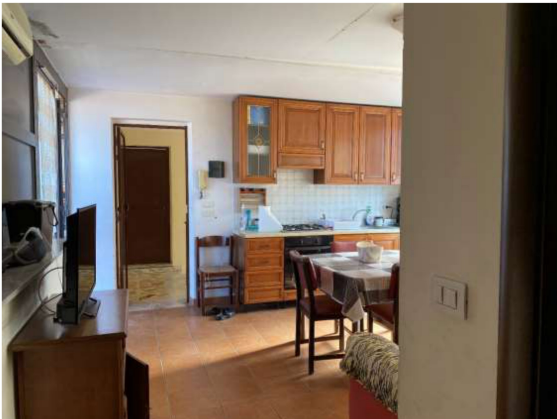
Foto 28 – Cucina realizzata nella terrazza di copertura e vista del pianerottolo di accesso