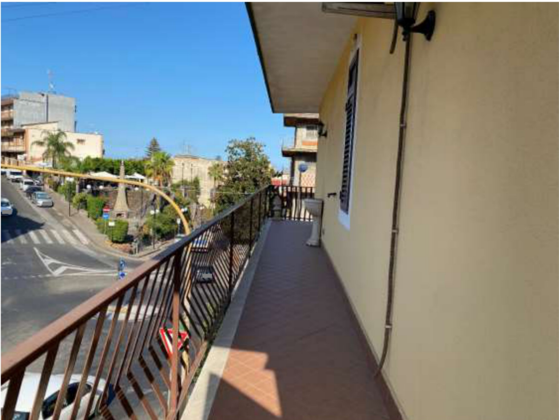
Foto 22 – Balcone lato nord e vista della via Petralia e della via Santa Maria del Sangue