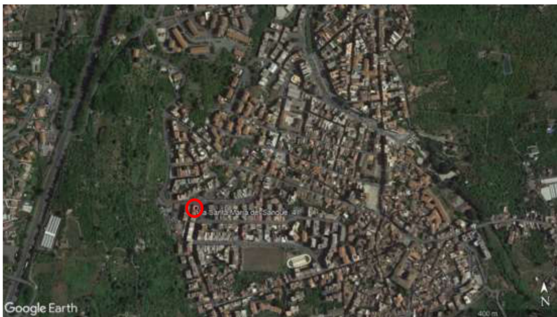
Foto 1 – Vista aerea della porzione di territorio del Comune di Aci Catena comprendente il fabbricato a cui appartengono gli immobili pignorati