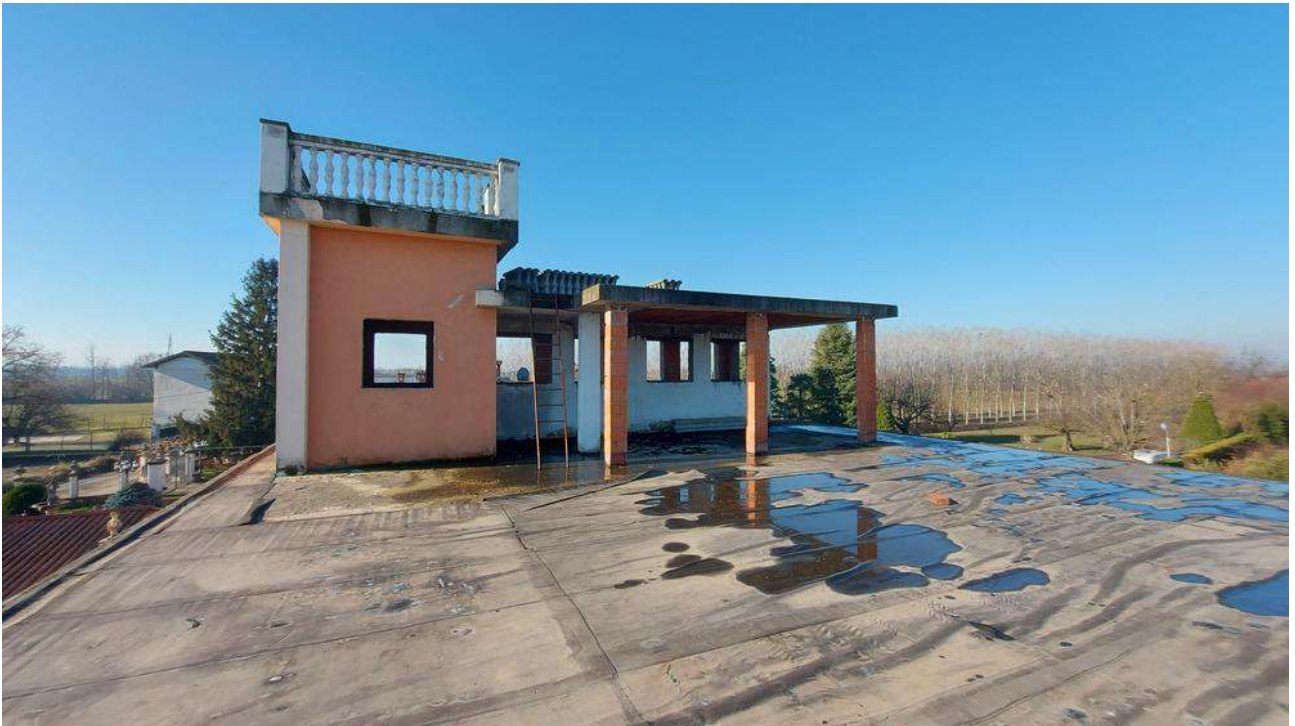
Foto 14 – Vista della torretta dal lastrico solare al piano 2 (sub 2 corpo C)