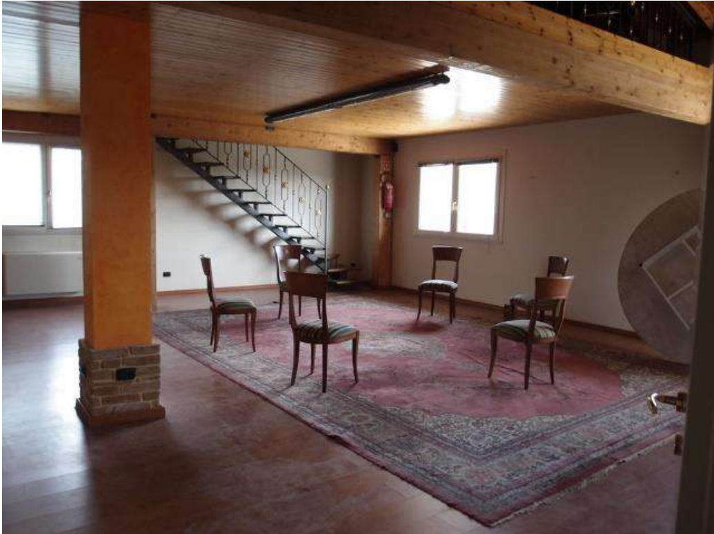
Foto 9 – Vista del locale di sgombero con soppalco al piano primo (sub 7 corpo A)