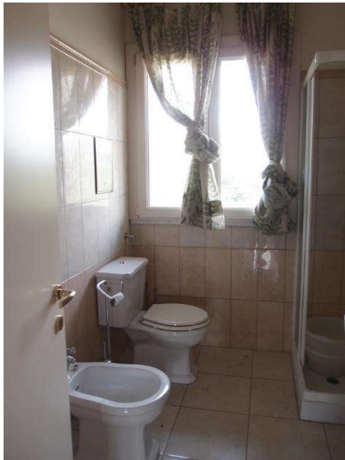
Foto 10 – Vista del servizio igienico al primo piano (sub 7 corpo A)