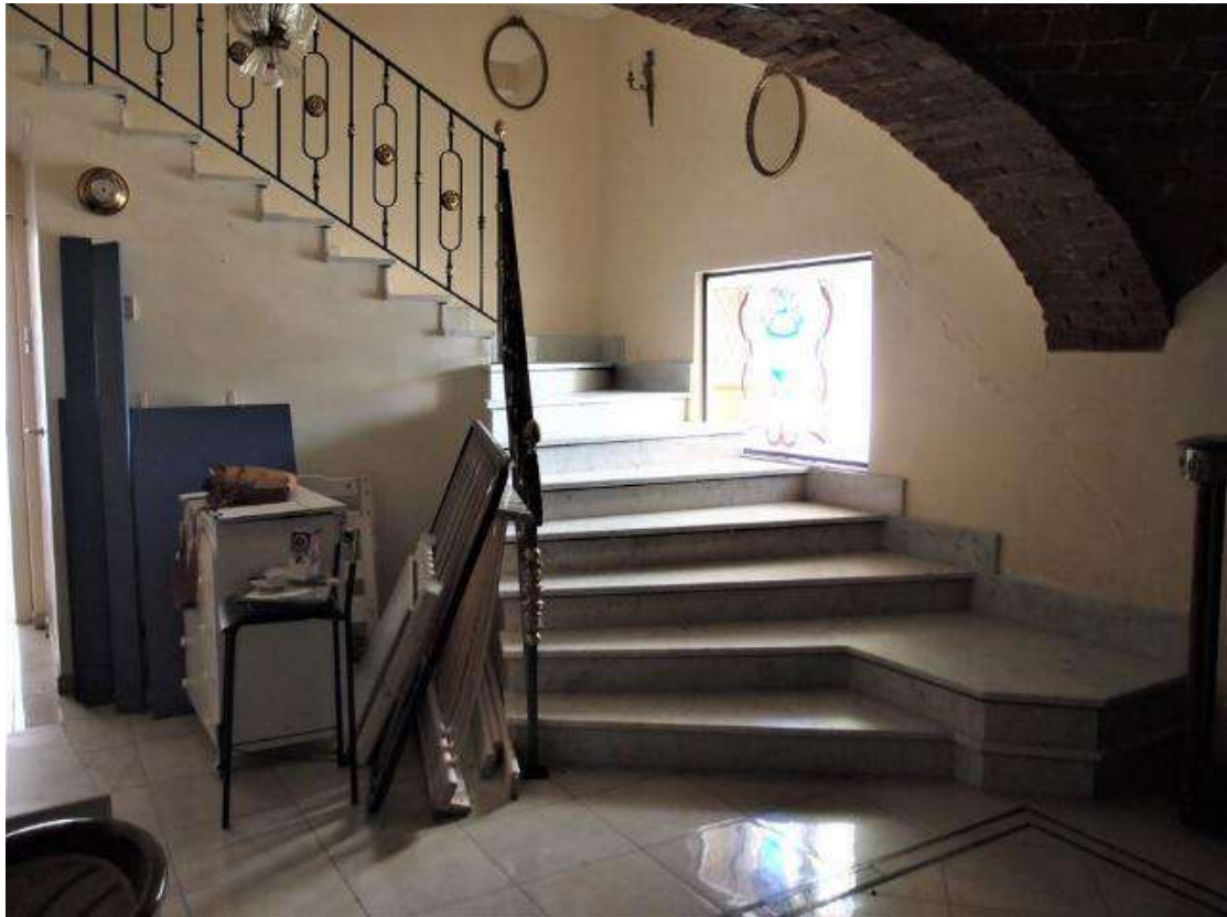
Foto 6 – Vista dell'ingresso abitazione (sub 7 corpo A) al piano terra.