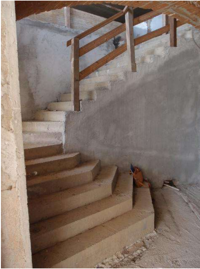
Foto 13 – Vista dell'ingresso con scala al piano terra (sub 2 corpo C)