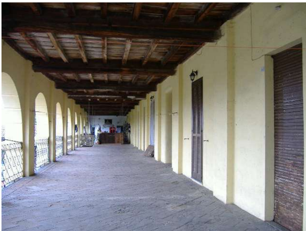
P.1 – Prospetto sud (ballatoio comune)