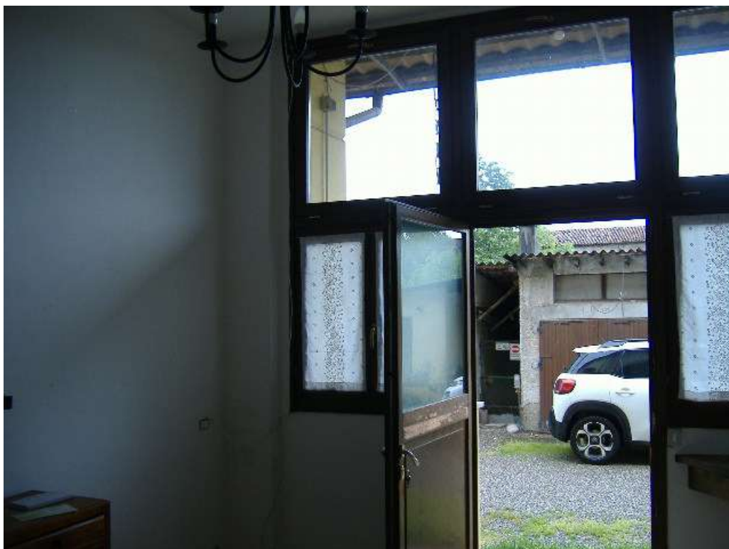
P.T – Zona giorno