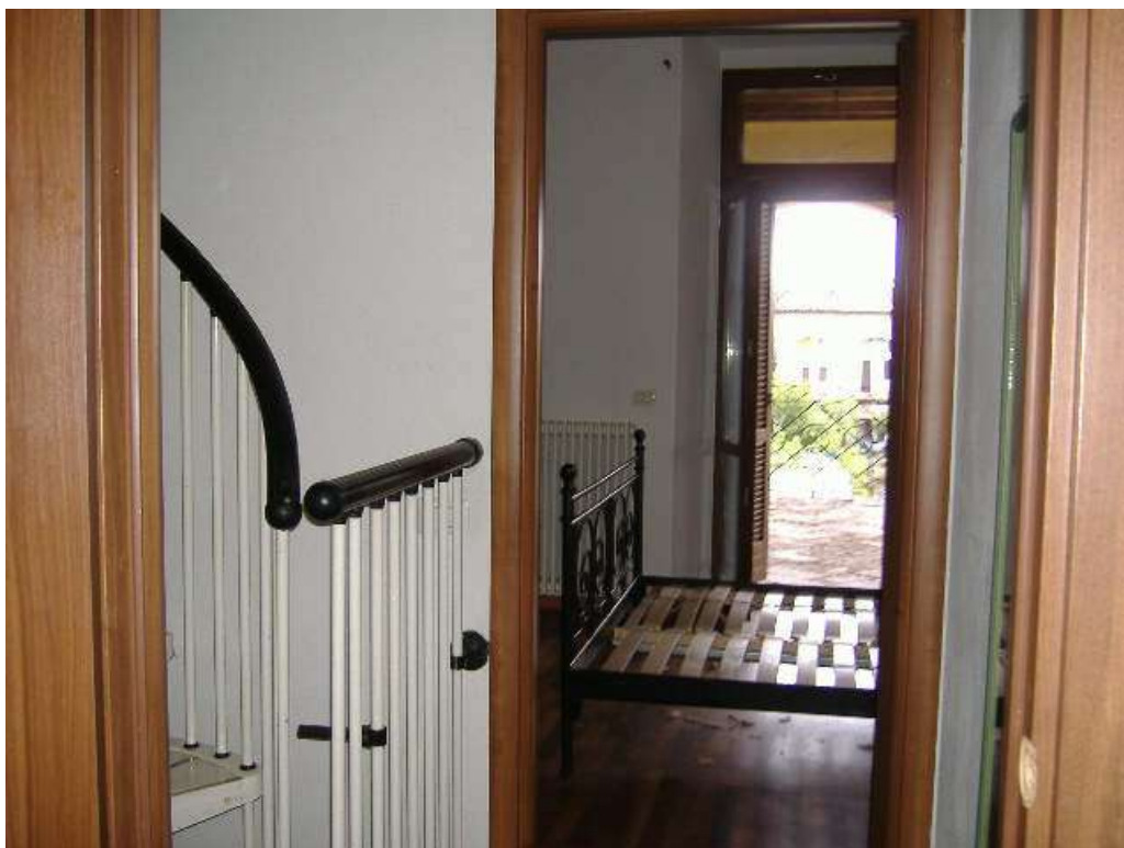
P.1 – Disimpegno