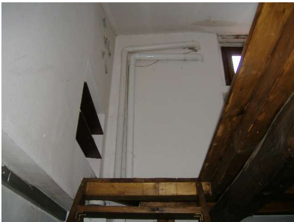
P.2 – Soppalco