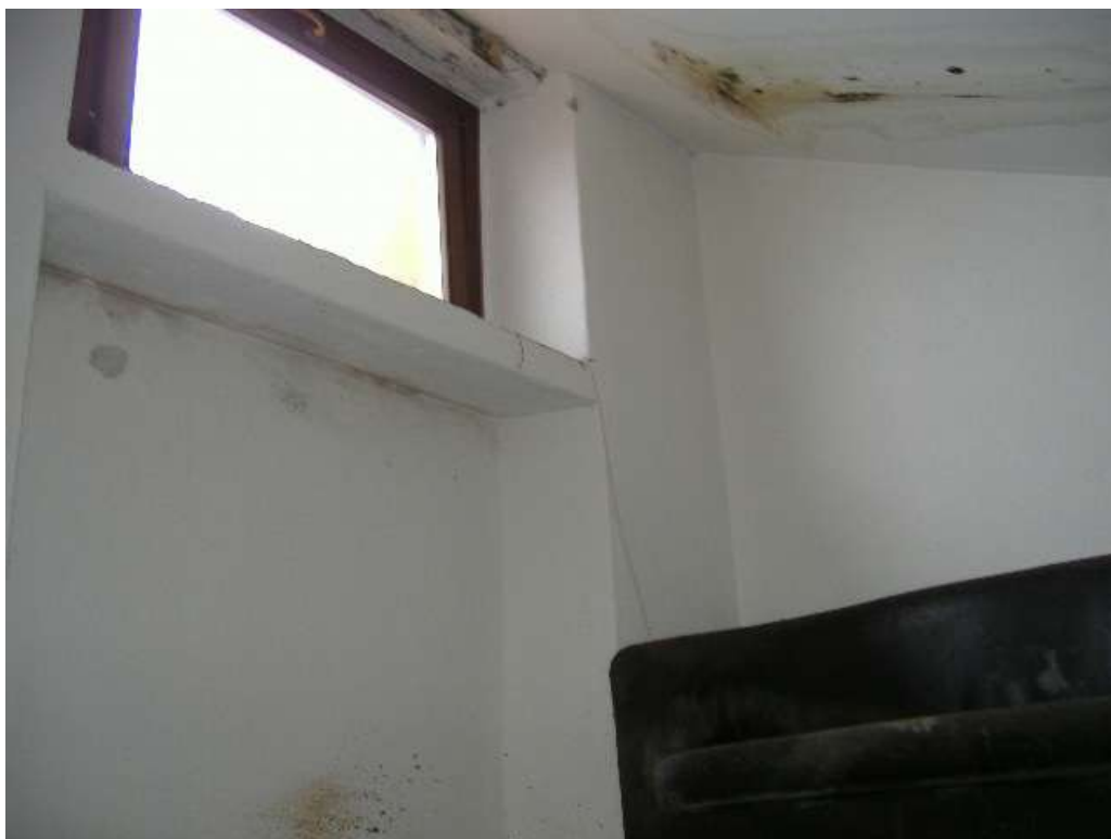
P.2 – Soppalco