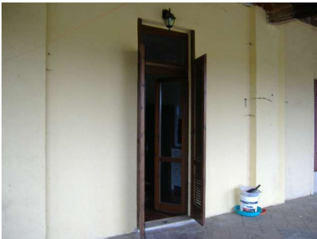
P.1 – Prospetto sud (lato camera)