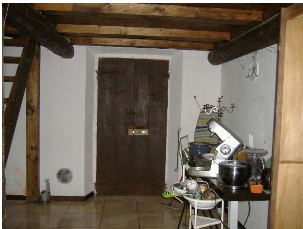
P.2 – Ripostiglio