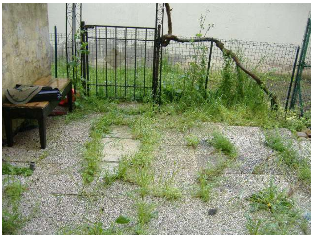
Area esclusiva (lato nord)