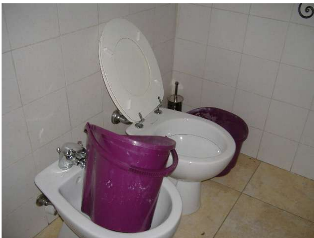
P.2 – Lavanderia