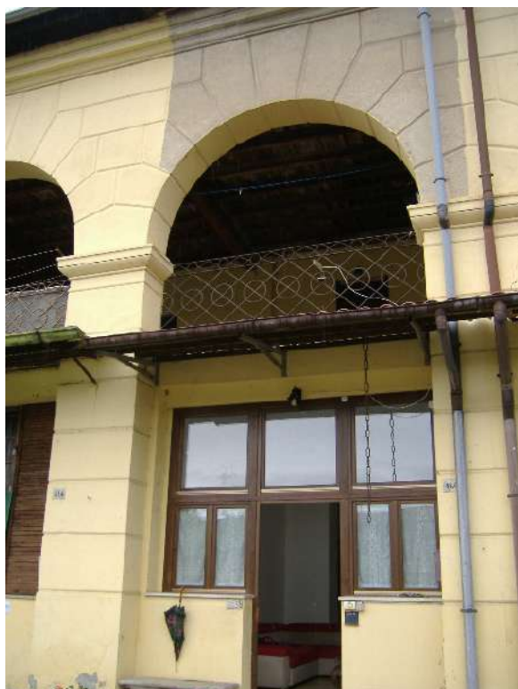
Prospecto sud P.T-1