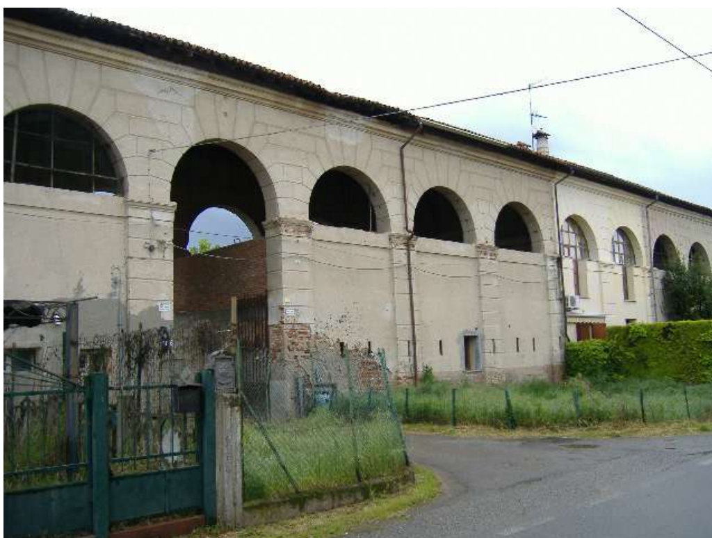
Accesso pedonale e carraio da via Garibaldi