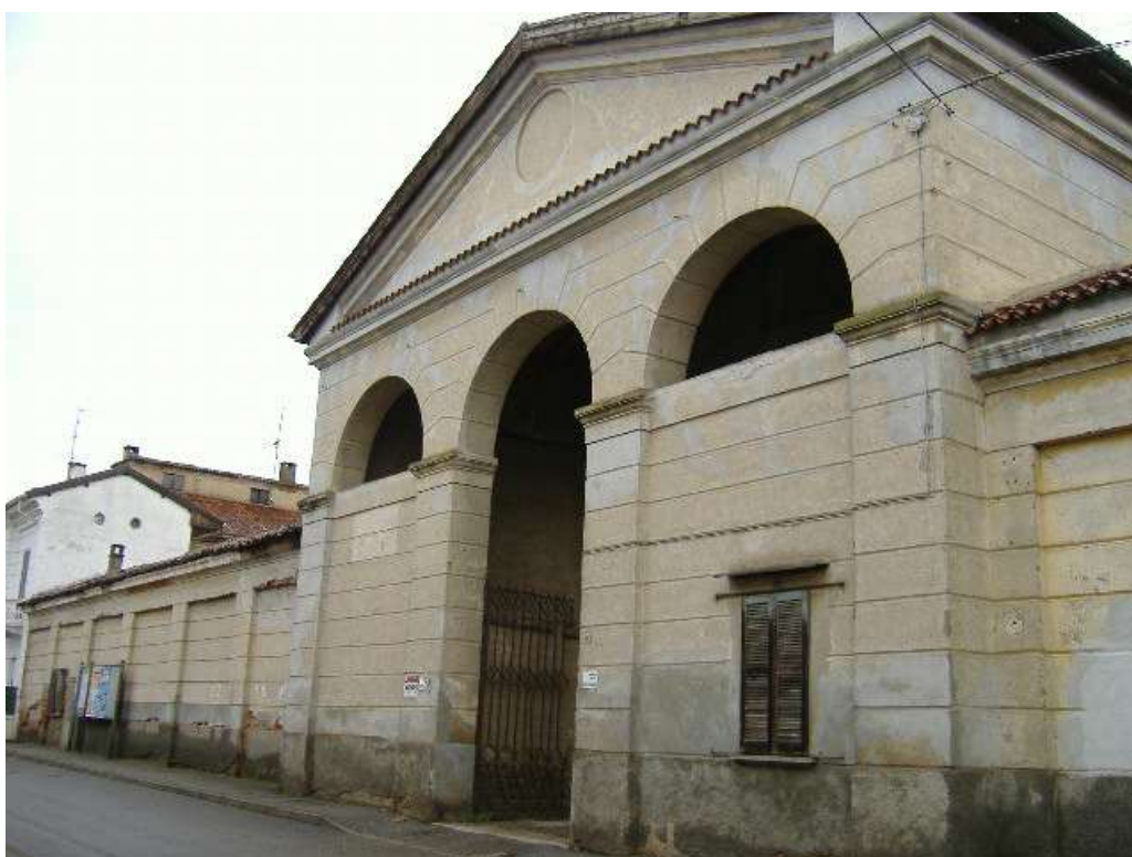
Accesso pedonale e carraio da via Arese n. 48