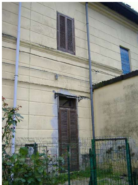
Prospecto nord P.T-1