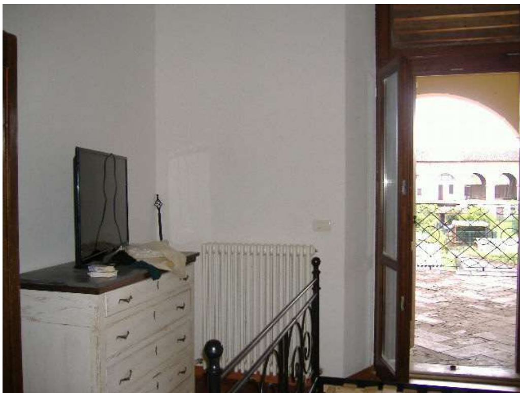
P.1 – Camera (lato ballatoio comune)