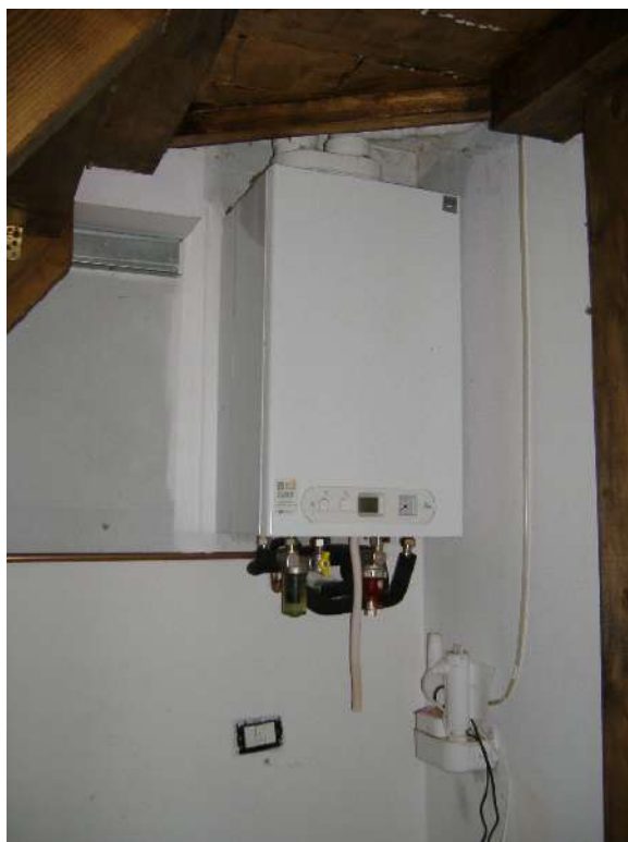
P.2 – Ripostiglio