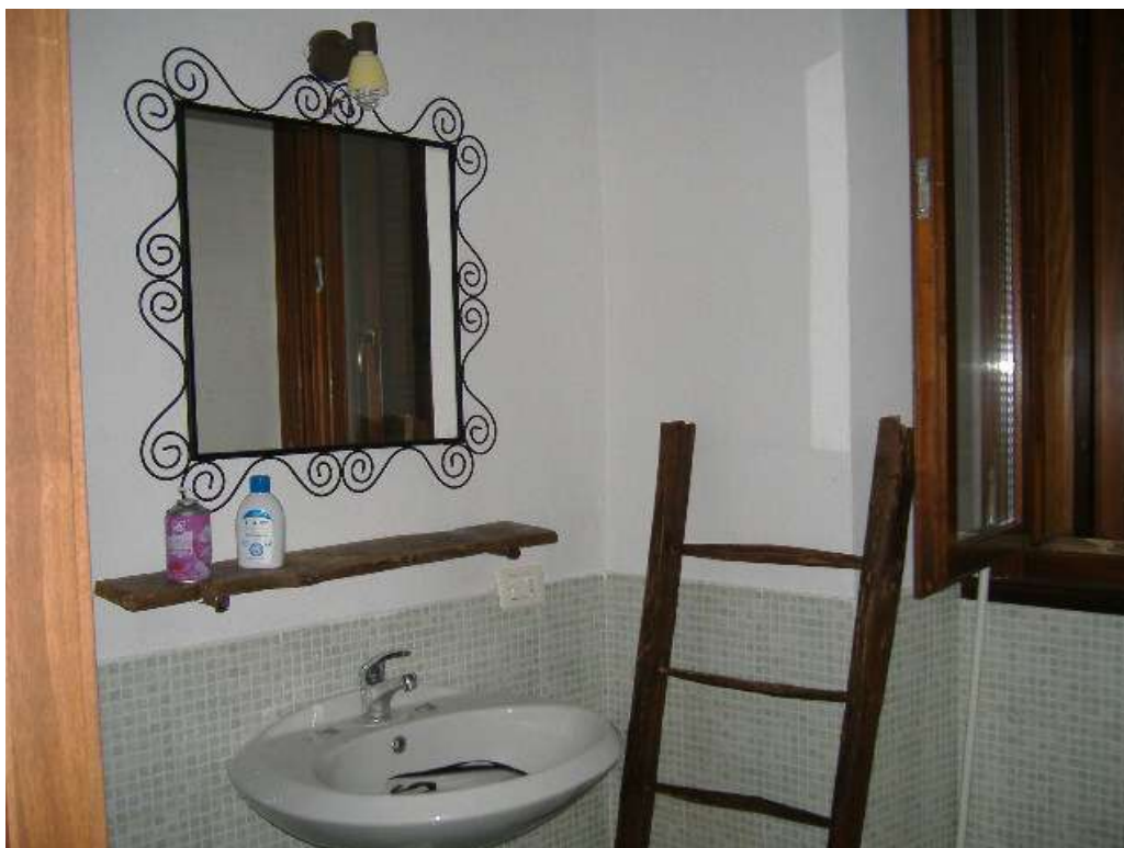
P.1 – Bagno (lato nord)