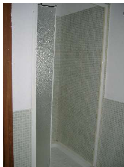
P.1 – Bagno