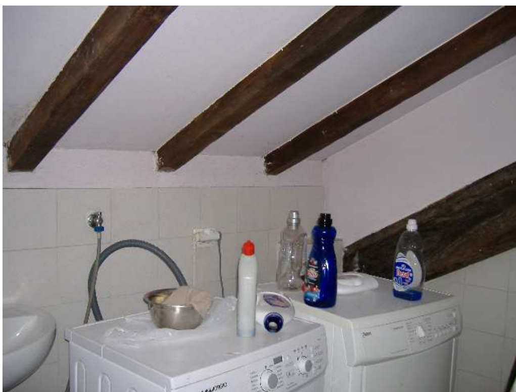
P.2 – Lavanderia