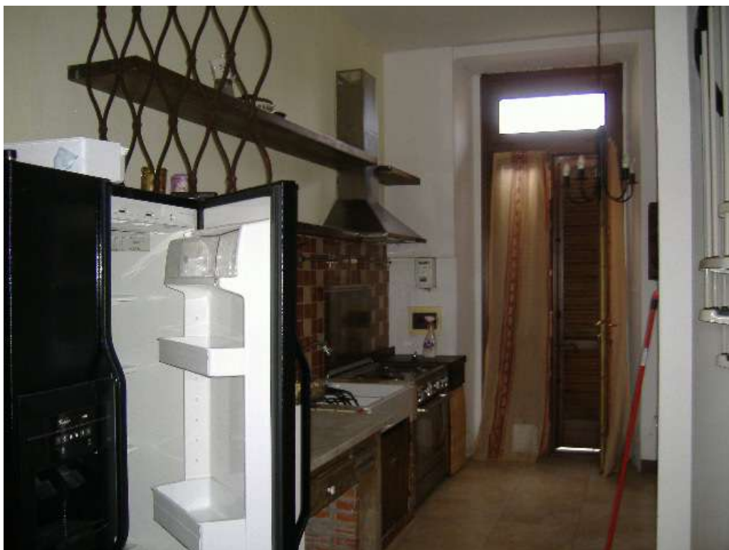
P.T – Angolo cottura