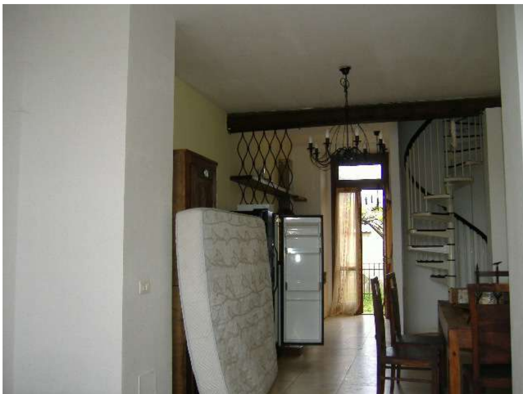
P.T – Pranzo e angolo cottura