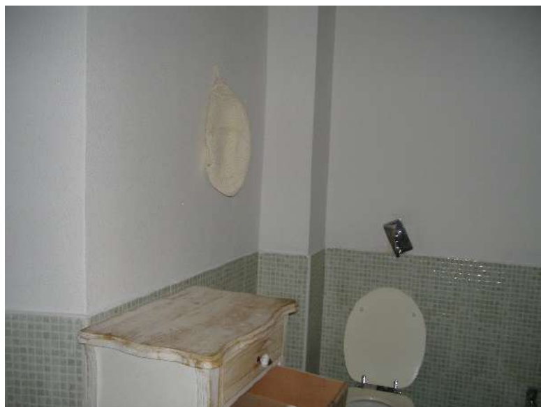
P.1 – Bagno