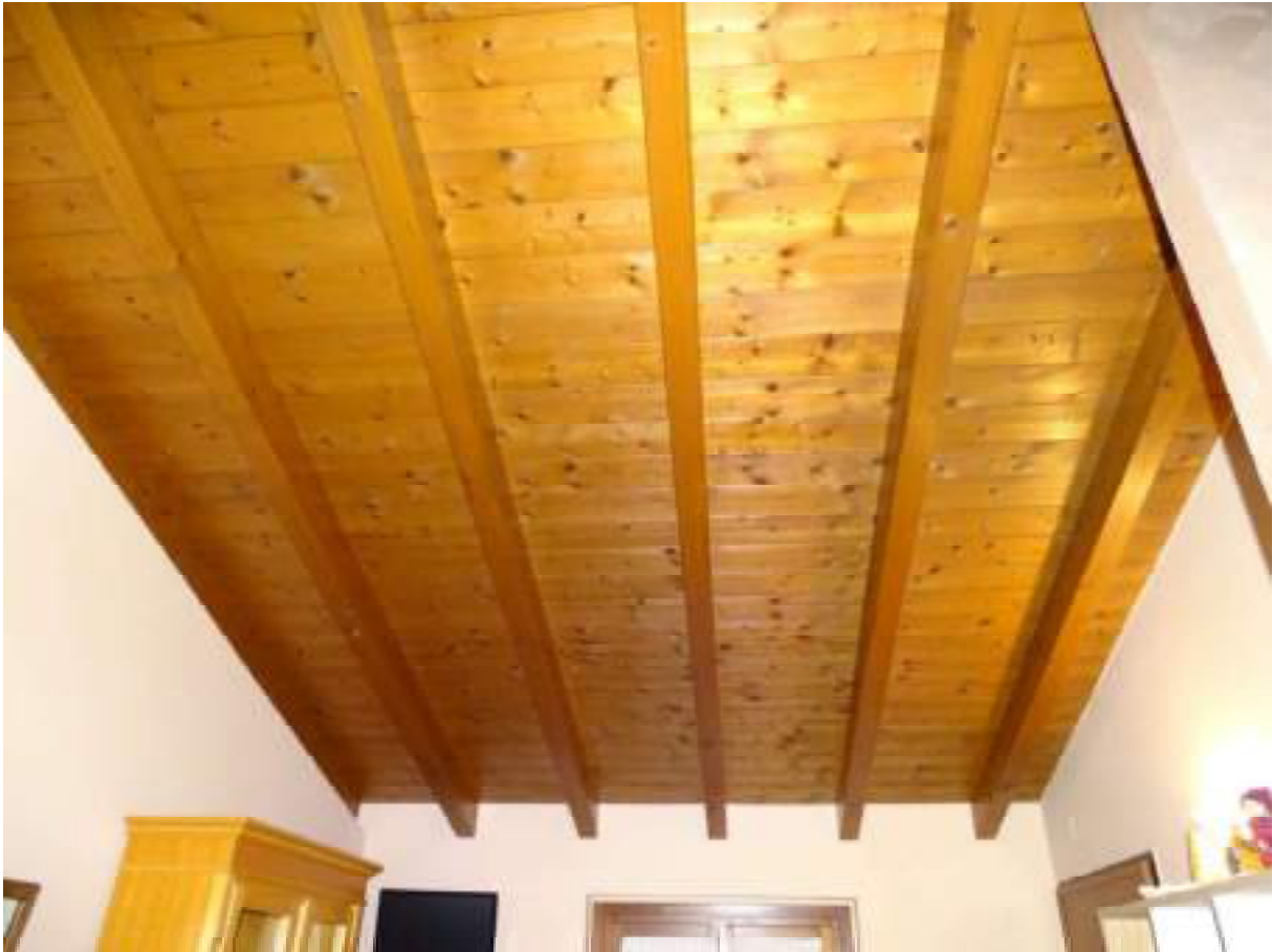
Particolare del tetto