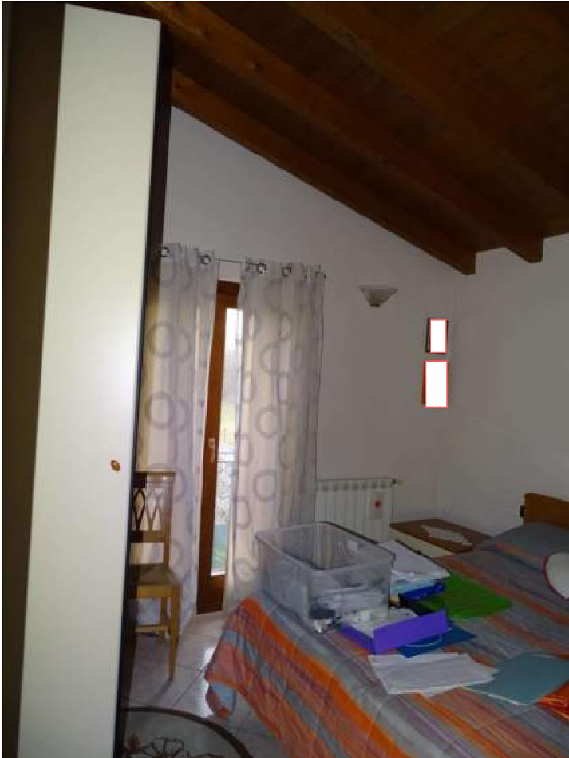
Camera da letto matrimoniale