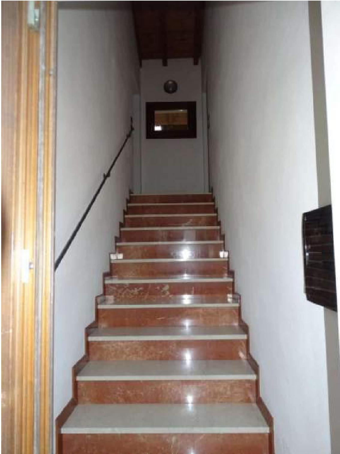
Vano scala comune d'accesso al piano primo