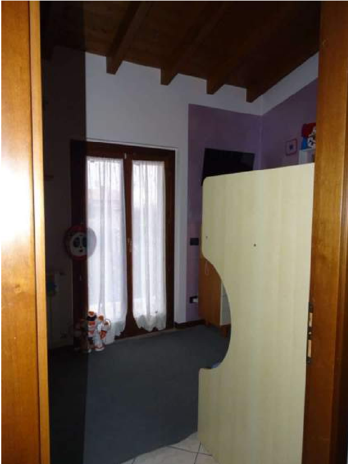
Camera da letto con letto a castello