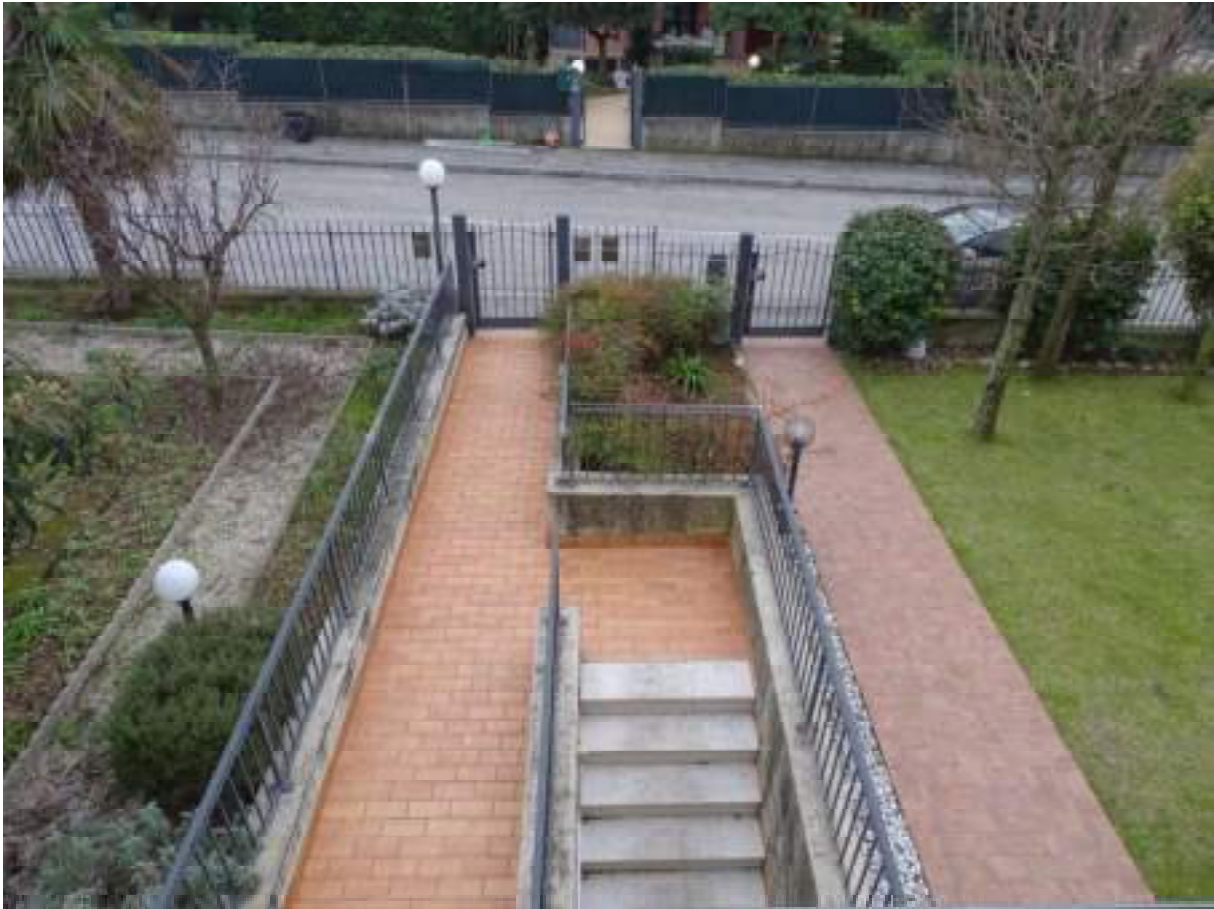
Veduta dal terrazzo