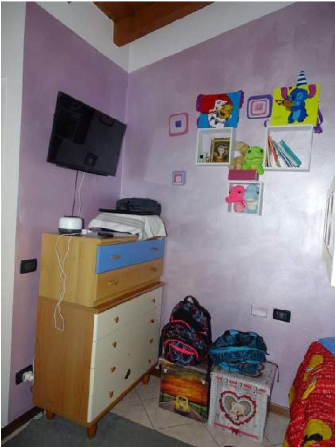
Camera da letto con letto a castello