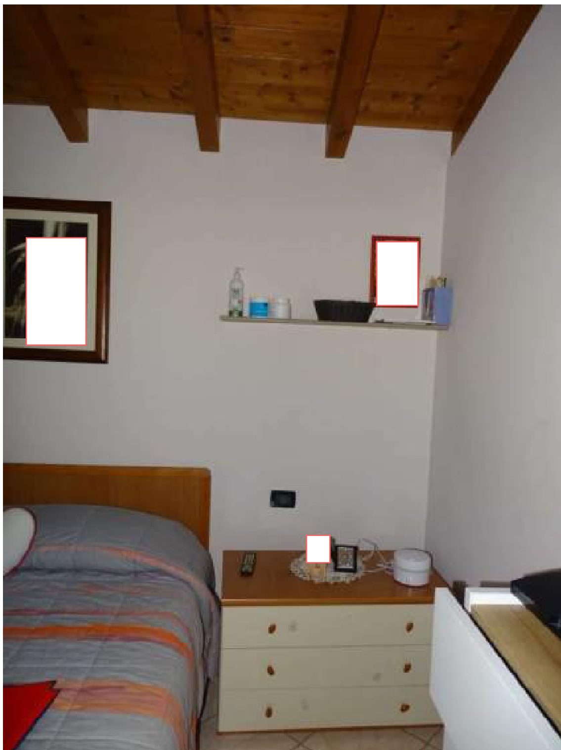
Camera da letto matrimoniale