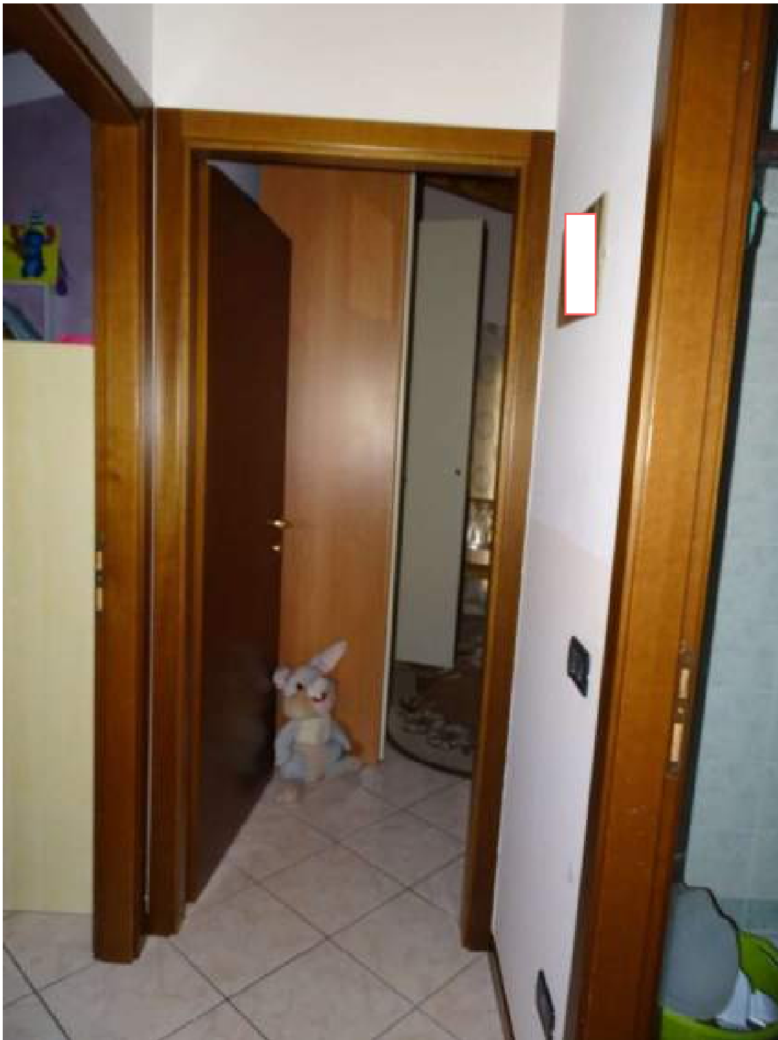
Corridoio d'accesso alla zona notte