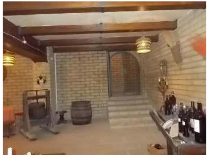
accesso al piano interrato