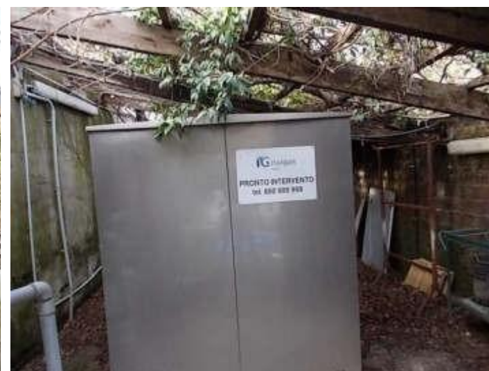
deposito attrezzi e locali tecnologici