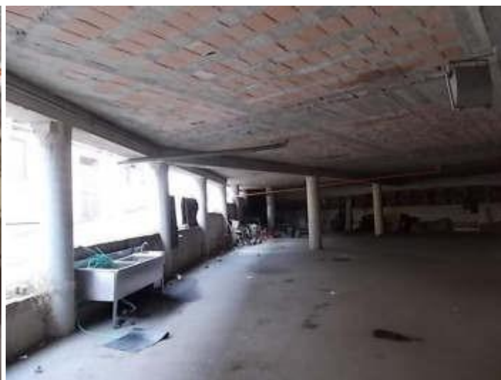
viste parcheggio coperto