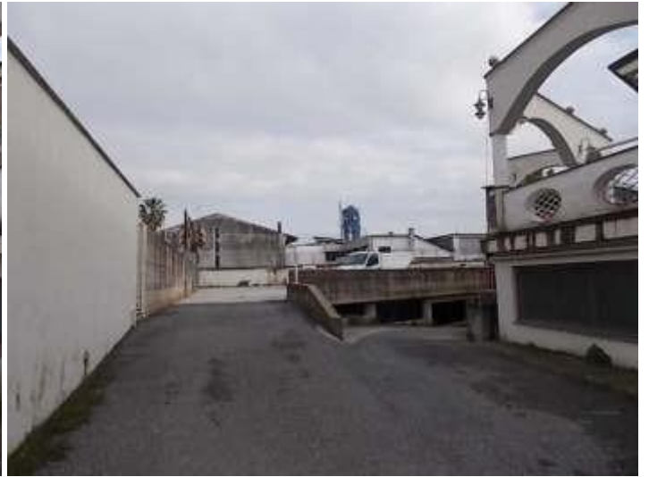
viale di accesso al parcheggio scoperto