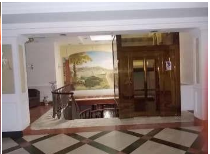
scala ed ascensore di collegamento tra i piani