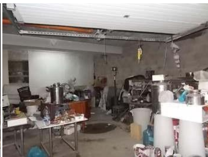
locali depositi ricavati nel parcheggio coperto