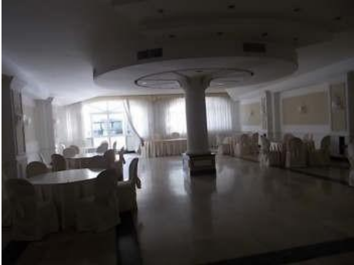
sala ristorante n. 5