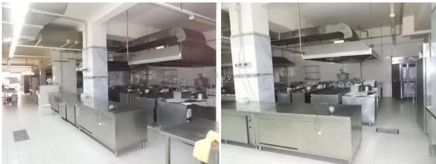
altre viste della cucina al piano rialzato