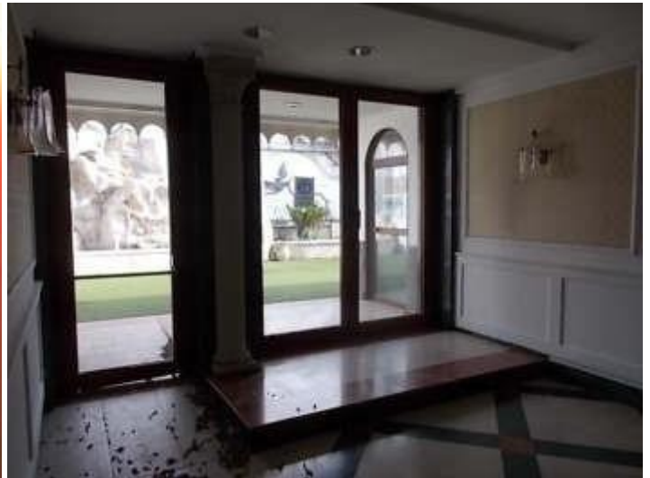
disimpegno delle sale ristorante ed uscita ai terrazzi esterni