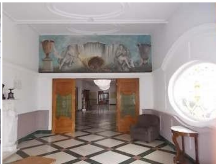
ingresso al piano rialzato