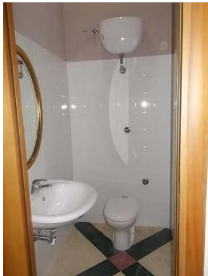
locale di servizio e w.c. nel corridoio di disimpegno