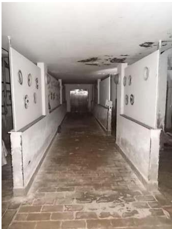
disimpegno e montacarichi