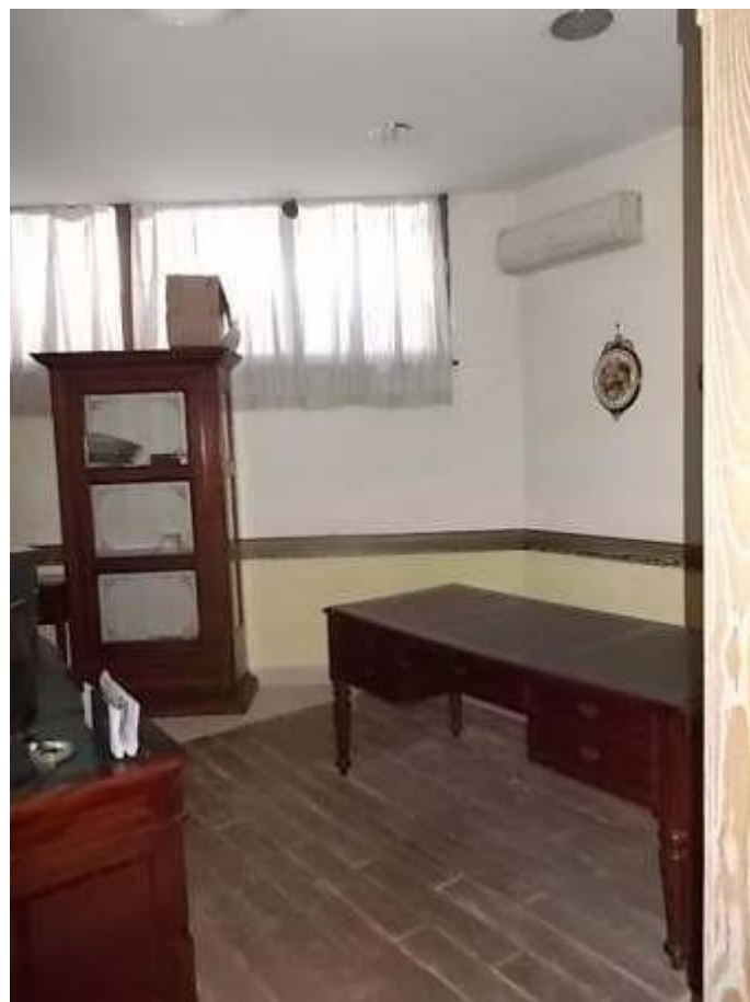
viste degli uffici e dei servizi annessi