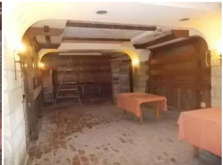
viste della cantina