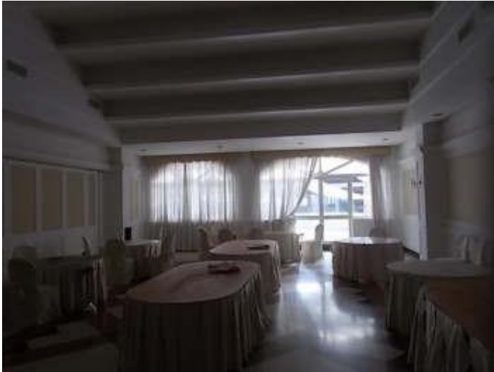
sala ristorante n. 4