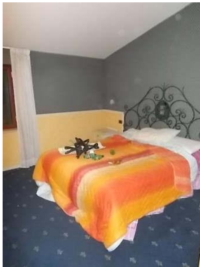
viste camera n. 2