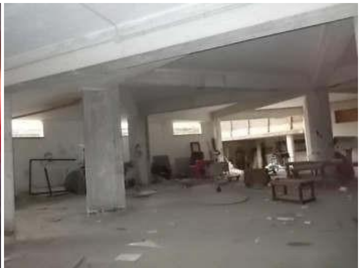
viste locale allo stato grezzo