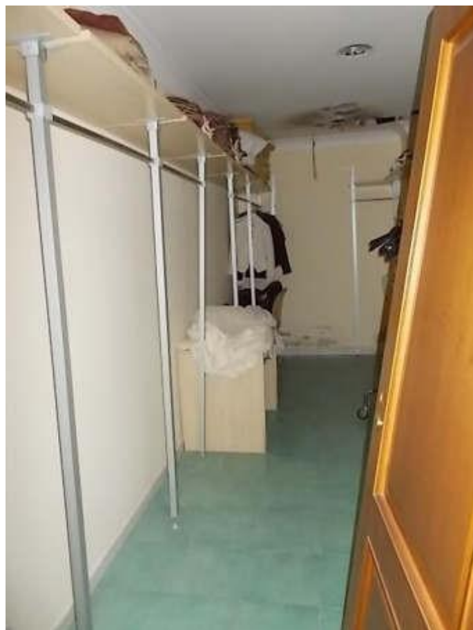
disimpegno, guardaroba ei spogliatoi