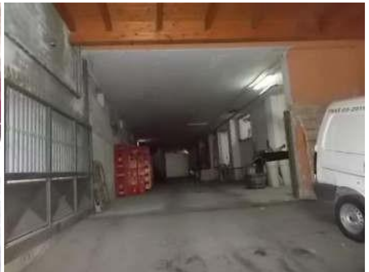
viabilità coperta ed accesso ai locali di servizio, si noti la parte di solaio in legno