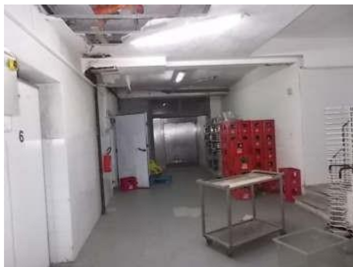
scala di servizio e montacarichi di collegamento tra i piani