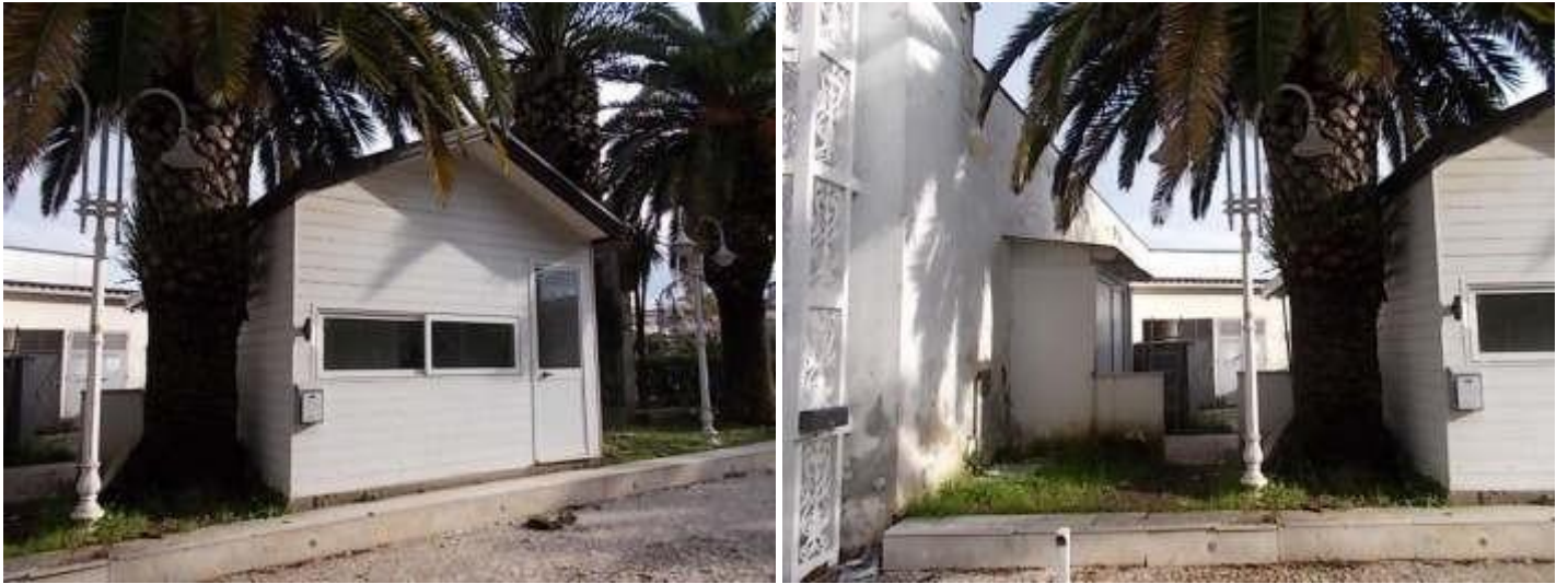
portineria e locali tecnologici posti a destra del cancello d'ingresso