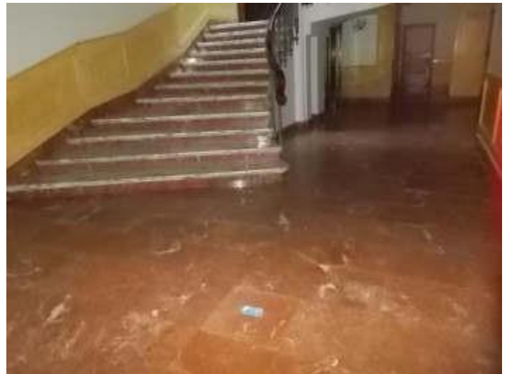
viste atrio al piano seminterrato nei pressi della scala e dell'ascensore ove è posto uno dei pozzetti di raccordo del collettore fognario