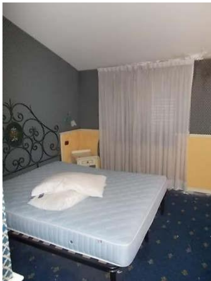
viste camera n. 3