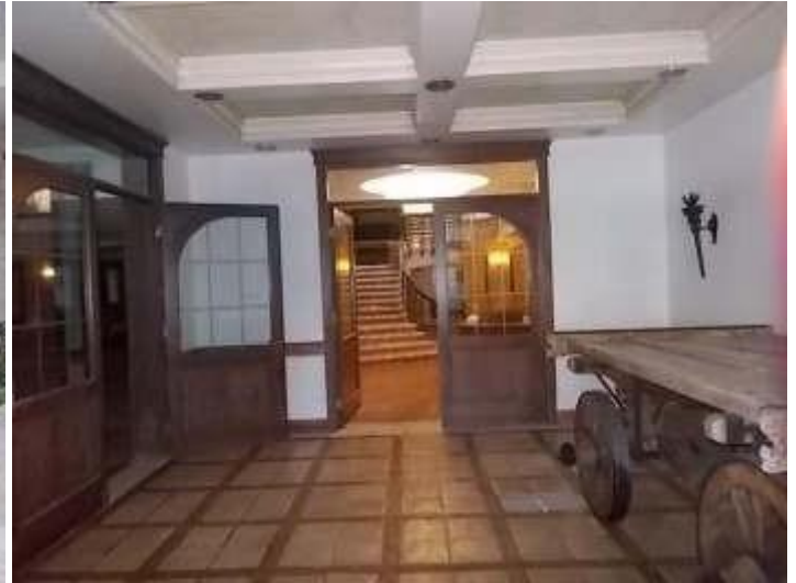
ingresso al piano seminterrato