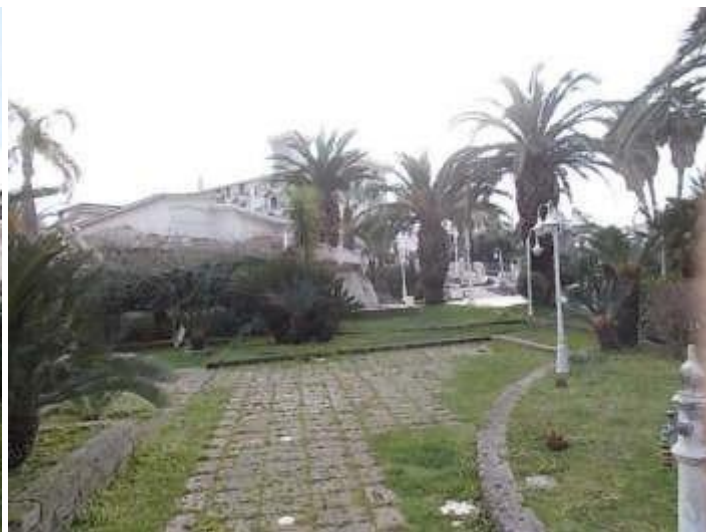
zona a giardino