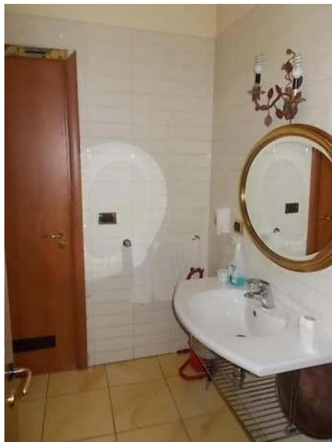
altra vista uffici e w.c. interno