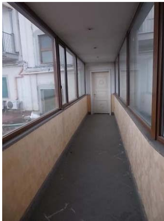
viste del camminamento coperto di collegamento alla struttura alberghiera estranea al fallimento