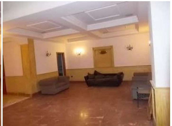
accesso ai servizi igienici al guardaroba ed agli spogliatoi per il personale