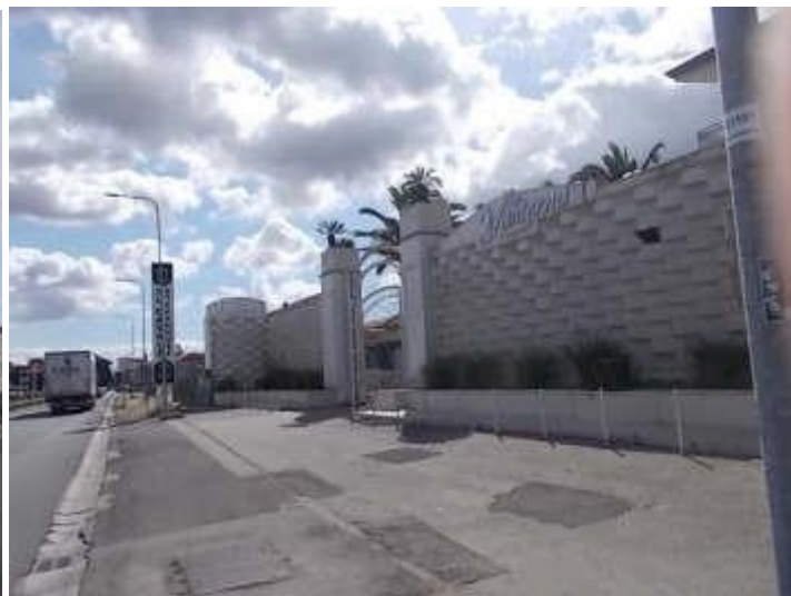
ingresso al ristorante visto dalla strada