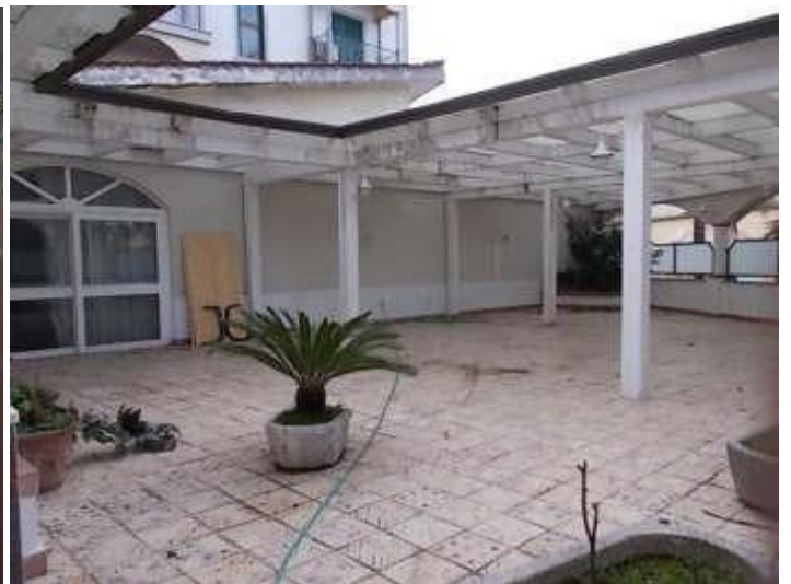
terrazzo posto a destra dell'ingresso