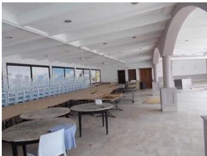
particolare delle zone coperte