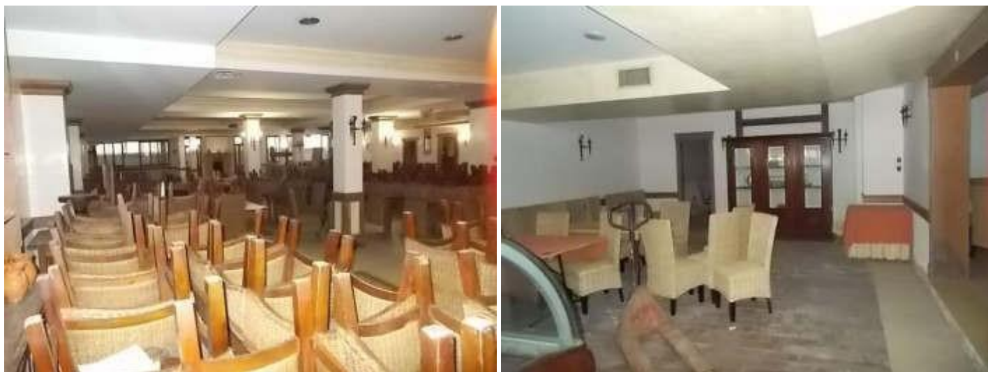
altre viste della sala ristorante