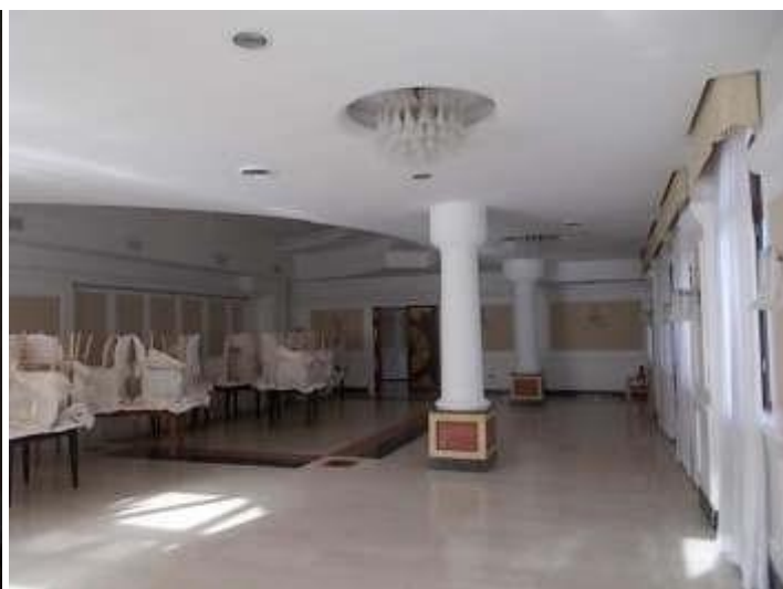
sala ristorante n. 3