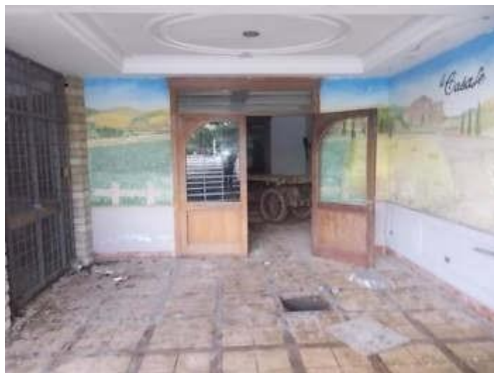
viste dell'ingresso al piano seminterrato dove sono posti alcuni pozzetti di intercettazione del collettore fognario