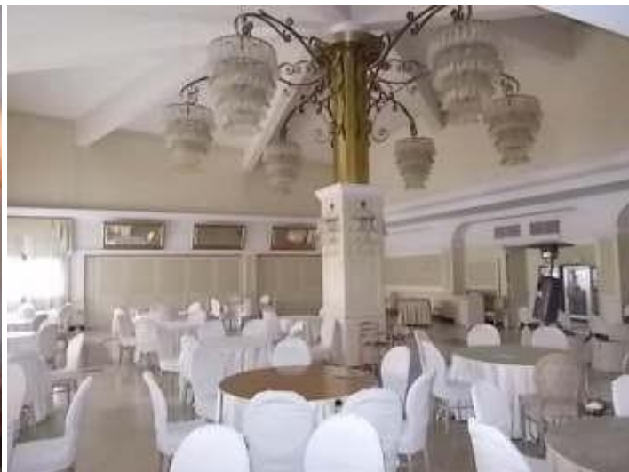
sala ristorante n. 1