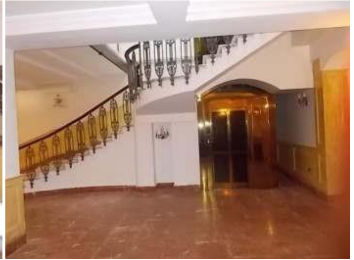
atrio, scala ed ascensore di collegamento al piano seminterrato