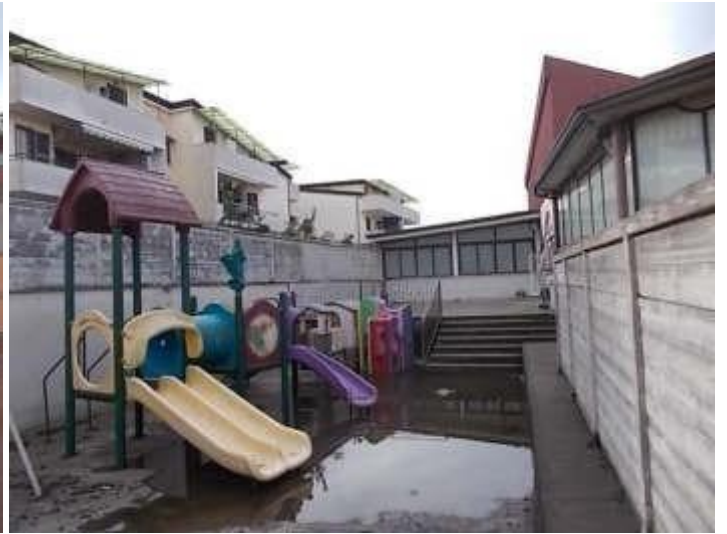
aree esterne poste tra il confine sud ed i terrazzi posteriori