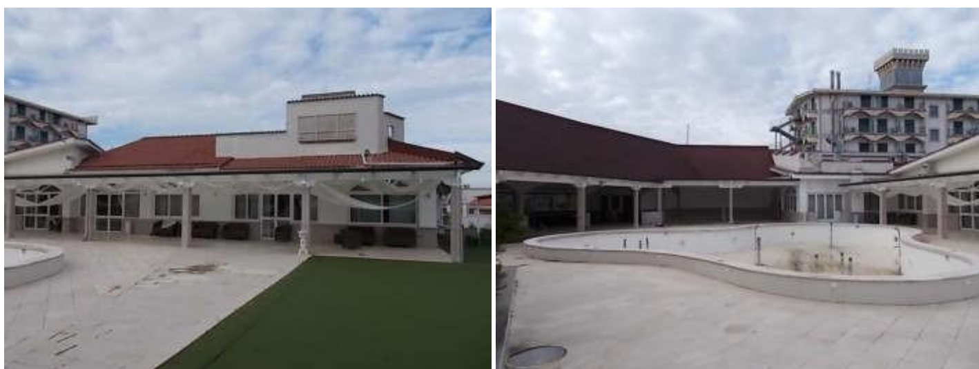
altre viste dei terrazzi