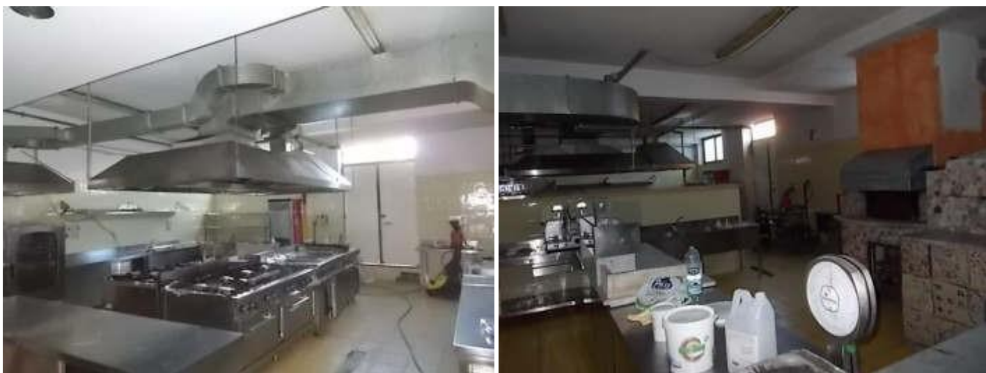
viste della cucina al piano seminterrato