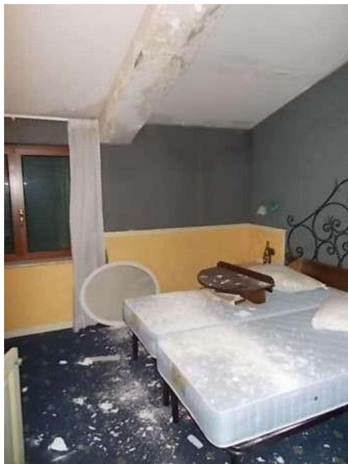
viste camera n. 4