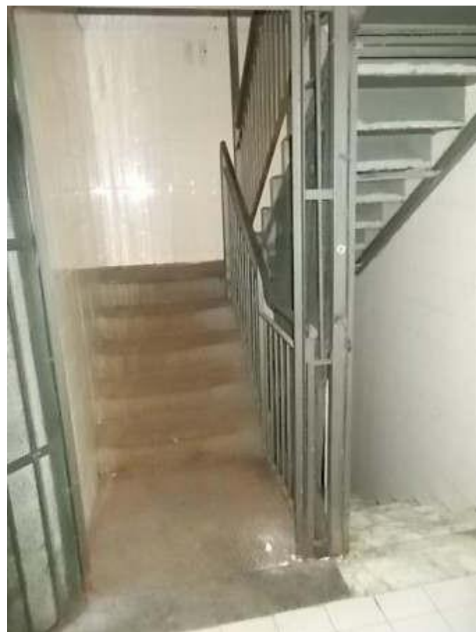
scala di collegamento con i locali di servizio al piano seminterrato