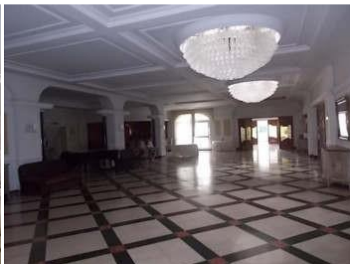
viste della hall