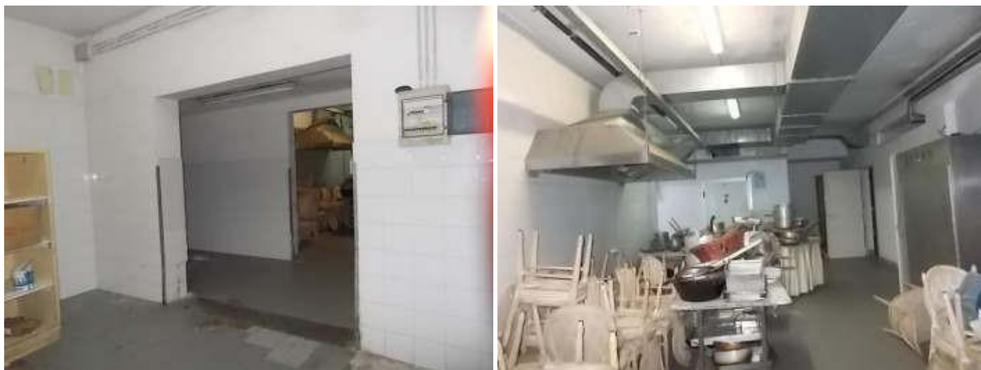
viste locali di servizio