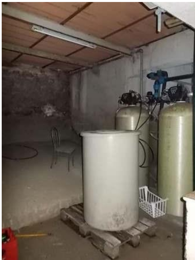
locale serbatoi e scala di collegamento tra i piani