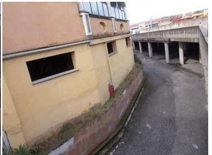
rampa di accesso al parcheggio coperto ed ai locali di servizio