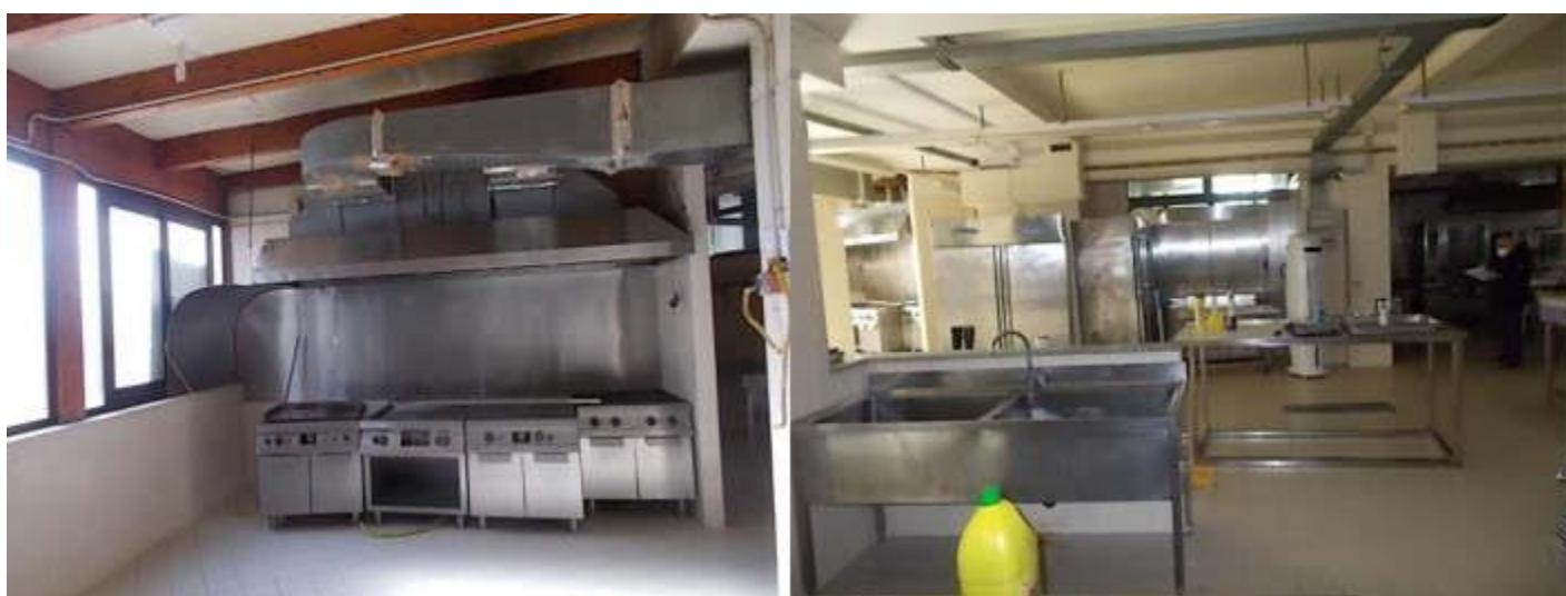
cucina e zona montacarichi