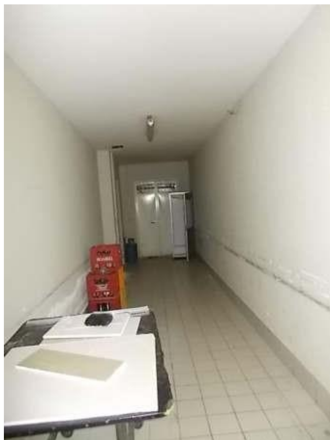
disimpegno locali di servizio