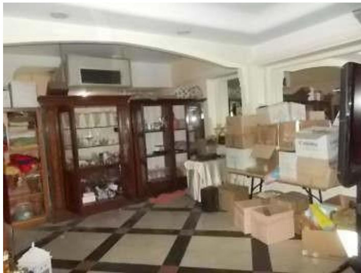
locale espositivo con ingresso dalla hall