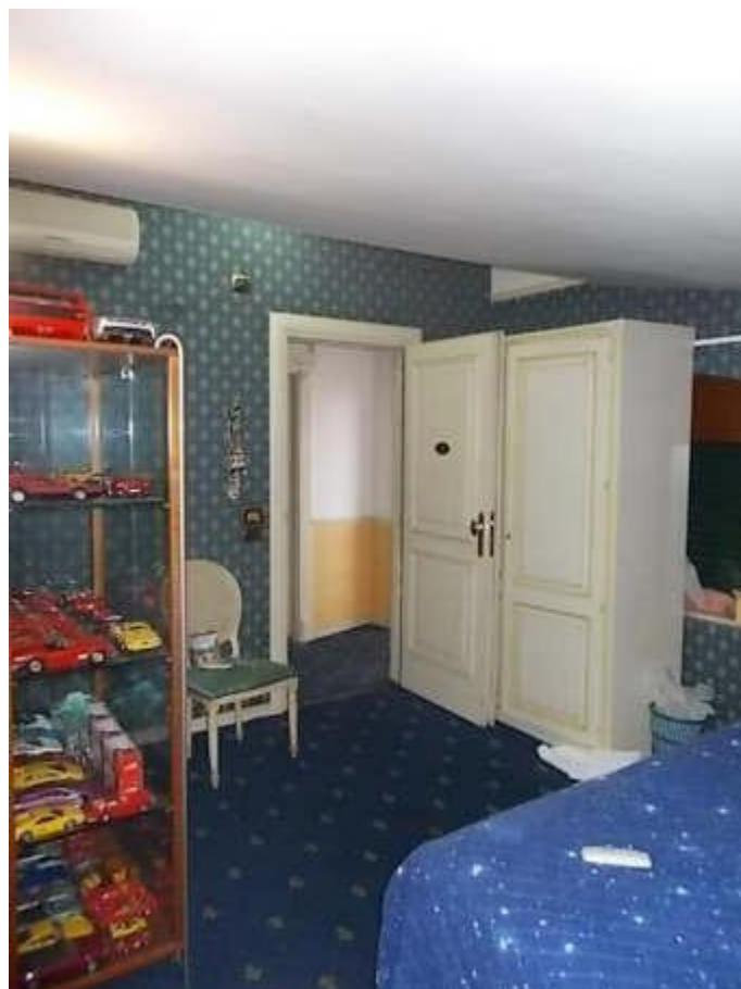
viste camera n. 6