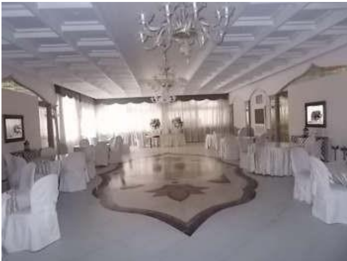
sala ristorante n. 6