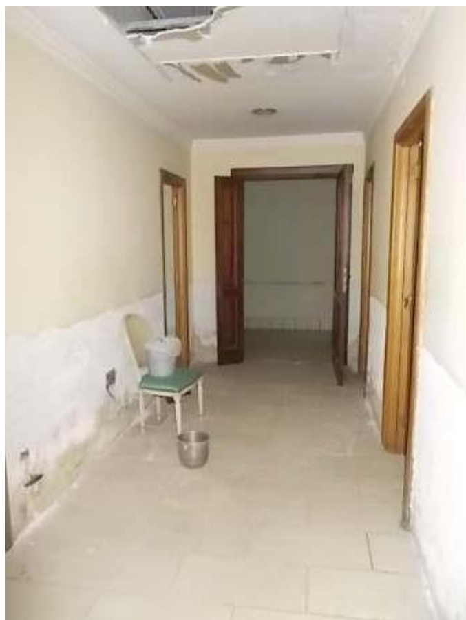
blocco servizi igienici in disuso