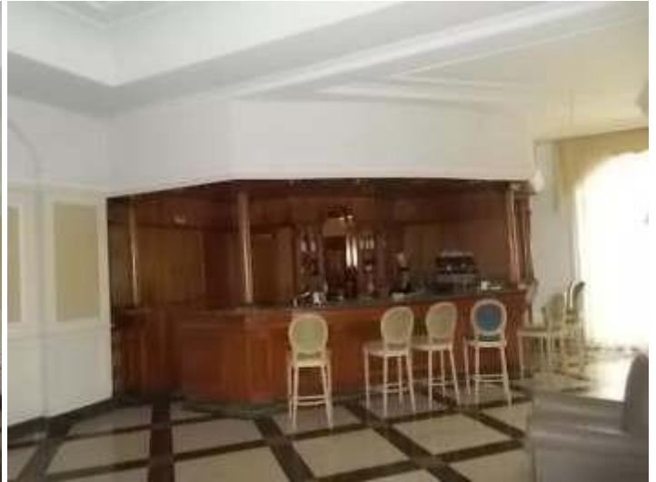
altre viste della hall e angolo bar