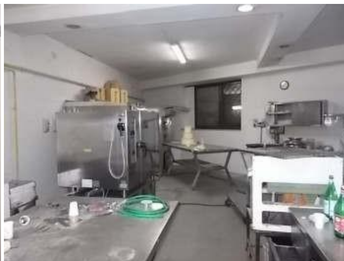
laboratorio di pasticceria