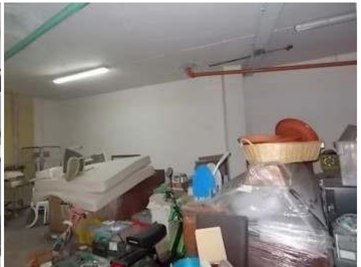
depositi – dispense