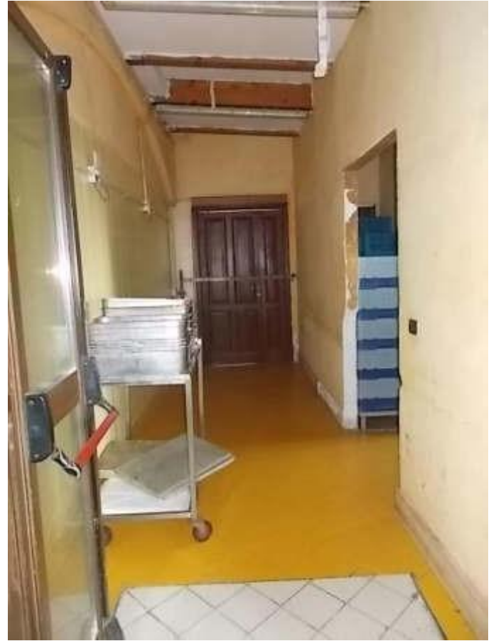
deposito ed accesso ai terrazzi dalla cucina