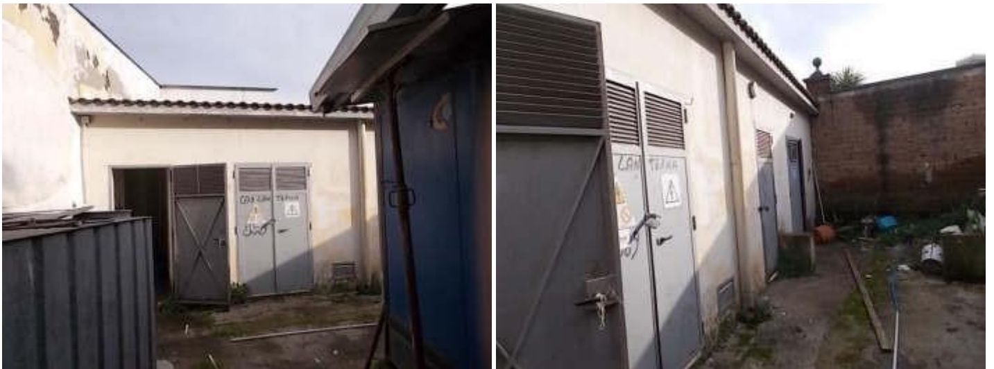
locali tecnologici e gruppo elettrogeno