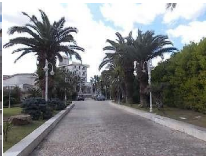
cancello d'ingresso dalla strada e viale di accesso