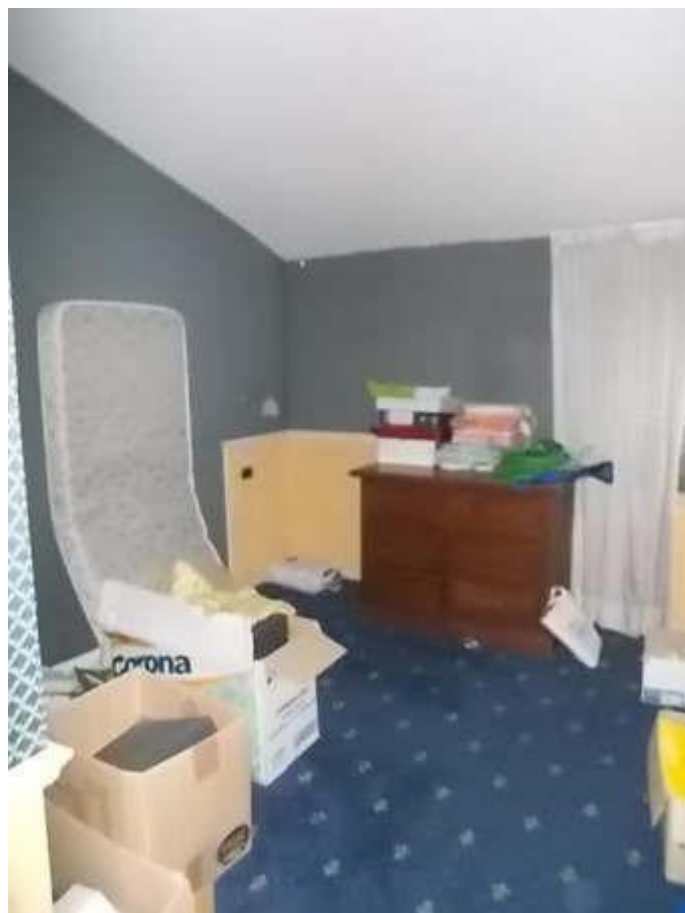
viste camera n. 1