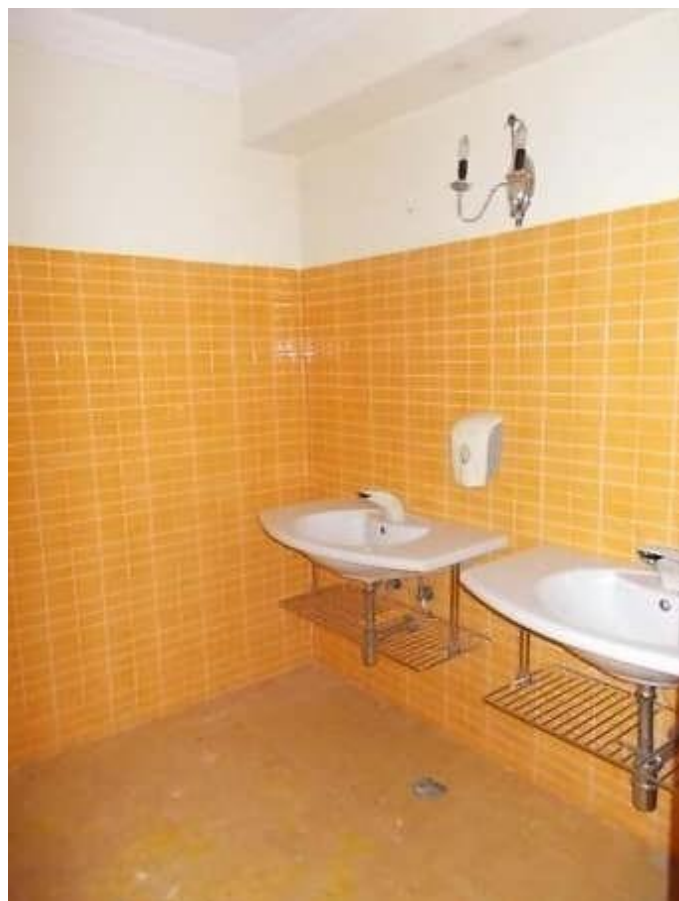
altre viste blocco servizi igienici in disuso