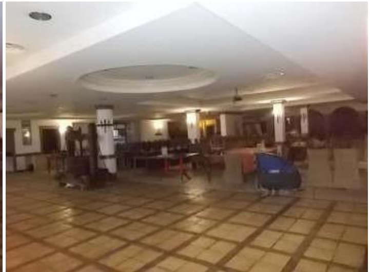
viste della sala ristorante