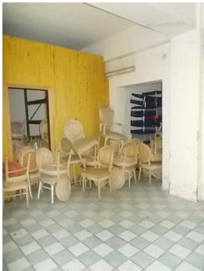
viste depositi e locali di sgombero