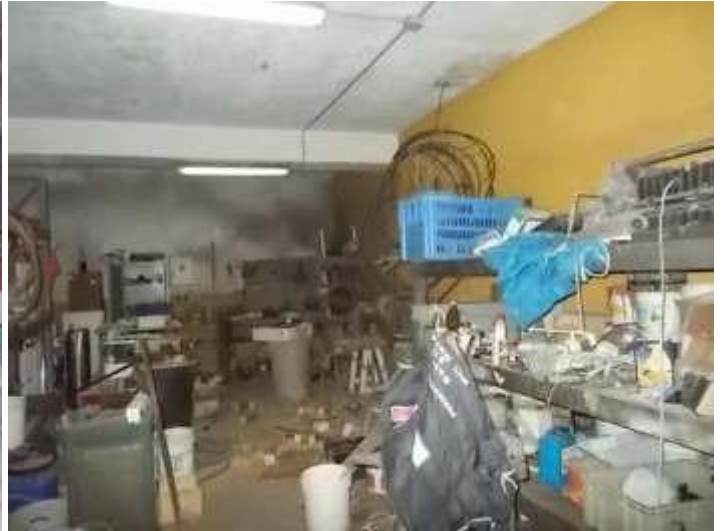
locali depositi ricavati nel parcheggio coperto