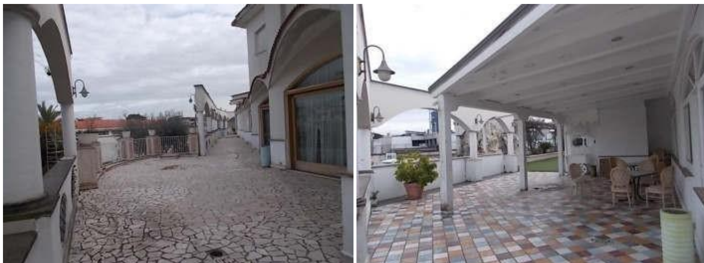
viste dei terrazzi laterali e posteriori alle sale ristorante