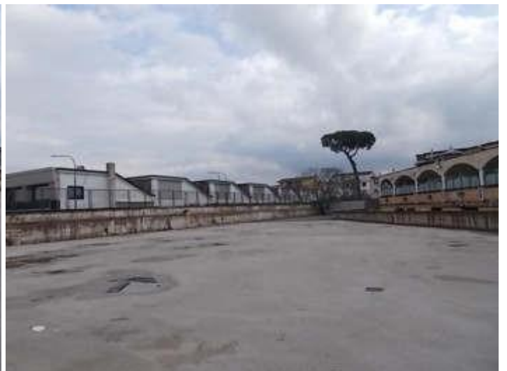
viste del parcheggio scoperto si noti la porta di collegamento con il complesso confinante da chiudere