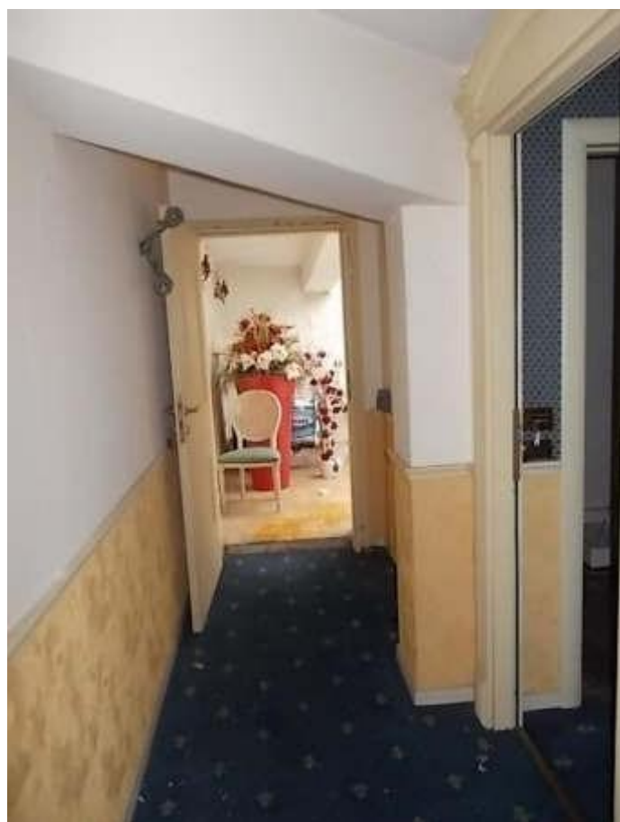
corridoio di disimpegno di accesso alle camere