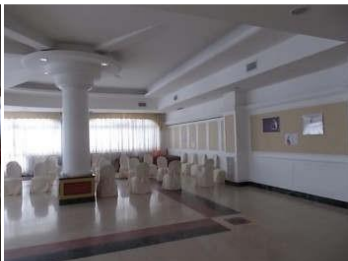
sala ristorante n. 2