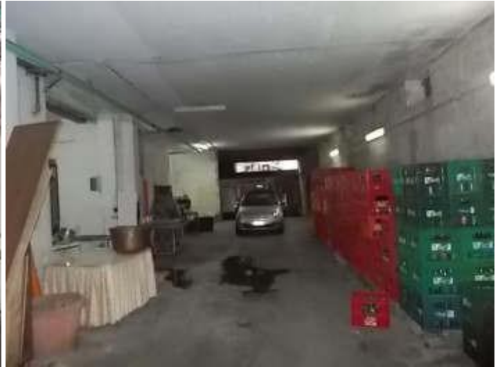
disimpegno movimentazione merci