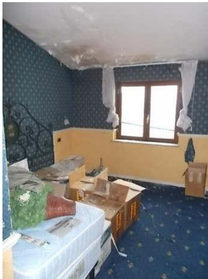
viste camera n. 5