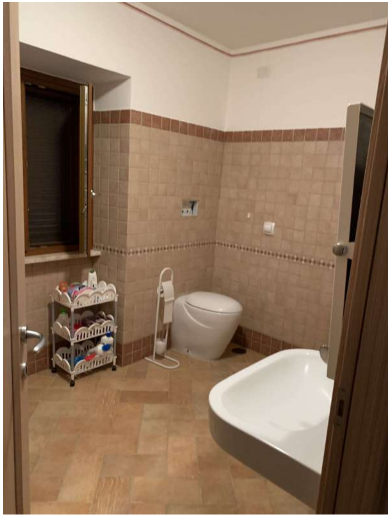
13 Fabbricato piano terra - agriturismo

58100 GROSSETO, VIA ROMA N° 3 - CELL. +393476223950