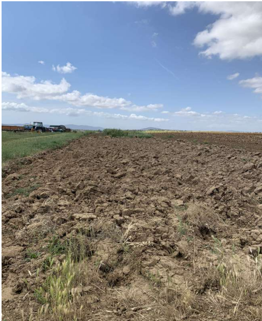
33 – Terreni seminativi, terreni preparati per le semine

58100 GROSSETO, VIA ROMA N° 3 - CELL. +393476223950