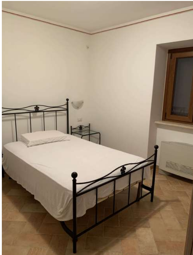
14 Fabbricato piano terra - agriturismo

58100 GROSSETO, VIA ROMA N° 3 - CELL. +393476223950