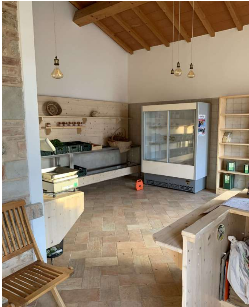
24 – Fabbricato B – interno – vendita

58100 GROSSETO, VIA ROMA N° 3 - CELL. +393476223950