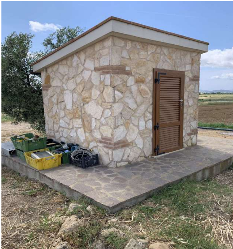
16 Piccolo volume tecnico

58100 GROSSETO, VIA ROMA N° 3 - CELL. +393476223950