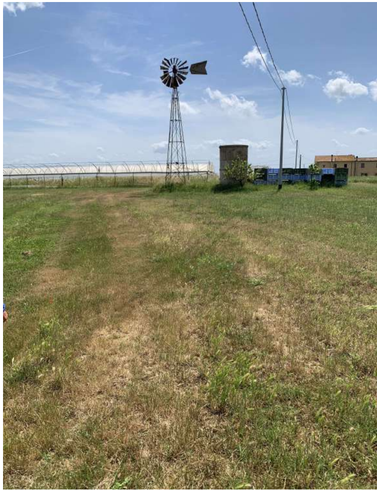
30 – Manufatto ex pozzo/cisterna, pompa a vento tipo Vivarelli, sullo sfondo le serre da demolire

58100 GROSSETO, VIA ROMA N° 3 - CELL. +393476223950