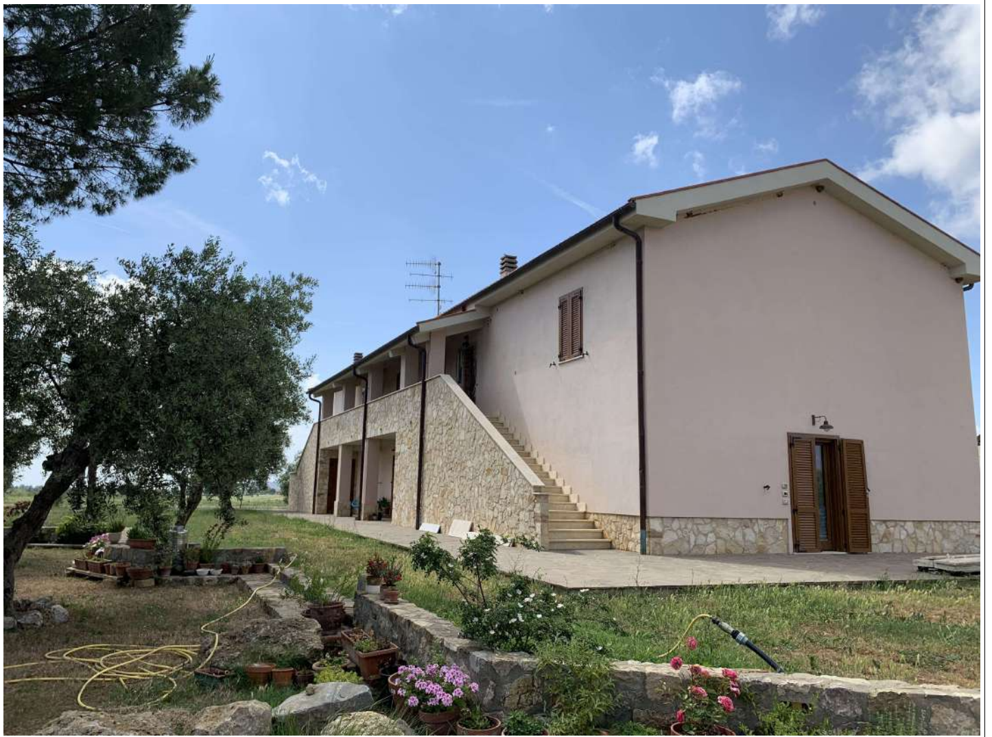
2 Fabbr A prospetto sud est

58100 GROSSETO, VIA ROMA N° 3 - CELL. +393476223950