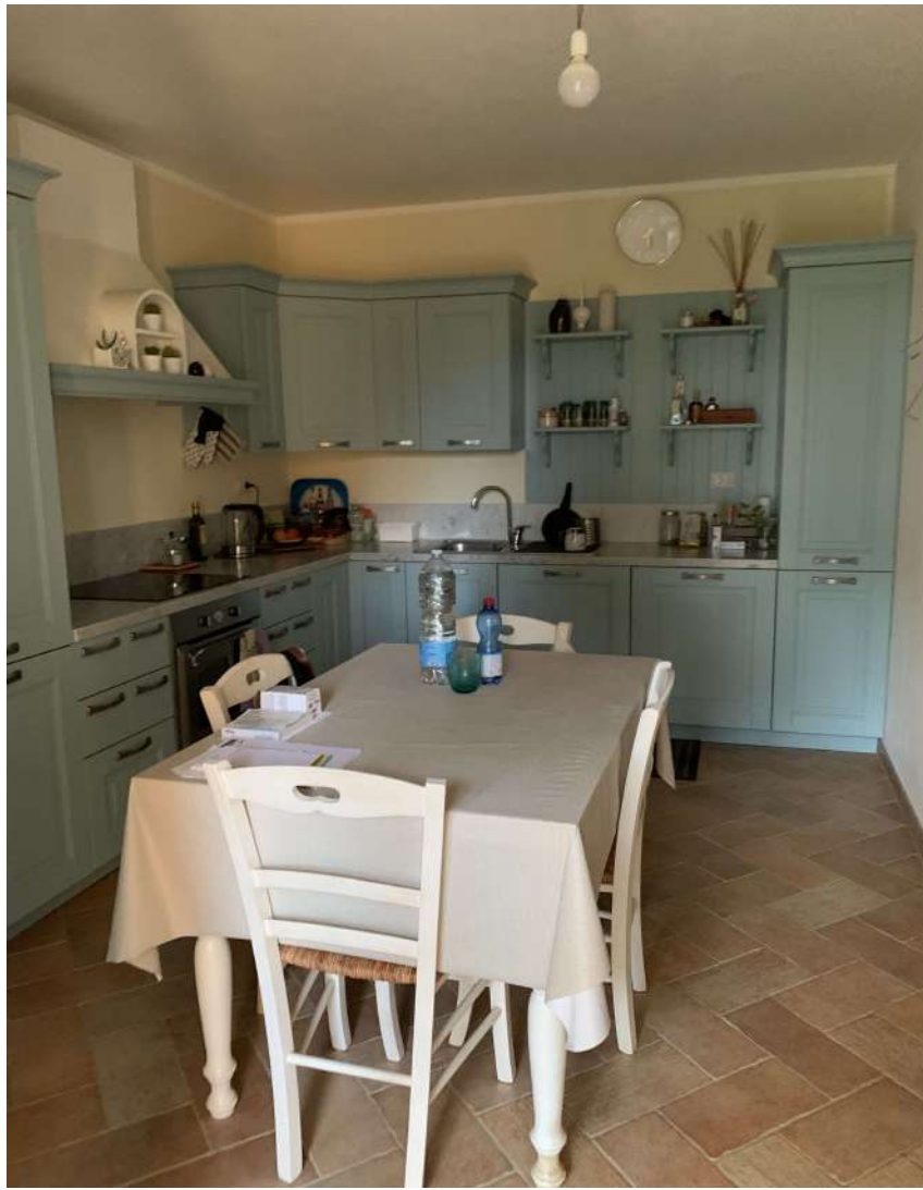
15 Fabbricato piano terra - agriturismo

58100 GROSSETO, VIA ROMA N° 3 - CELL. +393476223950