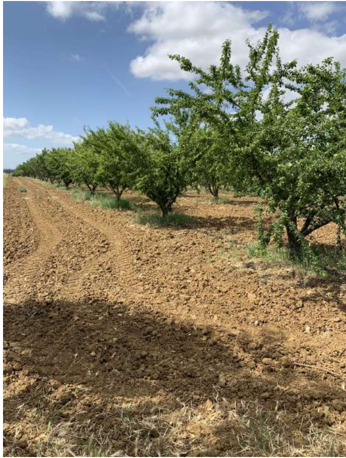
34 – Frutteto

58100 GROSSETO, VIA ROMA N° 3 - CELL. +393476223950