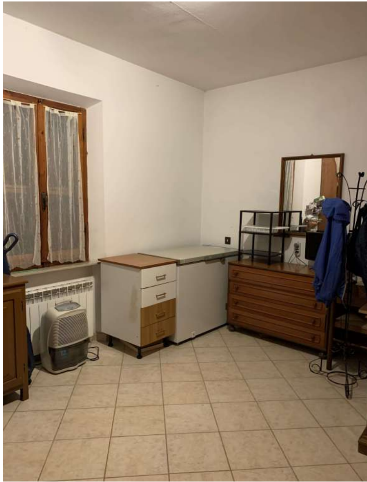
11 Fabbricato A sub 10 interno – abitazione 2

58100 GROSSETO, VIA ROMA N° 3 - CELL. +393476223950