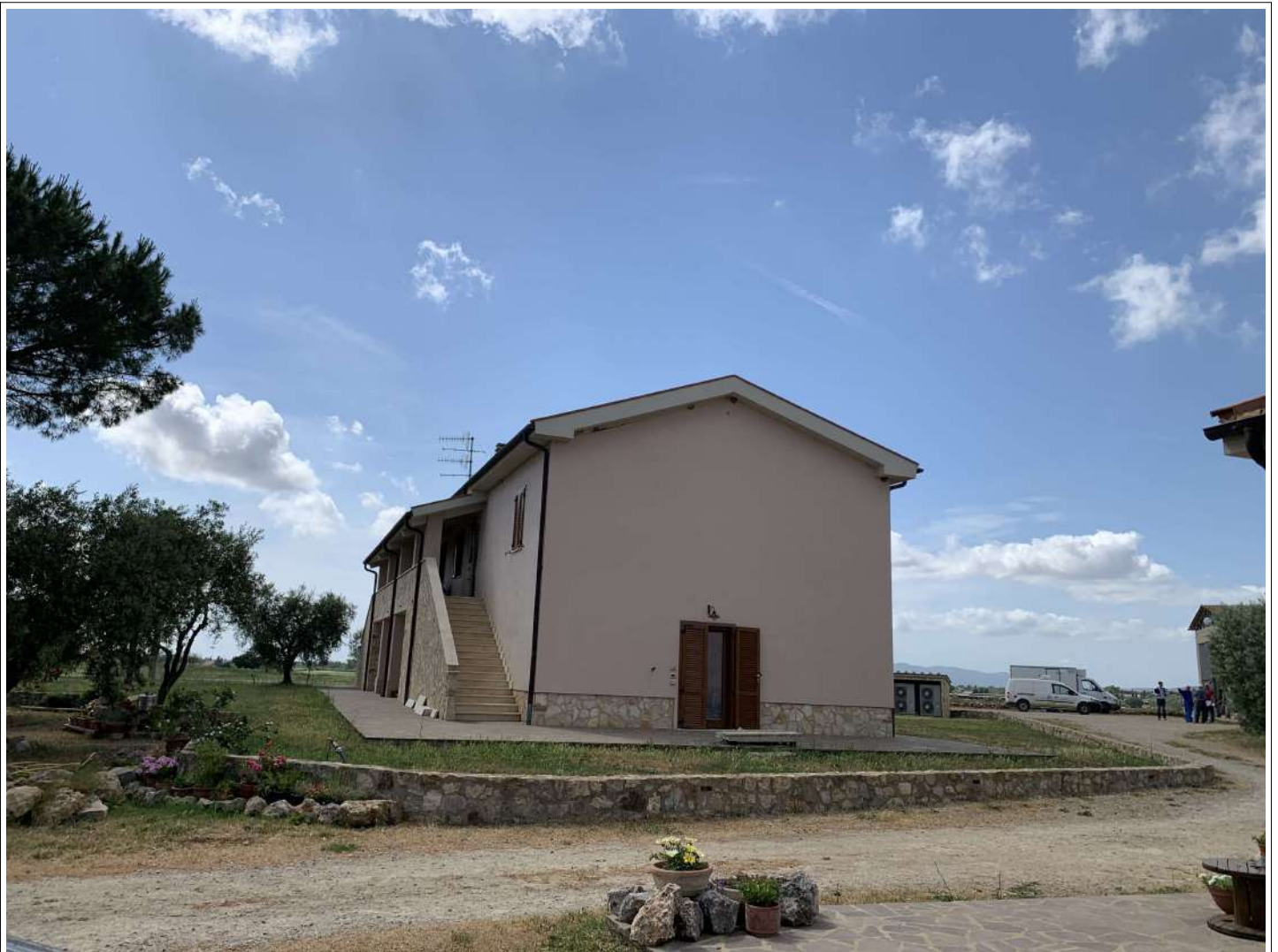
1 Fabbr A prospetto est

58100 GROSSETO, VIA ROMA N° 3 - CELL. +393476223950