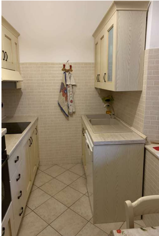
7 Fabbr A sub 10 interno – abitazione 2

58100 GROSSETO, VIA ROMA N° 3 - CELL. +393476223950