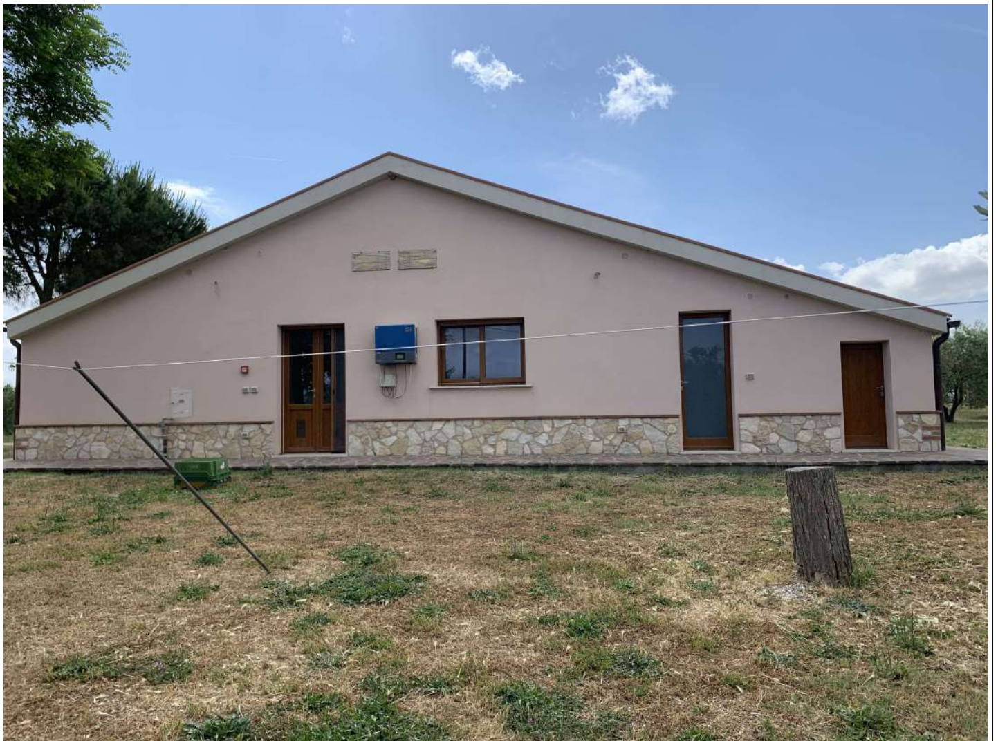
21 – Fabbricato B – esterno lato est – vendita/pasti agrituristici - laboratorio

58100 GROSSETO, VIA ROMA N° 3 - CELL. +393476223950