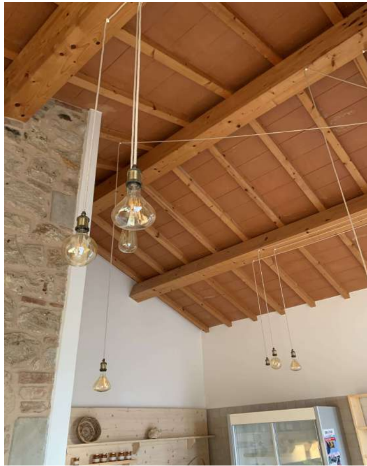
25 – Fabbricato B – interno – vendita

58100 GROSSETO, VIA ROMA N° 3 - CELL. +393476223950