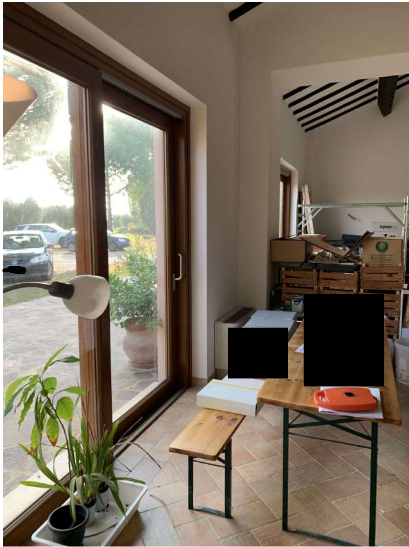
27 – Fabbricato B – interno – somministrazione pasti agrituristici, sala comune

58100 GROSSETO, VIA ROMA N° 3 - CELL. +393476223950