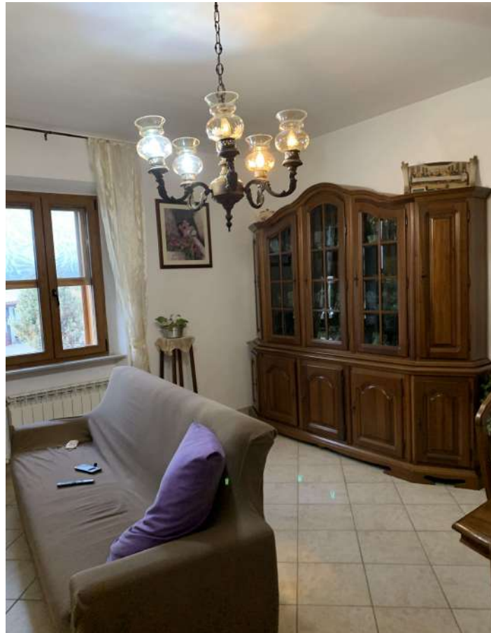
8 Fabbricato A sub 10 interno – abitazione 2

58100 GROSSETO, VIA ROMA N° 3 - CELL. +393476223950