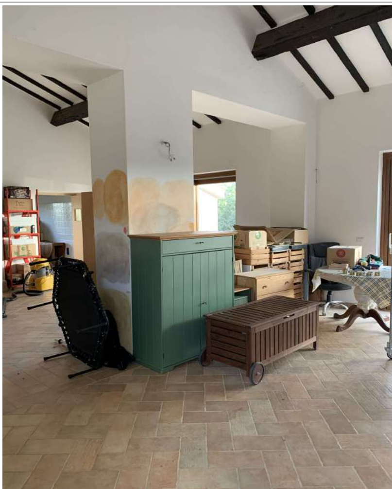
26 – Fabbricato B – interno – somministrazione pasti agrituristici, sala comune