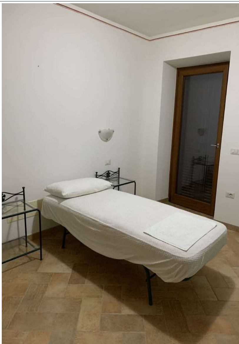
12 Fabbricato piano terra - agriturismo

58100 GROSSETO, VIA ROMA N° 3 - CELL. +393476223950