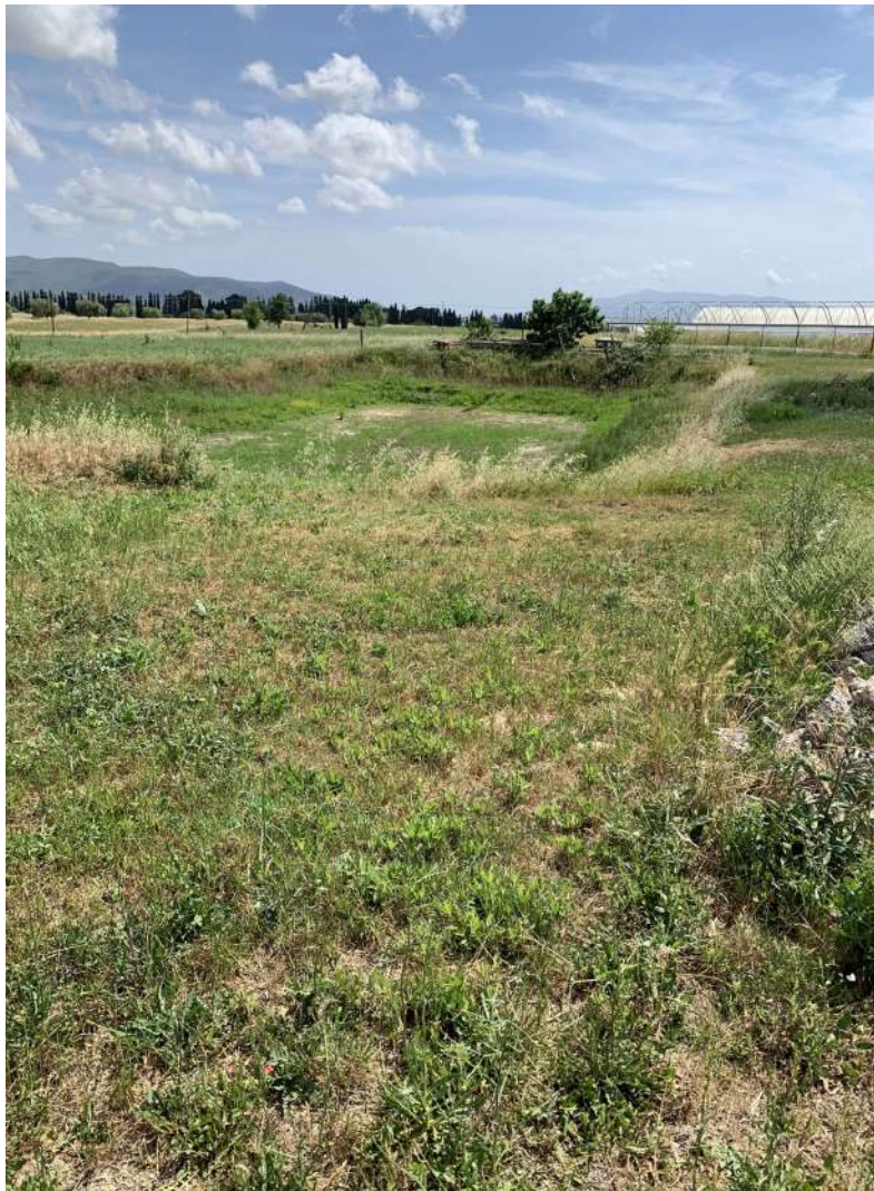
31 – Scavo “relitto” ex vaso

58100 GROSSETO, VIA ROMA N° 3 - CELL. +393476223950