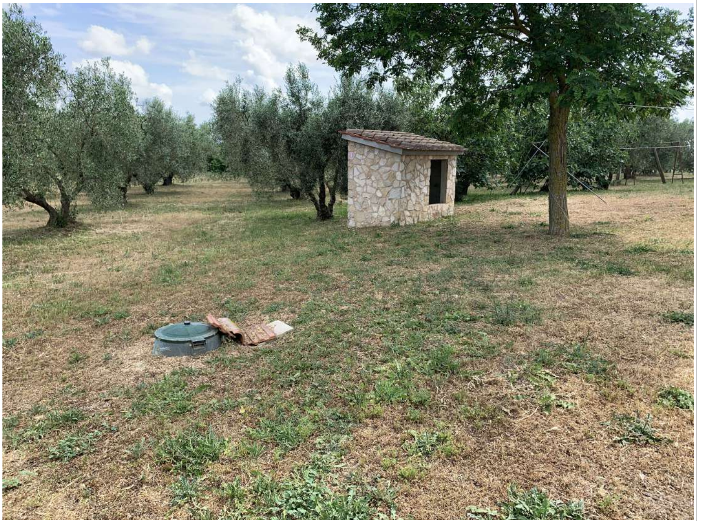
17 Piccolo volume tecnico

58100 GROSSETO, VIA ROMA N° 3 - CELL. +393476223950