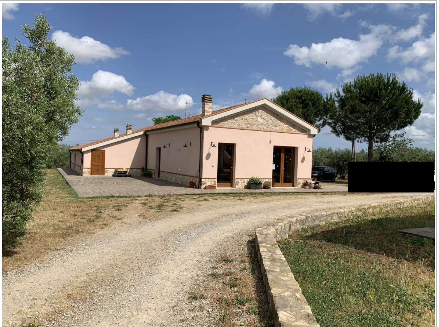
19 – Fabbricato B – esterno lato nord ovest – vendita/pasti agrituristici - laboratorio

58100 GROSSETO, VIA ROMA N° 3 - CELL. +393476223950