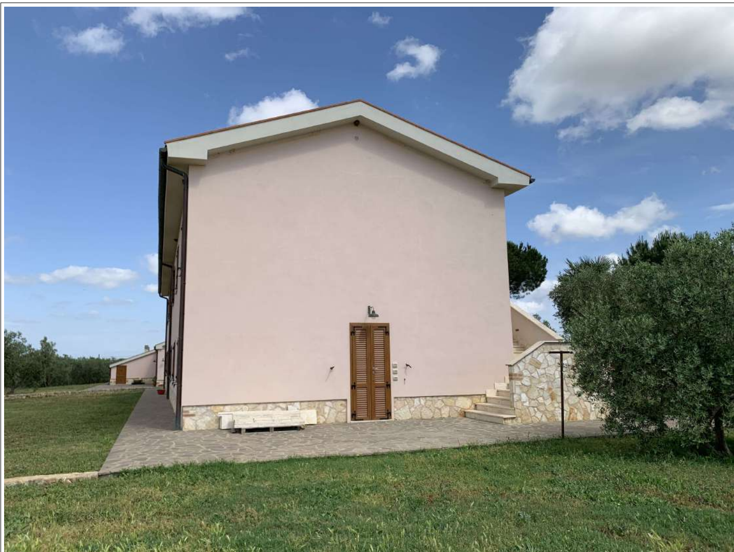
3 Fabbr A prospetto ovest

58100 GROSSETO, VIA ROMA N° 3 - CELL. +393476223950