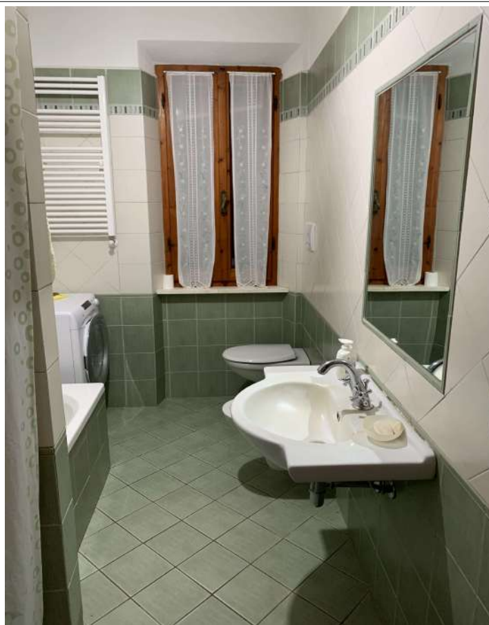
9 Fabbricato A sub 10 interno – abitazione 2

58100 GROSSETO, VIA ROMA N° 3 - CELL. +393476223950