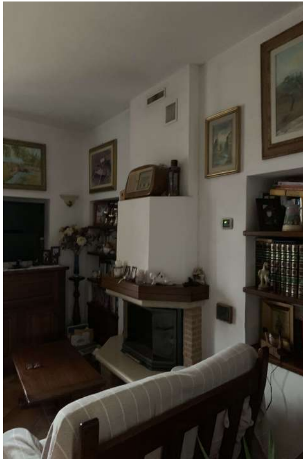
6 Fabbricato A sub 9 interno – abitazione 1

58100 GROSSETO, VIA ROMA N° 3 - CELL. +393476223950