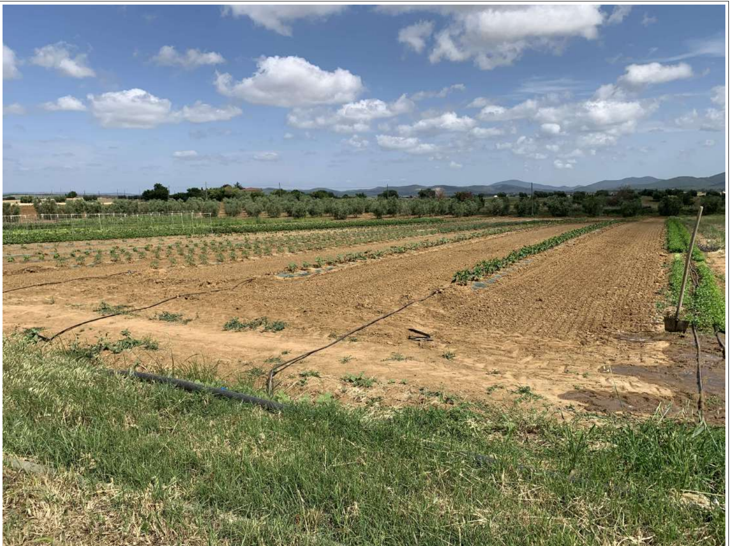
32 – Terreni seminativi, coltivazioni in atto

58100 GROSSETO, VIA ROMA N° 3 - CELL. +393476223950