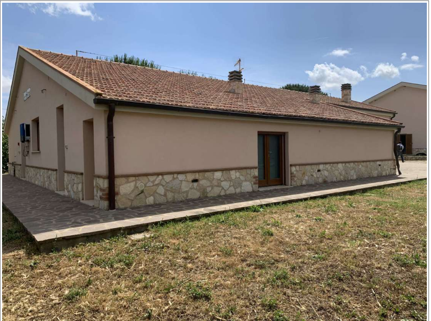
20 – Fabbricato B – esterno lato sud ovest – vendita/pasti agrituristici - laboratorio

58100 GROSSETO, VIA ROMA N° 3 - CELL. +393476223950