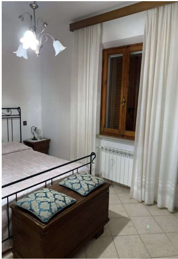
10 Fabbricato A sub 10 interno – abitazione 2

58100 GROSSETO, VIA ROMA N° 3 - CELL. +393476223950