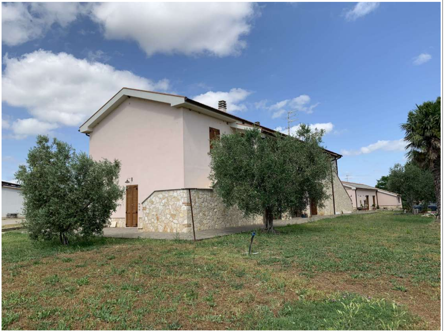
4 Fabbr A prospetto nord ovest

58100 GROSSETO, VIA ROMA N° 3 - CELL. +393476223950