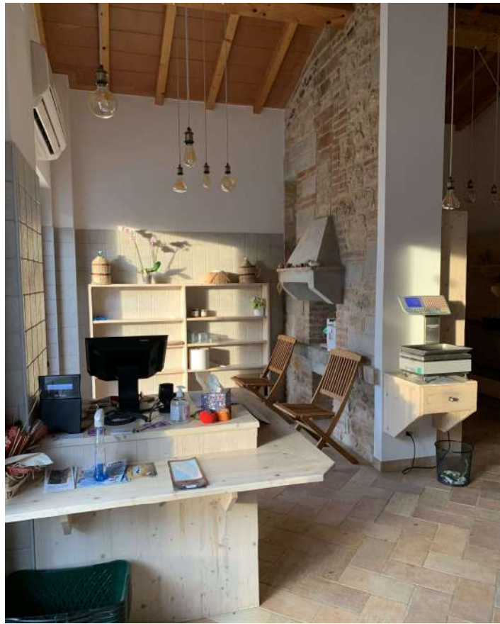
23 – Fabbricato B – interno – vendita

58100 GROSSETO, VIA ROMA N° 3 - CELL. +393476223950