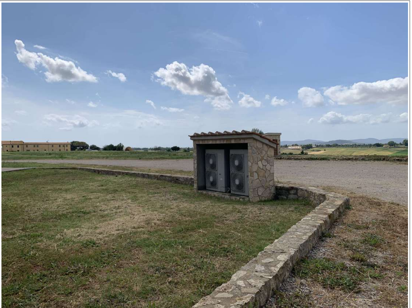
18 Piccolo volume tecnico

58100 GROSSETO, VIA ROMA N° 3 - CELL. +393476223950