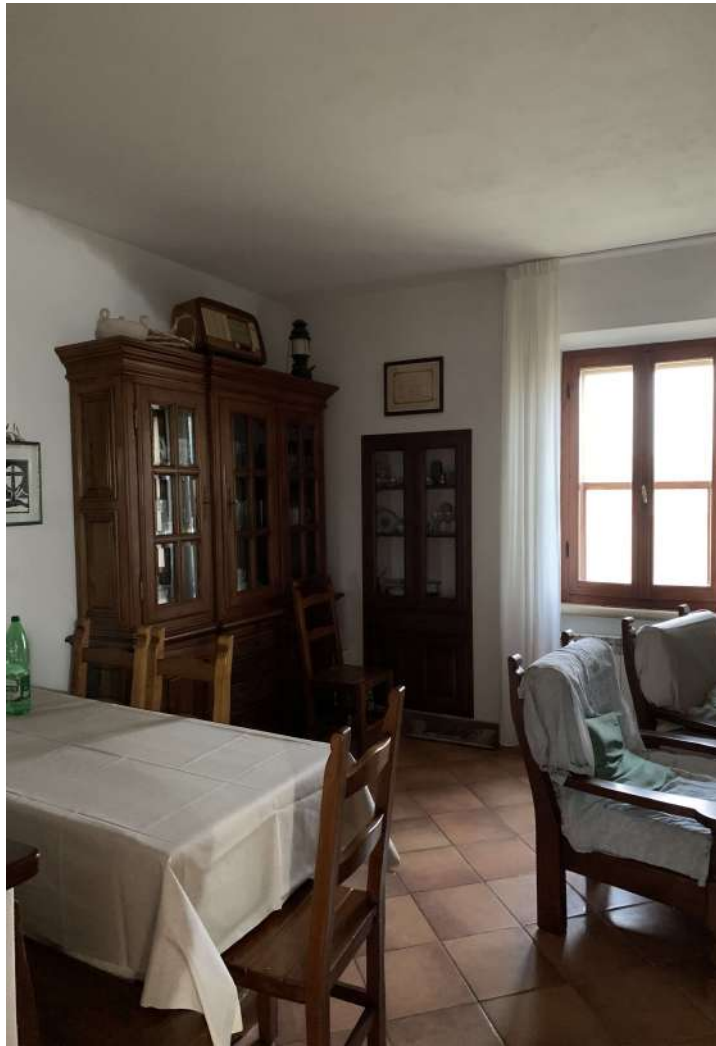
5 Fabbricato A sub 9 – interno – abitazione 1

58100 GROSSETO, VIA ROMA N° 3 - CELL. +393476223950